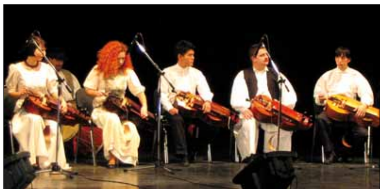
A Magyar Tekerőzenekar

zatt nagy érdeklődés. Viszont itt oktatnak a Lopakodó autósiskola munkatársai, és a Felismerés Alapítvány tanácsadásait, foglalkozásait is fel lehet keresni. A hegyvidéki nemzetiségek is otthonra találhatnak nálunk időnként.