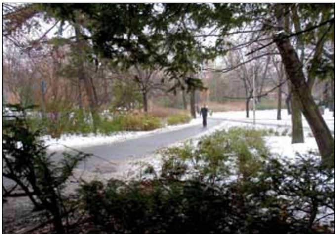
A Városmajor park főleg sötétedés után veszélyes hely