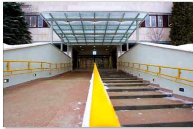
Az akadálymentesítést is megoldották

Az alagsorban újonnan megnyílt Hári Mária-emlékszobában a híres konduktor-nevelő életével kapcsolatos információk olvashatók, és ugyanitt a konduktív nevelés speciális eszközeit is megtekinthetik a látogatók. A szobában