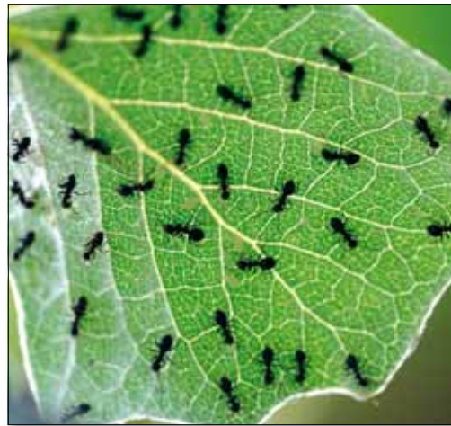
A hangyák elárulják a rejtőzködő tetveket

Kertjeinkben számtalan kártevő és kórokozó megfordul. Ennek oka a viszonylag sűrű beültetés és a különböző növényfajok, -változatok nagyon magas száma. Ezek között minden kártevő megtalálja az ízlésének megfelelőt. De mit tehet a kertész, ha a bár könnyebb megoldást kínál, de baljóslatú fegyvereit, a vegyszereket mellőzni szeretné? Szerencsére akadnak más, a kert használóira teljesen veszélytelen megoldások is!