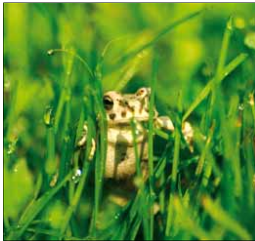
A zöld varangy is segíthet