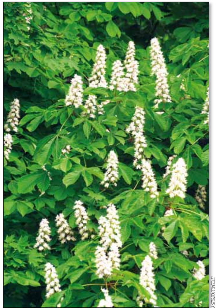
A vadgesztenyét az aknázómoly fenyegeti leginkább

Ha a fertőzés már elhatalmasodott a növényeken, akkor a védekezés komolyabb eszközeihez kell nyúlni. A vegyszerek előtt azonban próbát tehetünk a növényi teákkal, főzetekkel, oldatokkal. Ezek olyan szerek, amelyek könnyen hozzáférhető növények hatóanyagait tartalmazzák, de permetezéssel kell a kártevőkkel