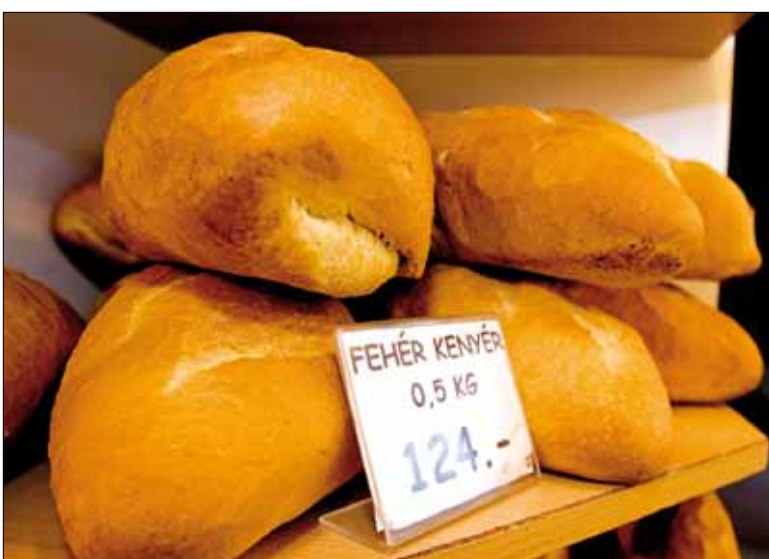
A kenyér ára is tovább emelkedik

Januártól ellenőrzik az egészségbiztosítási jogviszony meglétét az egészségügyi intézményekben. Az ellátást a jogviszony hiányában sem lehet megtagadni, vagy kifizetetlen annak költségét a beteggel. Ha valaki biztosítás nélkül vesz igénybe egészségügyi szolgáltatást, adatait az OEP elküldi az APEH-nak, az adóhatóság pedig az elévülési határidőre visszamenőleg behajítja a be nem fizetett járulékokat.