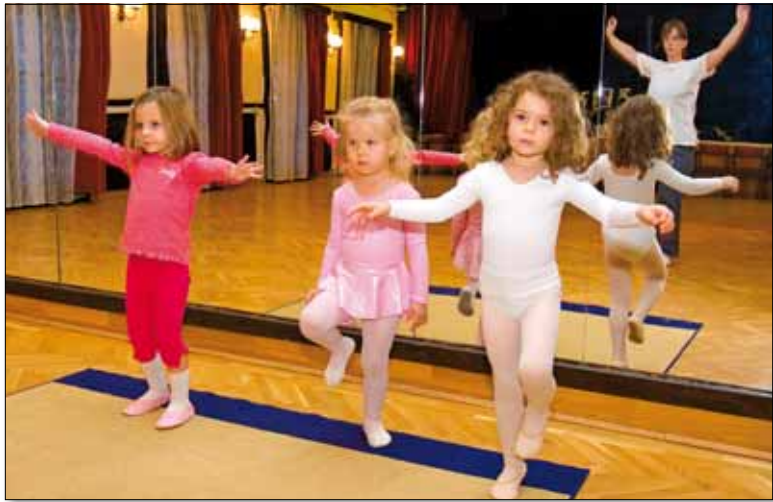
A legkisebbeknek is sok programot szerveznek

A hegyi adottságok folytán a Hollós út 5-ös számú villájának bejárata is jó emeletnyi mélységben van, lépcsősoron kell megközelíteni, mert az utcaszint nagyjából a mai tető vonalával azonos. A kerítésen diszkrét plakátvitrinek csábítgatják a betérni szándékozót a Jókai Klub emberleptékű, barátságos világába. Az épület – Kahlich Endre helytörténész úgy tudja – 1883-ban faszkerkezetes nyaralónak épült Szigeti Imre terve alapján, és tulajdonosa egy Kaszab nevű család (is) volt. Később bérhelyiséget létesítettek benne, többször átépítették, bővítették.