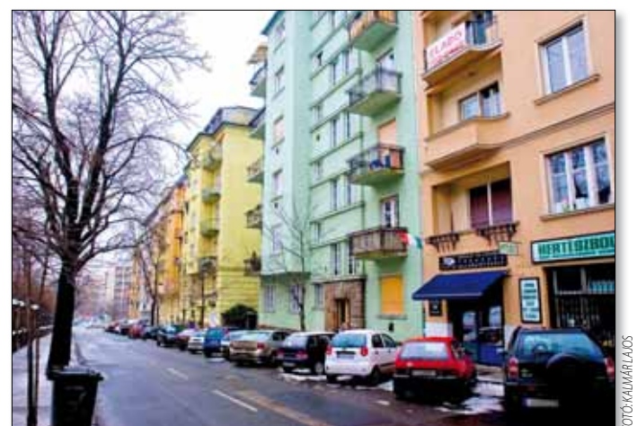
Idén előnyben részesítik a homlokzathelyreállításokat