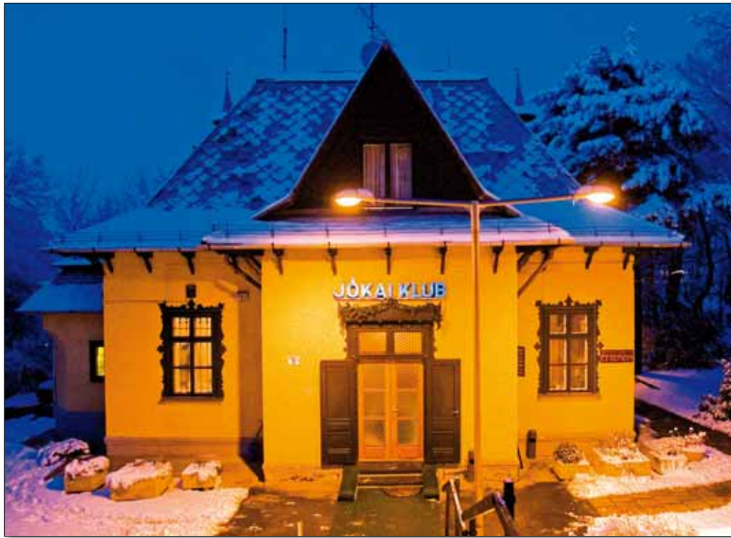
Fredetileg nyaralónak épült