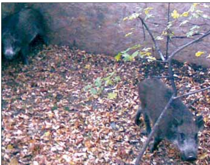
Sok állatot sikerült befogni tavaly

Jelentősen túlszaporodtak a vaddisznók a budai hegyekben a múlt év végén, emiatt az erdőszéli kertekben is megnőtt a vadkárok száma. Az erdészek befogással csökkentik a város környéki vadállományt – a csapdába ejtett állatokat a lakott területektől távoli erdőkbe szállítják át.