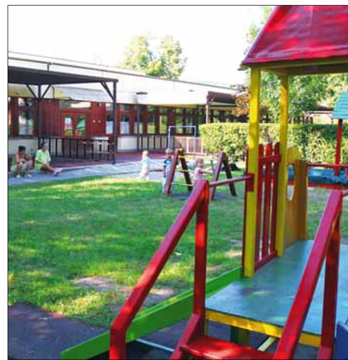
Okóbertől újabb húsz gyereket fogadhat a Zugligeti Bölcsőde