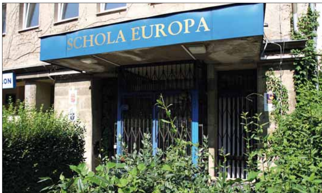
Az iskolában az első szakképzés ingyenes