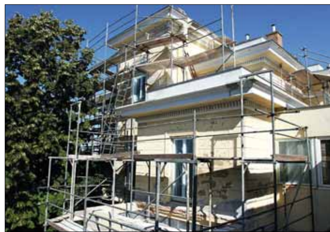
A Normafa Óvoda homlokzatát is felújították