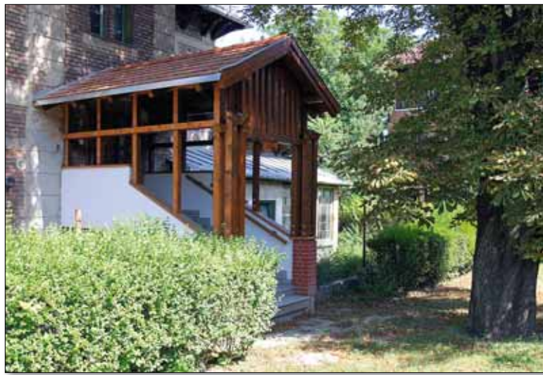
A Városmajori Gimnáziumban történtek a legnagyobb változások az iskolák közül

öltözők kialakításával folytatódott a szomszédos Zugligeti Óvoda fejlesztése, elkészült az Orbánhegyi ovi teraszának szigetelése és az épület statikai meg-