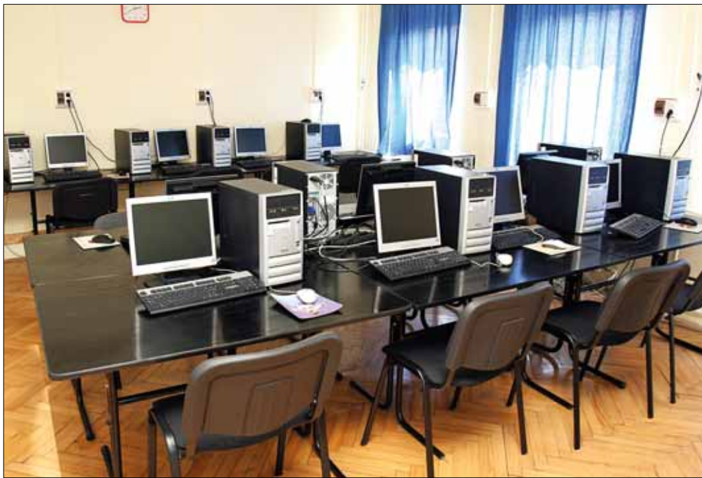
Pályázatokon nyert pénzekből korszerűsítették a technikai felszerelést

■ Néhány éve költöztek a Beethoven utcába, de úgy tudom, a Schola Europa már régebb óta létezik.