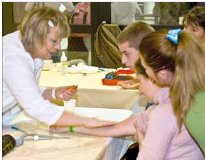
Az egészségügyi szűréseken csaknem négyszázan vettek részt

Mint mondta, úgy látja, Magyarországon a sport egyre inkább megéri a fiatalokat. A mozgáshiány a negyven év felettiekre jellemző, akik hajlamosabbak a „lustaságra”, s ezáltal jobban kiteszik magukat a különböző megbetegedések veszélyeinek. Szerinte öröndetes, hogy egy olyan új sportközpont nyitotta meg kapuit hazánkban, ahol gyakorlatilag mindenki megtalálhatja az általa leginkább kedvelt mozgásformát.