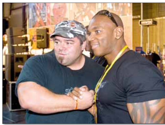
Flex Wheeler (jobbra) body builder, négyszeres Arnold Schwarzenegger Classic-győztes egy rajongóval