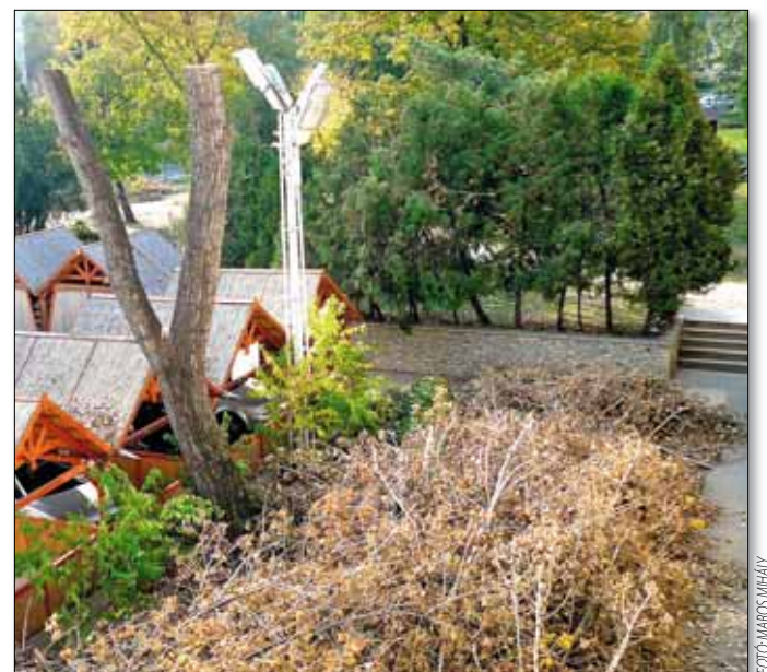
A fák az ifjtás után nemsokára visszanyerik régi lombdíszüket