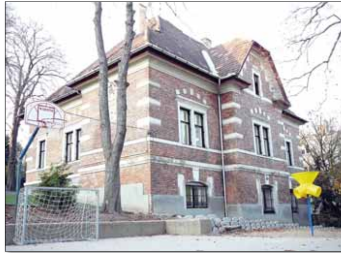
Az alsósok átmenetileg a Dobsinai utcai épületben tanulnak