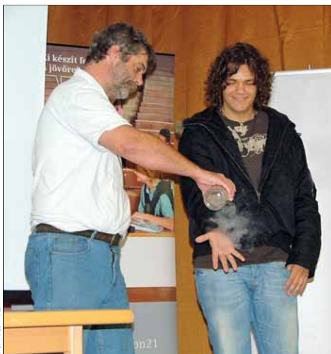
A látványos kísérletek segíthetik a tudomány népszerűsítését