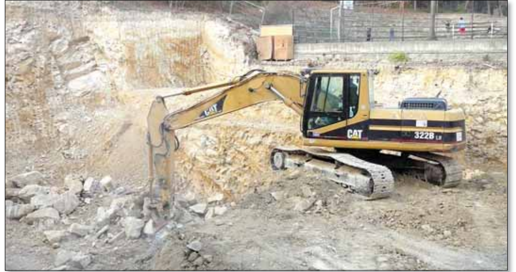
Az utóbbi évtized legnagyobb oktatási beruházása indult el

A kivitelezés és az üzemeltetés során a környezetbarát megoldá-