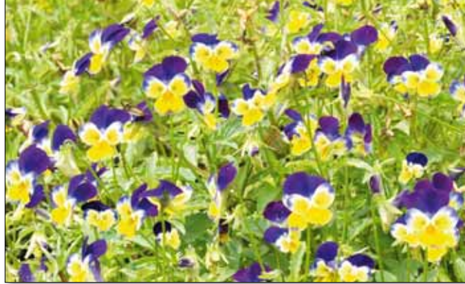
A vad árvácscsa teája vértisztító hatású

Az arasznyinál ritkán magasabb, elágazó hajtásrendszerű