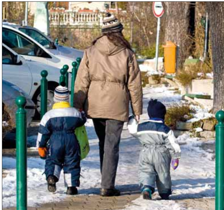
A járdák állapotát a Fővárosi Közterület-felügyelet folyamatosan ellenőrzi

sekk karbantartása, a telekhatártól a gázmérőig a társasház, míg a gázmérőtől a kéményig a lakás tulajdonosa, illetve annak használója vagy kezelője felel a vezetékek és készülékek állapotáért. A gázkészülékek kötelező felülvizsgálatáról a 2003. évi XLII. törvény rendelkezik. E szerint a 2004 előtt kiépített csatlakozó-vezetékek és fogyasztói beren-