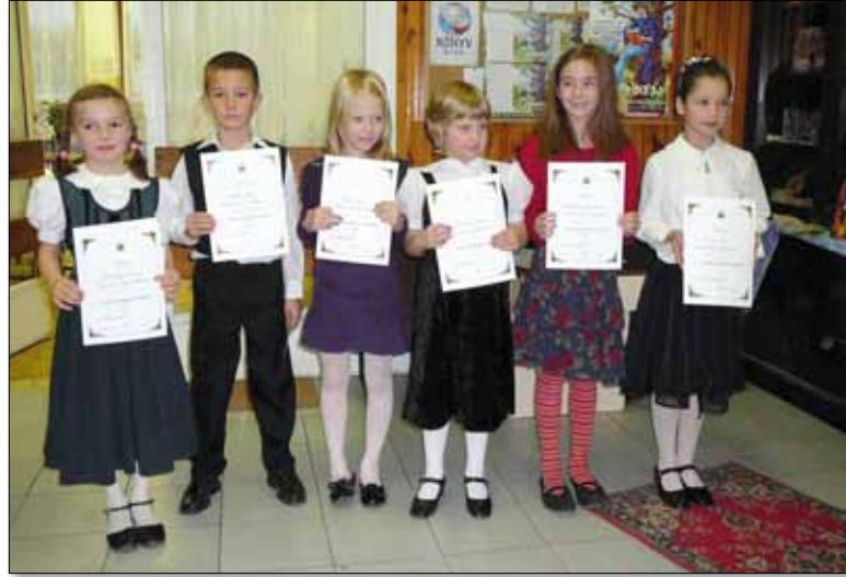
A szavalóverseny győztesei