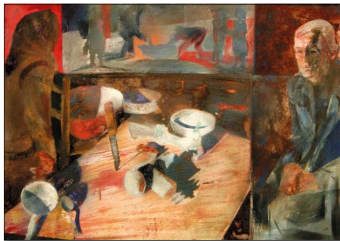
Régi disznótorok emléke

Ezeket az oldalhajításokat ő csupán kísérleteknek minősíti. Ahogyan egyik katalógusában vallja: „A kép öntörvényűsége mindig a racionális hatásokat erősítette a festésben, pár éves kalandjaim az izmusokkal rendre visszatértettek a szülőföld megtermékenyítő, elkötelezett tradíció szabta világába.” Ezüst György számára egyszer-