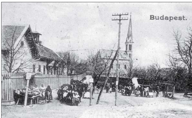
Az iskola épülete (baloldalt) 1890-ben, mellette a Szent László-templom