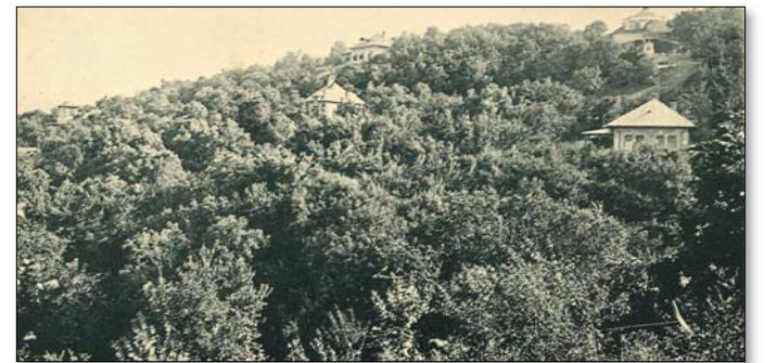
A Svábhegy a XIX. század végén

Hosszú évekig dúlt a harc a svábok és a rácok között a Buda környéki vidék feletti uralomért. Esetünkben a „harc”-ot ingatlanfelvásárlások és kereskedelmi csatározások jelentették.