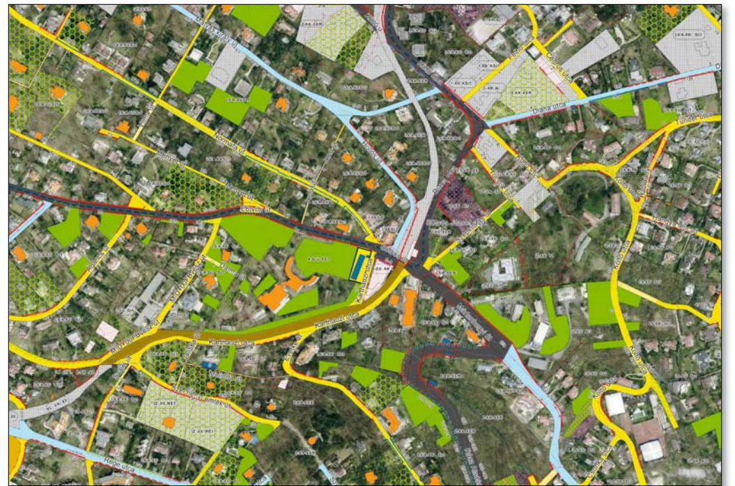
Ortofotó és a KSZT összevetve

Szabó-Kalmár Éva szerint a szigorítások mindenekelőtt a városkép védelmét, a jobb építészeti minőség megjelenését, illetve a zöldfelületek bővítését célozzák. Városképi szempontok miatt az épületek utcai homlokzatát (védett épületeknél azok valamennyi homlokzati felületét) nem lehet részlegesen felújítani vagy átszínezni, illetve a ríktó színezés se megengedett. Zárt sorú övezetekben a külső tokos redőnyök beépítése mellett a kirkakatszékerek kihelyezését is megtiltották. Újonnan létesülő és meglévő lapos tetők rekonstrukciója során (a védett épüle-