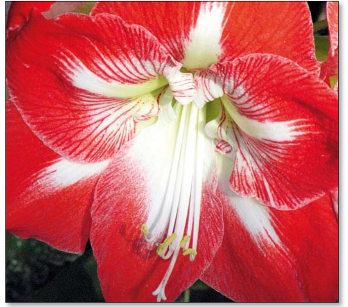
Hűvösebb helyen tovább megmaradnak az amarillisz virágai

A hajtatott növények egyik legkedveltebbje az amarillisz, amely nemcsak igényeiben, gondozásában, de méretében is eltér a többi hagymástól. A hagymákat – amelyek átmérője meghaladhatja a tíz centimétert is – akkor kell elültetni, amikor a nyugalmi időszak után megjelenik a csúcsán a hajtatás. Először áztassuk néhány órára kézmeleg vízbe, majd ültetésnél figyeljünk, hogy csak a hagyma kétharmada kerüljön a föld alá.