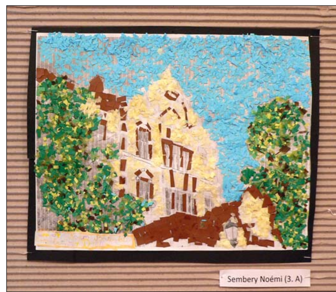
Sembery Noémi (3. A)

■ A kiállítás február 3-ig látogatható. Cím: XII., Hollós út 5.