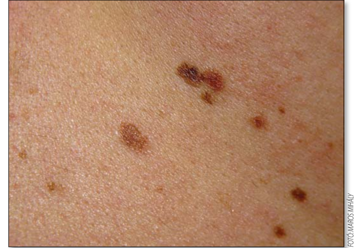
Bőrünket is folyamatosan figyeljük!

A bőr önvizsgálata . Amennyiben a bőrön található elváltozás aszimmetrikus, egyik fele nem hasonlít a másikhoz, széle elmosódott, egyenetlen, különböző színárnyalatok vannak jelen együtt, átmérője nagyobb a szokványos anyajegyeknél, akkor fennáll a melanoma gyanúja. Ilyenkor haladéktalanul keressük fel a legközelebbi onkológiai centrumot! A vizsgálat fáj-