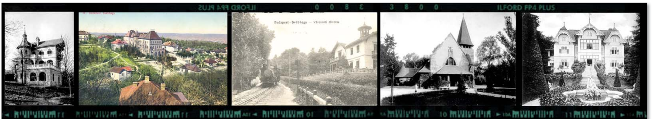
Értékeink régi képeslapokon