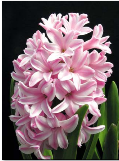
A jácint az egyik favorit

A bókoli csillagvirág kis terméte, de annál hálásabb növény. A hóolvadás után az elsők között bontja ki szirmait a nyugat-ázsiai erdők alján, így tökéletesen alkalmas hajtatásra is. A kis gumókból többet ültessünk egy cserépbe, mert csak így érvényesül. A kertbe – azt mondják – száznál kevesebbet nem is érdemes elültetni. A sok kis gumóból aztán előbújnak a fűszerű, keskeny levelek, majd a tövenként több száron a tucatnyi kis, kék, csillag alakú virág. Mélykékje (vagy egyes változatainak hófehére) a kertben is vonzza a tekintetet, a szobában pedig még feltűnőbb lehet.