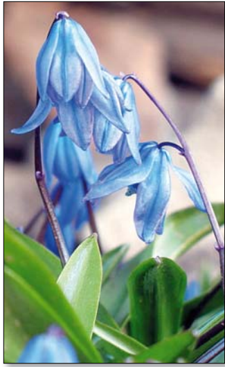
A csillagvirág hálás növény

A kertészek hajtatásnak nevezik azt a folyamatot, amelynek során a természetes virágzási időtől eltérő időpontban bírható virágzásra egy növény. Természetesen hajtatni csak a tartalék tápanyagraktárral rendelkező, azaz hagymás, gumós, gyökérzsers növényeket lehet. Ezek – amennyiben a tavaszt idéző környezetbe kerülnek – rendelkeznek a kihajtáshoz és virágzáshoz szükséges erőforrásokkal, így akár egy üvegedényben is kinyílhatnak. Nincs is más feladat, csak „elhitetni” velük, hogy a nyugalmi időszaknak vége, és itt a virágzás ideje.