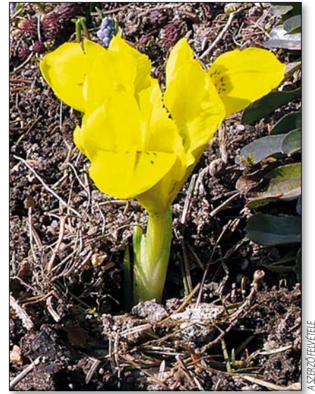
A török írisz is szép szobadísz lehet