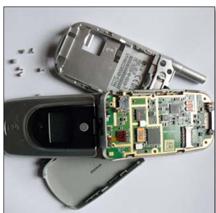
A szolgáltatók gyakran hivatkoznak vízkárra az elromlott mobiloknál