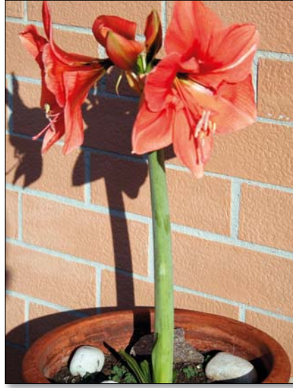
Az amarillisz méreteiben is eltér a többitől

JÁCINT, A KLASSZIKUS A hajtatott növények között a jácint az egyik favorit. Olyannyira elterjedt, hogy a hagymája méretéhez igazodó, speciális edényt is árulnak, amelyben egyszerűen virágoztatható. A tetszalott hagymát elég elhelyezni a közepesen elkeskenyedő, a hagymát a vízszint fölött megtartó üvegben. A nedvesség és a meleg (ideális esetben 10-15 Celsius-fok körüli hőmérséklet) hatására a levelek növekedésnek indulnak, és megjelenik közöttük a bimbó.