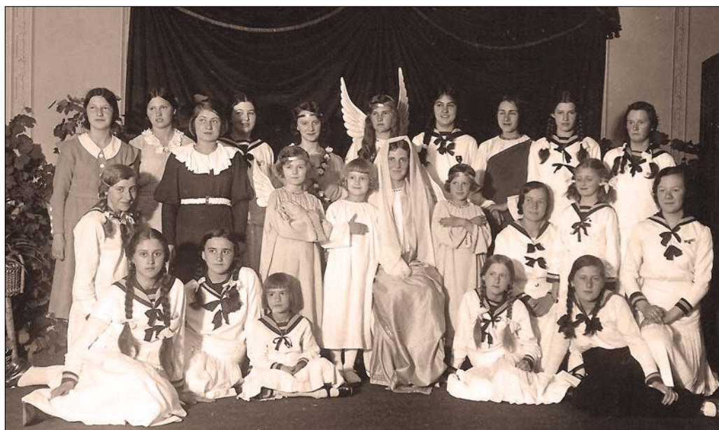
Színjátszó kör 1945-ben

A kéteemeletes ház a két világháború között a legmodernebbek közé tartozott. Alagsorában, a mai ebédlő helyén fürdőt alakítottak ki, medencével és zuhanyzóval. A magasságon orvosi rendelőt, városzobát és óvónői lakást létesítettek, valamint ide helyezték a Költő utcai kisdudát. A tornatermet színpaddal, karzattal, vetítővászonnal szerelték fel. Az iskola helyet adott a Svábhegyi Széchenyi Levente Egyesületnek, amelynek tagságát a Svábhegyen és vidékén lakó, 12–21 éves, testnevelési oktatásra kötelezett ifjak alkották.