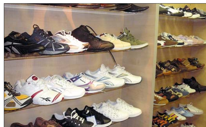
A cipők forgalmazásával foglalkozó cégek maguk vizsgálják ki a reklamációkat

A Fogyasztóvédelmi Egyesületek Országos Szövetsége arra hívja fel a figyelmet, hogy a vonatkozó törvény szeptemberi változása még kiszolgáltattottabbá tette a magyar fogyasztót, a jelenlegi szabályozás az állampolgárokkal szemben a vállalkozókat védi. Megszűnt a nyolc évig tartó alkatrész-ellátási kötelezettség. A vállalkozásoknak már csak törekedniük kell a hibás termék 15 napon belüli kijavítására, az új