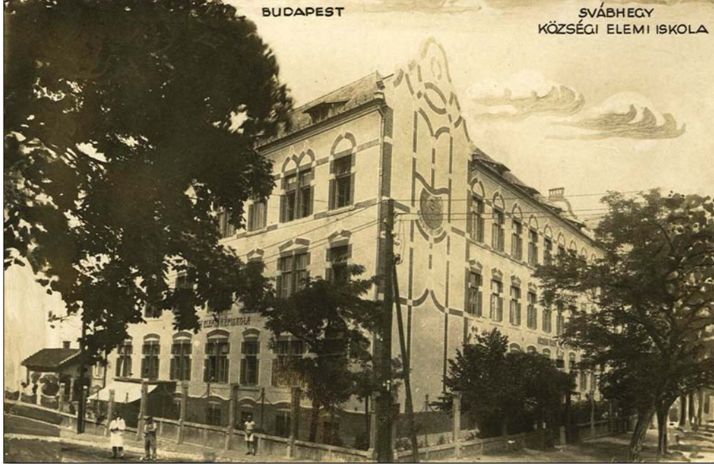
Az iskola a századforduló idején korabeli képeslapon

A következő tanévtől megindulhatott a 3. osztály is. A