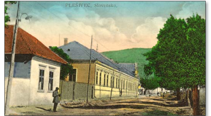
Pelsőci utcácska (1930-as évek)

A várom mellett érdemes felkeresni a XIII. századi templomot, amelyet egykor négytor-