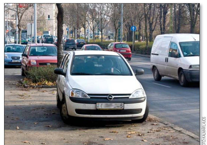
A helyi önkormányzatokra hárul a parkolóhelyek fenntartása