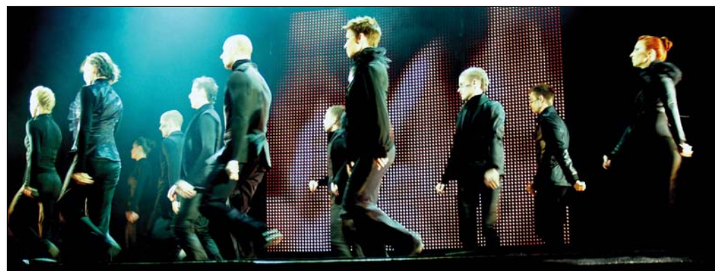
A látványvilágért a legjobb szakemberek felelnek

– Ha leteszél húsz extrém hangszert egy asztalra – mondja