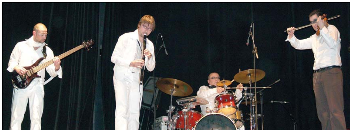
Az Anselmo Crew kíséri a táncosokat

A szombati zártkörű, meghívásos alapon rendezett médiabemutatóra a színházi körökben mozgó üzletemberek zöme garatra húzott nyakendőben, kisértélyit viselő hölgyek kíséretében érkezett („egy protokoll a számos közül” arca), ám milyen öröm volt nézni, amikor ugyanők a második szám, a Csángó boogie után megglazították a férfiú dísznemű csomóját, s már az első felvonás derekán vörösre tapsolták tenyereiket, amikor a fiútáncosok szteppelős-dobolás számának újrázását követelték. És így volt ez minden jelenlévővel, akiknek többsége veteránnak számít színházi bemutatók terén. Volt a levegőben valami, amit ők maguk között a siker szagának neveznek.