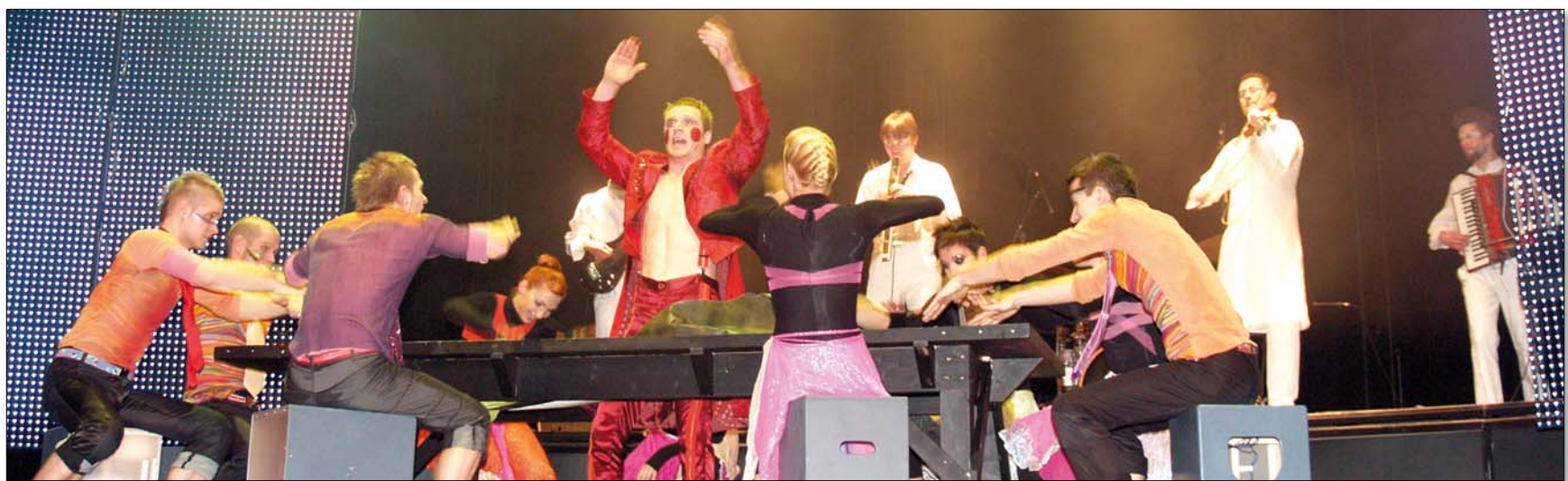
A produkció a világ bármely színpadán megállja a helyét, és felkeltheti az érdeklődést Magyarországra iránt

Az ügyvezető igazgató-producer szerint a produkció költségvetése 75-100 millió forint között mozog, ami három év alatt térülhet meg. A következő esztendő már a külföldi vendégszereplések éve lesz, két alternatív stábul, előadásokként tíz-tizenkét ezer dolláros bevétellel. Úgy érzik, a Montreali Művészetek Vásárára „betették lábukat az ajtóba”, a többi kizárólag saját magukon múlik.