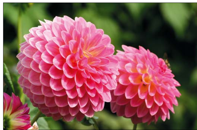
A dália is sikerrel nevelhető magról

A siker azonban nem a berendezéstől függ (nem véletlenül kapott helyet már akkor is a kerté-