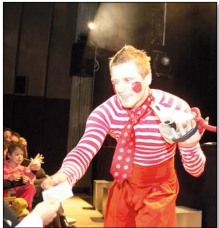
Imi, a hangulatfelelős

Az egyik legmerészebb húzás, hogy a táncosokat a színpadon a Kerekes Band és a Csík Zenekar zenéjét