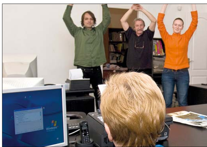
Igazi csapatmunkára lesz szükség a munkahelyeken

Köztudott, hogy a közérzetet erősen befolyásolja, mennyire érezzük magunkat fittnek, egészségesebbnek. Vitathatatlan, hogy még a legerősebb jellemnek sem könnyű mai, rohanó világunkban – ahol minden sarkon gyorsan elérhető ízletes kalóriabombákkal csábítanak – egészségesen táplálkozni, vagy egy-egy elhúzódó munkaéretkezet, túlóra után a sportot választani az otthoni édes semmittevés helyett.