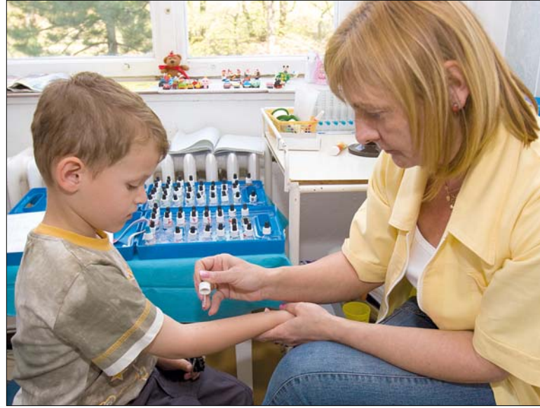
Az allergiás betegség megállapításához bőrtesztet vagy vérvizsgálat szükséges

nak, hogy gyermekénél is megjelenjenek a tünetek. Mindkét szülő esetében ez az érték jóval magasabb, az öröklődés esélye 80 százalék körüli. Az allergia terjedésére az ún. higiéné hipotézis is magyarázatul szolgál. E szerint a napjainkban jellemző „túlzott tisztasággal”, a tisztító- és tisztálkodó szerek túlzásba vitt használatával nem biztosítjuk kellőkép-