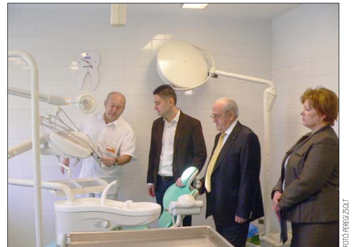
Új szájsebészeti kezelőegységet kapott a János kórház

avult, közel harmincéves készülékkel kellett dolgozniuk az orvosoknak.