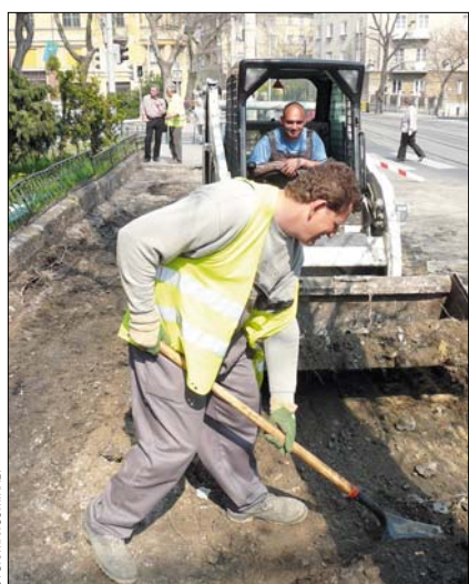
Újabb járdaszakasz újult meg