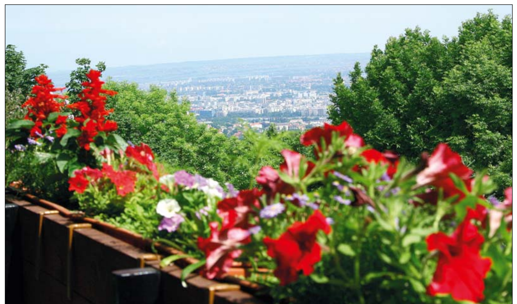
A virág csak keret

Ahhoz, hogy hosszú időn át tetszetős, egészséges növényeket nevelhessünk, először el kell dönteni, hogy az egyes ládák hová kerülnek majd. Természetesen, hogy nem alkalmas ugyanaz a növény a déli, forró ablakpárkányra, mint a mindig hűs, árnyékos, északi teraszra. A fény és árnyék mellett figyelembe kell