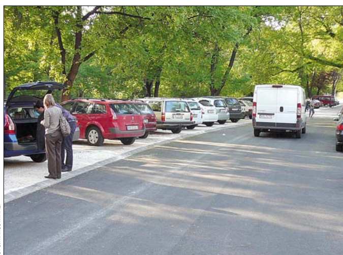
Az Ignotus utcában kulturált parkolási lehetőséget is biztosítottak

Ennél is nagyobb változáson esett át az Acsádi Ignác utca. A