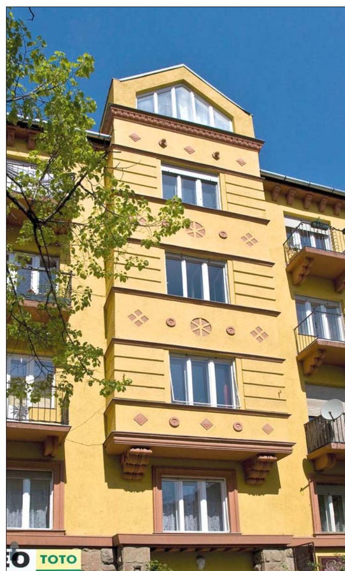
Az önkormányzat előnyben részesíti a homlokzatfelújításokat, mert ezek a városkép javítását szolgálják

■ A társasházi pályázatok pontos feltételeit a „Pályázati Felhívás és Tájékoztató 2009.” tartalmazza, amely a polgármesteri hivatal ügyfélszolgálatán (XII., Böszörményi út 23–25.) beszerezhető, vagy a www.hegyvidek.hu honlapról letölthető. A pályázatok beadásának határideje 2009. május 22., péntek 13 óra, kivéve a graffiti elleni védelem pályázatait, amelyeket – a rendelkezésre álló keretösszeg kiemeléséig – folyamatosan be lehet nyújtani, legkésőbb 2009. november 30-ig.