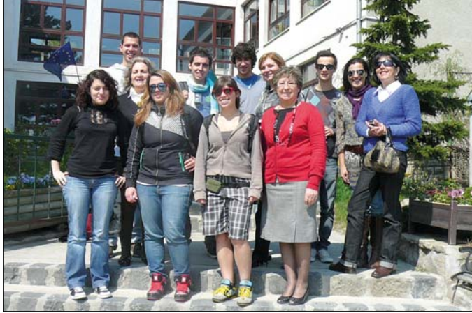
Viana de Castellóból érkeztek a vendégek

„portugál” tanévben megkezdődött a partneriskolák keresése, azóta öt portugál iskolával sikerült tartós kapcsolatot kialakítani. Az együttműködés keretében évente szerveznek diákcseraprogramot, melynek során a magyar és portugál gyerekek egymás nyelvével mellett a két ország kultúráját is megismerhetik. Ez különösen a tamási diákoknak jelent komoly segítséget tanulmányaik során, hiszen portugál televízió- vagy rádióadó nem fogható Magyarországon, így az anyanyelvi érintke-