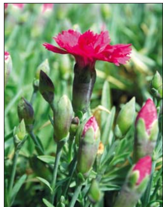
A virágzás kezdetén

venni a szélirányt és a csapadék mennyiségét is. Persze a háznak minden oldalán ugyanannyi eső esik, de ami a terasz ládáját áztatja, esetleg nem éri az ereszt alatti ablakpárkányt. Sőt, az sem kizárt, hogy vannak olyan ládák, amelyekbe az átlagnál sokkal több víz jut.