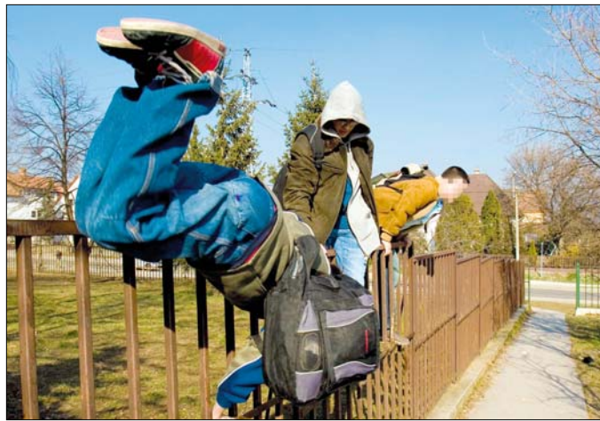
A statisztikák szerint több a hiperaktív fiú, mint lány

ekkel és felnőttekkel egyaránt. Nem, vagy csak részben fogadják el a szabályokat és az irányítást, öntörvényűek. A figyelmük csak rövid időre köthető le, nem szívesen vesznek részt olyan tevékenységben, amelyhez hosszabban kell ülni. Általában sokat beszélnek, és nehezen tudnak várakozni. Súlyosabb esetben ezek a tünetek már az óvodában is megnehezítik a beilleszkedésüket. Ha felmerül a probléma, érdemes azonnal gyermekpszichiáterhez fordulni, mert vannak terápiás lehetőségek, és igen jó eredmények