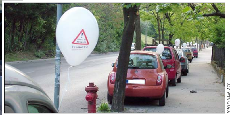
Sok hegyvidéki autós a visszapillantó tükrére akasztva egy ZebraFest-emblémás lufit találhatott a napokban. A lufik is arra figyelmeztetnek: lassítsunk a gyalogátkelőhelyeknél!