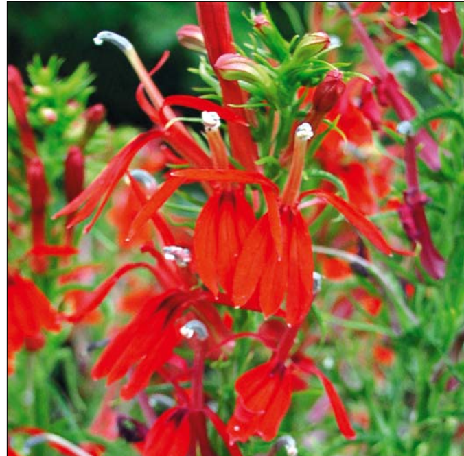
A lobélia legfőbb vonzereje a virága

ti zónájában virágzik legszebben. Az alapfaj kék virágai nagyobbak, de a virágmenyisége nem szerényebb a törpe változatnál. Alba változata nevéhez méltóan fehér virágokat nevel.