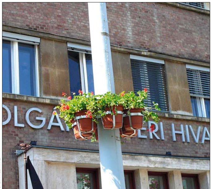
Virágokkal díszíti az önkormányzat a hegyvidéki városközpontot. Idén először a Böszörményi út és az Apor Vilmos tér mellett a Csörös utcába is jutott a növényekből. A hatszázhatvan muskátlikat a lámpaszalpokra szerelt virágtartókba helyezték el a kertészek