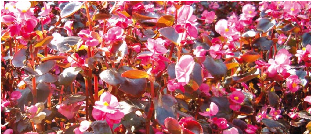
A begónia népes, 1500 fajt számláló nemzetség

Az Észak-Amerikában őshonos kék, vagy orvosi lobélia közel egy méter magas növény. Érdekessége, hogy mocsaras területeken, vagy a kert tó sekély, part men-