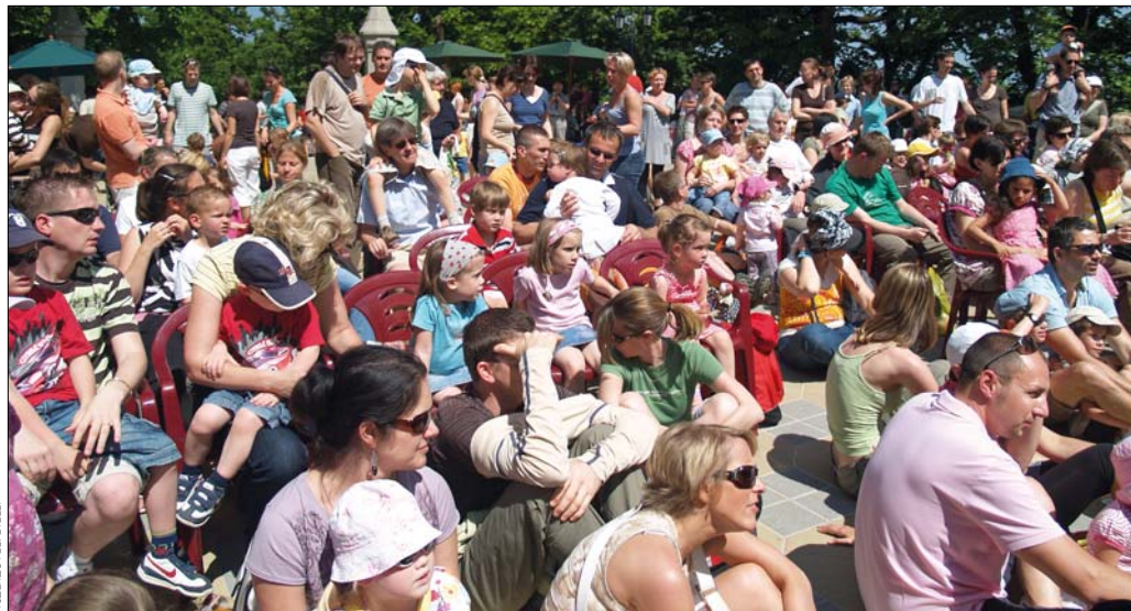
A SZARVAS FÉLVEZELÉ

A háromnapos programsorozatról a Hegyvidék Televízió is részletesen beszámol.