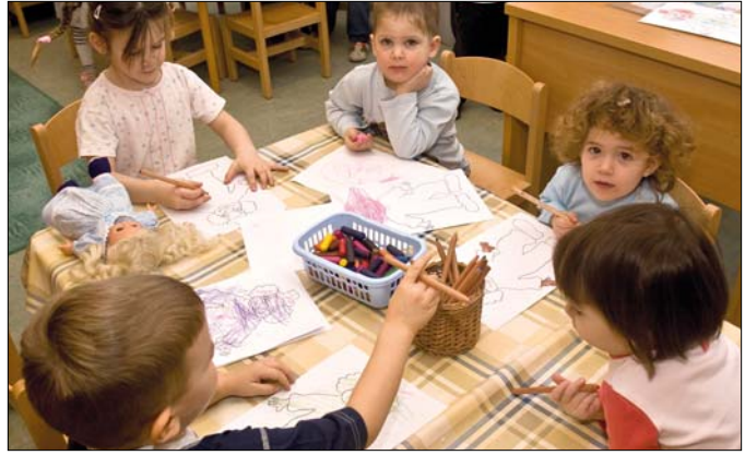
A kreatív képességek már gyermekkorban kialakulnak