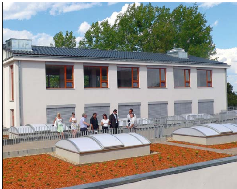
A tornacsarnok tetején környezetbarát zöldtetőt alakítottak ki

A polgármester emlékeztetett arra, hogy minden évben szinte mindegyik kerületi óvodában