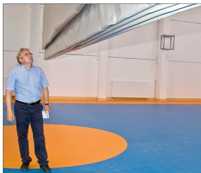
A tornaterem két részre osztható