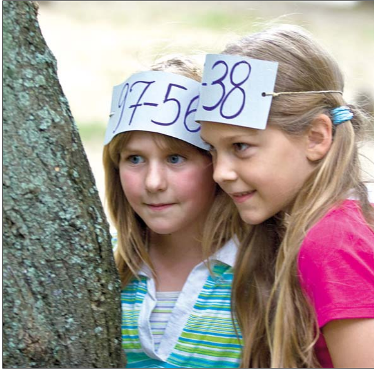
A számháborúzásra soha nem kell toborozni a gyerekeket

A vidám gyerekkocok látva elgondolkodtat, miért nem választja több szülő ezt a tábort ahelyett, hogy hagyja, a gyermeke otthon üljön a számítógép előtt, vagy a zenecsatornákat váltogassa a televízió. Ezen a héten nyolcvan-kilencven lurkót hoztak ide, és van még hely bőven. Ráadásul a pedagógusok sem bánnák, ha az