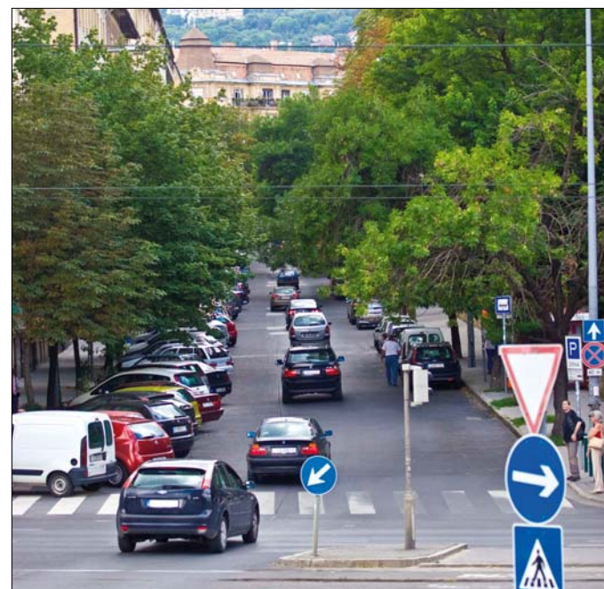
A 105-ös Pest felé mégsem a Királyhágó utcán közlekedne

■ A témával a Hegyvidék Televízió is bővebben foglalkozik.