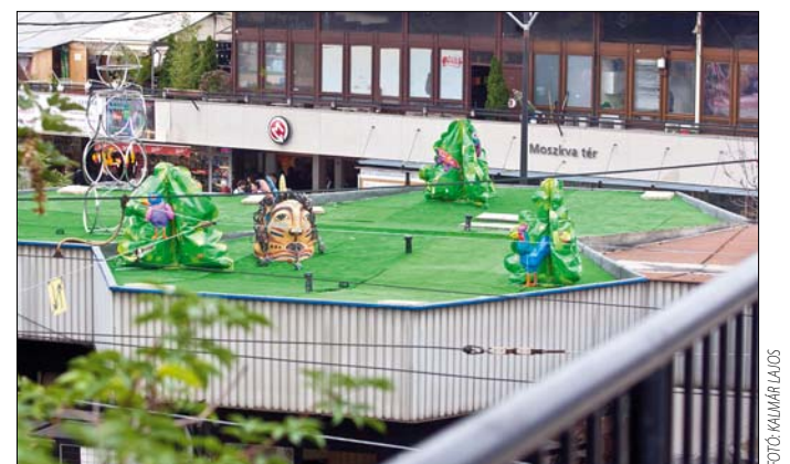
A tér több pontja is kellemes meglepetést tartogat