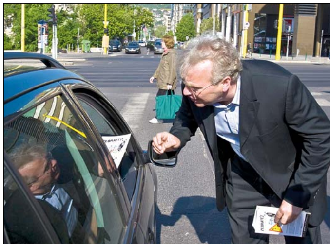
Nem csak az utak újultak meg, a gyalogosok érdekében közlekedésbiztonsági program indult