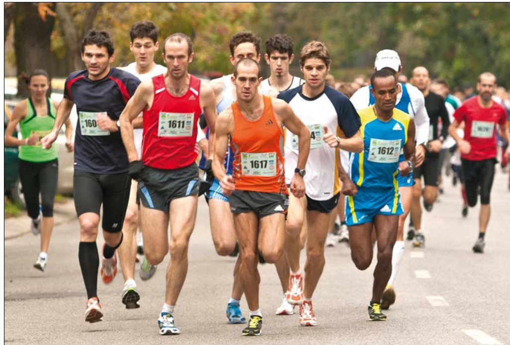
A pálya rövidsége miatt szinte végig teljes erőbedobással kell futni

A nagy esőzés miatt az eredeti időponthoz képest két héttel később rendezték meg a tizedik Előzd meg a fogaskerekűt! teljesítménytúra-, kerékpáros és futóversenyt. Bár az időjárás ezúttal sem fogadta kegyeibe a résztvevőket, a „leghegyvidékiebb” sportrendezvényen mintegy ezeröttszázan teljesítették a kijelölt tavokat.