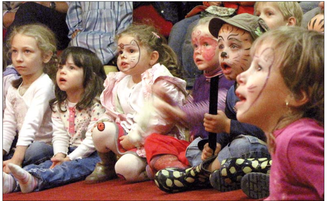
Domibábszínház mesét varázsolt a szemekbe

A kedvező tapasztalatok birtokában újabb egészségügyi programot indított a kerületi lakosok számára az önkormányzat. A Hegyvidéki Prevenció Szűrőszobát keretében jövő májusig minden hónap utolsó szombatján egy-egy betegségcsoport ingyenes szűrését végzik el a Szent János Kórházban. Az előlészűrésre,