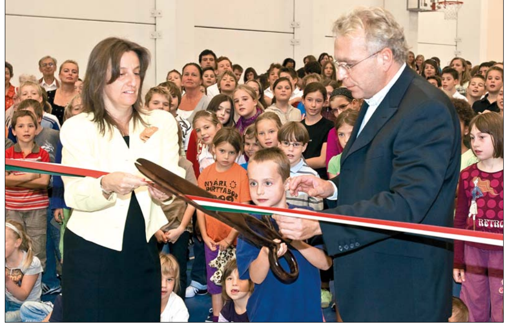
Máshol iskolákat zártak be, a Hegyvidéken bővült az oktatási intézmények hálózata (a Tamási Áron iskola új ökotornacsarnokának átadása)

– Kiváló az együttműködésünk a helyi rendőrséggel, amit szeretnénk erősíteni. Igyekszünk növelni a járőrök számát, eszköz- és pénztámogatást adunk, továbbá rendőrlakás-támogatást biztosítunk. Szeretnénk a helyi civil szervezetekkel egyeztetve biztonságosabbá tenni a Városmajort: a főváros támogatásával bekerítetünk a parkot, ezzel együtt pedig kamerarendszert építenék ki a területen. A cél az, hogy a Városmajor valóban parkként, pihenőhelyként funkcionálhasson. Át kell majd gondolni azt is, mit lehetne kezdeni a Városmajori Szabadtéri Színpad mai lelakott, lepusztult épületével. Véleményem szerint