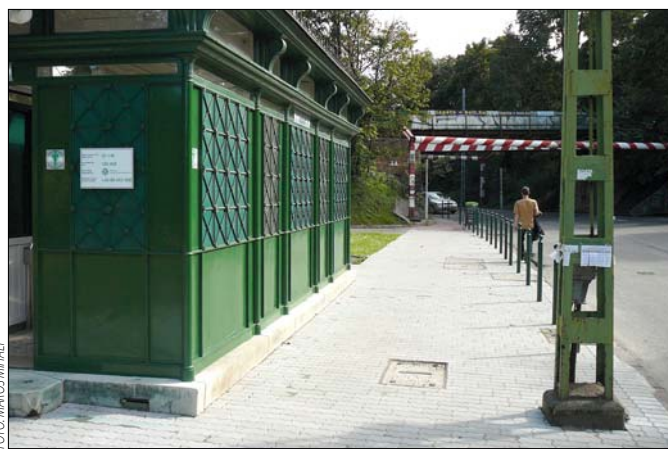
A János kórházzal szemben lévő, Városmajor utcai járda is megújult

Könnyebb lesz a ki- és behajtás a Béla király út irányából, a környéken élők kérésére ugyanis az önkormányzat közvetlenül a keresztvezetés előtt a Diós árok részleges befedésével kiszélesíti az útpályát. A mintegy negyven méter hosszú szakasz lehetőséget ad arra, hogy szükség esetén a felfelé haladó autók félreálljanak, és ne kelljen visszatolatlátniuk.