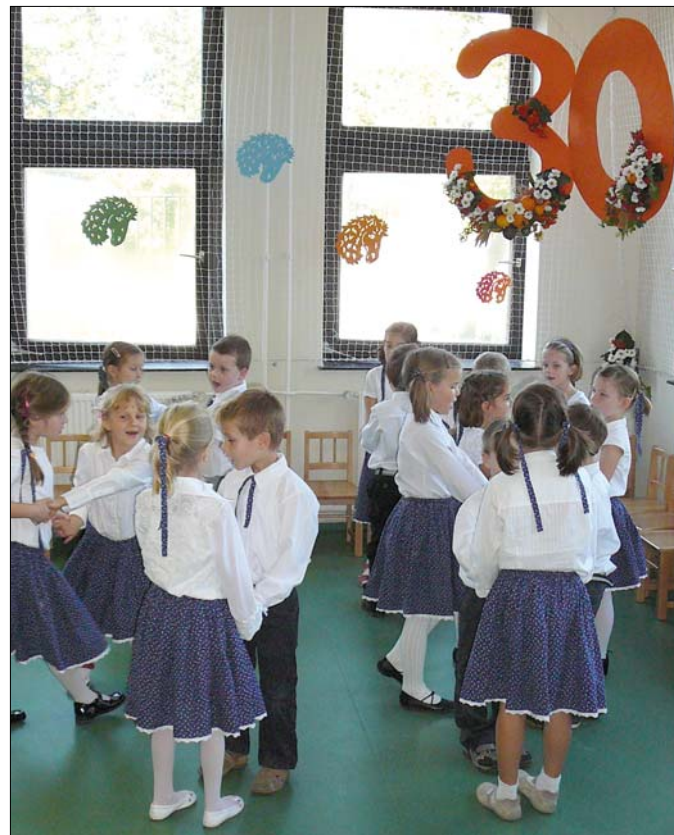
Ünnepi műsorral köszöntötték a gyerekek szeretett óvodájukat

Azt az óvodát ünnepeljük, amely talán a legjobb a kerületben, még akkor is, ha nagyon nehéz, vagy inkább lehetetlen különbséget tenni az intézmények között, hiszen mindegyikben kiváló munkát végeznek. A hangsúly pedig éppen a munkán van, és azokon, akiknek ezt a teljesítményt köszönhetjük: az óvodapedagógus-