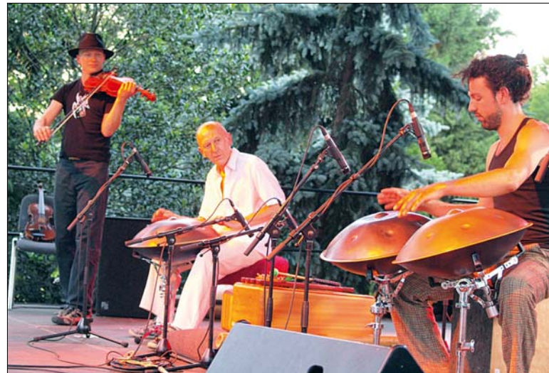
Kiváló zenészek sora lépett fel a két nap alatt (képünkön a Manivolanti projekt)