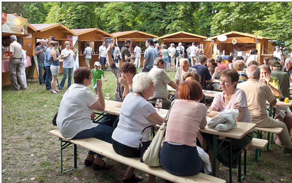
Az időjárás ezúttal mindkét nap kegyes volt, semmi nem zavarta meg a jó hangulatot

téséről és a késztermék számos jó tulajdonságáról. Merinói és kis számban racka bárányok szőrméjét készíti ki selymes puhává, a bőröket babakocsiban, autóüléseken, bőr ülőgarnitúrákon vagy éppen szőnyegként is lehet használni, mivel télen melegítene, nyáron hűsítene. „Mit gondol, miért hagyta magán a subáját a juhász egész éven át?” – kérdezte tőlünk búcsúzóként.