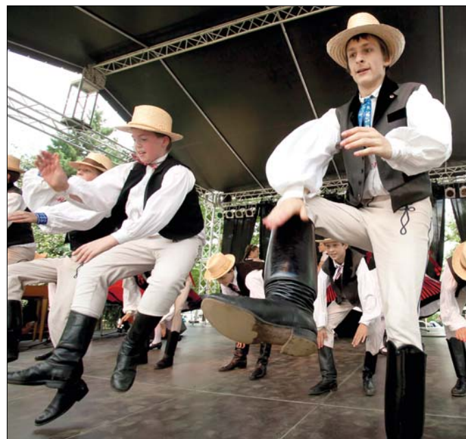
A néptánc elmaradhatatlan része a Hegyvidéki Napoknak

utca rövid szakasza sétálórészként született újjá, a lombok alatt magára talált a pázsit, a kutyák immár saját játszótéren futkározhatnak. Szombaton, a kora délutáni koncertek előtt szinte mindenki tett egy kört, hogy felmérje a változásokat. Lapunk bárkit megszólított, a fő téma a Gesztenyés volt, az, hogy „milyen széppé varázsolták...”