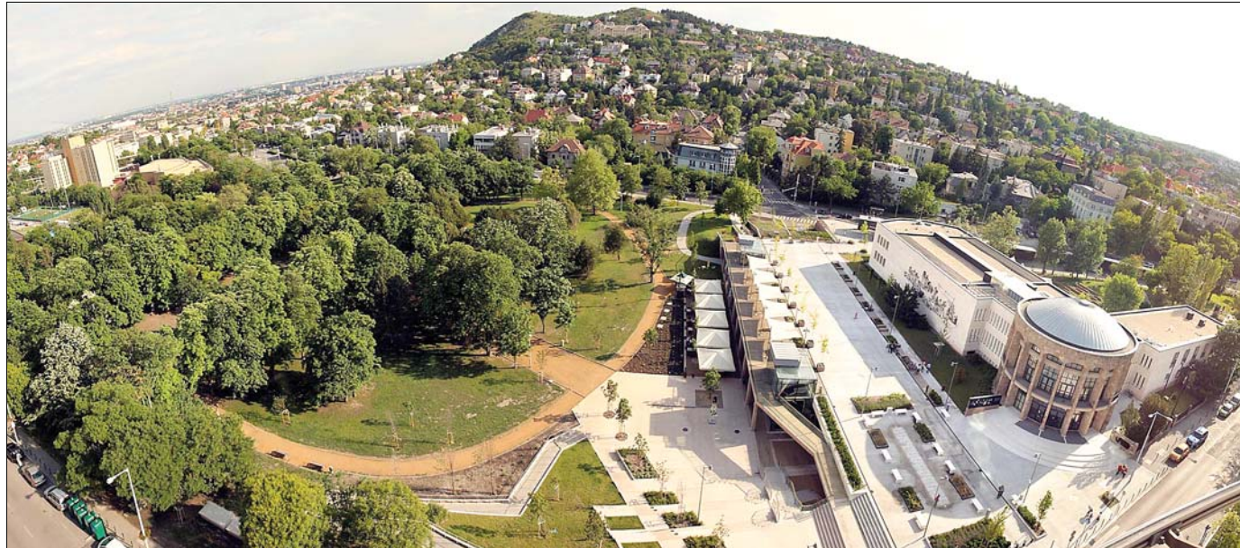
A MOM Kulturális Központ és a Gesztenyész kert látványos átalakításával a Hegyvidék egyik központi része újult meg

Új tornacsarnok és kültéri sportpálya, ökökert és tanösvény, új tantermek, laborok és közösségi terek épültek, megújuló energia felhasználásával komplex energetikai átalakítás, továbbá teljes körű akadálymentesítés valósult meg az iskolában. Csaknem 19 millió forint támogatás felhasználásával fejlesztették a kompetencia alapú oktatást, kialakították innovatív pedagógiai programjukat, tovább képezték