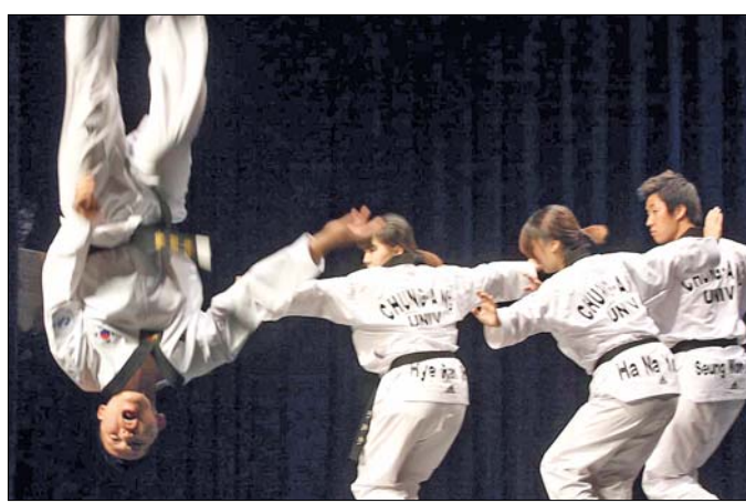
Taekwondo-bemutató: sport és performansz egyszerre

Zárásként a lényegesen békésebb Ariranggal ismerkedhetett meg a MOM közönsége. A sajtóhagyomány útján terjedő, mára az egyik legismertebb és legkedveltebbé váló koreai népdal, a hétköznapi emberek mindennapi örömeit és bánatát megjelenítve, a koreai emberek egységét, összetartozását erősítette a japán megállás alatt. A koreai művészek az előadással - szándékaik szerint - egyúttal a magyar és a koreai nép barátságát is kifejezték.