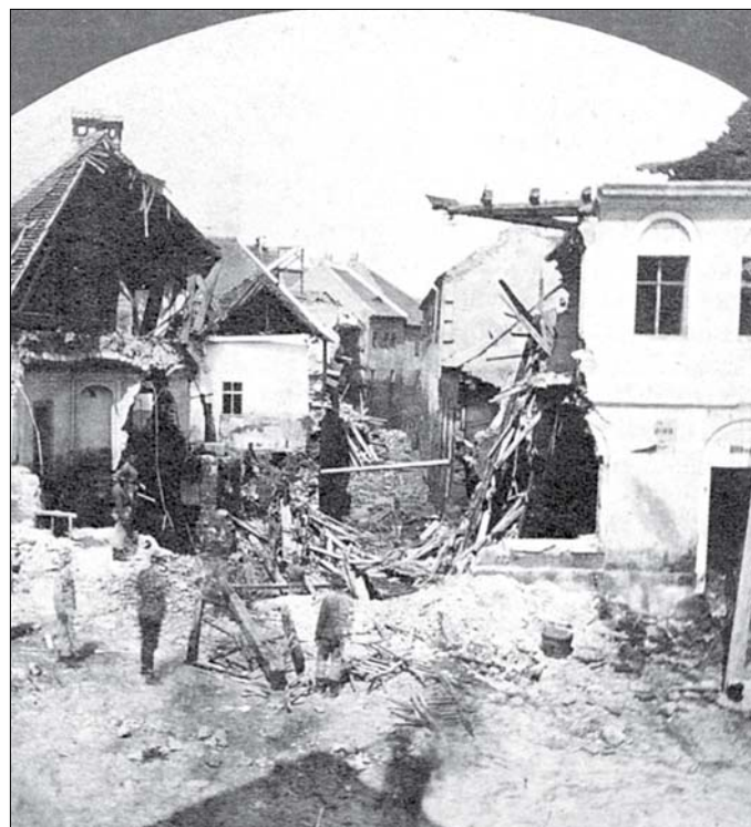
A Tabán az árvíz után

A gyorsan hömpölygő, saras áradat elleppte a Városmajort és a Vérmezőt. A Tabán vonalában 1875-re már befedték a patakot, de az a sok hordaléktól eldugult, és a víz új medret vájt magának a Tabán épületei között. Olyan hatalmas volt a nyomása, hogy a bedugult csatorna, mintha dinamittal robbantották volna fel, a levegőbe repült, elpusztítva a felette álló házakat. A Városmajor szomszédságában, a mai Széll Kálmán téren működő Drasche téglagyár gőzgépének kazánja a rázúduló víztől felrobbant, és felgyújtotta a környező házakat.