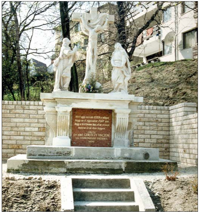
A Gerlitz-oltár eredetileg a Vízivárosi temetőnél állt

bejárata előtt állították fel 1890-ben, majd a temető bezárását követően, 1933-ban helyezték át a Szent Orbán térre. A középkorban a terület nagy részét a szervita szerzetesrend birtokolta, az ő emléküket őrizte meg a Szervitakunyhó, amely a Szent Orbán tér felett állt még jóval a szőlők kipusztulását követően is. Jókai Mór is megemlékezik róla; a 20. század eleji térképek még jelölték.