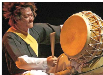
Samulnori: hangerő, ütem, dinamika

tanfolyamok - a legnépszerűbbek a nyelvoktatás, a taekwondo-edzés, a főzőórák és az új kedvenc, a papírhajtogatás - mellett