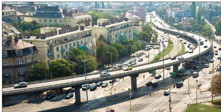
A dugódíj céljait illetően nincs vita

galom koncentrációja, mivel a város magja felé tartó járművek egyenletesebben oszlanának el, valamint az autók több lépcsőben keresnének parkolóhelyet. A többzónás kialakítás egyidejűleg segítené elő a légszennyezettség és a közlekedési problémák megoldását, s csökkentené a túlszűfoltosság kialakulásának lehetőségét.