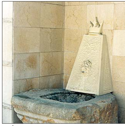
Az Ágnes-forrás mára elapadt

Ugyancsak itt található, a fák lombja alatt megbújva, a Gerlitz-oltár, amelyet eredetileg a Kút-völgyben fekvő Vízivárosi temető