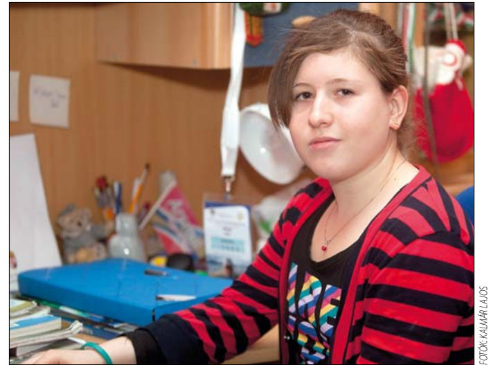
A legmagasabb szinten szeretne tanulni és sportolni is

– Nagyon, de hozzám tartozik. Egyszer egy sérülés miatt több hétre begipszelték a karomat, az idő alatt vizet jóformán csak a pohárban, vagy a levesben láttam – alig vártam, hogy visszamehessek a vízbe. Az úszók mindig azt mondják, hogy mi