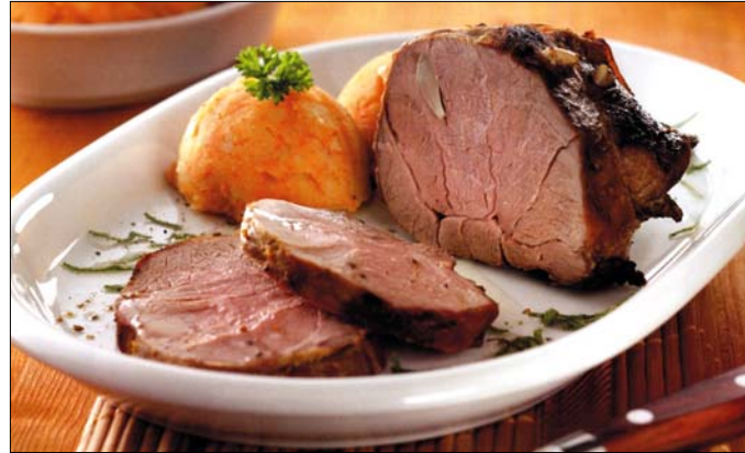
Birkacombhoz fokhagymás burgonya – nem gyógyít, de finom!

sütőben csaknem puhára pároljuk. Amint megpuhul, leemeljük róla a fóliát, és a forró sütőbe viszatolva ropogós pirosra sütjük. Párolás közben az elsült saftját kevés vízzel pótolgathatjuk.