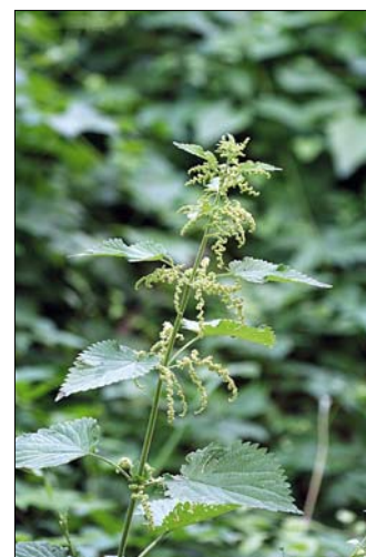
Csalán: kesztyűbűben szedjük!

is készíthet belőle. Nagy előnye, hogy könnyen gyűjthető, és fogyasztása a méregtelenítés mellett a kert gyommentesítésében is jelentős javulást idéz elő.