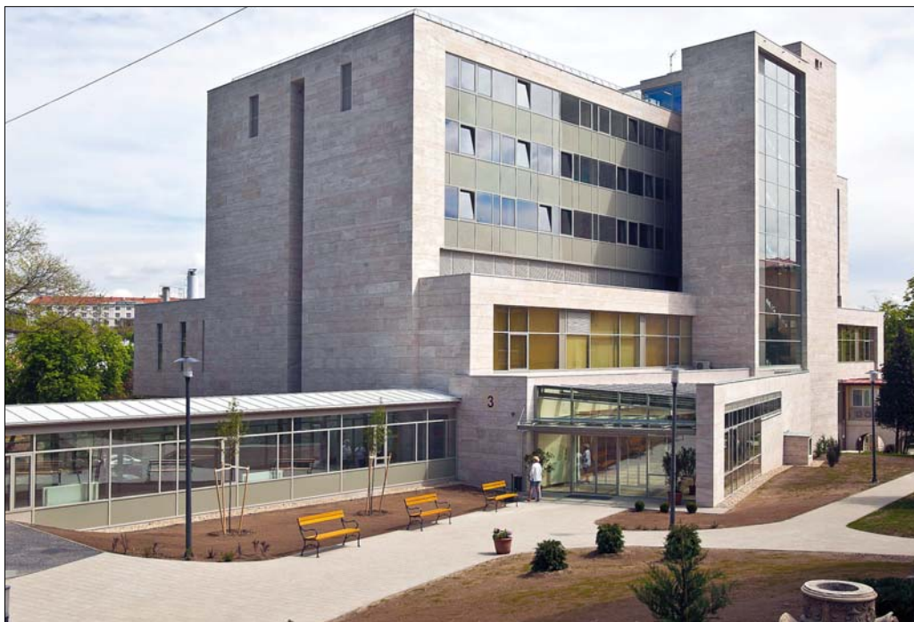
Az új épületszárnyban több speciális műtő és hetvennyolc ágyas fekvőbeteg-részleg javítja a gyógyítás feltételeit