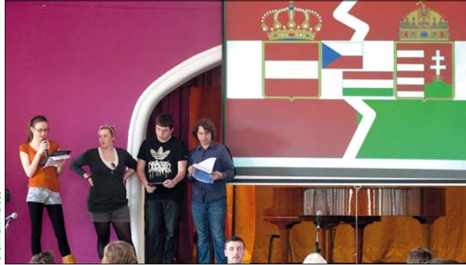
A régi történelmi kapcsolat komoly hajtóerő az együttműködéshez

lyamosok rövid épületbejárás mutatott be az eredetileg a Sion rend által épített intézmény kalandos történetét. Kifejezetten a cseh iskola kérésére a 12-esek a két világháború közötti Magyarországról, közelebbről a trianoni békediktátumról, a Horthy-korszakról, valamint a második világháború magyar vonatkozású eseményeiről és közvetlen hatásairól, a hatalomra kerülő sztálinista rendszerről tartottak előadást, míg a prágai diákok a cseh-magyar történelmi kapcsolatokat elevenítették fel. Az iskolai prog-