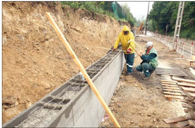
Várhatóan a nyári iskolaszünet végére minden munkával elkészülnek