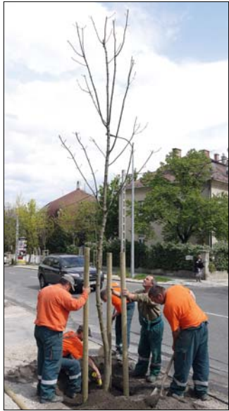
Hárs-, kőris- és juharfákat ültettek

Az önkormányzat által kiadott kötelezettségnek megfelelően április végén és május elején négy helyszínen, az Irhás árokban, illetve a Németvölgyi, a Szarvas