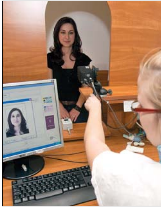
Az okmányirodában készül a fotó

A napokban adták át az igénylőknek az újfajta diákigazolványok első példányait. A Nemzeti Egységes Kártyarendszerbe illeszkedő, korszerű chippel ellátott igazolványok a korábbinál sokszínűbb alkalmazást tesznek lehetővé.