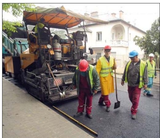
Jól halad a Korompai utcai burkolat-helyreállítás

az úttest részleges kiszélesítésével, valamint az Orbán téri buszmegálló megerősítésével, jelenleg az útpálya aszfaltozása zajlik.