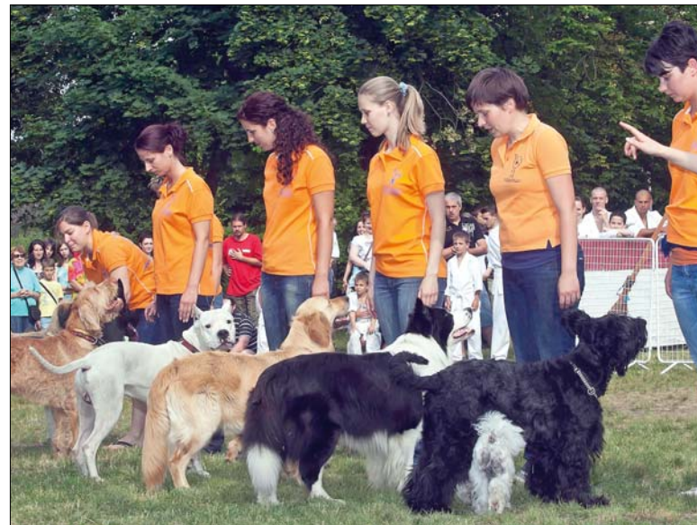
A kontrollt nem pórázal, hanem a gazda tudatosságával kell elérni