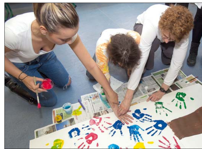
Készül a festett „tenyerfa”