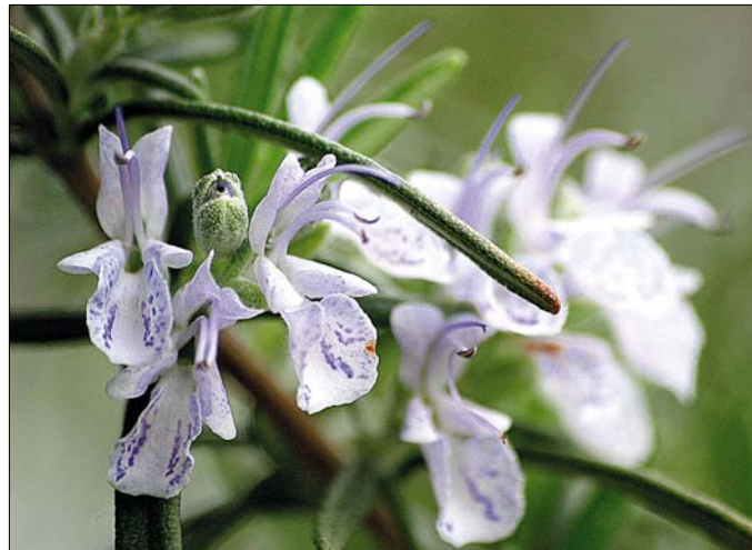
A rozmarin tetszetős bokorrá cseperedve elegendő levelet ad