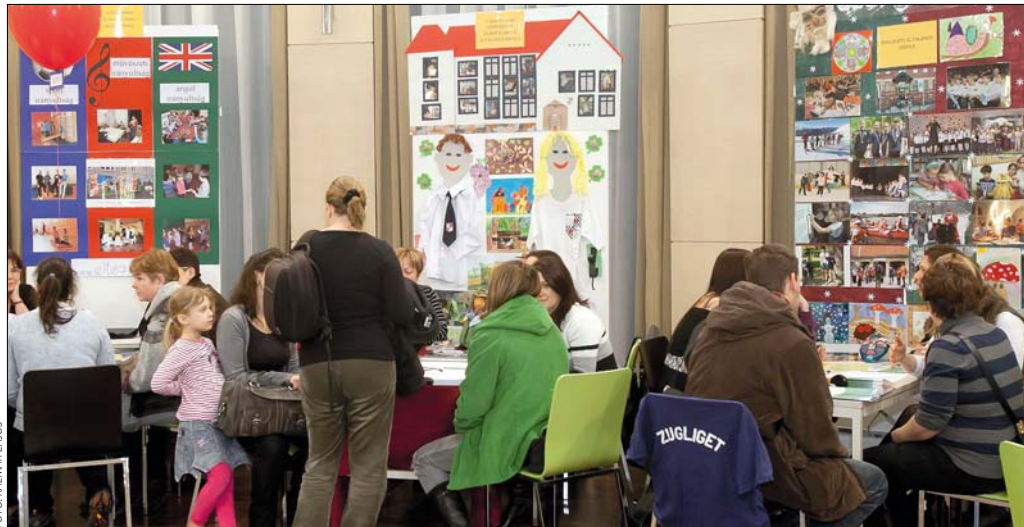
A februári "Iskolanyitogató" során az érdeklődők közelebbről megismerkedhettek a kerületi intézményekkel

Az irodavezető elmondta, hogy az Arany János Általános Iskola és Gimnáziumban szep-