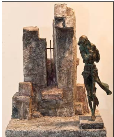
Nagy János: Esterházy 1.

Az egyebek mellett Esterházy János-díjjal elismert Nagy János az ezredfordulón átvethette a Magyar Köztársaság elnökének aranyérmét, egy évvel később pedig a Magyar Köztársasági Érdemrend lovagkeresztjét. A Városmajor utcában május 18-ig látható kiállítását végignézve a látogató egyszerre érzi a megajándékozottságot és a hiányérzetet: ajándék a katarzis, amit a művek üzenete ad, ugyanakkor torokszorítóan hiányzik a bizonyosság, hogy ezeket az alkotásokat máskor is, gyakran, sok helyütt újra megcsodálhatjuk.