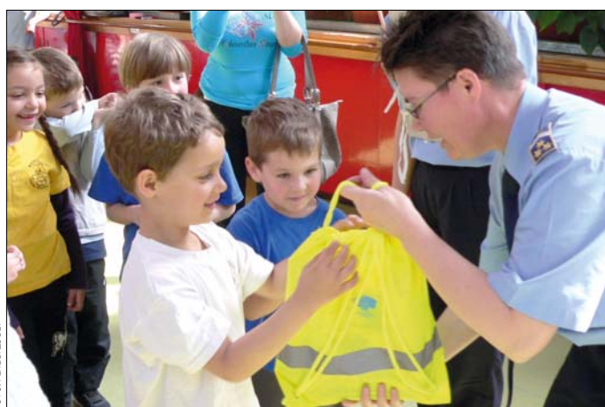
Valamennyi óvodás jutalmat kapott

A közlekedésbiztonsági ismeretek oktatását, a tudatformálást nem lehet elég korán kezdeni – ezt igazolja az a verseny, amelyet kerületi óvodásoknak rendezett a hegyvidéki rendőrkapitányság. A KIMBI Óvodában megrendezett versenyen a nagycsoportosok játékos feladatok segítségével gondolkodhattak el arról, melyek a gyalogos közlekedés biztonságos formái a városban. Olyan, a korosztályuk számára könnyen érthető és fontos kérdésekre kellett választ adniuk, mint hogy az úttest melyik részén szabad átkelniük, vagy hol kell haladniuk akkor, amikor az út mentén nincs kiépített járda.