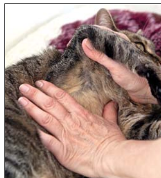
Kirándulás, sétáltatás után jól nézzük át kedvencünk bundáját!

Az utóbbi ellen hatékony védelmet nyújt a bárki számára elérhető, három részből álló oltássorozat. Ennek első két dózisát egy hónap különbséggel adják be – a védettség a második oltást