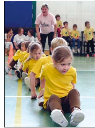
A vidám sorversenyt is lehet komolyan venni

Tíz kerületi óvoda több mint kétszáz nagycsoportosa vett részt a hatodik alkalommal megrendezett Nyuszi Kupán. A Semmelweis Egyetem Gyakorló