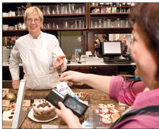
Egyre több helyen elfogadják a kis plasztikkártyát

Hegyvidék Kártyákat továbbra is lehet igényelni, mindenkinek jár, aki elmúlt 14 éves, és a kerületben lakik, dolgozik vagy tanul. Új kártyát – amelynek érvényességi ideje egy év – a polgár-