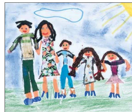
Az idei központi téma a család volt