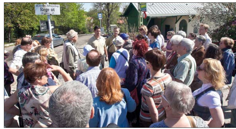
Ez alkalommal is kiderült, hogy a hegyvidékieket érdekli lakóhelyük története

„Az emlékmű eredetileg artézi kútunk készült, és a Városligetben állt, a millenniumi városrendezés során került új helyére, ide, a hegyre. Az eredeti szobor Stróbl-alkotás volt, sajnos többször ellopták, utoljára végleg eltűnt. A mostani portré az eredeti másolata. A mögötte látható kilátóból páratlan panoráma tárult egykor a kirándulók elé, mára azonban annyira benőtték mindent az