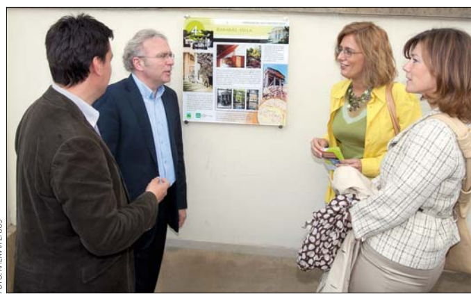
Séta közben ismerkedhetünk a környék múltjával

mai oktatási intézmény helyén. Az érsebészeti klinikáról egyebek mellett kiderül nemcsak az, hogy ott végeztek hazánkban az első sikeres szívtünetést 1992-ben, de az is, hogy régen számos neves művész, politikus keresett eny-