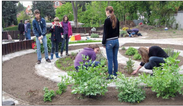
A Tamásiban az ökökertet tették még barátságosabbá a diákok

Miután a virágok a helyükre kerültek, következett a közös tánc, majd kezdetét vette a váruvált vetélkedő, amelyen arra is fény derült, hogy melyik állat milyen természeti környezetben érzi a legjobban magát. Bár a feladatok teljesítéséért minden állomáson pont járt, győztes nem