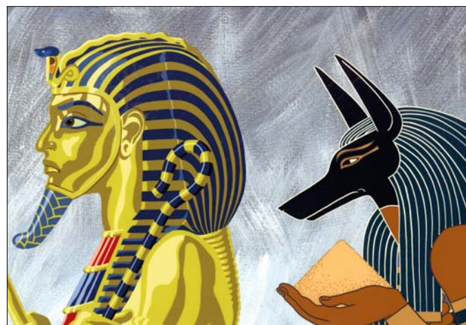
Az ember tragédiája (IV. szín: Kő és homok)