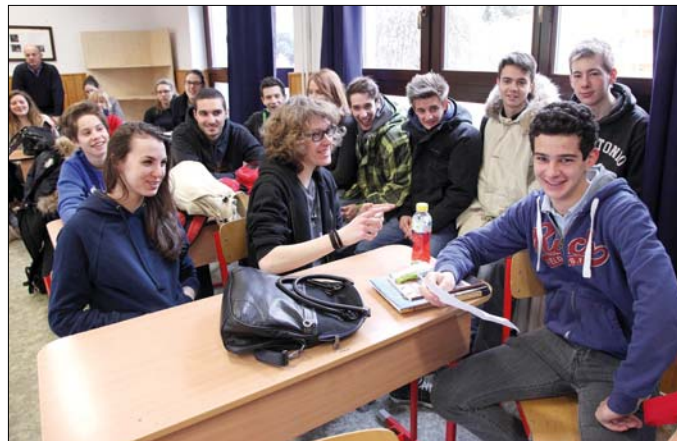
A közösen eltöltött idő hasznos az olasz és a magyar fiataloknak is

hozzánk, ami a gyerekeknek kiváló lehetőség, hogy gyakorolhassák a nyelvet. A közösen töltött idő a vendégeinknek is hasznos, mert megtapasztalhatják, hogyan él egy