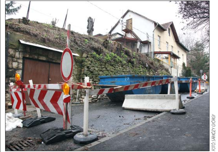
A biztonság érdekében lezárták az érintett útszakaszt