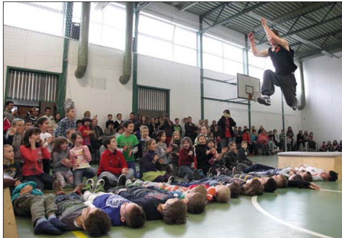
Különleges sportbemutatók szórakoztatták az ünneplőket