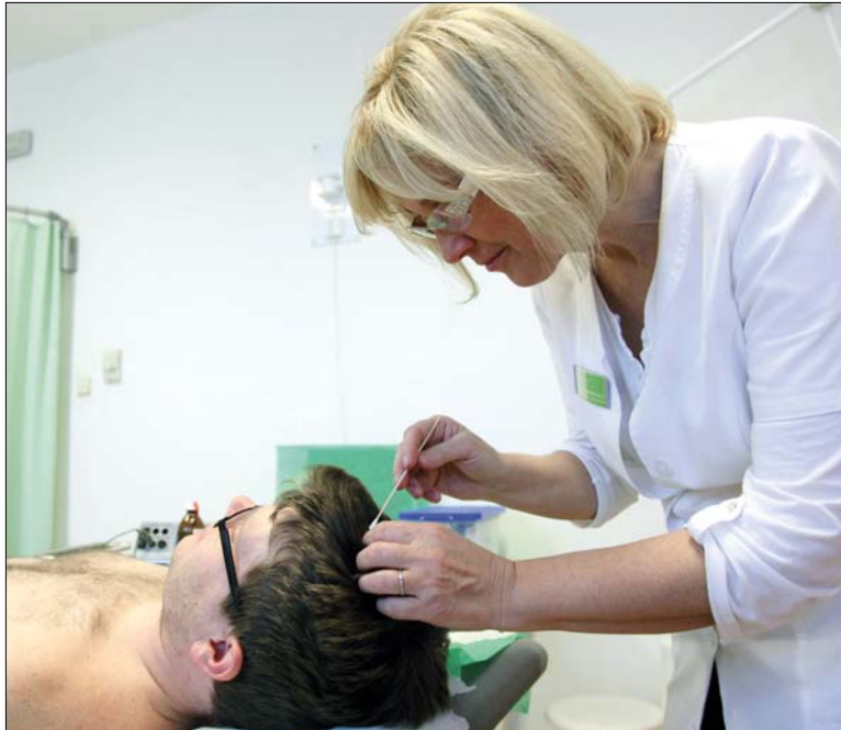
A vizsgálat során először a fejbőr épségét ellenőrzi az orvos

Bár alapvetően esztétikai kérdés, mégsem szabad elhanyagolni, ugyanis a fejtetőn bekövetkező hajvesztés az UV-sugárzás szempontjából is problémát okozhat – ezért nagyon fontos, hogy kopaszodás esetén mindig gondoskodjunk megfelelő védelemről a nap ellen. Használjunk kalapot, sapkát, illetve napvédő krémet.