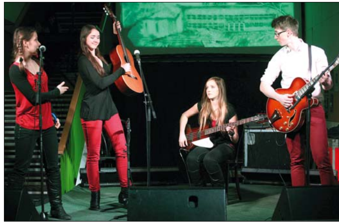
A zenei programban egykori és jelenlegi növendékek is szerepeltek

kolai első, valamint a gimnáziumi kilencedik évfolyamon az idei évtől kifejezetten sportiskolai osztályok is indulnak.