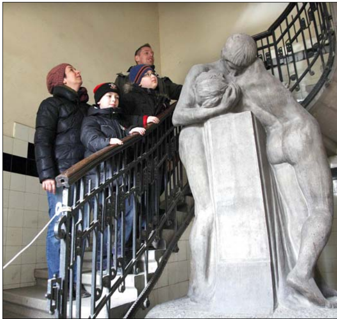
Maros utca 10.: akkoriban a házbelső esztétikája is szempont volt