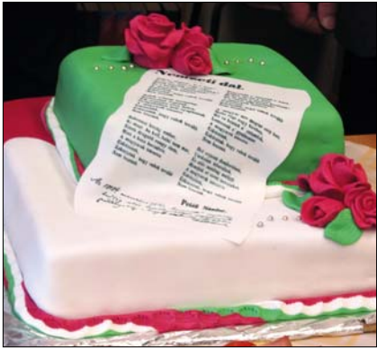
Ajándék marcipántorta a Nemzeti dallal

A németvölgyiek igyekeztek a nyárasdihoz méltó gazdag programot szervezni. Az ismerkedést szolgáló játékos tanórák, a Sándor-palota, a Magyar Nemzeti Galéria, valamint más várbeli látványok megtekintése mellett a látogatás napjára időzítették a