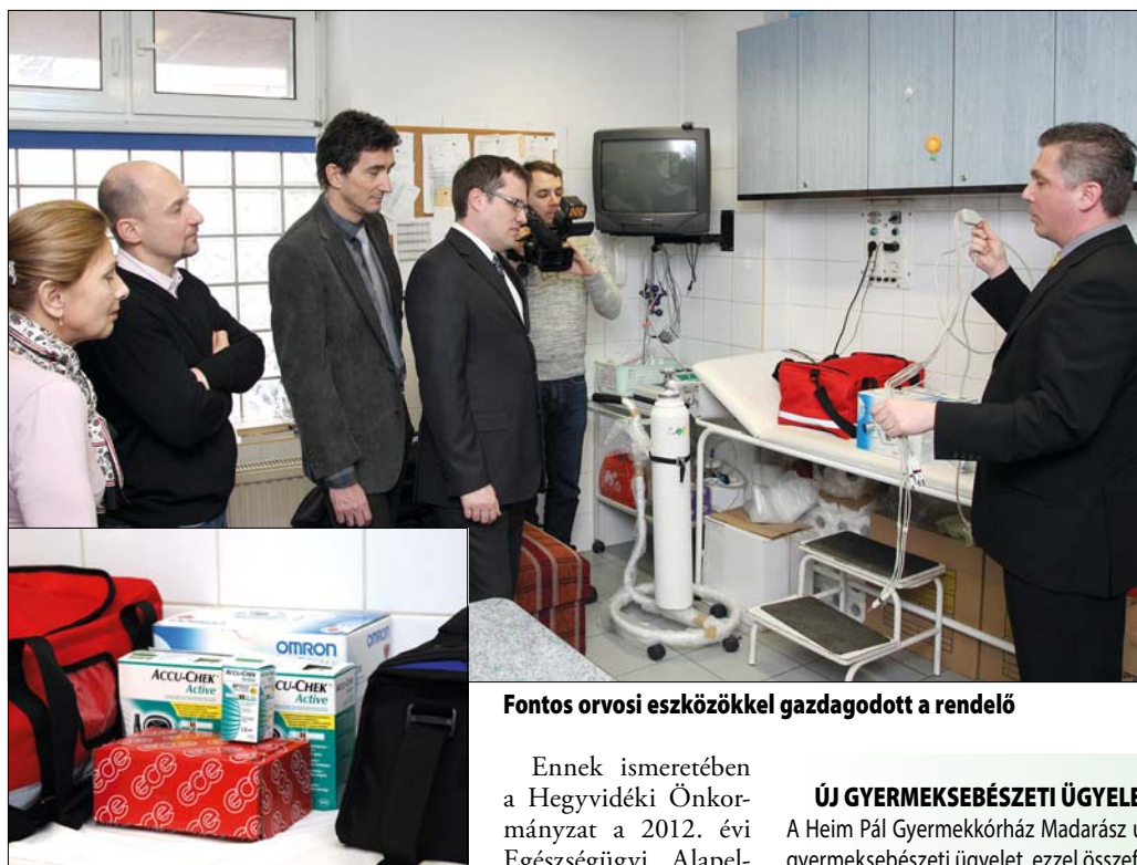
Fontos orvosi eszközökkel gazdagodott a rendelés

Ennek ismeretében a Hegyvidéki Önkormányzat a 2012. évi Egészségügyi Alapellátás pénzzaradványát, mintegy 1,2 millió forintot az ügyelet mindennapi munkáját segítő műszerek, orvosi eszközök beszerzésére fordította. Ily módon félautomata defibrillátorral, EKG-készülékkel, továbbá vérnyomás- és vércukorszintmérőkkel, sürgősségi táskával, oxigénpalackkal, illetve egy ahhoz tartozó állvánnyal és gáznyomás-szabályozóval gazdagodott a házi orvosi rendelés.