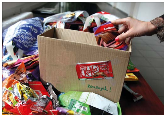
Már két nagy kartondobozt megtöltöttek az önkormányzatban dolgozók

Környezetvédelmi, illetve jótékonyági céllal indította el tavaly a csokoládepapír-összeváltást a világ több mint húsz országában hulladék-újrahasonosítással foglalkozó TerraCycle magyarországi képviselője (a Milka termékek forgalmazója, a Kraft Foods támogatásával). Környezetünket azzal védhetjük, hogy a feleslegessé vált csomagolások nem szeméttelre vagy égetőmübe, hanem egy feldolgozóhelyre kerülnek, és azokból újabb hasznos műanyag termékek készíthetnek.