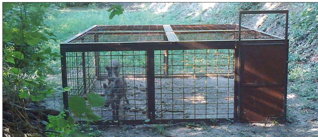
A befogott vadaknak szőrük szála se görbül, rövid időn belül szabadon eresztik őket távol a Hegyvidéktől

Sajnos, a felhívások és figyelemfelkeltő kampányok ellenére továbbra is előfordul, hogy emberek élelmet szórnak ki a kertek végében, illetve etetik a vaddisznókat.