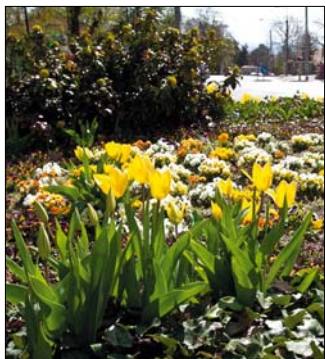
Április végén folytatódik a virágültetés a közterületeken

„Jó lenne, ha minél több kerületi ablakra, erkélyre és belső udvarra növények kerülnének, éppen ezért az idén minden eddiginél több, összesen húszezer tő, nagyobb részben piros, illetve lilá és fehér tiroli muskátli talál majd