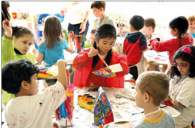
Rajzolni, festeni a Happy Kids óvodásai is nagyon szeretnek