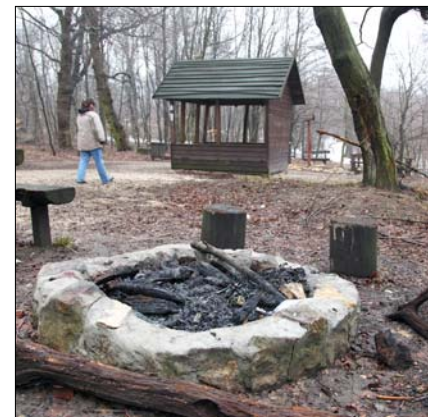
Tűzgyújtási tilalmat is elrendelhetnek

alvó erdő ugyanis tele van nagy mennyiségű, könnyen és gyorsan égő elszáradt növénymaradékkal.