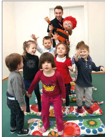
A bábos torna a kedvenc a Micimackóban

– Rengeteg óvodapedagógus, dajka, asszisztens jelentkezik az óvodában. Először néhány napig nálunk dolgoznak, s ha úgy látjuk, hogy megfelelő a szakmai felkészültségük, és be is tudnak illeszkedni közénk, akkor közös