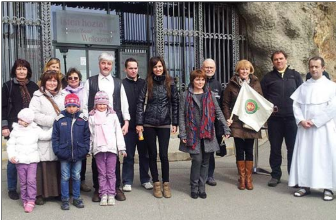
Zarándokok a Gellért-hegyi Sziklatemplomnál

A spanyolországi El Camino mintájára létrehozott Magyar Zarándokút, szent helyeket érintve, Esztergomból vezet Máriagyűdre, s alapja lehet majd a Czestochowa és Medjugorje között tervezett nemzetközi zarándokútnak. A kijelölt, „felfestett” útvonalon 20-35