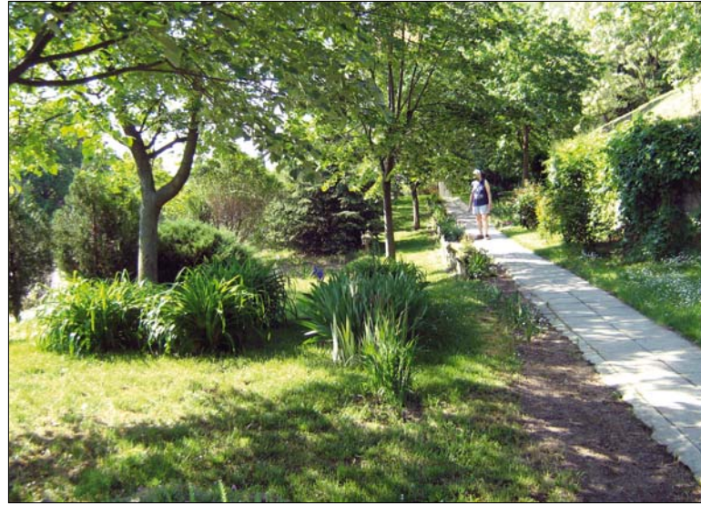
A tavalyi győztes kert (Csorna utca 5.)