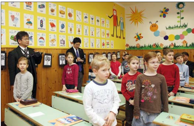
A japán vendégek hasznos tapasztalatokkal gazdagodtak a Virányosban

A Virányos Általános Iskolában tett látogatásukat követően a küldöttség tagjai a Károli Gáspár Református Egyetemen, valamint a Városmajori Gimnáziumban vettek részt bemutatóórákon. (m.)