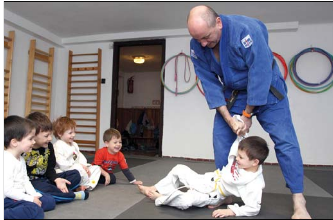
Dzsúdófoglalkozás a Szorgos Méhecskékéknél

– A nevelési programunk inkább nemzetközi, mint magyar, a gyerekeket egyénileg készítjük fel leendő iskolájukra. Olyan pedagógus segít ebben, aki tanítói diplomával is rendelkezik, és ismeri a budapesti nemzetközi iskolákat,