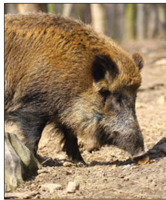
(m) Nehezen találják élelmet

Az utóbbi hetekben többször előfordult, hogy vaddisznók tévedtek be lakott területekre, ráadásul az erdőszéli utcáknál lényegesen távolabb, az Orbán térig, illetve a Kútvolgyi útig is eljutottak. Több bejelentés érkezett a Szechenyi-hegy és a Hunyad-órom környékéről is, a megszokottnál viszont kevesebb a korábban az állatok kedvencének számító Irhás árok térségéből. A viselkedésük nem változott, általában kisebb kondákba verődve túrják szét a kerteket, élelem után kutatva felborítják az utcára kitolt kukákat, illetve