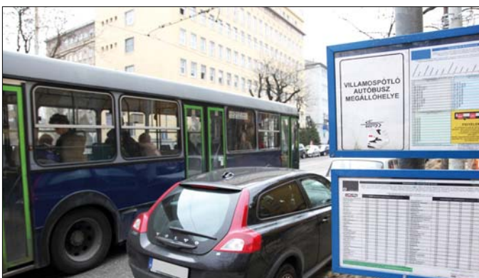
Néha még a busz sem tud beállni a megállóba