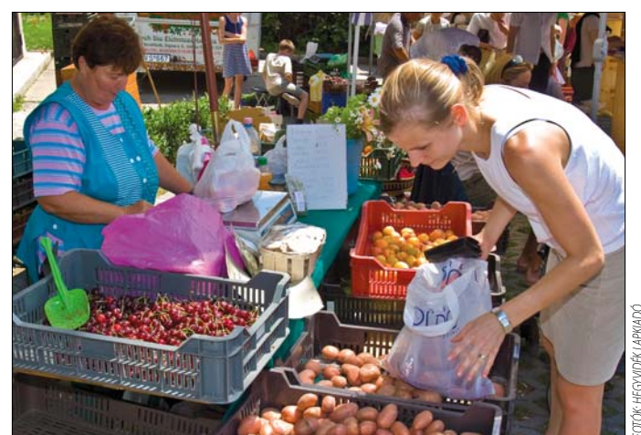
Sokan szívesen vásárolunk termelőtől

– Minden terméknek az a jó, ha a legrövidebb úton jut el a fogyasztóhoz.