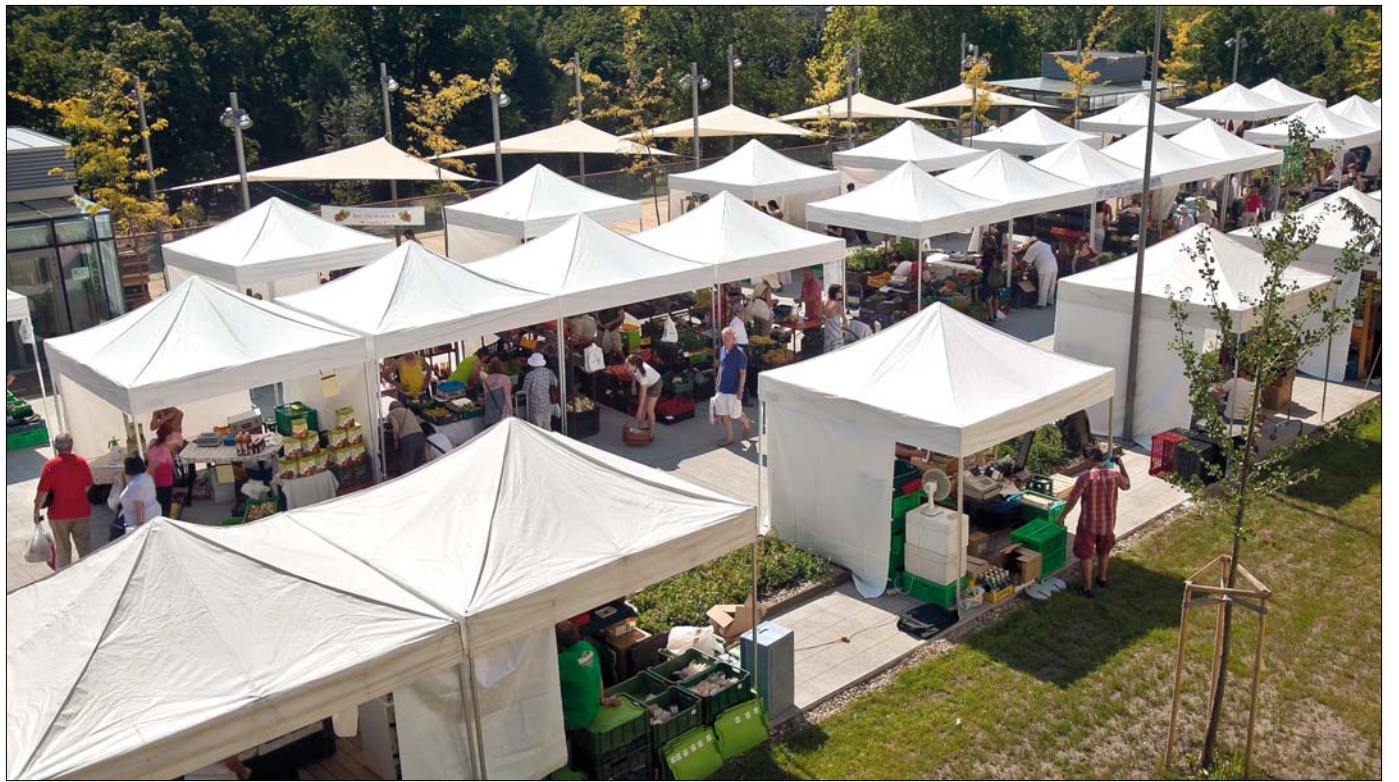
A termelői piac hangsúlyozottan nem bio piac lesz, és nem is klasszikus zöldséges stand, a gazdák a saját termékeiket kínálják majd idényjelleggel

– Tizenöt család hozta létre a Ker-Tész Termelő és Értékesítő Szövetkezetet. Vannak köztük hideghűtéses hajtással foglalkozók, akik salátát, újhagymát, retket, paprikát, paradicsomot, palántákat és fűszernövényeket termelnek, ők azok, akik az első piaci napon is megjelennek már. Aztán jönnek a szezonak meg-