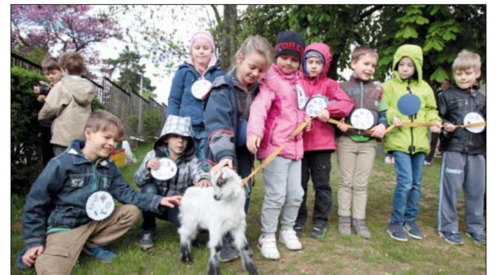
A kecszegida volt az egyik fő kedvenc

lomból távcsöves madármegfigyelést szerveztek az udvaron. Nem tudjuk, sikerült-e az ifjú természetbúvároknak kakukkot vagy pacsirtát lencsevégre kapni, egy graffalóval azonban mindnyájan megismerkedhettek a „meseutazókban”: a nem túl félelmetes erdei szörnyről Julia Donaldson története alapján Piros Ildikó színművész mesélt. Aki minden feladatot teljesített, állomásonként