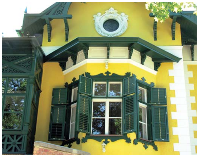
A Normafa út 17/b szám alatti épület helyreállításához a korábbi években nyújtott segítséget a Hegyvidéki Önkormányzat

A 20 millió forint keretösszeggel értékvédelmi támogatásra a kerület által védett, továbbá fővárosi és műemléki védettséggel rendelkező épületek tulajdonosai pályázhatnak. Nem feltétel a társasházi forma, akár az egy-két lakásos régi villaépületek rekonstrukciós munkáival is lehet nevezni. Annak a lehetőségét