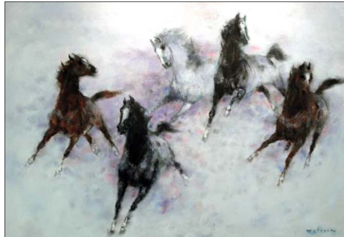
Öt ló lila háttérrel