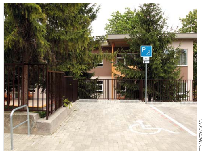
Mozgássérülteknek alakítottak ki parkolót a KIMBI Óvodánál