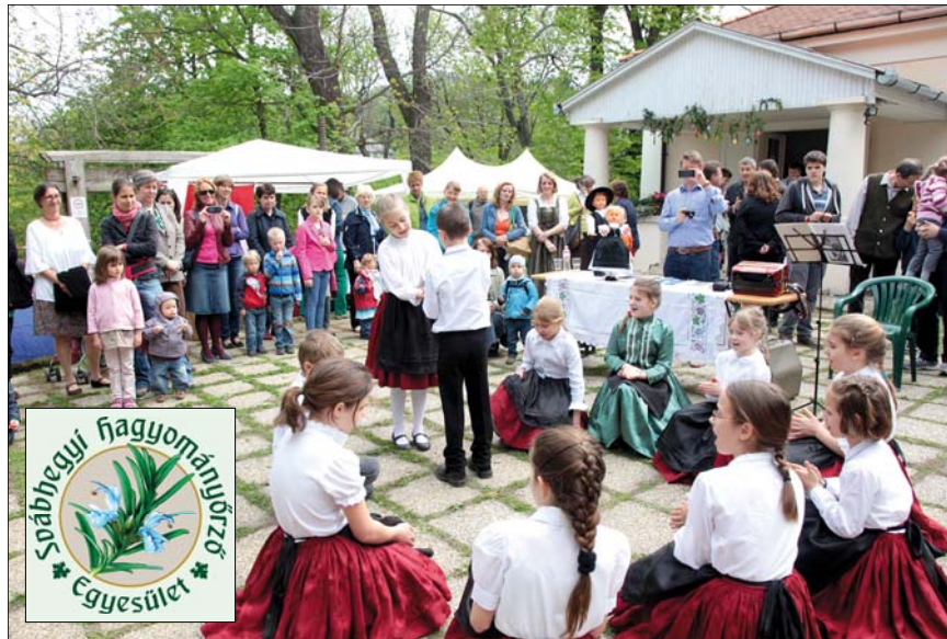
A Jókai iskola diákjai sváb táncokat adtak elő a Livia-villa kertjében