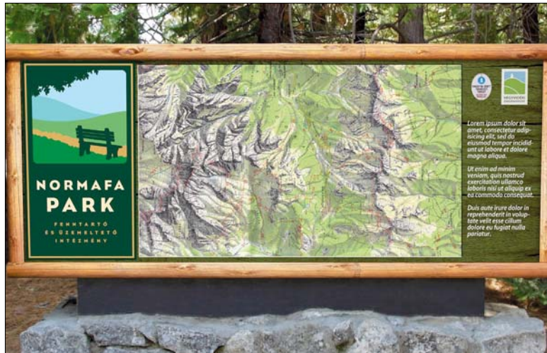
A Café Design logóterve részletgazdag és hagyománytisztelő

Tavaly októberben lépett hatályba az a törvény, amely alapján a kormány a Hegyvidéki Önkormányzatra bízta a Normafa kezelését és rehabilitációját. Azt, hogy pontosan mi történjen a környék rendezése során, egy sokrétű, jelenleg is zajló környezetvédelmi vizsgálat sorozat – az Európai Unió szigorú szabályozásával összhangban lévő Natura 2000-es hatásvizsgálat, valamint több más, a kerület megbízásából vég-