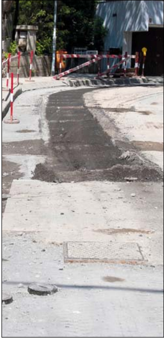
Zajlanak a kátyúzások