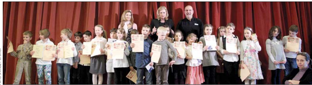
A zsűri tagjai és az okleveles elismerésben részesülő diákok

„Mi a szavalás? A vers föltámasztása papírsírjából” – írja Kosztolányi Dezső A versről című művében. A Jókai Klubban rendezett költészet napi szavalóversenyen huszonegy tehetséges hegyvidéki kiskisiskolás vállalkozott a poémák életre keltésére.