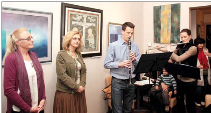
Zenés előadás színesítette a megnyitót