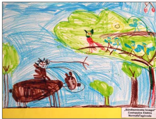
Costopulos Elektra (Normafa): Sündisznócska lovagol

dekes, egymással kombinálható technikák örömtelivé, vonzóvá teszik a fejlődési folyamatot. A gyakorlás közben tökéletesedik a kézművészet és a technikák pontos használata is. Az óvodai nevelés során fontos cél a gyermekek ízlésének formálása, esztétikai fogékonyságuk alakítása. A művészettel való találkozás észrevehetően javítja a kreatív