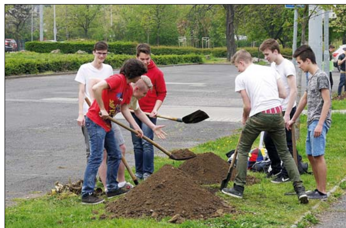
Az utóbbi években többször ültettek fákat a Gesztenyés kertben

„Sajnos, a legfrissebb felmérések azt mutatják, hogy a ma még álló fák között rengeteg a beteg, balesetveszélyes példány, ezeket a gyalogosok biztonsága érdekében mindenképpen el kell távolítani.