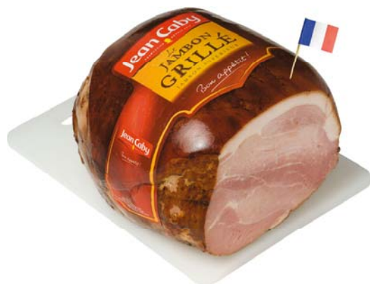
Le Grillé francia grillezett sonka

A németországi Fekete-erdő sonkája. Méltán híres, nagy múltú, fenyő forgáccsal füstölt, hagyományos kézműves stílusban, száraz sózással és három hónapos érleléssel füstölt sonka.