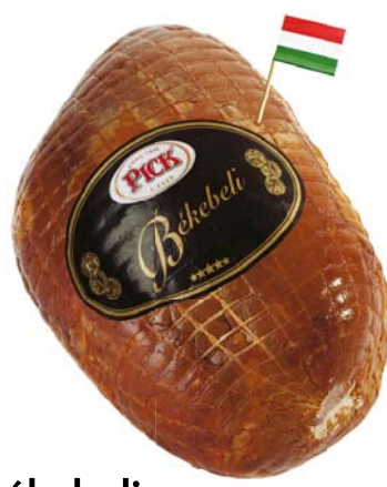
PICK Békebeli kötözött sonka