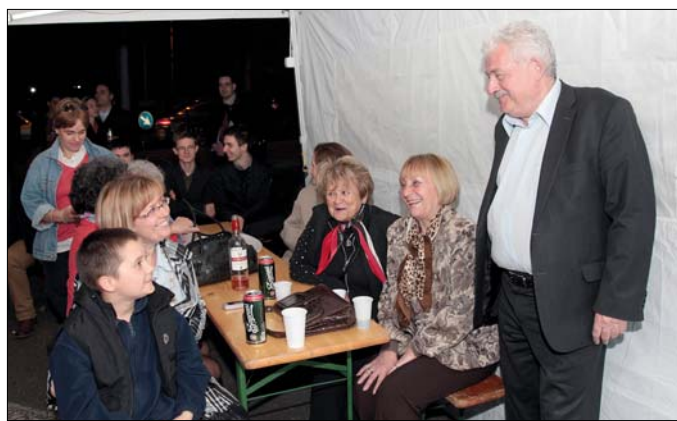
„Itt jó eredményt várnak az embertől”