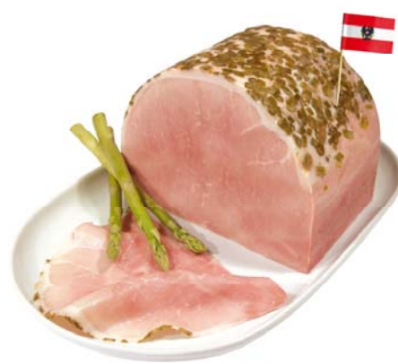
Osztrák spárgás főtt sonka