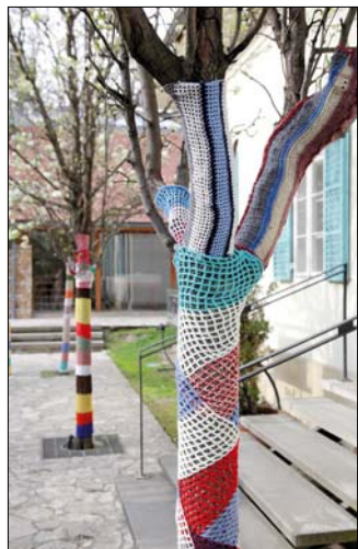
Feldíszített fa a kertben

ő sa óta készültek a nagy öltöztetésre a „vad horgolók”, akik március 26-ra feldíszítették a Barabás-villa fáit, sőt, még Barabás Miklós szobrára sem voltak restek sálat készíteni. A tízfős csapat a villa kulturális programjai-