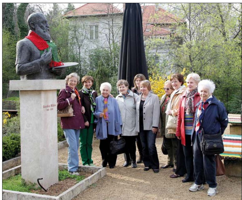
Barabás Miklós szobra sálat kapott a lelkes csapattól