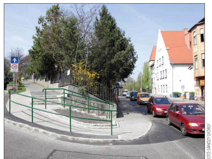
Rámpa a Városmajor és az Alma utca sarkán

Jelentős közlekedésbiztonsági beruházás zajlott a Normafa úti háziorvosi rendelőnél. Korábban az ide járó betegek és orvo-