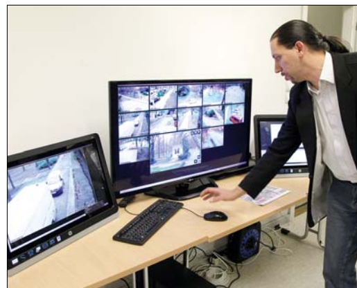
A Városmajorban már beváltak a kamerák