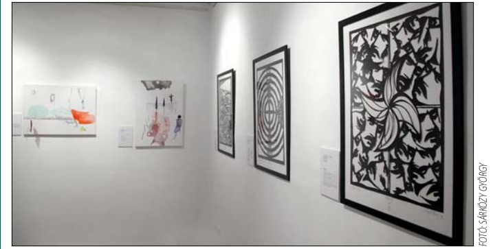
Vers és képzőművészet mágikus harmóniája jött létre