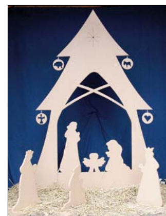
Kő Papír Olló Kreatív Labor

Az emléklapok mellett egy DVD-t is árvehettek a készítőik. Ezen a Hegyvidék Televízió riportja látható arról, hogyan zajlott karácsony előtt a betlehemépítés. Külön elismerés-