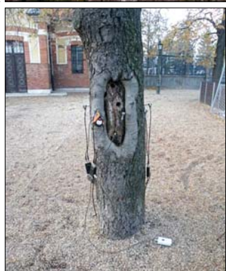
Műszerrel is megvizsgálták a fákat

Gyönyörűek a svábhegyi Diana park ősoleg vadgesztenyefái, akárcsak a tekintélyes méretű korai juhar-, nyugati ostorfa- és feketedió-példányok. A hatalmas fák közül azonban jó néhány állapota mára kritikussá vált, amire az önkormányzat által tavaly decemberben végzetett állapotfelmérés derített fényt.