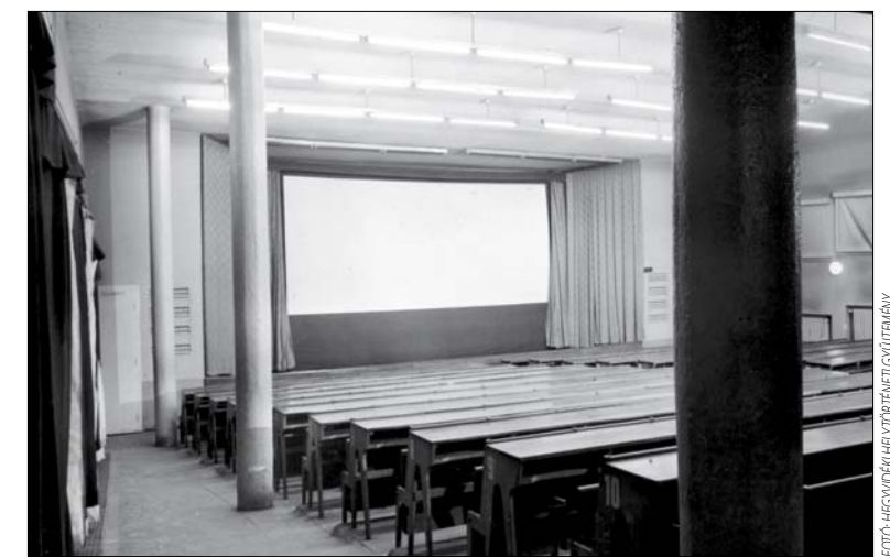
Előadóteremből alakították ki a nézőteret