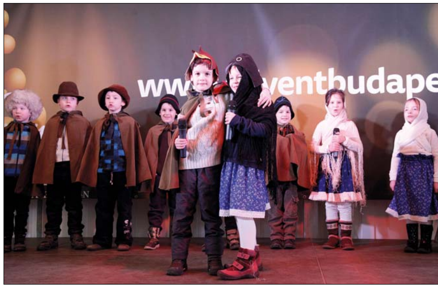
A Normafa Óvodába járó gyerekek a Téli ünnep című műsort adták elő a Városháza Parkban

A zené és a tánc volt a főszerep a Normafa Óvoda hagyományteremtő fellépésén is. A Süni vegyes csoport a Téli ünnep című műsorát adta elő a Városháza Parkban megrendezett adventi programsorozaton (ahol először szerepelt kerületi intézmény). Az Age of Hope Alapítvány szervezésében adománygyűjtő kampányt adott otthont a Városmajori Gimnázium. Az iskola aulájában kihelyezett hatalmas dobozok rekordidő alatt megteltek, az ajándékok nehéz körülmények között élő gyerekek karácsonyát tették boldogabbá. Nagy sikert aratott a Tamási Áron Általános Iskola és Német Két Tannyelvű Nemzetiségi Gimnázium Luca-napi vására is, amelynek közel hét-száz ezer forintos bevételét az egyik kerületi szociális intézménynek ajánlják fel.