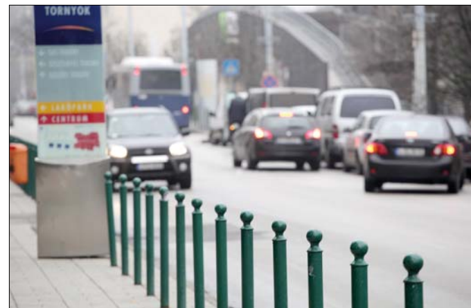
Az oszlopok a gyalogosokat is védik

Még tavaly év végén megkezdődött a Tusnádi utcai sérült se-