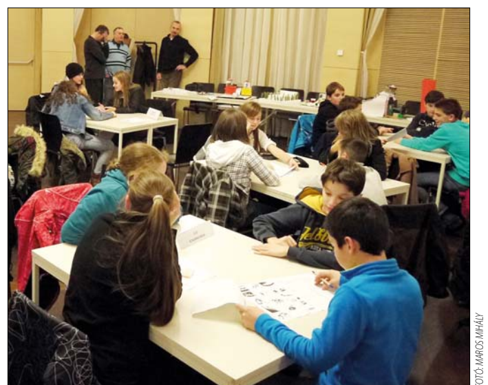
Képes fejtörő, totó, keresztrejtvény is szerepelt a feladatok közt

Nagy sikert aratott az alkalmi kiállítás, ezen az iskolákban készített, a téli olimpiák helyszíneit megörökítő makettek kaptak helyet. Ötletes alkotások születtek, a legizgalmasabb talán a Virányos Általános Iskola fúrógéppel működtetett sífelvonója volt. Az írásbeli teszten megszerzett pon-