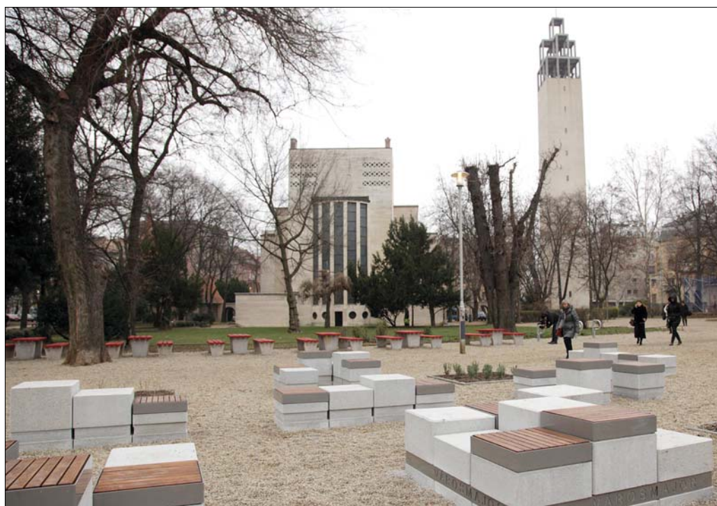
Szabadtéri fitnessgépeket, helyeztek ki, utcabútorokat cseréltek le a megújult városmajori parkban