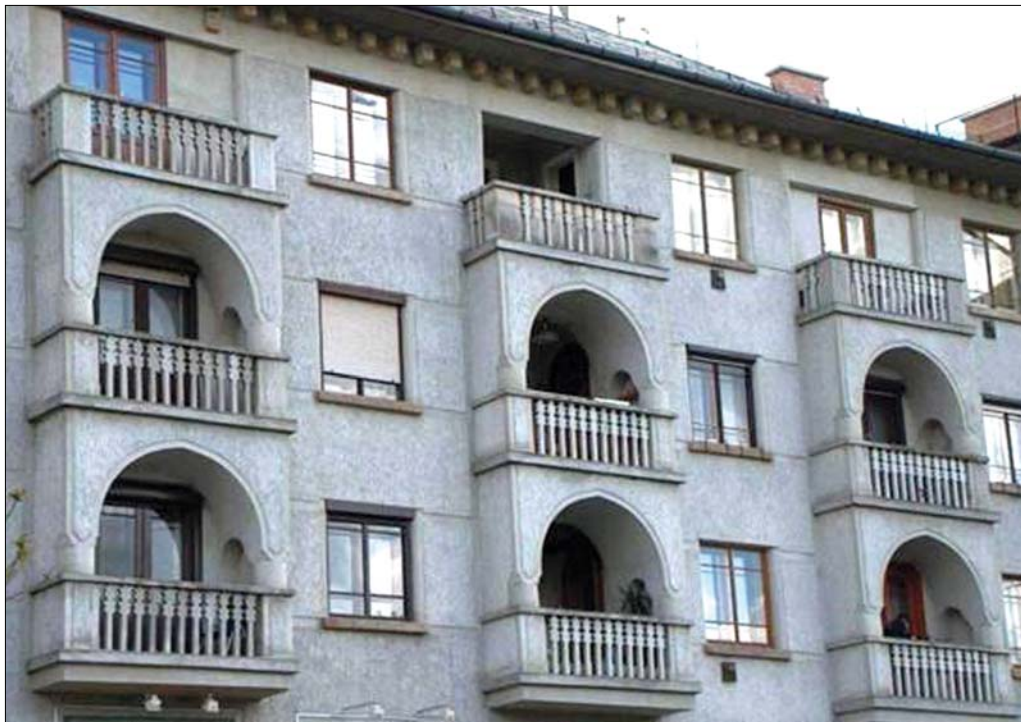
A homlokzatok jellegzetes elemei az íves záródású loggiák