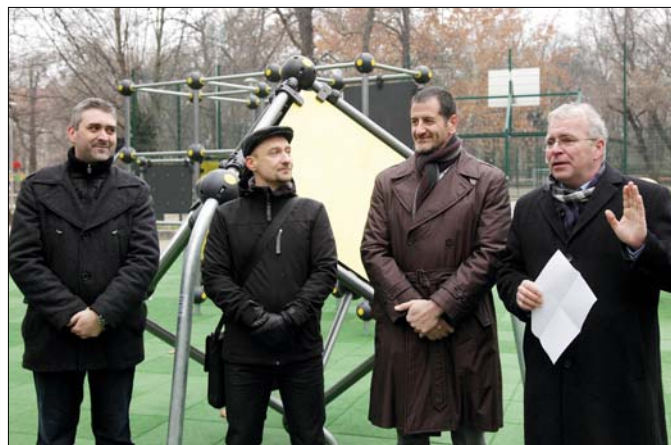
A fejlesztéseket a polgármester (jobbra) mutatta be a helyszínen

Az átdolgozott tervek alapján, a főváros 150, valamint a kerület 60 millió forintos hozzájárulásával fejlesztették a parkban a közvilágítást, harminchárom új kandélabert szereltek fel. Több helyen megújult a növényzet, utcabútorokat cseréltek le, teljesen átépült a templom mögötti „fogadótér”, továbbá új, zárt kutyafut-