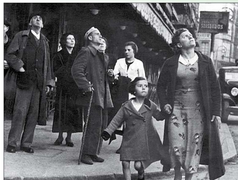
Bombardió (Bilbao, 1937)

Május 25-én reggel egy francia ezreddel gyalog indult el felderítőútra a laoszi határvidékre. Útközben a francia katonákat, a levegőt, kifosztott falvakat és a temetetlen halottakat fotózta. Miközben egy dombra kapaszkodott fel, hogy látképeket készítsen, taposóaknára lépett. Nemcsak híres fotói – mint például a D-nap, vagy A milicista halála – maradtak fenn utána, de ma már szinte közhelyként idézett mondata is: „Ha nem elég jók a képeid, nem voltál elég közel.”