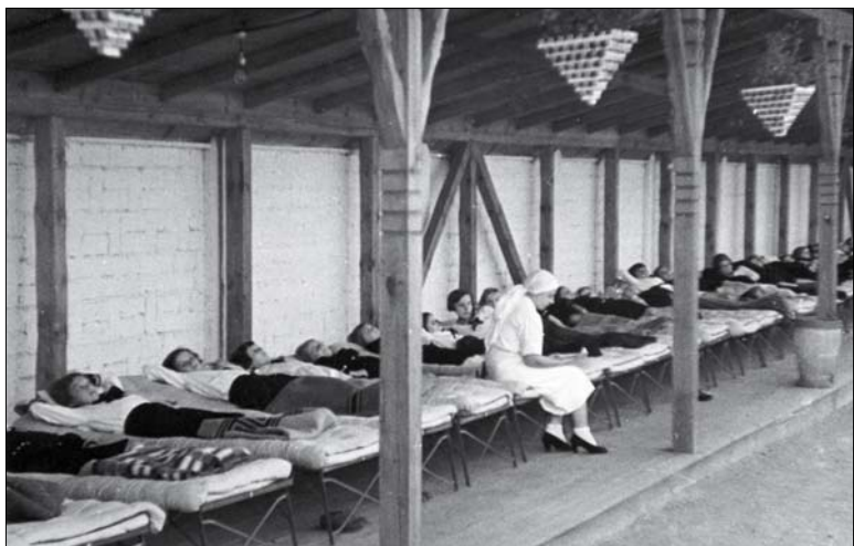
Gyenge testalkatú, betegségre hajlamos gyerekek jártak ide