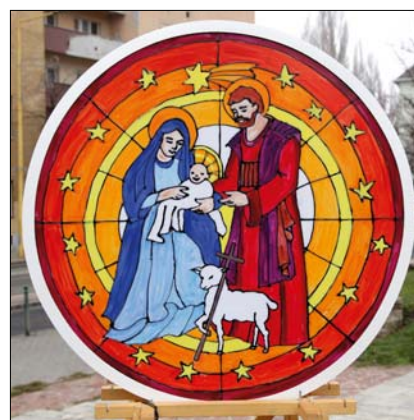
Budahegyvidéki Evangélikus Egyházközség