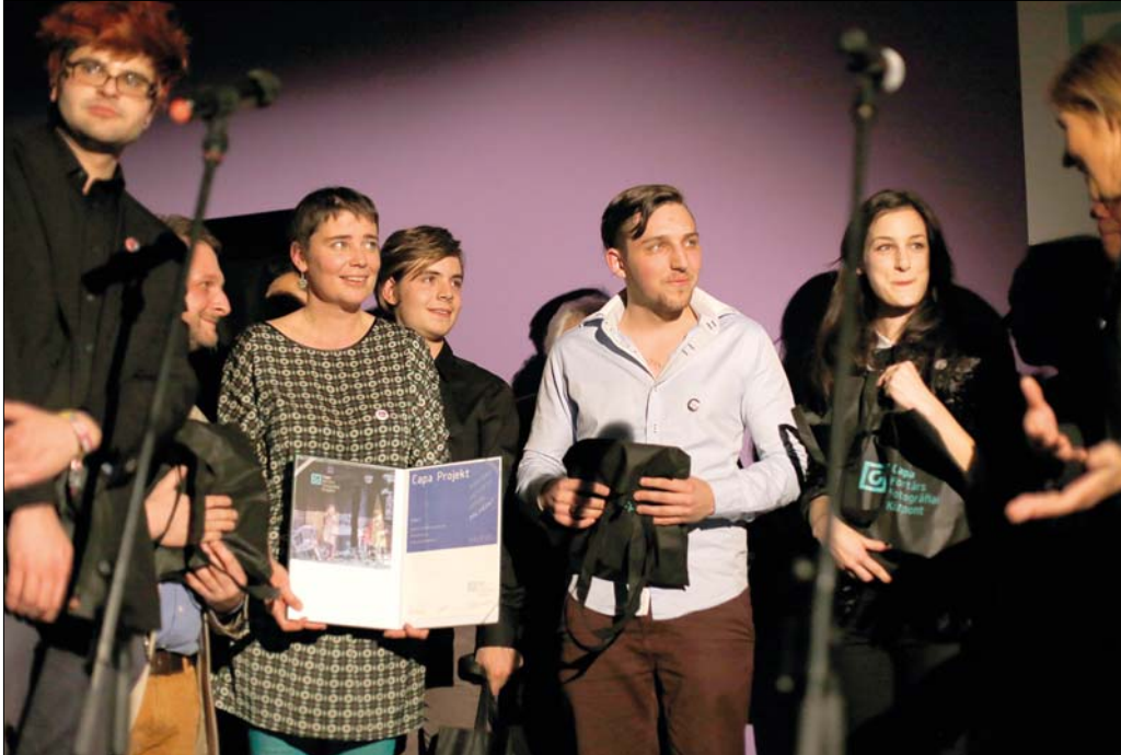
A győztesek a Robert Capa Kortárs Fotográfiai Központban vették át az első helyezettek járó díjat

Több mint ezer pályázó közül nyert a Budai Rajziskola csapata azon a versenyen, amelyet a decemberben felavatott budapesti Robert Capa Kortárs Fotográfiai Központ első pályázatára készített. A hét másodéves Öndívatbemutató című videoprojektje eszköztenül is látványos módon reflektál az emberi kiszolgáltatottságra.