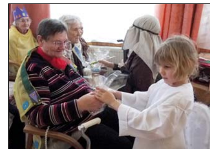
Ünnep a virányosi idősek otthonában