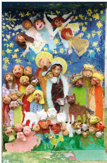
ELTE Gyakorló Általános Iskola

„A világ legismertebb történetét meséljük el a betlehemekkel gyermekeinknek és magunknak. A közös munka során azonban szeretettel és kapcsolatokat is létrehozunk, ami legalább annyira fontos, mint a betlehemi történet újból és újból való felidézése” – jelentette ki a kerület polgármestere az „Építsünk közösen betlehemet!” címmel meghirdetett prog-