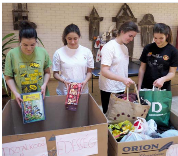
Hamar megteltek a dobozok a Városmajori Gimnáziumban