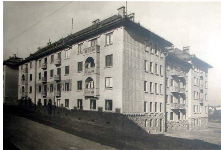
A Kiss János altábornagy utca 55–59. alatti bérházcsoport 1928–29-ben épült

Épületeként négy lépcsőház vezet fel az emeletekre. A lakások alapterülete 35–130 négyzetméter között változik. A lábazat a földszint magasságában rusztikus természetű burkolat, a felső szintek homlokzatfelületét változóan függőleges, ferde, halszállkás, rovátkolt díszítésű vakolat alkotja.