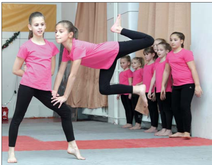
Versenysport és életforma egyben

A fitnesz és a showtánc versenysport, egyben életforma – hirdeti a Csollány Fitness SE. Az Arany János Általános Iskola és Gimnáziumban működő egyesület növendékei látványos galán mutatták be tudásukat.