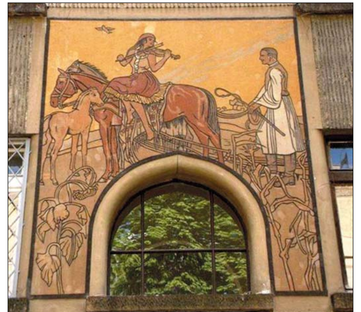
Az épületeket színes sgraffitók díszítik

ember szereti az egyszerűt, a világosat és a nyugodt komolyságot. Kevés szavú a nép igaz fia, férfiasan hallgat, de ha megszólal, értelmes és szabatos, vagy ragyogó világos, mint a Kelet költészete. Legyünk