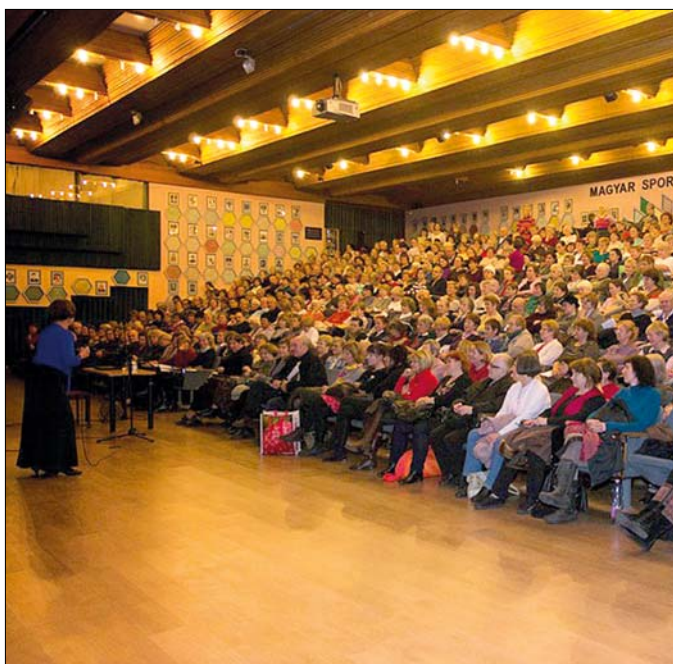
Már az 500-at is meghaladja a regisztrált hallgatók száma

meg is mozgatja hallgatóit, hiszen a fő cél nemcsak a szellemi, hanem a fizikai fitness tartás is. Épp ezért teniszestek, gyalogoltak, táncoltak, rendszeresen túráztak a résztvevők. A sportolási lehetőségek köre jelentősen bővül a második félévben, a felmért igényekhez igazodva. A következő szemeszter január 27-én 17 órakor indul, a nyitó előadást Vitray Tamás tartja a Testnevelési Egyetem aulájában. Február 3-án prof. dr. Papp Lajos szívsebész lesz az előadó. További információk: szenior.akademia@gmail.com.