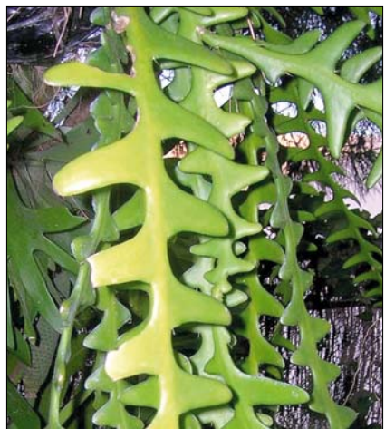
A szár veszi át a levelek funkcióját