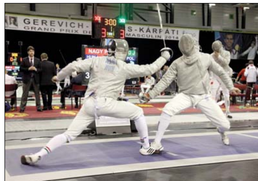
A legjobbak léptek pástra

Először, de remélhetőleg nem utoljára adott otthont a MOM Sport csarnok a Gerevich–Kovács–Kárpáti férfi kard Grand Prix selejtezőinek, valamint a 64-es tábla küzdelmeinek. A legnagyobb hagyományokkal rendelkező magyarországi vívónagydíjon – a név kötelez, hiszen Gerevich Aladár, Kovács Pál és Kárpáti Rudolf összesen tizenkilenc olimpiai aranyérmert nyert – a világranglista első tizenhat helyezettjéből tizenöt lépett pástra.