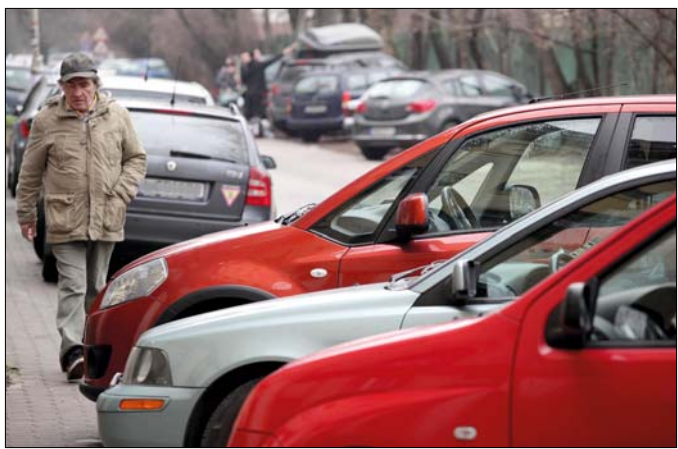
Az autóknak csak a megjelölt helyeken szabad felállni a járdára

Mindig van, aki megpróbálja, pedig nem éri meg trükközni a parkolással. A Hegyvidéki Közterület-felügyelet ugyanis a törvényben foglaltaknak megfelelően mérlegelés nélkül megbírságolja a tilosban álló, sok esetben a parkolási díjat megúszni akaró autósokat.