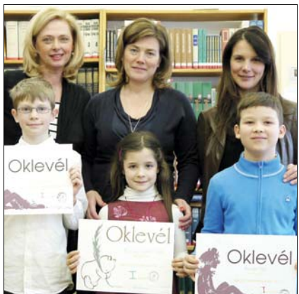
A győztesek és a zsűri