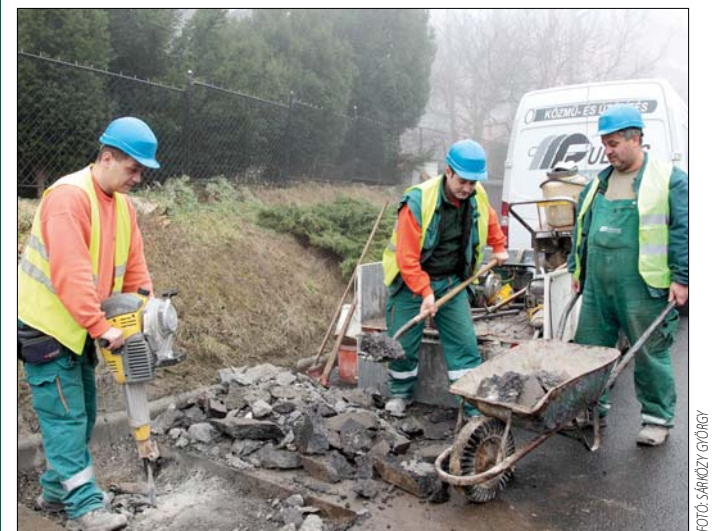
Munkálatok a Csipke úton

Áprilisban kezdődhet a több kilométernyi új csatorna kiépítése, ami már jelentősebb forgalomkorlátozással jár. A részletekről a kivitelező legalább egy hét-