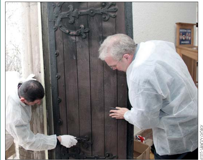
A kapu nem kapott lángra, de komoly javításra szorul

A fából készült kapu szerencsére nem kapott lángra, azonban a bejárat erősen bekormozódott, valamint leolvadt az ajtón lévő műanyag tájékoztató tábla. A helyreállítás során újra kell festeni az ajtó farészzeit és az acélpántokat, továbbá a bejárat környezetében le kell tisztítani a megfeketedett kőhomlokzatot. A javítási munkákban Pokorni Zoltán