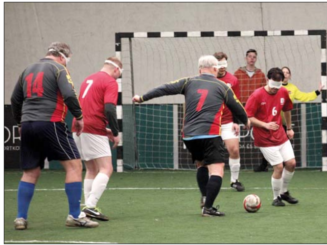
A LÁSS csapata (pirosban) egyre eredményesebb

A Látássérültek Szabadidős Sportegyesülete barátságos labdarúgó-mérkőzésre hívta a MALÉV-Old Boys öregfiúcsapatát. A MOM Sportban megrendezett, jó hangulatú összecsapáson egy góllal a vakfocisták győztek, bebizonyítva, hogy a sport képes eltüntetni az emberek közötti különbségeket.