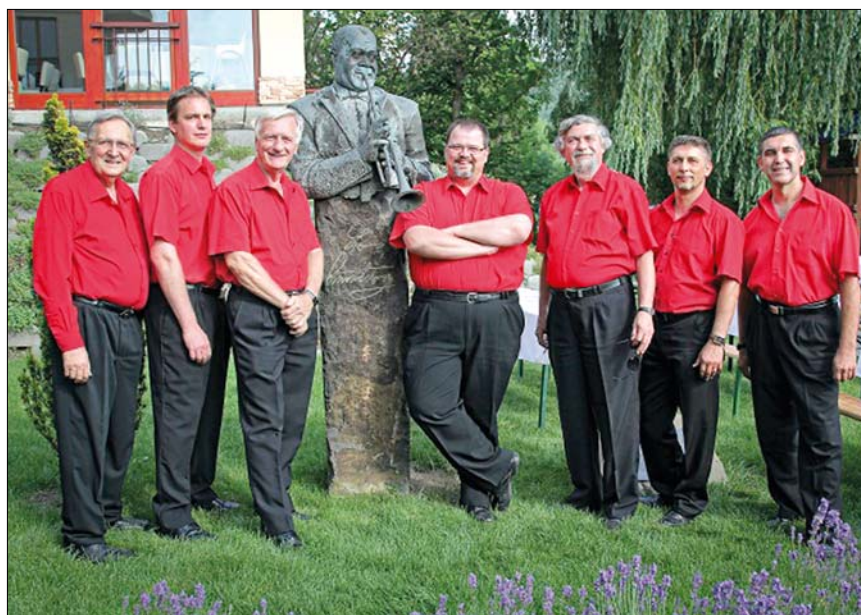
A Benkó Dixieland Band több mint ötven éve zenél a legmagasabb színvonalon