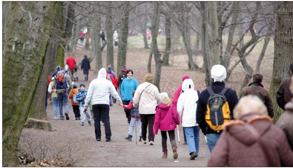
Még hidegben is sokan kirándulnak egy-egy hétvégén a Normafánál, így közös érdek, hogy rend legyen

A NOE-tagok fontosnak tartják, hogy a játszótér közelében