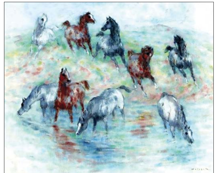
Expresszionista stílusban festett lovai összetéveszthetetlenek

Önkéntes, kitartó civilek, művésztároló amatőrök végezték el ezt az érdekes, időigényes tényfeltárási munkát, valamint az életmű jelentős hányadának hazahozatását. Fekete Klári és a többiek fáradhatatlanságának köszönhetően Holesch Dénes mára végérvényesen elfogadott lett Magyarorszá-