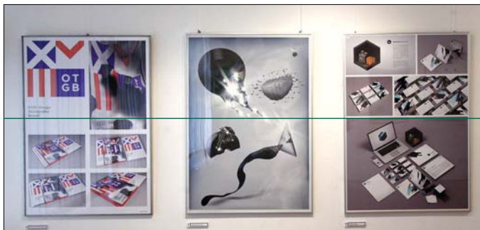
Több szempontból is jeles munkák láthatók a Hegyvidék Galériában