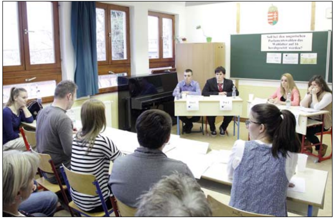
Jól felkészült diákok vitáztak a Goethe Intézet versenyén

„Ahhoz, hogy valaki szavazhasson, tisztában kell lennie az alapvető politikai fogalmakkal. A vetélkedő előtt készítettünk egy felmérést, és sokan nem tudták megmondani, mi az államfő feladata, jogköre. A legnagyobb probléma az, hogy egy fiatalok számára még a történelemórán sem kapja meg azokat az információkat, amelyek szükségesek ahhoz, hogy dönten tudjon, tessen azt, liberális vagy konzervatív pártra szavazzon. A francia felvilágosodásról is csak a gimnázium utolsó