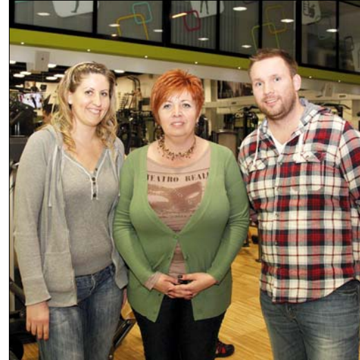
A három szerencsés „átalakuló”

ból a három jelentkező minőségi táplálékkiegészítőket is kapott, amelyek hozzájárulnak a még jobb eredmény eléréséhez, valamint ajándékba egy-egy MOM Sport Fitdress szettet (egy kapucnis felsőt, egy szabadidőnadrágot és egy pólót), amelyben kényelmesen tudnak edzeni.