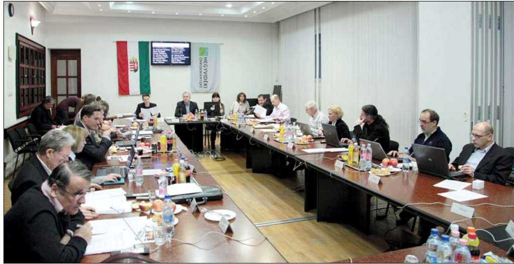
Az önkormányzati képviselő-testület legutóbbi ülésén elfogadta az idei költségvetési rendeletet

„Takarékosan, fegyelmezetten gazdálkodunk, ezt igazolja, hogy a működésünk során megtakarított háromszázharmincötmillió forintot is az önkormányzati vagyongyarapításra tudjuk fordítani” – mondta el a polgármester a 2014. évi költségvetés főbb számai kapcsán az önkormányzati képviselő-testület legutóbbi ülésén. Pokorni Zoltán kiemelte, hogy út- és járdafelújításra az idén közel 700 millió forintot költenek, emellett az intézményfejlesztésekre is jelentős összegeket fordítanak. Az Arany János iskola tetőszerkezetének rekonstrukciójára 125 millió, a Tamási Áron iskola bővítésére 145 millió forintot különítenek el, és a hegyvidéki térfelügyelő kamerák számát is növelnék összesen 50 millió forintból.