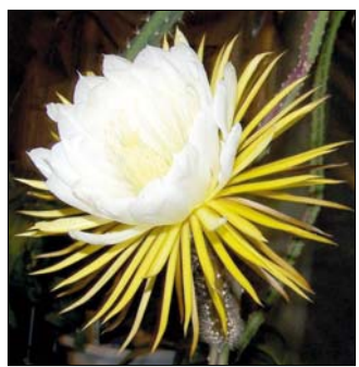
Virága kifejezetten nagy méretű

A rendszertanában azért szeretgázó csoport a külsején kívül