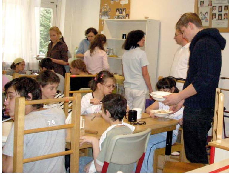
A tizenegyedikesek segítettek a petős gyerekek napi ellátásában

„Első alkalommal májusban mentünk az intézetbe, tavaly azonban áttettük az időpontot a második félév elejére, így nem kell attól tartani, hogy az önkéntes munka miatt tanulónk lemaradnak a tananyaggal –