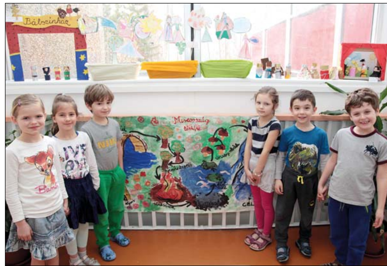
Meseország térképét is megrajzolták a gyerekek

zösségének javaslatára a kerületi pedagógusok rendszeresen figyelemmel kísérik egymás óvodáit, a Mesevár-hét alkalmából hegyvidéki óvónók látogattak el az intézménybe tapasztalatszerzés és ötletgyűjtés céljából. A programot bemutató szakmai előadás után mindenki elmondta, milyen játékok, aktivitások serkentő feladatokkal teszi izgalmasabbá csoportja mindennapjait. A beszélgetés során szóba kerül-