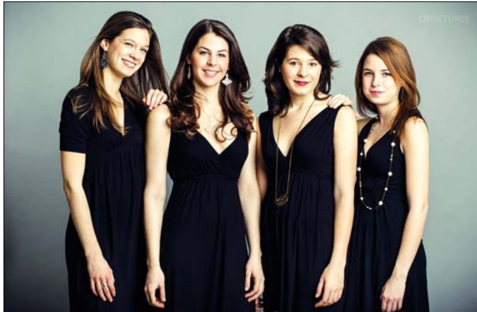
A „Fölszállott a páva” március 22-i elődöntőjében láthatjuk őket

dern emberétől. A hagyomány őrzése számukra már a hétköznapi élet része. A Csercsellel a televíziós vetélkedő után egy héttel, március 29-én az Országos Táncháztalálkozó és Kirakodóvásáron, a Papp László Budapest Sportarénában találkozhatunk. Erre az eseményre jelenik meg a „Táncháztalálkozó 2014” lemez, amelyen az együttes is hallható lesz.