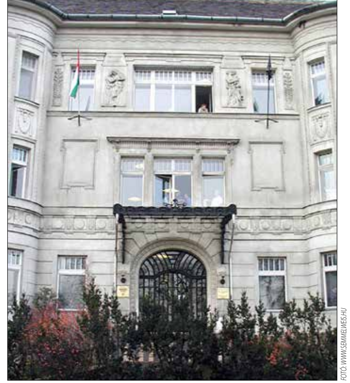
Érdekes gyönyörködni a részletképzések szépségében

A 20. század fordulóján a kellemes környezetű, a legmoder-