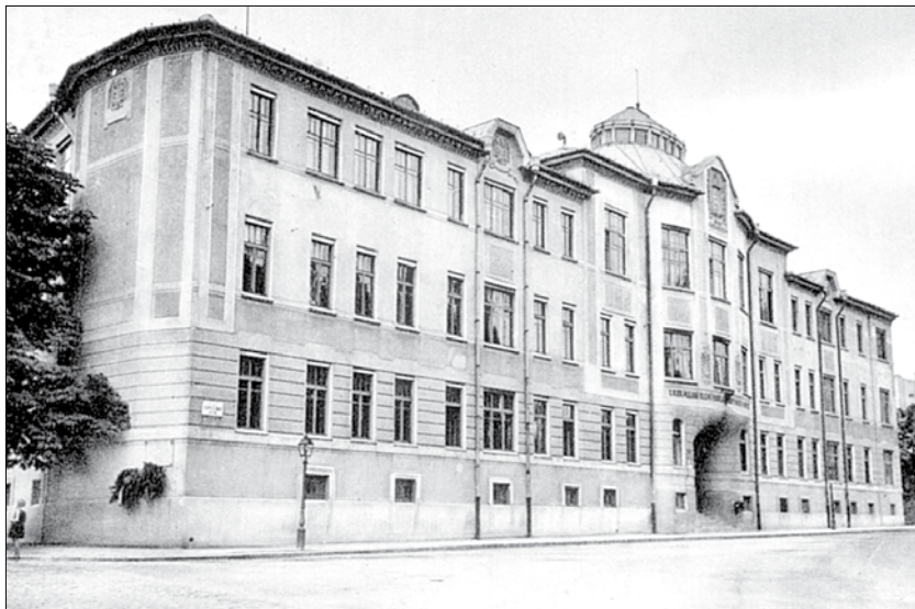
A tanítóképző épülete a második világháború előtt, tetején a csillagvizsgálóval

A tanítóképző 1959-ben felsőfokú (akadémiai) intézménnyé vált, az általános iskola