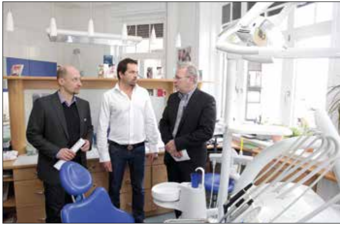
Megszépültek a helyiségek, és az orvosok új műszereket szereztek be

A Hegyvidéki Önkormányzat a fogorvosokkal együttműködve megújította a Mészáros utcában működő felnőtt fogászatot. Az önkormányzat 8 millió forintos hozzájárulásából kicserélték az ablakokat, felújították a beltéri nyílászárókat, rendbe tették az ügyfelek által használt vizesblokkot, továbbá elvégezték a bojler és a kazán cseréjét, a fűtés korszerűsítését, valamint egy kompresszor áthelyezését és szervizelését.