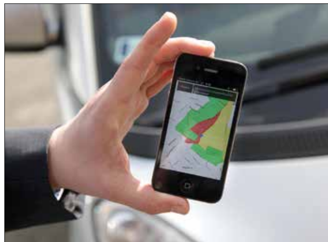
Térképen is megtekinthetők a parkolási zónák