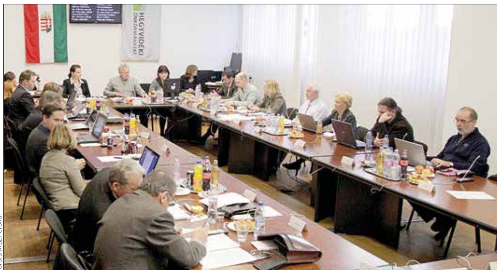
Munkában a képviselő-testület

nyosságból megállapítható közgyógyellátás köréből, az elmúlt évekhez hasonlóan a nyugdíj-emeléssel arányosan (2,4%-kal) megemelték az egyes jövedelmi sávokra vonatkozó jogosultsági értékhatarokat. A 85 és 100 év