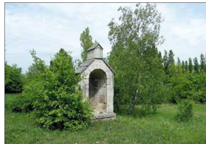
A szinte teljesen ismeretlen csillebérci kápolna