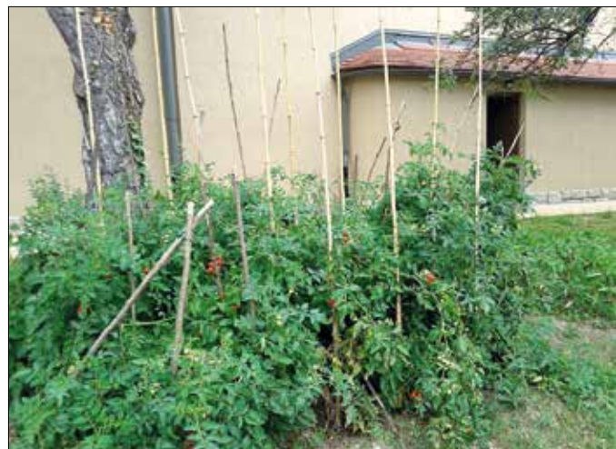
Paradicsom a templomkertben

ófalui közösségi kert, amely a 250 éves fennállását ünneplő Szent József-plébánia, egy helyi egyesület és az önkormányzat közös kezdeményezésére alakult át. A területet a plébánia közösségi háza biztosítja, ahol a jelentkezők együtt végzik a kertészeti feladatokat. A munkálatokat