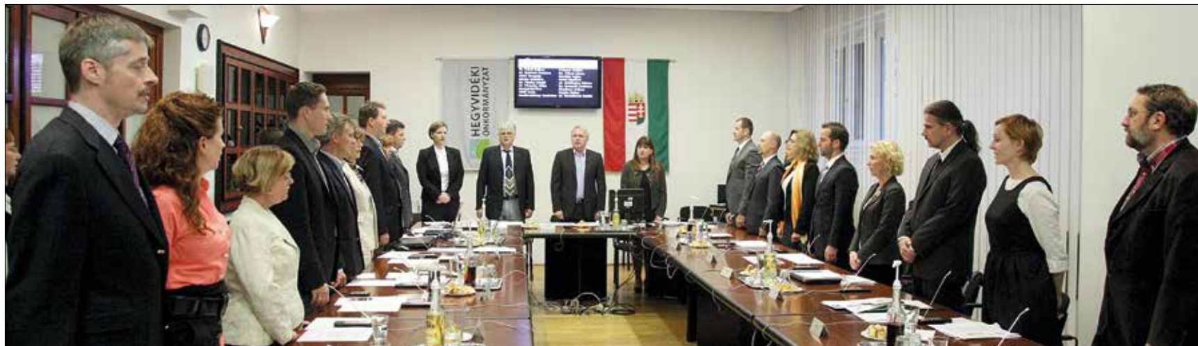
A képviselő-testület ünnepélyes eskütétele