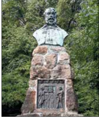
Tóth István készítette a szobrot

Kossuth Lajos száműzetésben hunyt el 1894 márciusában Olaszországban. Amikor a halálhíre Budapestre ért, azonnal lázás szervezkedésbe kezdtek különbö-