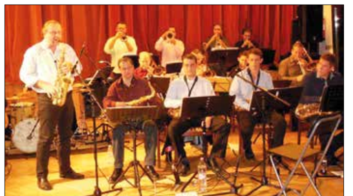
Jazzmánia Big Band

mestere, Count Basie művészetét tisztelgette, a zenekari számok közt a Basie band leghíresebb dalai és hangszerelei szívesen hangzottak el a legkitűnőbb tolmácsolásban. Ahogy azok a fúvósok, az öt szaxofon, a négy trom-