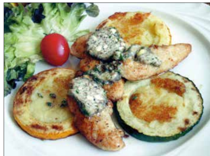
Csirkemellszeletek vargányás fűszervajjal