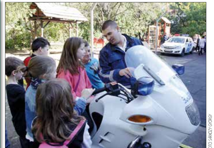
A rendőrmotorok mindig sikere van

Jutott idő az oktatásra is: a katasztrófavédelem munkatársai