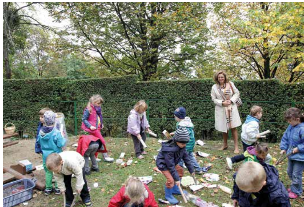
A környezettudatosságot az óvodákban lehet megtanulni

Hozzátette, a kerületi óvodák a gyakorlatban maradéktalanul megvalósuló pedagógiai programjaikban kiemelt hangsúlyt helyeznek a környezettudatosságra, a természet tiszteltetésére nevelésre. „Ezeket az értékeket az óvodában lehet és kell megalapozni, ahogyan ezt a hegyvidéki intézményekben teszik” – emelte ki Fonti Krisztina, aki ezután a természetvédelemről beszélgetett a gyere-