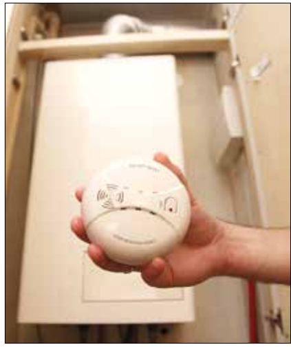
A mérges gázt észlelő készülék életet menthet

A múlt évben 131 szén-monoxid-mérgezéssel kapcsolatos esethez kellett kivonulniuk a Fővárosi Katasztrófavédelmi Igazgatóság tűzoltóinak, akik hatvanhárom embert állapítottak meg mérgezésben. Az idén szeptember óta hatan – köztük egy gyermek – kerültek kórházba a mérges gáz belélegzése miatt, egy ember pedig meghalt. Holott a biztonsági előírások betartásával, valamint a szükséges óvintézkedések megtételével elkerülhető lenne a tragédia.