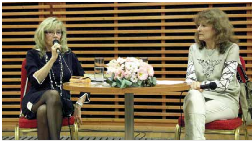
„Vitt a sors. Mindig nagyon komolyan vettem a munkámat”

Ez nem Huszti Péter-, hanem Piros Ildikó-est! – szölt közbe nevetve Piros Ildikó, amikor Kondor Katalin épp azt mesélte, hogy a legutóbbi találkozásukkor megkérte Pétert, hozzon egyet a feleségével készült közös lemezükből, de akkor azt a választ kapta, hogy az otthon sincs meg nekik. Szerencsére a színművész talált egyet, így az Ismeretlen ismerősök című beszélgetésen a Barabás Villa közönsége is belehallgathatott a dalokba.