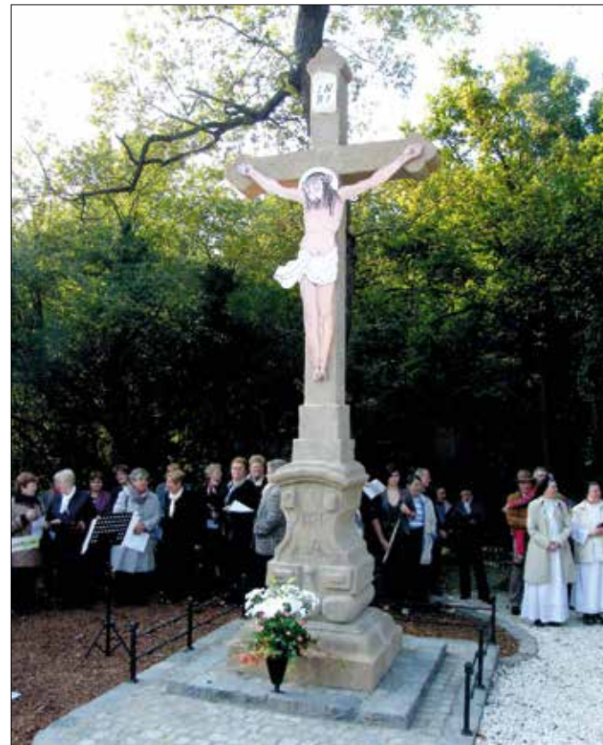
A felújított kereszt a megszenteléskor

feleségétől tudta meg, hogy a gyermek vele ment a szekérre. A didergő és éhes fiúra késő este találtak rá a keresésére induló családtagok. A viszontlátás öröme