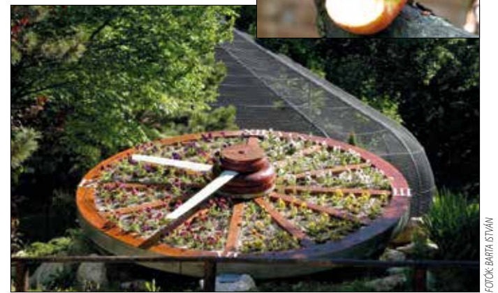
A látogatók kedvencei közül kettő: a mókus és a virágóra