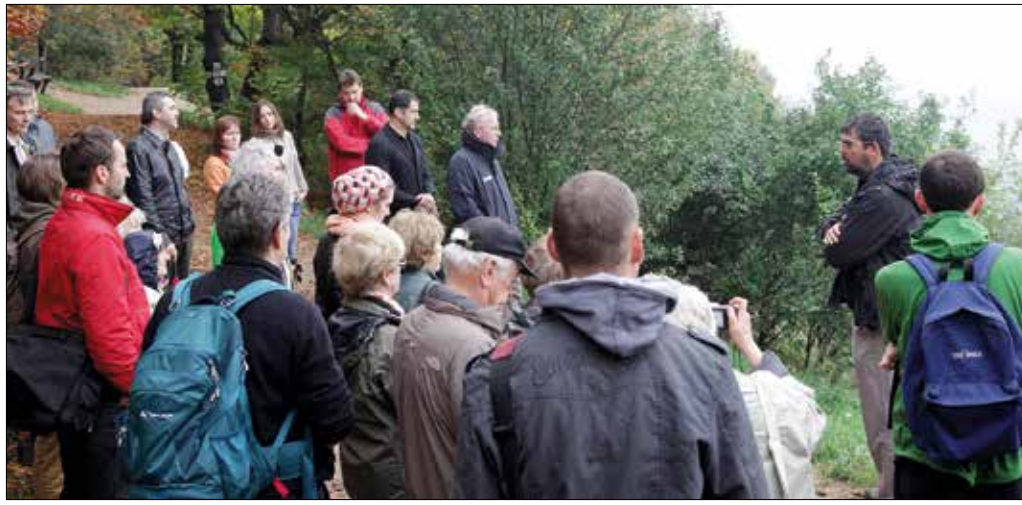
„Nehéz, sőt néha lehetetlen igazságot tenni a Normafát használók között”