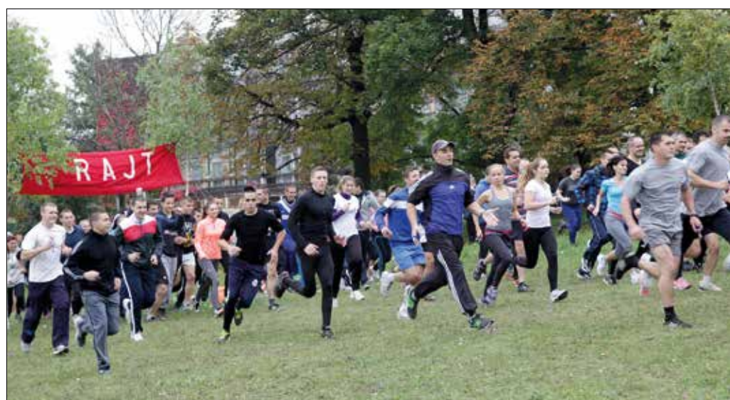
Az idén 212 futó teljesítette az öt kilométeres távot

Szent György SE ügyvezető elnöke. – Egy régi mondás szerint a láb mindig kéznél van, csak könnyű, sportos öltözék meg egy jó futócipő szükséges, és bárki lefuthatja, vagy lesétálhatja a távot. Ennek köszönhetően a résztvevők évente legalább kétszer pontos képet kap-