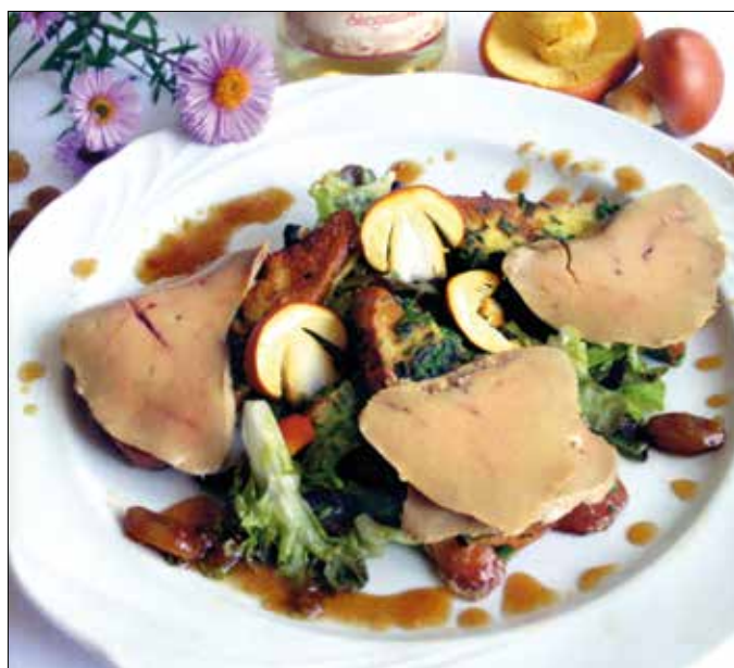
Nem csak inyenceknek: császárzalóca és libajava

Tálaláskor a cukkinihengereket, tányérra ültetve, megtöltjük a gombasalátával. Dízíthetjük néhány szem félbevágott koktélpáradicsommal és kaporral.