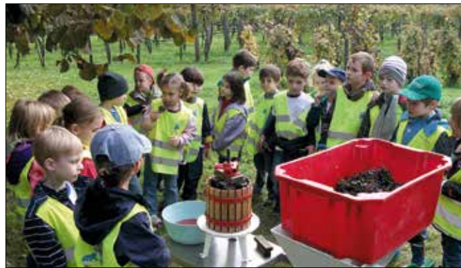
A gyerekek saját kezűleg dolgozhattak fel a szőlőfürtöket

„Zöld» óvodaként kiemelt figyelmet fordítunk a környezettudatos nevelésre, aminek része a növények megismertetése a gyerekekkel. Így találtunk rá a Sós István Borászati Szakközépiskola és Szakiskola tangazdaságára, ahol a szőlőről, valamint a szőlőfeldolgozásáról tudtak meg érde-