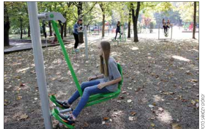
Profik és amatőrök is használhatják

Az edzőgépek – a Margareta parkban lévő kivételével – a sőtétedés után zárt játszótéren kívül kaptak helyet. Így az esti kocogás közben, vagy akár reggel sem kell lemondania senkinek a