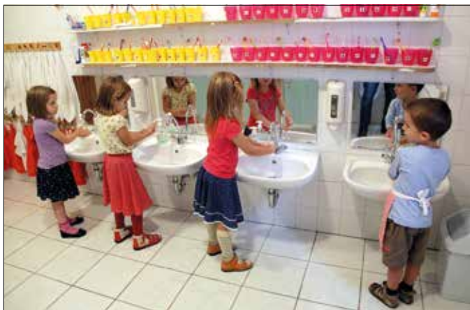
Már az óvodások is tudják, nem mindegy, hogyan mosunk kezet

A kéz egyetlen négyzetcentiméterén akár tízmillió baktérium is megtelepedhet. Ezért fontos a rendszeres és megfelelő kézmosás, hiszen a piszkos kéz számos betegség közvetítője lehet: a statisztikák szerint a világban évente közel hárommillió gyermek hal meg az elégtelen higiénia miatt. Erre hívja fel a figyelmet a kézmosás világnapja, amelynek nem véletlenül őszi az időpontja (október 15.), hiszen ilyentéjt kezdődik az influenzaszезon, márpedig a betegség terjedését jelentősen csökkenti a megfelelő tisztálkodás.