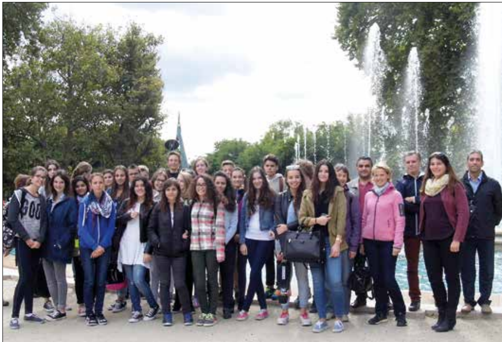
Tartalmasan töltötték el a rendelkezésükre álló egy hetet a francia, német, török és magyar diákok

A Sashegyi Arany János Általános Iskola és Gimnázium 2013 óta vesz részt a „Mens sana in corpore sano” (Ép testben ép lélek) elnevezésű, kilenc ország közeli ezer diákját összefogó Multilaterális Comenius projektben. Ennek célja a többi között az egészséges életmód népszerűsítése a diákok körében, ahogyan alkalmas arra is, hogy a gyerekek megismerjék egymás kultúráját, a gyakorlatban tapasztalják meg a tolerancia fontosságát. Mindemellett a program hozzájárul a közoktatás minőségének javításához, erősíti annak európai dimenzióját, kiemelten segíti a multikulturális környezetben történő tanulást, a hátrányos helyzetű társadalmi csoportokat, valamint az iskolai leszakadás elleni harcot. Az Arany János iskola 2015 nyaráig Csehország, Dánia, Franciaország, Németország, Norvégia, Spanyolország, Svédország és Törökország egy-egy iskolájával tartja a kapcsolatot. A programban részt vevő intézmények diákjai látogatást tesznek