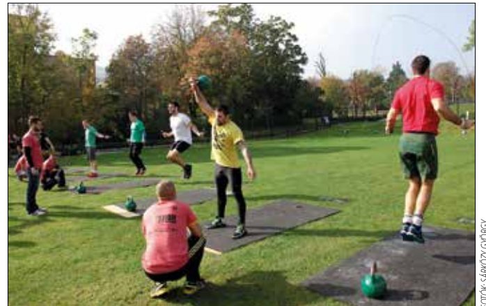
Sokféle mozgásforma közül választhattak a résztvevők