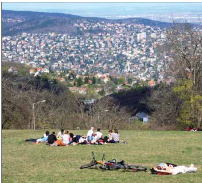
Kiváló adottságokkal rendelkezik a terület

– A Natura 2000 határbebecsítés egy neves szakemberekből álló csapat készítette el. Megítélésünk szerint az anyag leíró része nagyon alapos, minőségi munka, elvben komoly szakmai háttérrel biztosít a tervezett beruházási elemek hatásának megítéléséhez. Ugyanakkor a tanulmány következtetései ehhez képest néhol túlzottan megengedők. Nagy örömmünkre szolgált Pokorni Zoltán polgármester új bejelentése, hogy a terület nem kíván élni a tanulmányban megfogalmazott lehetőségekkel, hanem saját döntésük szerint elvetik a tervezett fejlesztés legkevesebbé környezetbarát elemeit, köztük a hógyűzést, alpesi jellegű sípályarendszert, vagy a nyári bobpályát, és helyette a természetvédelmi rehabilitáció kerül a középpontba.