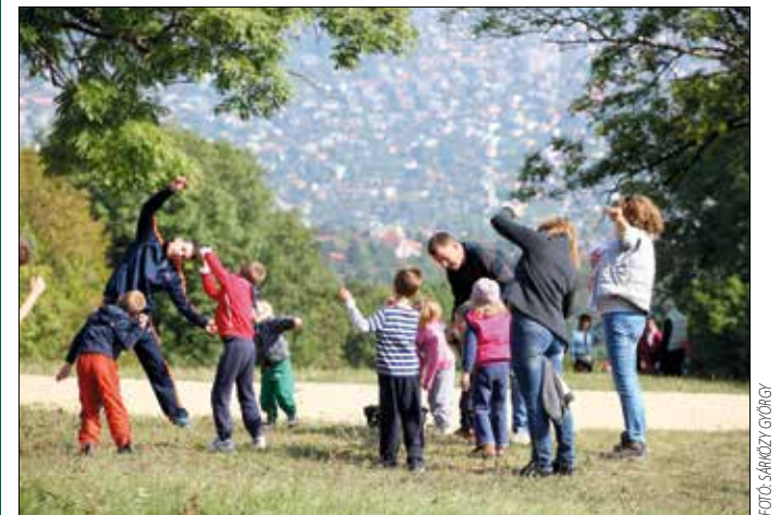
Fontos, hogy mind a négy évszakban mozogni, sportolni lehessen