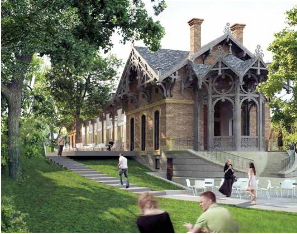
Az egykori lóvasút-végállomás felújítás utáni állapotának látványképe