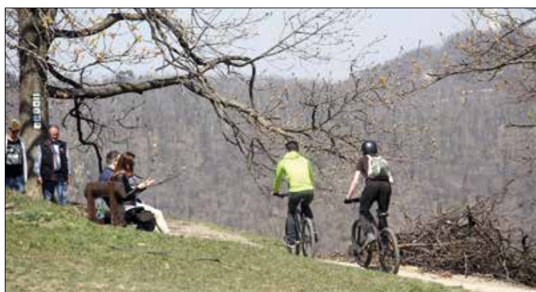
A Normafa a legfontosabb hegyvidéki pihenő- és rekreációs környezet