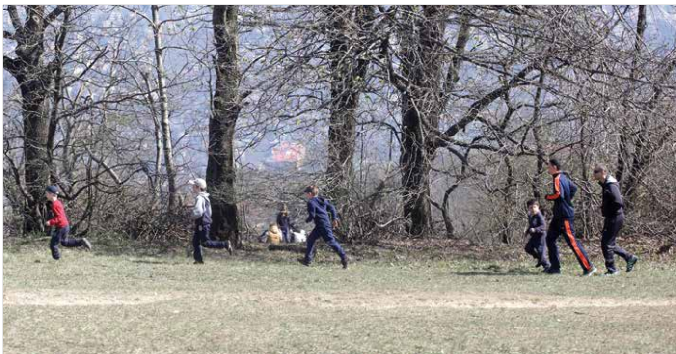
Okos kompromisszumokkal egymást erősítheti a turisztikai és a természetvédelmi szempontú rehabilitáció