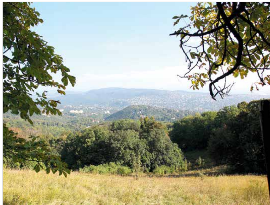
A Natura 2000-es határvizsgálat során feltérképezték a terület legjelentősebb élőhelyeit

– Az, hogy az elmúlt évtizedekben egyre közelebb húzódtott hozzá a város, továbbá a fajgazdagságot veszélyeztető, kedvezőtlen folyamatok vették kezdetüket. A Normafa sokkal nyíltabb terület volt egy évszázaddal ezelőtt: a rétek, kaszálók közt csak kisebb erdőfoltok húzódtak. Mára gyakorlatilag megfordult az arány, a korábbi rétek elcsérsedtek, beerdősültek, emiatt pedig vesztesen megfogyatkozott számos védett növény és állatfaj egyedeinek száma.