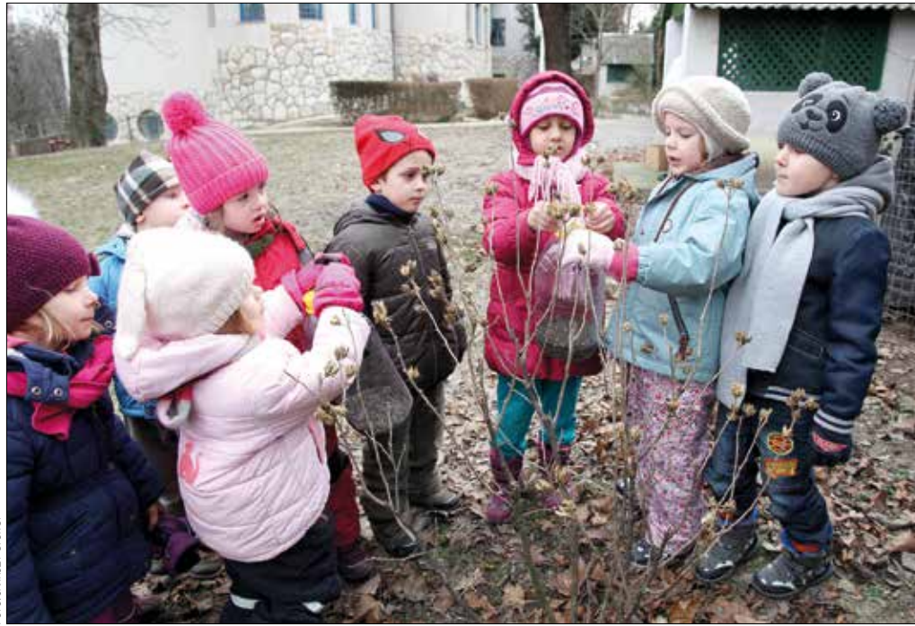
A „Zöld óvodák” elősegítik, hogy a gyerekek maguk fedezzék fel természeti környezetüket

emberi környezetüket, ezek tárgyait és jelenségeit. A környezetismereti neveléssel alakítjuk ki bennük a kulturált élet szokásait, az elfogadott viselkedési formákat, az érzelmi és erkölcsi viszonyokat. Ennek segítségével közvetítjük az egyetemes és