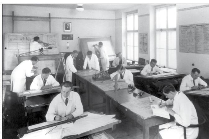
Világszínvonalú munka folyt a világhírű üzembn