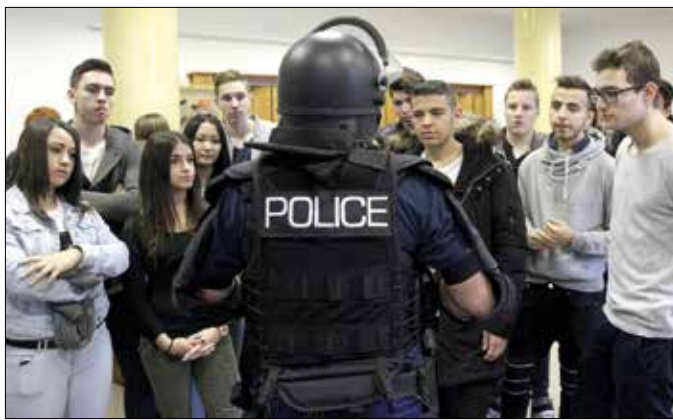
Meglepő módon nem csak a fiúk érdeklődnek a rendőri munka iránt

Ez utóbbi lehetőséggel főként a fiúk éltek, ugyanakkor a tömegoszlathoz használt védőfelszerelés a lányok fantáziáját is meg-