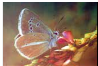
Megmenekülhet a csikos boglárka

A polgármester hangsúlyozta, a most közzétett hatásvizsgálat nem az önkormányzat konkrét, a Normafa fejlesztését célzó terveit tartalmazza, hanem a törvényben megfogalmazott lehetőségeket vizsgálja abból a szempontból, hogy milyen hatással bírnának a környezetre a különböző elemek. Kitért rá, hogy a dokumentumban minden olyan lehetőséget megvizsgáltak, amit a törvény lehetővé tett volna – mint például egy hosszú, új szakaszokkal bővülő, ülőlifttel kiszolgált sípálya, nyári bobbpálya, valamint egy új libegő építése –, azonban az elmúlt másfél év egyeztetései és a