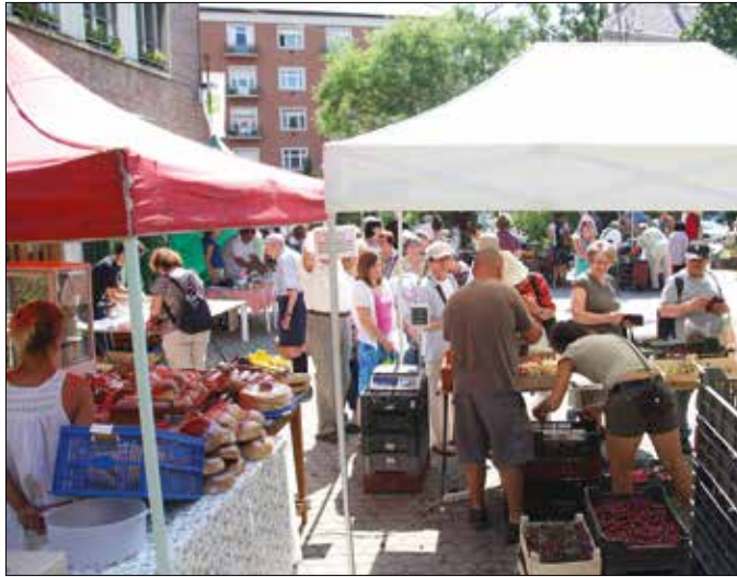
Keddenként továbbra is a polgármesteri hivatal mellett zajlik az árusítás

kormányzat tervei szerint a közeljövőben újabb helyszínnel bővülne a hegyvidéki termelői piac, de a megfelelő helyről és árusítási napról egyelőre még nem született döntés. A városmajori templomnál, a plébánia területén működő piac szervezője változatlanul a Szövetség az Élő Tiszáért Egyesület, amelynek tagjai hét-