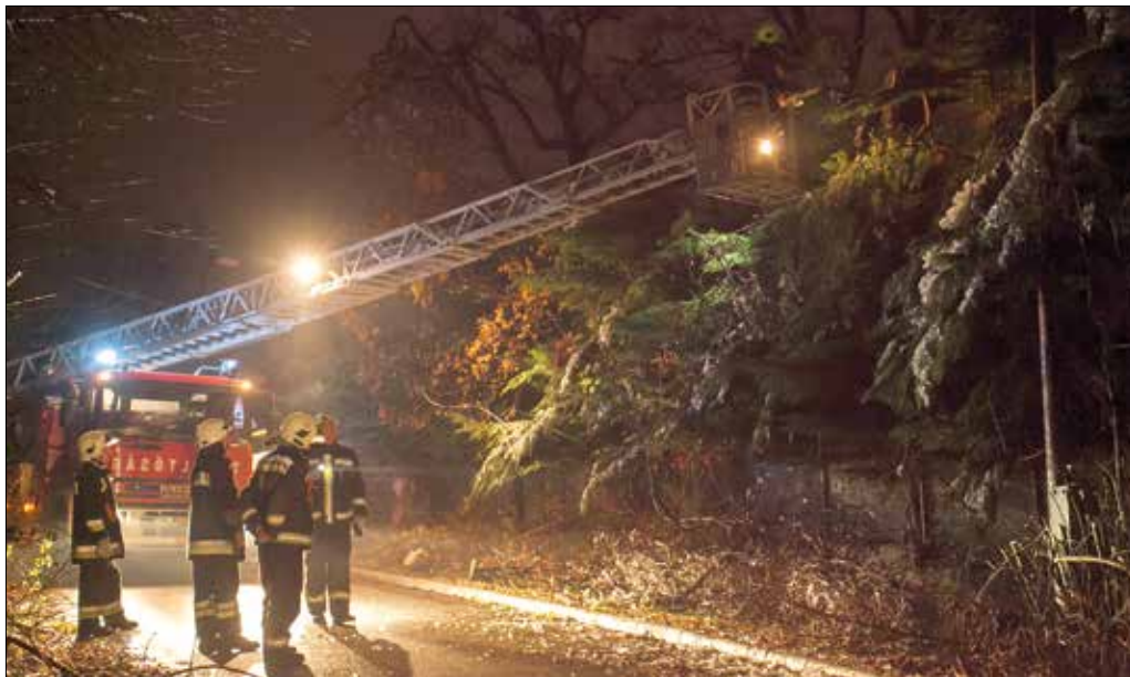
Összesen több mint hatszáz káresethez riasztották a tűzoltókat december első napjaiban