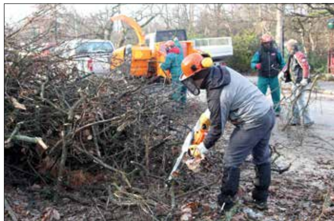
Az utak mentén lévő rönköket, ágakat a szakemberek felaprítják...

Az utak mentén felhalmozott nagyobb rönköket elszállítják, míg a kisebb darabokat felaprítják, az aprítékot pedig elterítik a talajon. Az igazgató hangsúlyozta: nem tervezik a teljes erdőterület megtisztítását, a turistaforga-