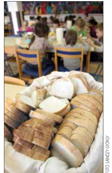
A kerületi iskolákban nem fehér kenyér kerül az asztalokra

A diétetikusi megjegyezte, hogy a szolgáltatók számára plusz költséget jelent a közétkeztetési szabályok szigorítása, ám a legfontosabb mégis az – tette hozzá –, hogy az új szabályozás jó hatással lehet az emberek egészségére. Szólt arról, hogy az elmúlt pár évben riasztóan megemelkedett a 2-es típusú cukorbetegség száma: míg korábban jellemzően az 50-60 éveseknél jelentkezett ez a betegség, ma már többnyire a 30-as korosztály kénytelen szembeülni azzal, hogy diabéteszes. Ez az egészségtelen életmódra vezethető vissza, a fiatalok egyre kevesebbet mozognak, továbbá az étrendjükben mind nagyobb arányban fordulnak elő a fehér lisztből készült termékek, míg zöldséget, gyümölcsöt alig fogyasztanak.