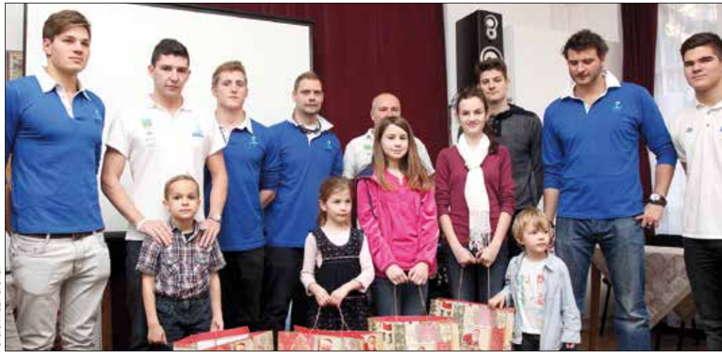
A Hegyvidék-YBL WPC vízilabdacsapat tagjai minden évben megajándékoznak rászorulókat