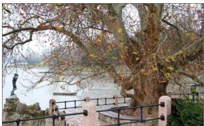
A tatai platán csemeterében került ide, most 232 éves

A két program célja kissé eltérő. Mindkettő a velünk élő fákra kívánja felhívni a figyelmet, de az erdészek az országban élő fajokokat mutatják be, míg a másik szavazáson a valamilyen szempontból különleges egyedeket versenyeztetik. A jelölést követően egy zsűri választja ki a tizenöt döntőt, közülük a közönség szavazatai alapján dől el, melyik az aktuálisan legértékesebb fa.