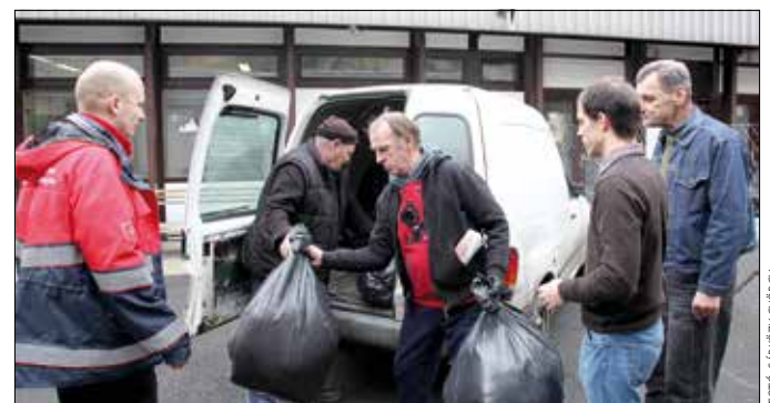
Nagy segítséget jelentenek a hegyvidékiek által gyűjtött adományok

A kirándulók biztonsága érdekében egy hónapon át nem volt látogatható a Normafa, január elejére azonban az utak döntő