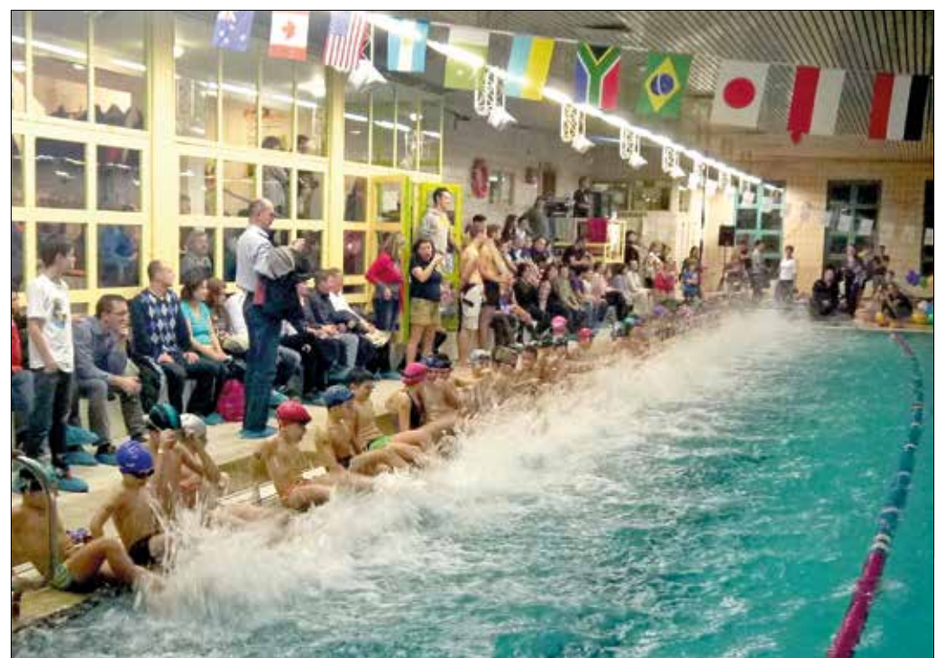
Két napon át pezsgett a víz az uszodában, háromszáz gyermek vett részt a programokon

■ További információk: www.hegyvidekharcosai.hu .