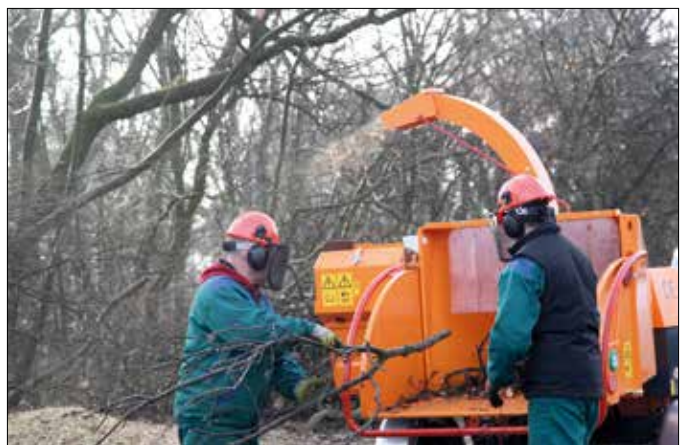
...az aprítékot pedig elterítik a talajon