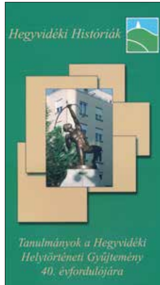
Az új kiadvány címlapja

inkább, mert az ostrommal kapcsolatos döntések mégiscsak ezekben az épületekben születtek, s mert az ezekkel kapcsolatos adatok értékelése révén kiigazítható a szakirodalom néhány korábbi tévedése.