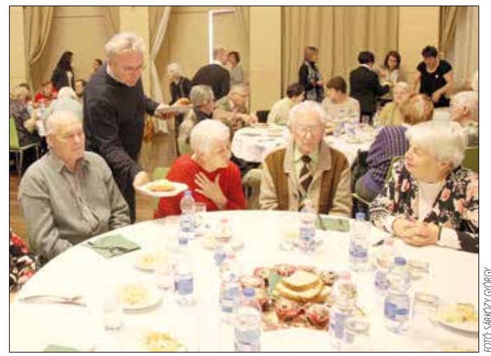
Ünnepi különlegesség: a polgármester szervezte az ételeket

„Fontos, hogy megadjuk a módját ennek az alkalomnak. Nemcsak az étel számít, hanem az is, hogy találkozhatunk egymással, asztalhoz ülhetünk, beszélgethetünk. A magány a karácsony időszakában még fájdalmasabb azoknak az időseknek, akik egyedül élnek. Ez a találkozás azonban segít, hogy észreveggyük a barátainkat, megbecsüljük a közösséget. Az élet néha keserű, de ha odafigyelünk az ilyen alkalmakra, megláthatjuk a jó és kellemes dolgokat is” – fogalmazott köszöntőjében Pokornyi Zoltán polgármester, aki Kovács Lajos alpolgármesterrel