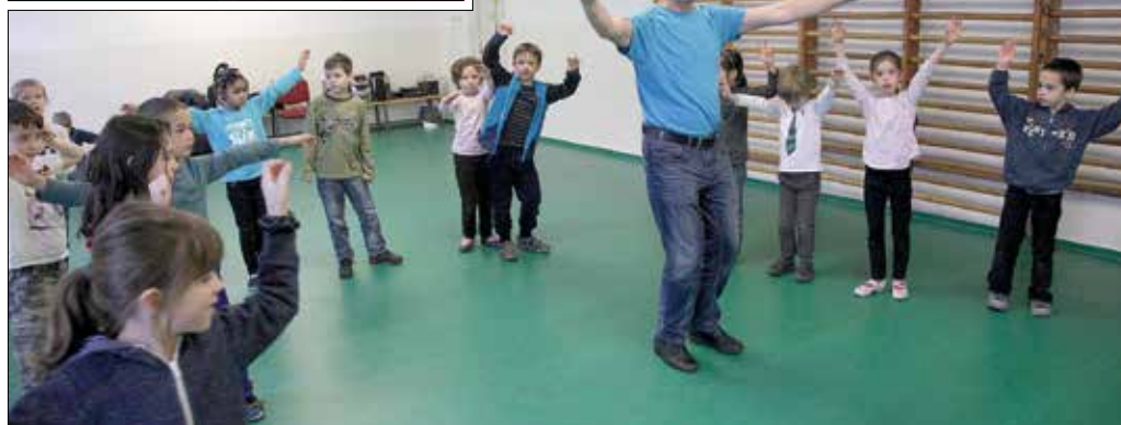
A Timár-módszer lényege, hogy a néptáncot anyanyelvnek tekintik, és így is tanítják