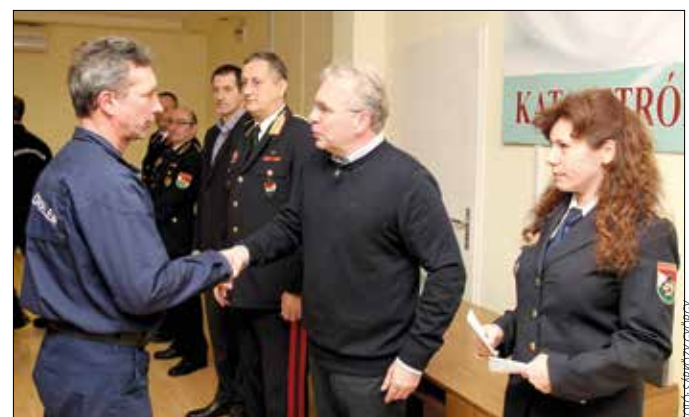
A polgármester köszöntötte a tűzoltókat

A Hegyvidéken végzett kiemelkedő munkájáért az Észak-Budai Katasztrófavédelmi Kirendeltség alá tartozó II. kerületi Hivatásos Tűzoltó-parancsnok-