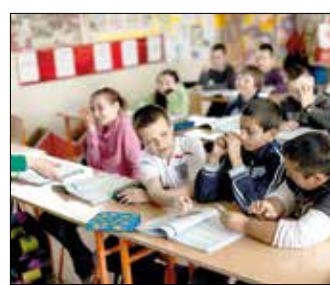
A roma gyerekek oktatását is segítenék

A roma nemzetiségű polgárok szakképzésének elősegítése érdekében az önkormányzat tagjai együttműködést kezdeményeznének a szakképző intézményekkel, munkahelyekkel, míg a foglalkoztatás javítását a pályázati lehetőségek feltérképezése és nyomon követése, azaz egy pályázat