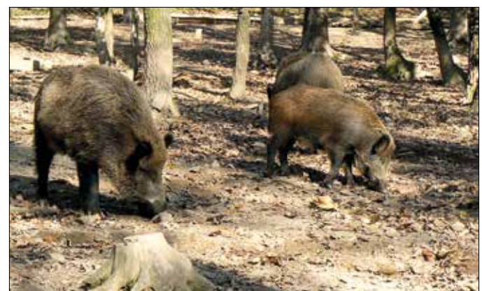
Már a Budakeszi Vadaspark is biztonságosan látogatható

mentesítéssel, a Pilisi Parkerdő Zrt. arra kéri a kirándulókat, hogy ne térjenek le a turistautakról. A folyamatos kármentesítés miatt a turistautak mellett is számítani kell munkagépek közlekedésére, ami szintén a szokásosnál na-