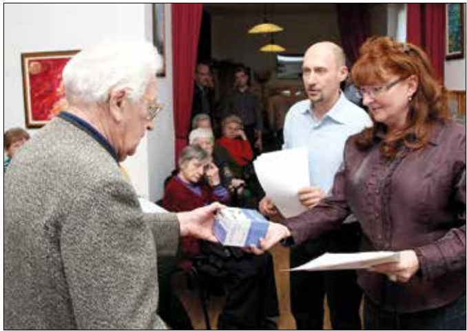
Második alkalommal kaptak mérőket a rászorulóknak a betegegyesülettől