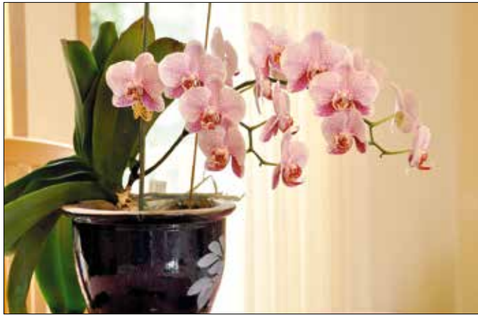
Sok orchidea télen nyílik

Lakásunk belső környezetét saját kényelmi igényeinkhez igazítjuk, ezért fűtünk télen, gyújtunk villanyt esténként. Aztán ehhez a mesterséges környezethez keresünk növényeket, amelyek a természet közelségét hivatottak jelezni életünkben. Még a legközelibb utánajárással is nehéz azonban olyan növényeket találni, amelyek a lakáshoz hasonló körülményeket részesítik előnyben, emellett megfelelően dekoratívak is.