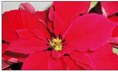
A mikulásvirág ilyenkor a legszebb

Am a jól szigetelő, modern nyílászárók korában a levegő nedvességtartalma könnyebben kúszik felfelé, mint lefelé a szobában, s ezt sokszor csak a kicsapódó vízcseppekből és a rajtuk elszaporodó penész zöldes foltjából vesszük észre. Szobanövényeink szempontjából talán még kedvezőtlenebb a helyzet felújítás előtt, ilyenkor nem a bennrekedő pára, hanem általában a levegőt erősen szárító fűtési rendszerek