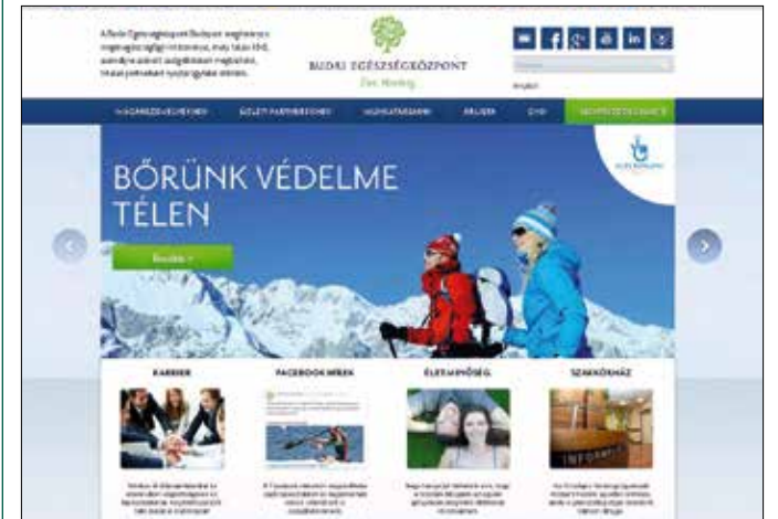
Nem először díjazták a Budai Egészségközpont honlapját

A honlap megújításával egy időben az egészségközpont új, a magán-egészségügyi piacon egyedülállóan sokoldalú online ügyfélszolgálati rendszerrel bővítette szolgáltatásait, amit pácién-