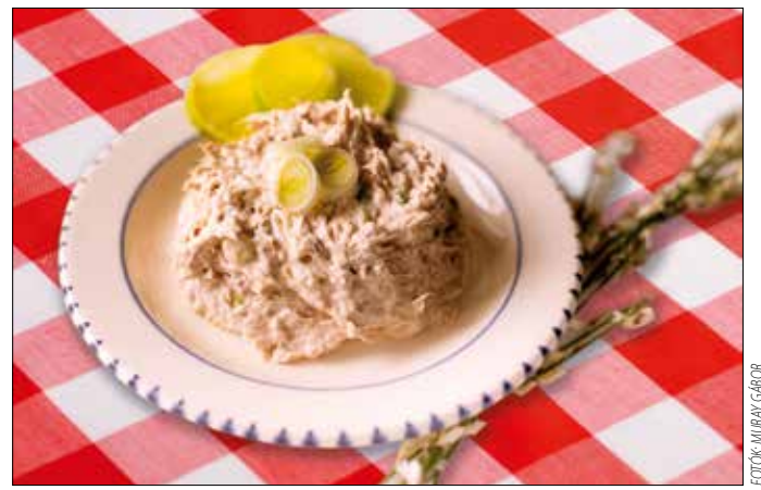
A tonhalkrém igen izletes pírtóssal, vagy akár valamilyen magos kenyérral

Először elkészítjük a bolognai ragut. Kevés olajon megpírtjuk a felkockázott baconszal-