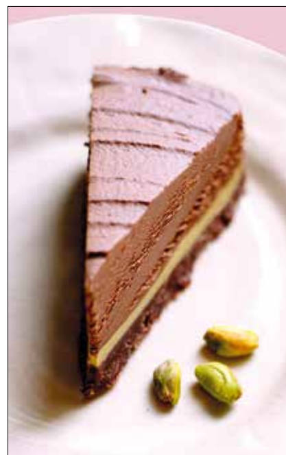
Csokis sajttorta pisztáciával

Kétszáz fokra előmelegített sütőben, alufóliával lefedve, 35 percig készül. Ezután vegyük le az alufóliát, és még 20 percig sütjük, hogy a teteje szépen megpiruljon!