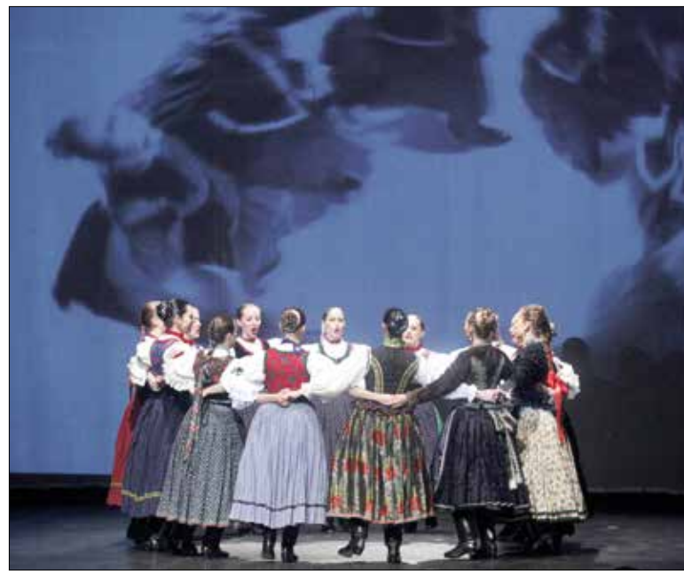
Részlet a Magyar Állami Népi Együttes látványos műsorából

A gálaesten, a Hegyvidéki Önkormányzat meghívásának köszönhetően, Pozsonyból, Somorjáról, Dunaszerdahelyről, Gútáról és Komáromból érkező hetvenfős felvidéki magyar csoporttal közösen tekinthettük meg a Kincses Felvidék című műsort, amelyben a Magyar Állami Népi Együttes hazai hivatásos néptáncgyűjtései közül elsőként foglalja össze a Felvidék tánc- és zenekultúráját. A nagy sikert arató produkció azoknak a tájegységeknek a népzenejéből merít, ahol Bartók Béla végzett kutatást. Az együttes a többi között gömői, zoborvidéki, Felső-Garam menti, bodrogközi, lipői, zempléni, árvai táncokat mutatott be a MOM Kulturális Központ színpadán.