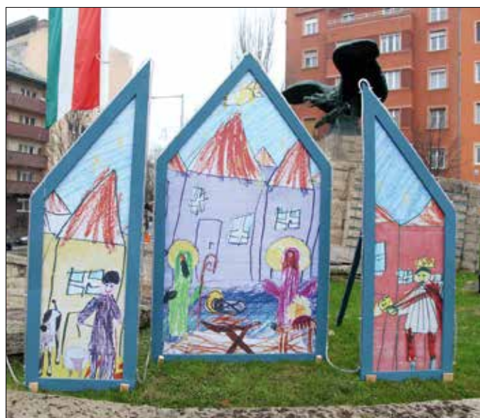
A hegyvidéki evangélikusok betleheme