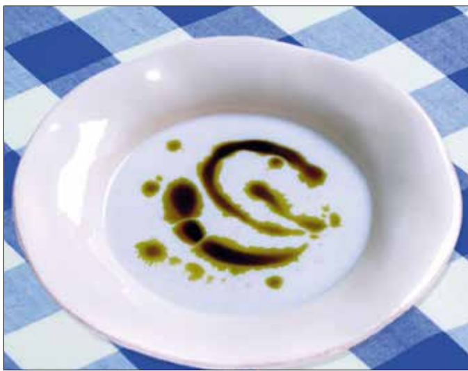
Pikáns csicsóka krémleves

Mindjárt az elején töredelmesen be kell vallanom, hogy nem vagyok nagy halrajongó. Van azonban a halak között egy, amelyik a legnagyobb örömmre ízében is, állagában, illatában is