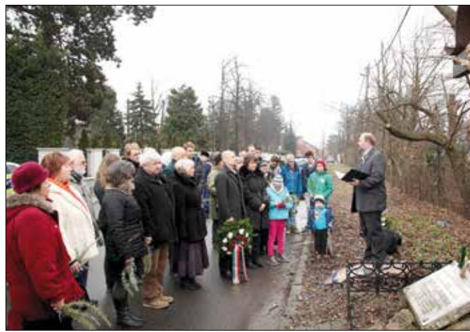
A német kitelepítettek emlékeztek az Eötvös úti sváb keresztnél