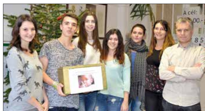
Sierra Leone-i családoknak gyűjtöttek pénzt a hegyvidéki iskolában

A tanév során Afrika-napokat szerveztek az Aranyban, a fiatalok különböző projekt feladatokat oldottak meg, szó esett az esélyegyenlőségről, a környezetvédelemről és az egészséghez való jogról. Ez utóbbi az épp akkoriban kitört ebolajárvány miatt különösen aktuális volt, a partnerskola filmjének köszönhetően a magyar gyerekek első kézből kaptak információkat a kialakult helyzetről.