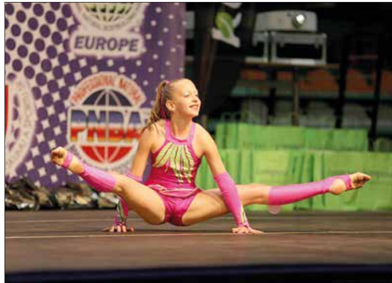
A fitness a tánc, balett, torna, aerobik, ritmikus gimnasztika változatos ötvöze

A magyar versenyzők hagyományosan jól szerepelnek a különböző fitneszviadalokon, a sportág számos hazai világ- és Európa-bajnokkal büszkélkedhet. Nem csupán a felnőttek, hanem