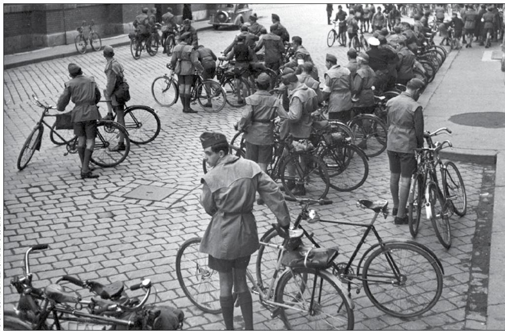
Kirándulni indulnak a fővárosi cserkészek (1940-es évek eleje)

A legtöbbször egy-egy cserkészcsapat tagjai játszottak egymással, úgy, hogy megfelezték a résztvevők számát. Ezek a programok nem jártak fizikai közharcokkal, inkább a tájékozódást, a csapatszellemet és a stratégiai elképzelések helyességét erősítették, kontrollálták – lényegében egy számháborúhoz hasonlítottak. Gyakran előfordult, hogy