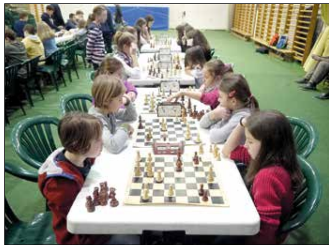
A rövid játszma során gyorsan kellett jól dönteni

A Hegyvidéken igencsak kedvelt sportág a sakk, szinte nincs olyan kerületi iskola, ahol tantervi kereteken kívül vagy különórán ne játszanának a gyerekek. A népszerűsége jelzi az is, hogy a diákolimpia keretében megrendezett sakk egyéni és csapatbajnokságra az idén is több mint kétszáz általános iskolás, valamint gimnáziumista adta le nevezését.