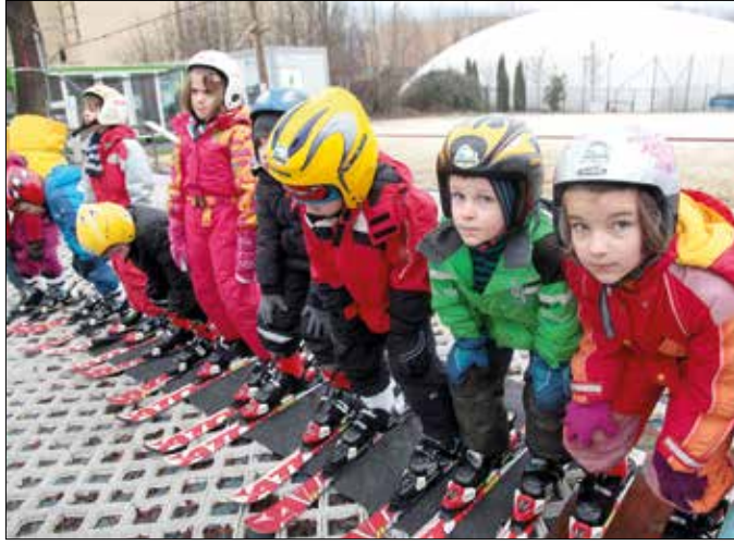
Síelni tanulhatnak az óvodások a Nanook Síiskola segítségével