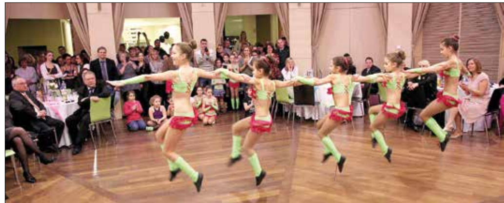
Előbb a gyerekek ropták, aztán egész este a pedagógusoké volt a táncparkett

„Ezek a bálók kiváló alkalmat teremtenek a közösségépítésre. Fontosak azok a pillanatok, amikor kicsit elengedhetjük magunkat, másként tudunk együtt lenni, hiszen ez az, amiből majd a hétköznapiokban