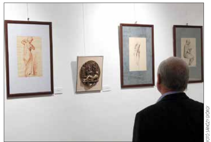
Lajos József művészetét áthatja a rendezettség

A magyar szobrászat egyik kiválósága – akinek műveivel országsszerte találkozhatunk – most először kapott lehetőséget arra, hogy Budapesten önálló kiállításra mutatkozzék be. Sok munkája van, tárlatának mégsem volt előre megtervezett tematikája. „A terem diktálta, milyen alkotásokkal töltssem meg a falait. A kiállításokon a művész a saját lelkét mutatja meg a világnak. Éppen ezért kicsit zavarban is voltam,