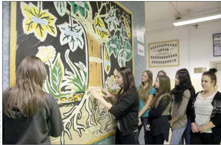
A diákok által készített „fenntarthatósági fa”

Erre nagyszerű lehetőséget kínált, hogy a Budai 2011 szeptemberében az OTP Fáy András Alapítvány mintaiskolája lett. A partnerségnek köszönhetően a diákok rendszeresen részt vesznek az O. K. (Középiskolások Országos Pénzügyi és Gazdasági Központ-