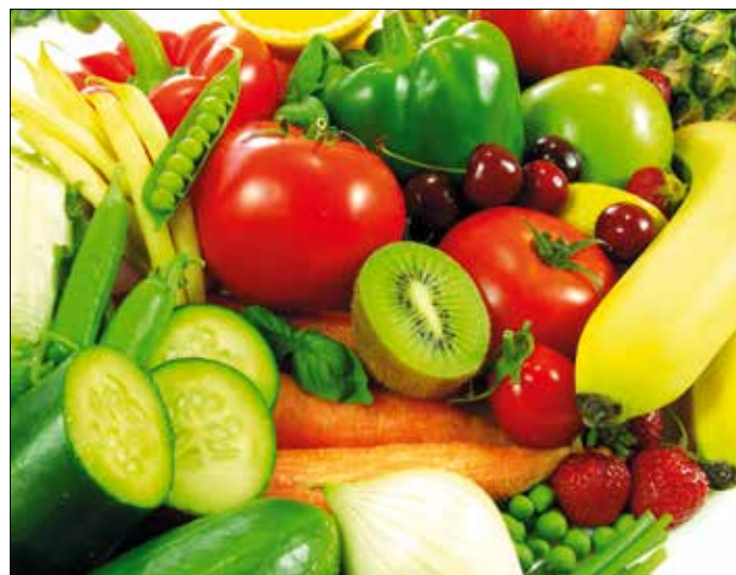
Nem elég tiszta vízzel lemosni őket

Az rendben van, hogy ősszel, ameddig lehet, a satnyább répát vesszük a felpumpált üvegázi helyett, hogy télen lemondunk az ízletlen, ragyogó paradicsomokról, és ha ilyenkor friss zöldségre vágyunk, konzervet, tartósított helyett inkább mirelit árut választunk – de mi legyen az almával, narancssal, citrommal, barackkal és cseresznyével, amit a piacon idény szerint vásárolunk? Hiszen ha mindentől kezeletlen példányokat vinnénk haza, arra