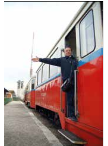
A nyár elején állhatnak szolgálatba

A felvétel jelentkezési sorrendben történik. Aki nem jut be a tavaszi tanfolyamra, az októberben induló őszi tanfolyamon próbálkozhat legközelebb.