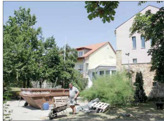
Nagy átalakításokat végeznek a Gennaro Verolino iskola épületében