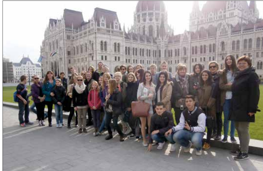
A program részeként több országból érkeztek külföldi diákok Budapestre

Eredményhirdetés és díjátadás: a magyar népmese napján, szeptember 30-án 14.00 órakor a Lívia-villában (XII., Költő utca 1/a).