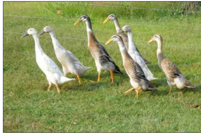
Az indiai futó kacsá hatásos, de itthon még nem bevethető „fegyver”

A csapdázás történhet a kártevők etetésével is. Ha a kertben kigyomlált pitypangot a földre terítjük, a csigák annak esnek neki a dísz- és haszonnövények helyett. Persze, az odacsábított egyedeket időben össze kell szed-