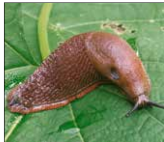
Spanyol meztelen csiga

Hasonlóan hatékony, de sokkal bonyolultabb megoldás a visszahajló peremes, alacsony keszítés. Ez, bár hasznos, jelentősen