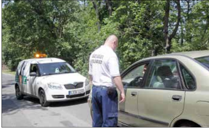
Sokba kerülhet a szabálytalan behajtás

akarják kikerülni a Budakeszi úti dugót. Pedig sokba kerülhet a szabálytalan közlekedés, a közigazgatási bírság összege fix 30 ezer forint – a közterület-felügyelőnek nincsen módja mérlegelni.