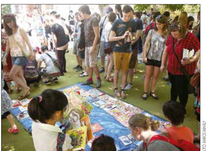
Hogyminden évben, az idén is kedvezményes nyári könyvvásárt rendezett a Budapesti Japán Iskola. A legkelendőbbek a manga képregények, a divatlapok és a nyelvkönyvek voltak