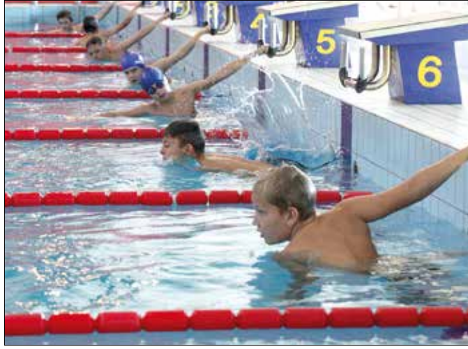
Úszásban és fociban is összemérték tudásukat a fiatalok

A XII. kerület legnagyobb sportversenye a Hegyvidéki Szabadidősport Nonprofit Kft. által szervezett diákolimpia. Az immár évtizedes múltra visszatekintő sorozat népszerűségét bizonyítja, hogy bár senkinek sem kötelező a részvétel, a 2014–2015-ös tanévben összesen mintegy négyezer nevezést adtak le az intézmények – és nem csupán az önkormányzat által működtetett iskolák. Az atlétika-, úszó-, labdarúgó-, kosárlabda-, röplabda-, floorball-, sakk-, partizánbajnokságokban és a szellemi olimpián az ELTE Gyertyánffy István Gyakorló Általános Iskola, a Ssemelweis Egyetem Gyakorló Általános Iskola és Gimnázium, valamint a Pannonia Sacra Katolikus Általános Iskola tanulói is rajthoz álltak.