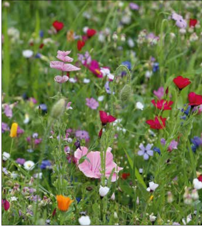
A virágos rétek szépsége a változatosságukban rejlik

Az esők hatására kikelő növények egészen az első őszi fagyokig virágoznak, minden további gondozás nélkül. Teszik mindezt az