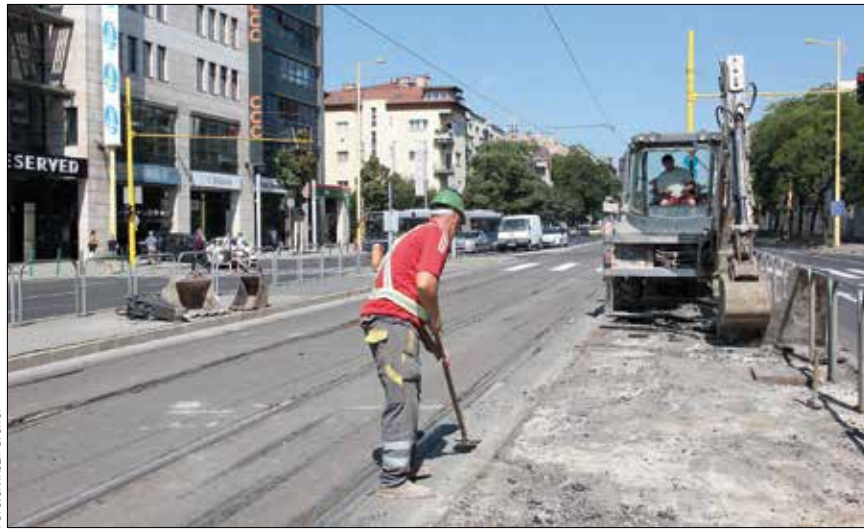
A munkák miatt várhatóan október közepéig szünetel a villamosforgalom

A Déli pályaudvar megálló északi végén – az Alkotás utca páratlan oldala és a peronok között – jelzőlámpával biztosított gyalogátkelőhelyet alakítanak ki. A Déli pályaudvar és a BAH-csomópont megállóhelyeken a jelenlegi FUTÁR kijelzők megtartása mellett újabbakat helyeznek ki az átelles peronokra, míg a Nagyenyed utca megállóhely északi végében és a Királyhágó utcai villamosperon déli részében öntözőberendezéssel ellátott zöld sávot hoznak létre. A Nagyenyed utca és a Királyhágó utca megállóhelyeknél kicsérlik