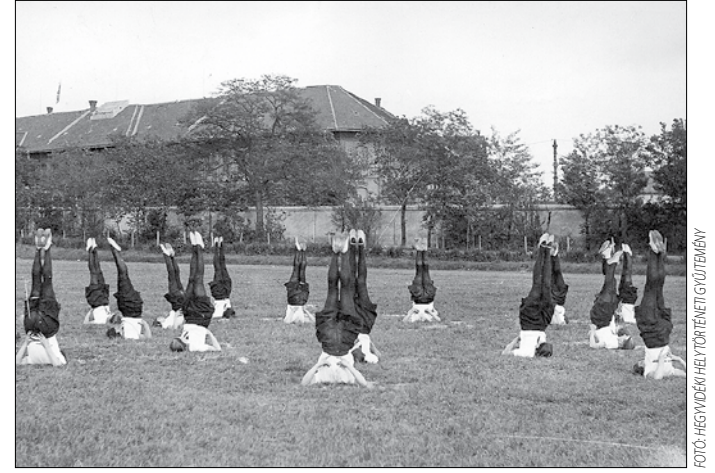
Női tornagyakorlat a TF udvarán az 1930-as években

A fennállása 50. évfordulóját ünneplő Magyar Testnevelési Főiskola 1975-ben egyetemi rangot kapott. Tíz évvel később, 1985-