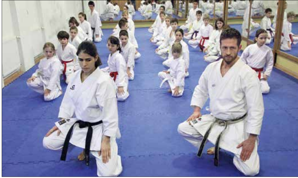
Őrzik a karate tradicionális értékeit, az edzéseken mindig meghatározó a jókedv és a csapatépítés

A már megszokott programok mellett szeptembertől vadonatúj tanfolyamokat is indít a Hegyvidék SE keretében működő Győri úti Shuhari Dojo. A XII. kerületben élő és a nappali tagozatos diákok egyes kurzusok árából kedvezményt kapnak.