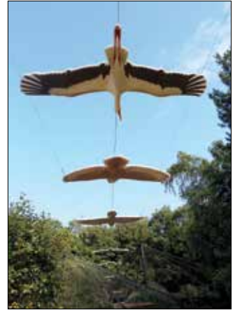
Új tanösvény várja a gyerekeket

Az első őstulok mindössze egy éve érkeztek a vadasparkba, s a program sikerét mi sem bizonyítja jobban, mint azok a világosbarna borjak, akik szüleik társaságában élvezik az árnyas kifutó békéjét. Tavaly egy kalandos véletlen segített kiválasztani a két