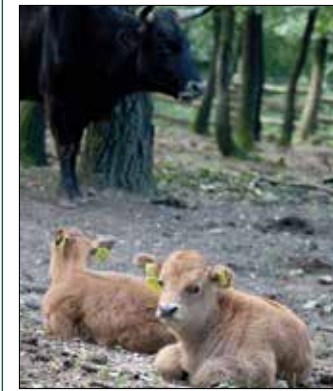
Bővült az őstulok családja

új anyagok hatékonyan tartják távol a madarakra legveszélyesebb és a környező erdőkben gyakori kisragadozókat.