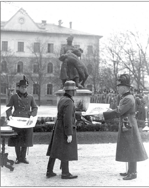
Háttérben a Csendőrvértanúk emlékszobra

Az ország területét hat csendőrkörületre osztották fel, a testület működési területe kizárólag vidékre korlátozódott, irányítása azonban a fővárosból történt. Az