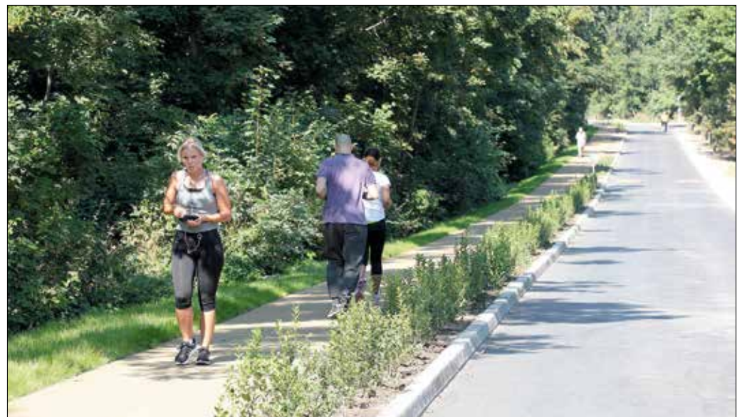
A futók első visszajelzései rendkívül pozitívak az új futópályával kapcsolatban

Érdekes célpontja lehet egy kirándulásnak a Tündér-hegyi kőfejtő is, ami korábban geológiai bemutatóhelyként működött, azonban az elburjánzó növényzet miatt az utóbbi időben egyre nehezebb volt megközelíteni. Ezért a nyáron szakemberek eltávolították a tájidegen, invazív övönövényeket, így ismét láthatóvá váltak a látványos színekben