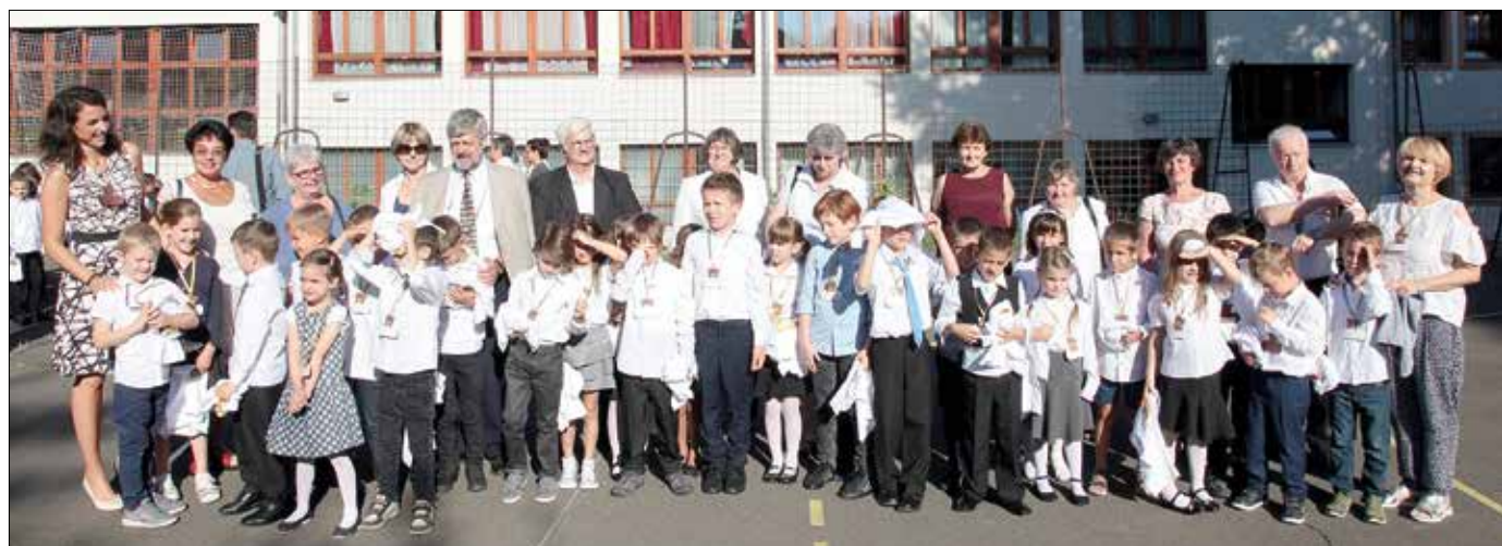
Erős kötelék alakult ki a hatvan évvel ezelőtti elsősök között – jó lenne, ha a maiak is hasonló érzésekkel gazdagodnának

Többen részesei lehetnek az iskolai kórus világraszóló sikerének: 1961-ben elsőként vették