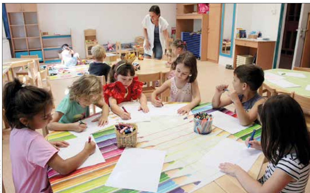
Az Orbánhegyi Óvoda tagóvodájában három csoport kezdte meg a nevelési évet

A szakszolgálat végzi el az iskolareptés felmérést, valamint biztosítja a beszédfejlesztésre fókuszáló logopédiai ellátást is, amire az utóbbi években egyre nagyobb igény mutatkozik. Lesz látás-, hallás-, fogászati vizsgálat; a szintén az önkormányzat kezdeményezésére két éve elindított ortopédiai (gerinc)szűrésre már most szeptemberben, míg az esetleges lisztérzékenység megállapítására novemberben kerül sor. Újdonság, hogy a szakorvosi igazolással rendelkező táplálékallergiás gyerekek részére az idén már napi háromszor biztosított a speciális étkeztes.