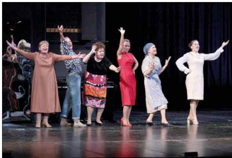
A Kecskeméten rendezett díjátadó egyben országos évadnyitó gála is volt