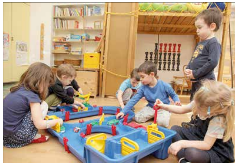
A gyerekek játékos foglalkozásokon ismerkedhetnek a természettudományokkal