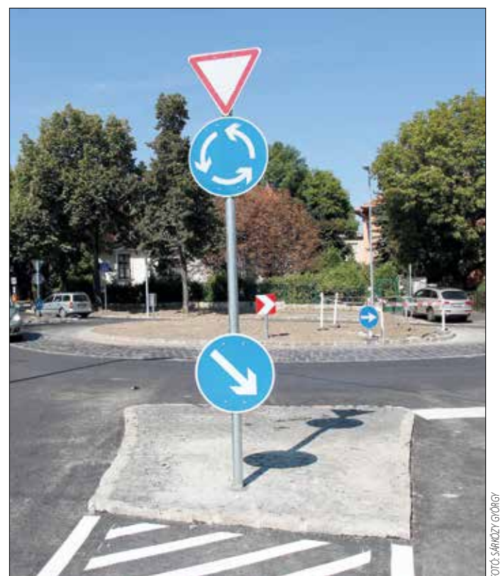
Korszerű és biztonságos csomópont épült az Alsó Svábhegyi úton

Új körforgalom épült a Kútvölgyi lejtő és az Alsó Svábhegyi út kereszteződésében. A korszerű és biztonságos csomópont közepén virágokat ültet az önkor-