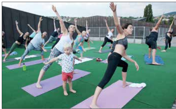
A jóga jótékony hatását mindenkinek érdemes megtapasztalnia

Nyugalom, testi-lelki felfrissülés, pozitív életszemlélet – ezeket az érzéseket tapasztalhatták meg azok, akik az ötszillagos MOM Sportban található Fitness&More fitneszkomplexum tetőteraszán a Hegyvidék látképében gyönyörködve jógáztak. Egy különleges edzésen, a rooftop jógán jártunk.