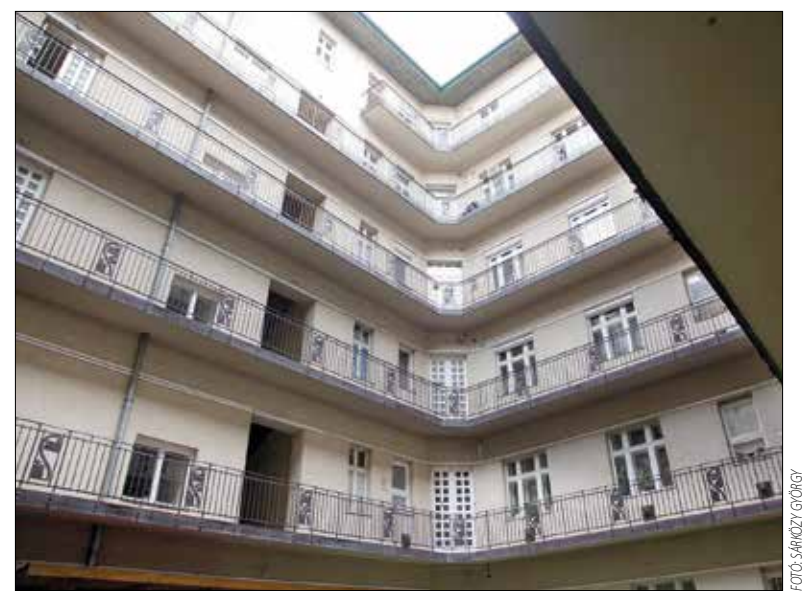
A házban mindenhol biztosítani kell az akadálymentes közlekedést

Újdonság, hogy a lakóépületben kifüggesztett tűzvédelmi szabályzatnak tartalmaznia kell a készítője nevét és elérhetőségét, valamint az aláírását – ezáltal a felelősség kérdése egyszerűbben tisztázható. A jogszabályváltozás értelmében a háromszintesnél magasabb és tíznél több lakó- és üdülőegységet magában foglaló épületben, épületrészben a közös képviselőnek vagy az intézőbizottság elnökének, ha nincsenek, akkor az épület, épületrész tulajdonosának a feladata írásban kidolgozni a tűzjelzés tartalmi követelményeit.