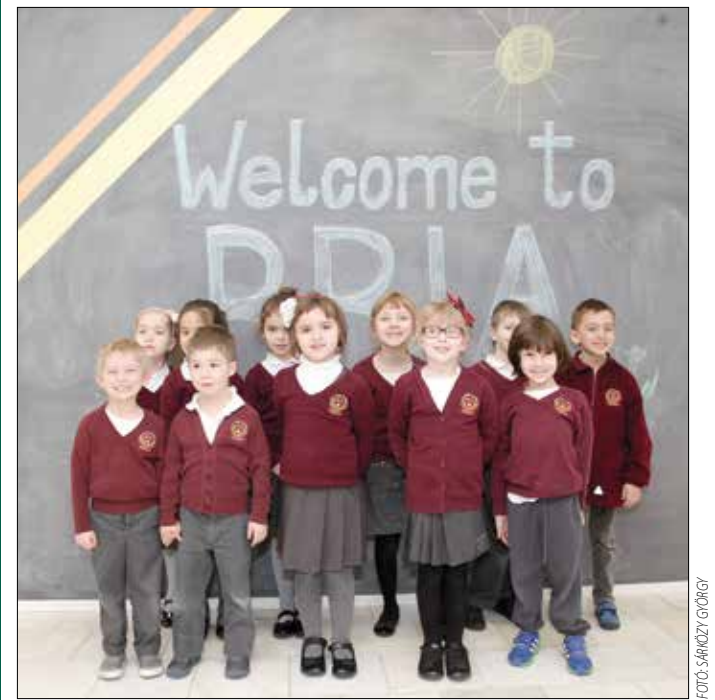
Jelenleg az elsőtől a negyedik osztályig fogad diákokat az intézmény

A Budapest British International Academyben a tantárgyakat – a magyar kivételével – angol nyelven oktatják, a tanárok fele angol anyanyelvű. A legfeljebb tizenhat fős osztályokban egyidejűleg két pedagógus tanít, ez teszi lehetővé, hogy egyénileg is sokat foglalkozhassanak a diákokkal.