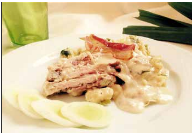
Ünnepi alkalomra is kitűnő: rétegezett karaj túrós galuskával

Nehéz „eladni” a gyerekeknek a zöldségfélék gyöngyét, a kelbimbót, pedig ez az egyik legvitaminúsabb, legtáplálóbb főzeléknek való. Tapasztalat szerint ilyenkor segít a levestrűkk, mert valami miatt azt általában jobban szívlik a kisemberek, mint a második fogást.