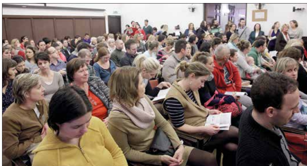
Az érdeklődő szülők szokás szerint zsúfoltság megtöltötték a Jókai Klubot