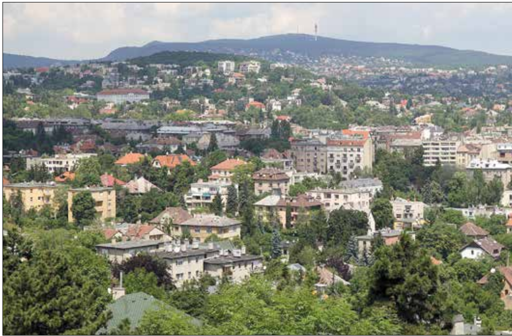
Intézmények, utak, zöld területek fenntartását fedezik a helyi adók

A csoportos beszedési megbízáshoz a banknál meg kell adni a Hegyvidéki Önkormányzat technikai számát (A15735753T 243), valamint egy 17 jegyű sze-