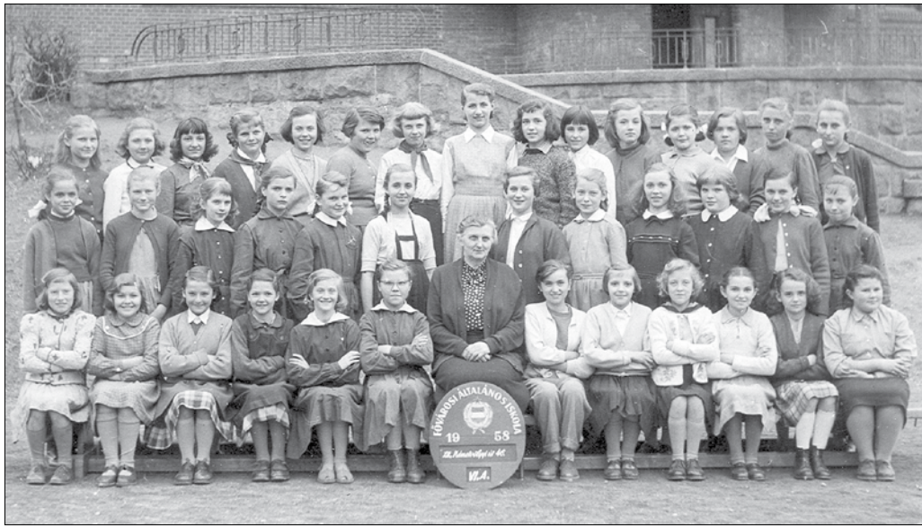
Egy 1956-os osztálykép