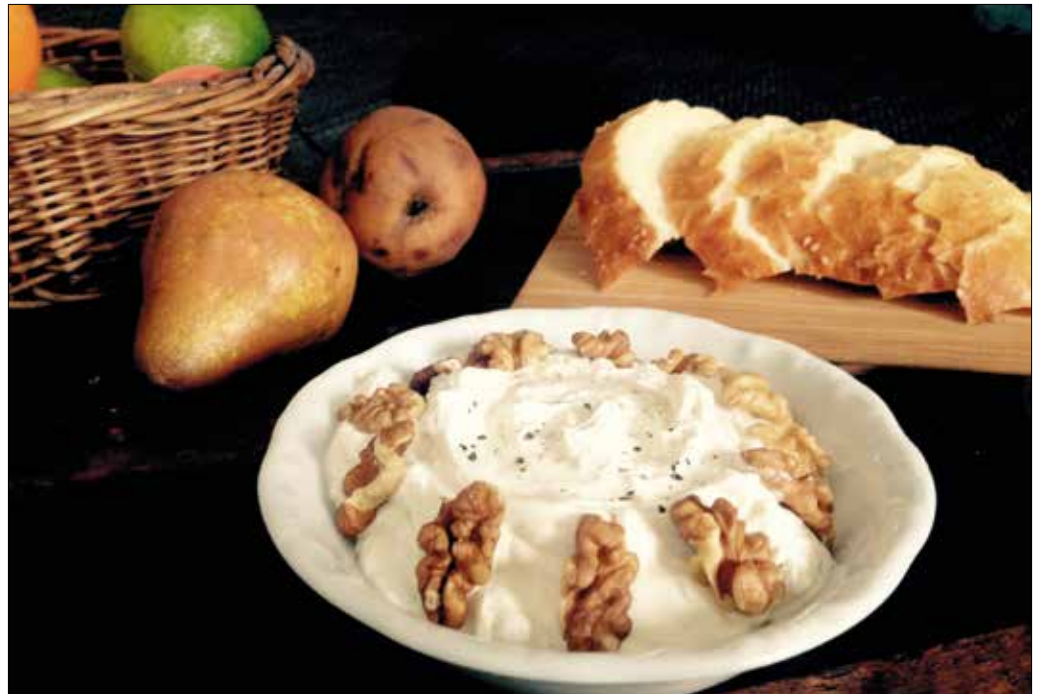
Kiváló vendégmarasztaló mártogatós a diós-körtés sajtkrém