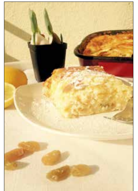
Különleges smarni, túróval

Hűlni hagyjuk, és amikor már alaposan sűrűsödik, ráöntjük a