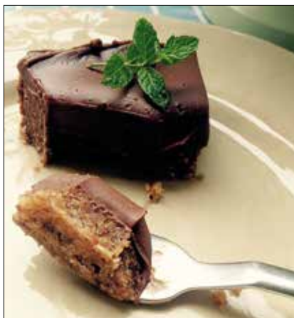
Mentás csokitorta: csak úgy olvad a szájban!

◆ Figyelem, ortodox finomság következik! Ez a tejszínes-mentás csokoládétorta sűrű, mégis csak úgy olvad a szájban; alapja pedig egy hajszálnyi sós zabkekszéből készül, ami kellemesen ellenpontozza a desszert édességét.