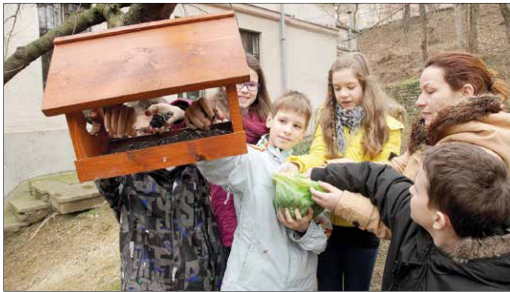
A közös madáretetés a gyerekek legkedvesebb elfoglaltságai közé tartozik

zik a hagyományok ápolásával, a környezettudatosság, a fenntartható fogyasztás és fejlődés pedagógiájának gyakorlati megvalósításával. A minősítés három évre szól, a har-