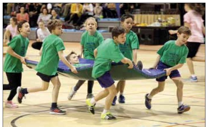
Jó fizikum és ügyesség is kellett néhány feladat teljesítéséhez