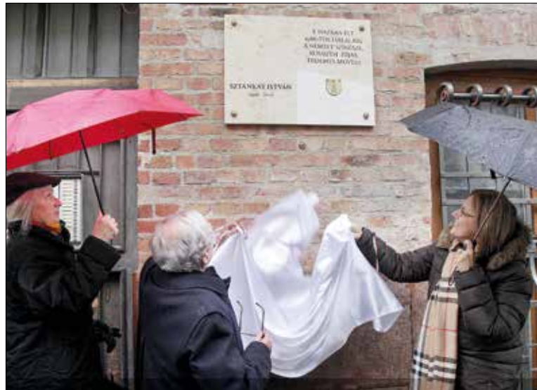
Egykori Városmajor utcai lakóháza falán avatták fel az emléktáblát

Közszeregetnek örvendett, nemzedékeket bűvölt el mély, bűgő hangjával Sztankay István, a Nemzet Színésze, Kossuth- és Jászai Mari-díjas, érdemes művész. Polgár volt, abban az értelemben, ahogy Márai Sándor gondolkodott az egyszerre magyar és európai polgárról. A Hegyvidéki Önkormányzat februárban emléktáblát állított a színművész egykori lakóháza, a Városmajor utca 10-es számú ház falára.