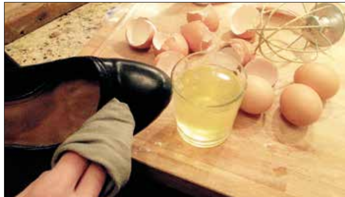
A bőrcipő puhan tartható, ha időnként bekenjük tojásfehérjével

A tojássárgája frissen tartható, ha hideg vizet öntünk rá, és hideg helyen tároljuk. (A tojáshejat se dobjuk ki! Ha összetört tojáshe-