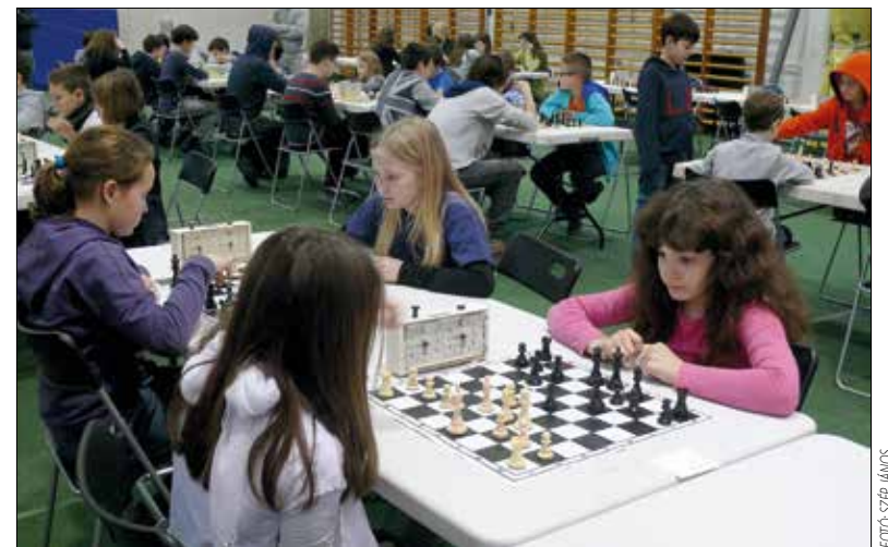
A sakk az egyik legnépszerűbb sportág a Hegyvidéken

A sikerszeriát a lányoknál az Osztrák–Magyar Európaiiskola járó egyik diák, a középiskolás fiúk között pedig a Városmajori Gimnáziumot képviselő tanuló törte meg. Valamennyi győztes egyenes ágon bejutott a budapesti elődöntőbe, míg az egyes korcsoportok második és harmadik helyezettjei a budapesti pótdöntőben folytathatják a küzdelmet.