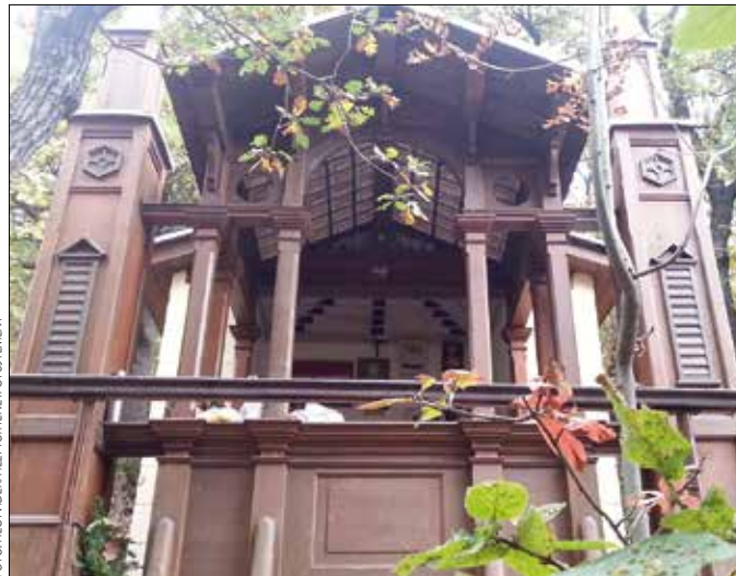
1998-ban szentelték újra a hányatott sorsú kápolnát

A következő évtizedekben azonban hiába óvták a kápolnát, az 1990-es esztendő végére az egykori épületnek csak kis torzója maradt. A XII. kerület helytörténetek kutatója, a Svábhegyi Egyesület elnöke, a 2007-ben elhunyt