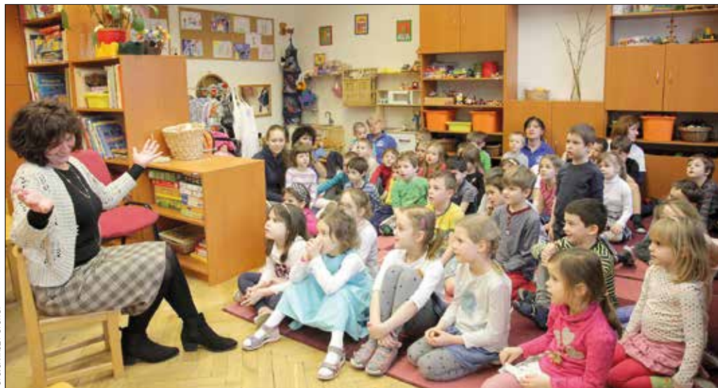
A tizenkét órás mesemondás a Városmajor utcai óvodában kezdődött el

Ezért állt az önkormányzat a Mesészó Magyar Mesemondó és Szövegfolklor Egyesület kezdeményezésére mellé, és segítette abban, hogy február 12-én délelőtt 10 órától este 10-ig harmincegy kerületi intézményben, óvodák-