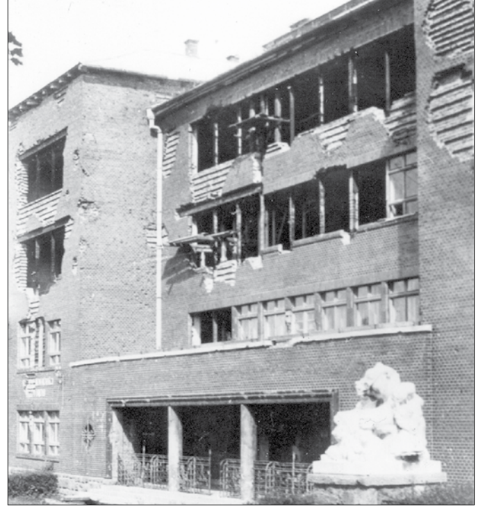
A világháborúban hatalmas károkat szenvedett az iskolaépület

Az 1969–70-es tanévtől orosz és angol nyelvi tagozatos, szakosított tantervű osztályok működtek a „Mackósban”. A barakkok a 80-