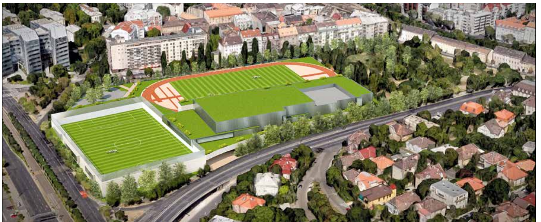
A Csörsz utcai sporttelep látványterve