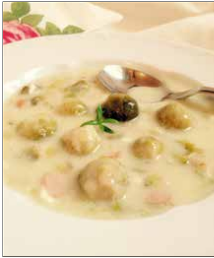
A kelbimbó a zöldségfélék gyöngye