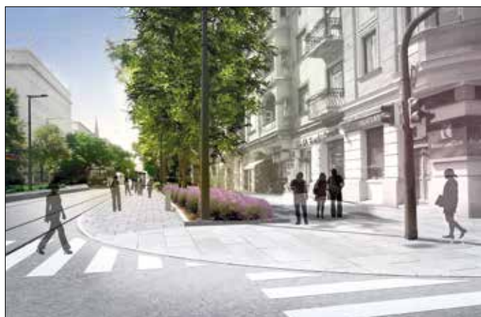
Kényelmes gyalogközlekedésre alkalmas járdákat hoznának létre

A főépítész a problémák közt említette a gyalogosok életét nehezítő körülményeket. Bár a Böszörményi út keresztmetszete végig elég széles, ennek ellenére a járdák osztottak, sok helyütt szűkek, tele vannak akadályokkal,