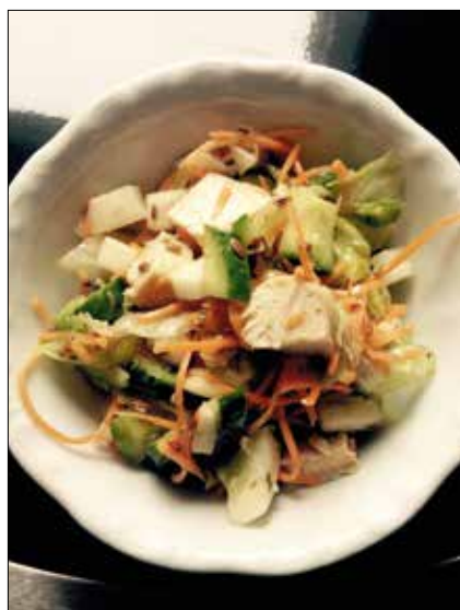
Lenmagos saláta tökmagolajjal

½ kígyóuborka 2 sárgarépa 1 pár csirkemell ½ jégsaláta tökmagolaj lenolaj 1 marék lenmag ½ citrom leve 1 fehér retek só, bors, cayenne bors angol mustár