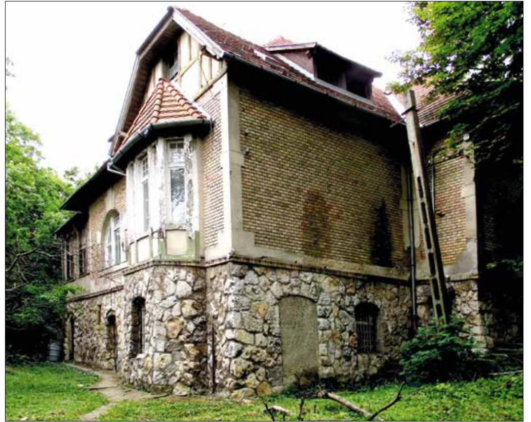
Az egyik pavilon, szintén villából átalakítva

A hatalmas kert, a még mindig megmenthető épületekkel, közvetlenül határos a Vakok Bar-thyány László Római Katolikus Gyermekotthona, Óvoda és Általános Iskolával. Ez az intéz-mény állandó terület- és épület-