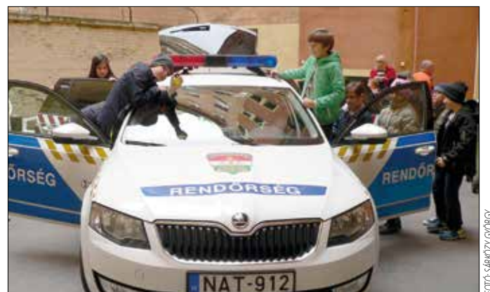
Ezúttal a rendőrautó nem rendeltetészerű használata is belefért

A Hegyvidéki Mesevár és a KIMBI Óvodából, valamint a Németyölgyi Általános Iskolából érkeztek vendégek a kerületi rendőrkapitányság nyílt napjára. Az óvodások és a diákok játékos közbiztonsági előadáson vettek részt, valamint megismerkedtek a mindennapokban alkalmazott rendőrségi felszerelésekkel.