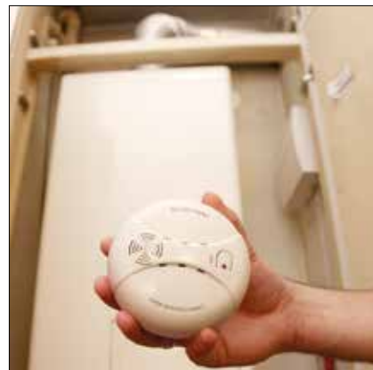
A szén-monoxid-riasztót mindig a fűtőberendezés közelében kell felszerelni

Szintén veszélyt jelenthetnek a szagelszívó berendezések, amik a lakótér levegőjét használják, miközben a kéményekből visszafelé áramoltathatják a mérges levegőt. A hibátlanul szelelő kémény is okozhat gondot, amennyiben nem tökéletes a kialakítása: ilyenkor előfordulhat, hogy a légköri nyomás nem engedi a kéményen át távozni a gyilkos gázt, ami felgyü-