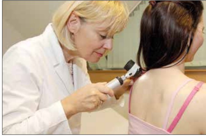
Nagyon fontos az anyajegyek rendszeres ellenőrzése

A bőr egészségéhez a szintén zsírolékony A-vitamin is hozzájárul. Ennek növényi előanyaga a