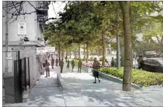
... és ilyen lenne

sok és buszok esetleg forgalmi torlódásokat okozhatnak majd, a BKK szerint azonban ez a probléma kiküszöbölhető lesz. A napjainkban telepített jelzőlámpás csomópontok esetében ugyanis már