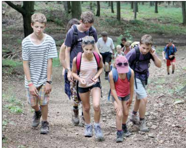
Sok fiatal csatlakozott a csapathoz az évek folyamán

N. G.: Örömmel mondhatom, hogy igen! Naggy hangsúlyt helyezünk arra, hogy megszeressük a természetjárást a gyerekekkel. Tapasztalataink szerint a húsz év körüli fiatalok eltávolodnak tőlünk, de családalapítás után többnyire visszatérnek, immár a gyermekeikkel együtt. Huszonöt-harminc esztendője a gyermekeink jöttek velünk, most már