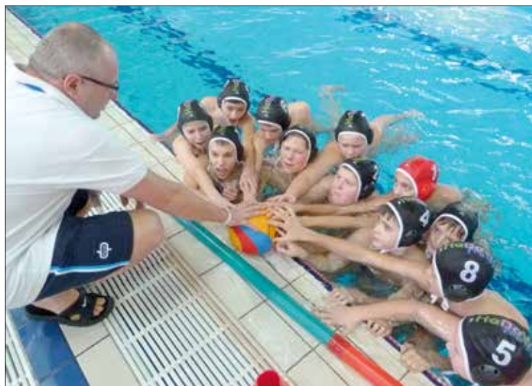
Edzők, játékosok, idősebbek, fiatalok mind egyet akarnak: még jobb YBL-t!

– Egyelőre nincsenek topcsapatunk, inkább a középszintű felső részéhez tartozunk, de