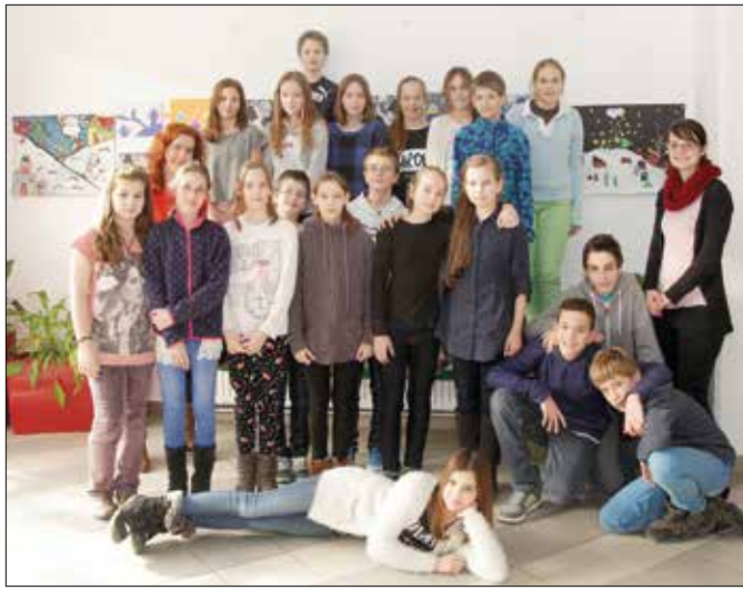
„Ádámok és Évák” a Zugligeti Általános Iskolából

A zugligeti iskola magyar nyelv és irodalom tanító pedagógusa