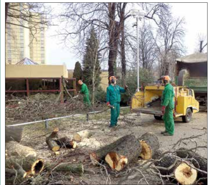
Csak akkor vágják ki fát, ha az elkerülhetetlen

Az állomány örvendetes fiatalodik, fát csak akkor vágnak ki, ha ez elkerülhetetlen. A FŐKERT Zrt. által elvégzett felmérés szerint – a Novotelhez tartozó huszonhat fát a Soproni Egyetem módszerével röntgenézték meg – sajnos egyre több a veszélyes péld-