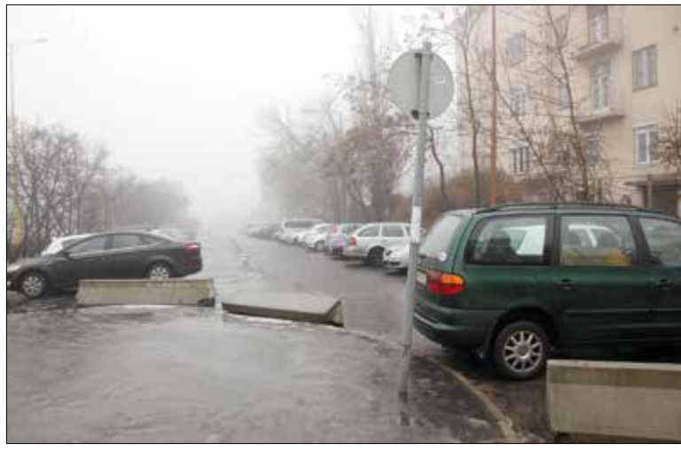
Most töredezett aszfaltburkolatú parkoló

Mivel az önkormányzat változatlanul egyben szeretné értékesíteni a területet, ezért a képviselő-testület a legutóbbi ülésén úgy döntött: egy újabb, harmadik pályázatot ír ki, azzal a feltétellel, hogy a négy telket csak együtt vásárolható meg. Így teremthető meg ugyanis annak az esélye, hogy – a fővárosnak fizetett vételárat is leszámítva – legalább 200 millió forint haszonnal gyarapodhasson a kerület vagyona. A befolyt összeget az önkormányzat intézményfelújításra fordítja.