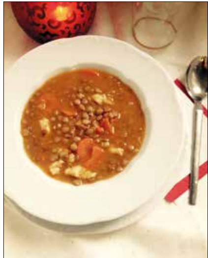
Ne csak újévkor együnk lencsét!

ul a vasat. Azt viszont kevesen tudják, hogy a tejtermékekkel együtt hiába fogyasztunk vastartalmú ételeket, mert azok gátolják az értékes ásványi anyag felszívódását. Úgyhogy mielőtt belepötytyintjük az első kanál tejfölt a tányérunkba, helyezzük mérlegre: az élvezet vagy az egészség a fontosabb?