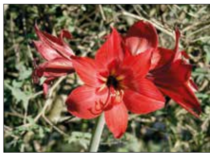
Csodás vörös virága van

Ha a címből nem is derül ki egyértelműen, a köznyelvben amarillisként emlegetett növényről lesz szó az alábbiakban. Sokszor nézzük vágyakozva hatalmas virágait, áldozatos gondozást és komoly szakértelmet feltételezve, pedig virágoztatása nem jelenthet kihívást egyetlen hobbikertész számára sem.