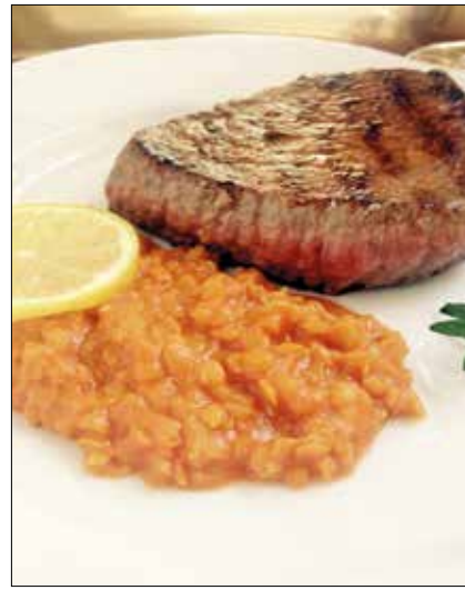
A vöröslencse gyorsan tálalható

Az angolkrémhez: 5 dl teljes tej 5 tojás sárgája 4 ek cukor 1 vaníliarúd kikapart magjai