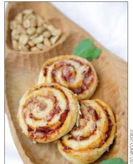
Kiadós vendéglátó a pizzás csiga

A 20 deka vaj robotgép segítségével összedolgozom a 8 deka liszttel. Körülbelül 2 centi vastag téglalapot nyújtok belőle két sütopapír között, majd fóliába csomagolva hűtőbe teszem. A kelt tésztához mindent egy táliba halmozok, és hideg kézzel, gyors mozdulatokkal szép, rugalmas tésztát dagasztok.