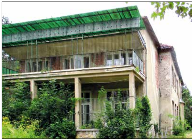
Kórházi pavilon a kertben