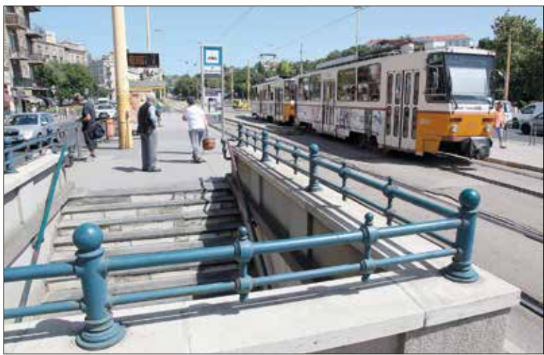
A Déli pályaudvarnál új gyalogátkelőhely segíti majd a közlekedést

A fonódó villamoshálózat és a Széll Kálmán tér átadásával nem állnak le Budán a fővárosi fejlesztések. Az év második felében ötvenöt villamosmegálló épül át a teljes akadálymentesség érdek-