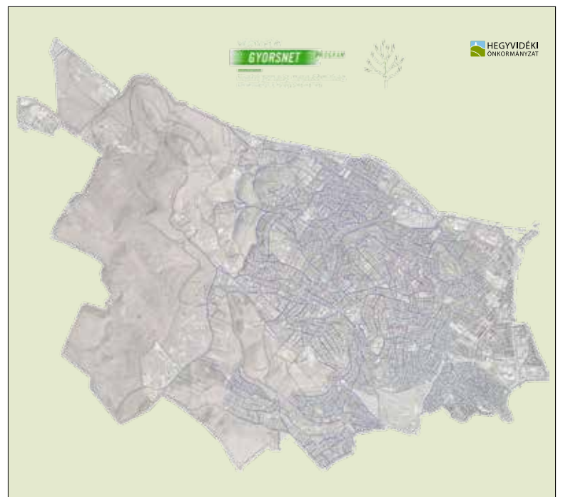
A XII. kerület 38 ezer háztartását érinti a hálózatfejlesztés

„A Telekom és a Digi szerepvállalásával háromra módosul a kerületben elérhető szolgáltatók száma, ami remélhetőleg csökkenti az árakat. A kerület chhez