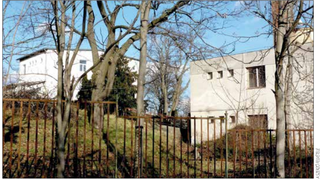
A kórház Mártonhegyi úti, modernebb épületei

1974-ben megalakult a gyermekkardiológiai osztály, a vesebetegségek szívhibás betegek körével bővülve. Teljesítménydiagnosztikai laboratórium, EKG, Pkg ultrahang-diagnosztika, izotóplabor segítette a szívbetegségek diagnosztizálásában. 1975-ben a fejlődésneurológiai és neurorehabilitációs osztály évente 450 osz-