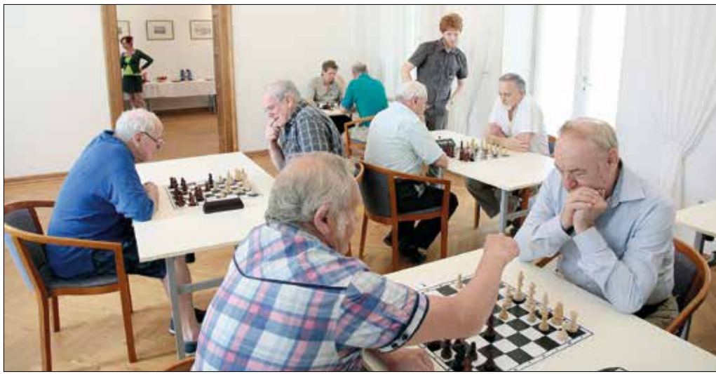
A sakkverseny jól illeszkedett a Szépkorúakért a Hegyvidéken programhoz