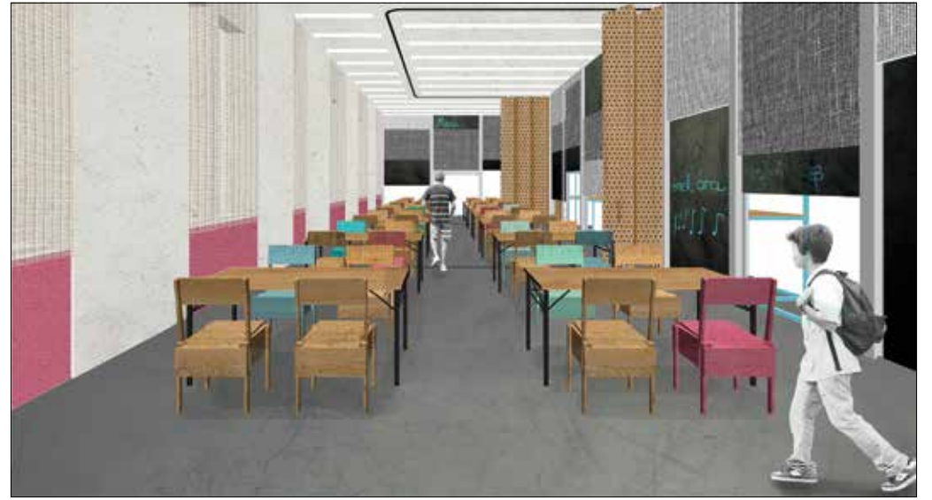
A Jókai iskola étkezdéje a tervezők szándéka szerint közösségi programok megrendezésére is alkalmas lenne

A szakmai zsűri a 150 ezer forint pénzzal jutalmazott Árkay-