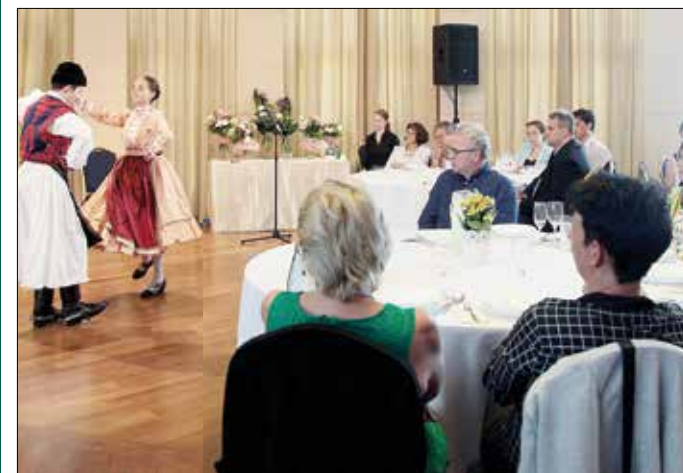
Minden tanév végén összejönnek az intézményvezetők egy kis ünnepésre

felújításra vár a zugligeti lóvasút-végállomás, át kell költöztetni a gyermekorvosi rendelőt – sorolta. – Még nincs döntés a fővárosi szuperkórházról; a mi érdekünk, hogy elkülönült szakrendelői tőmb, például a Kútvölgyi szolgáltató ki a kerület lakosait. Ha az iskolák működéséért az állam felel, meg kell majd állapodni, a civil egyesületek hogyan használhatják továbbra is a tornatermet délutánonként. Fontosak a digitális világ veszélyeire felkészítő tanfolyamok pedagógusoknak és diákoknak egyaránt. Óvodai és bölcsődei kapacitásbővítésre