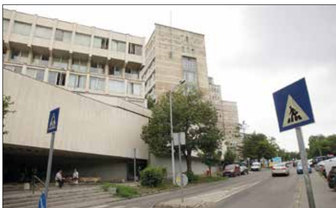
A Kútvölgyi épülete alkalmas lenne önálló hegyvidéki szakrendelőnek