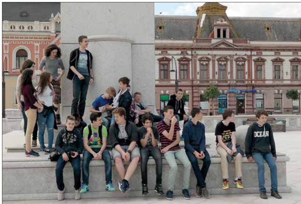
Pihenő a nagyváradi főtéren

A programokat úgy állították össze, hogy a diákok minél közelebbi kapcsolatba kerüljenek a Székelyföldön élő magyarok mindennapi életével és kultúrájával. Fontos esemény volt a zetelakai általános iskola tanulóival eltöltött közös nap. A fiatalok