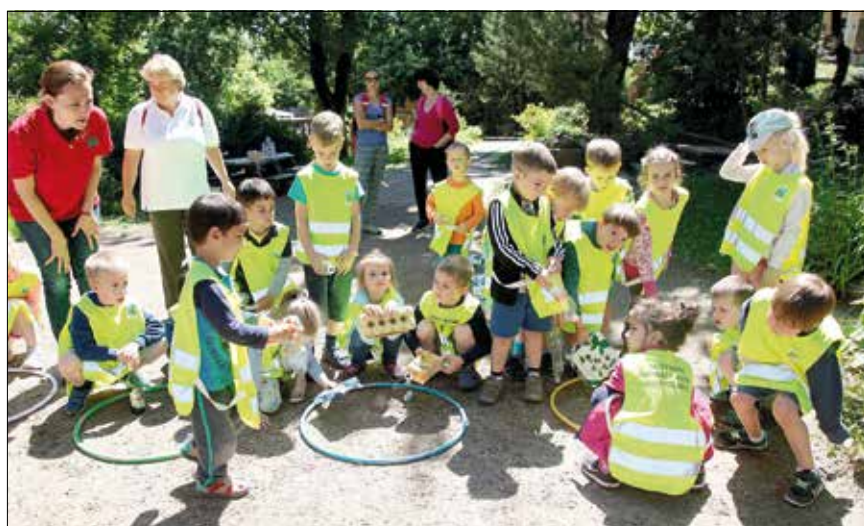
A tanulás mellett a sikerélmény biztosítása a célja a játéknak