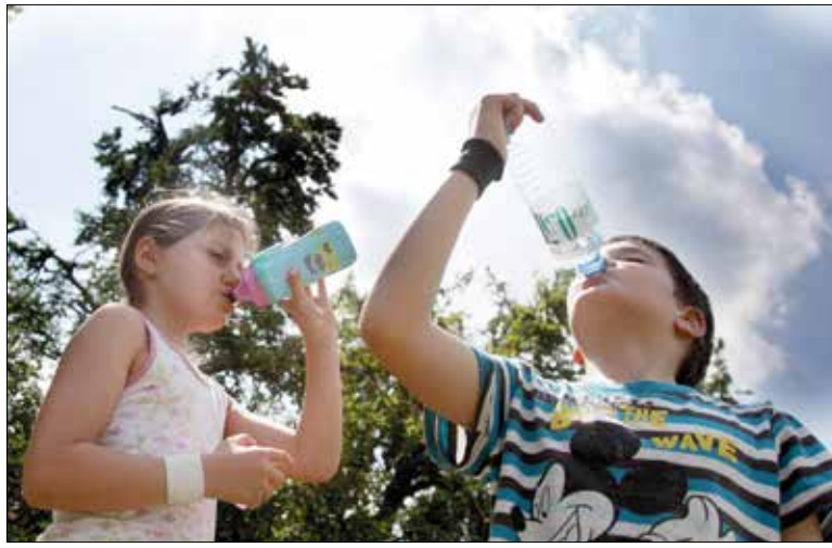
Kánikula idején jelentősen nő a szervezet folyadékigénye, igyunk sokszor és sokat!

Bár már kaptunk ízelítőt a rekkenő hőségből, még sok forró nyári nap áll előttünk, jó, ha gondosan felkészülünk rá. A Fővárosi Katasztrófavédelmi Igazgatóság tájékoztatása szerint az egészségre veszélyt jelentő hőhullámnak tekinthető, ha az Országos Meteorológiai Szolgálat időjárás-előrejelzése alapján a napi középhőmérséklet legalább három egymást követő napon meghaladja a 25 Celsius-fokot.