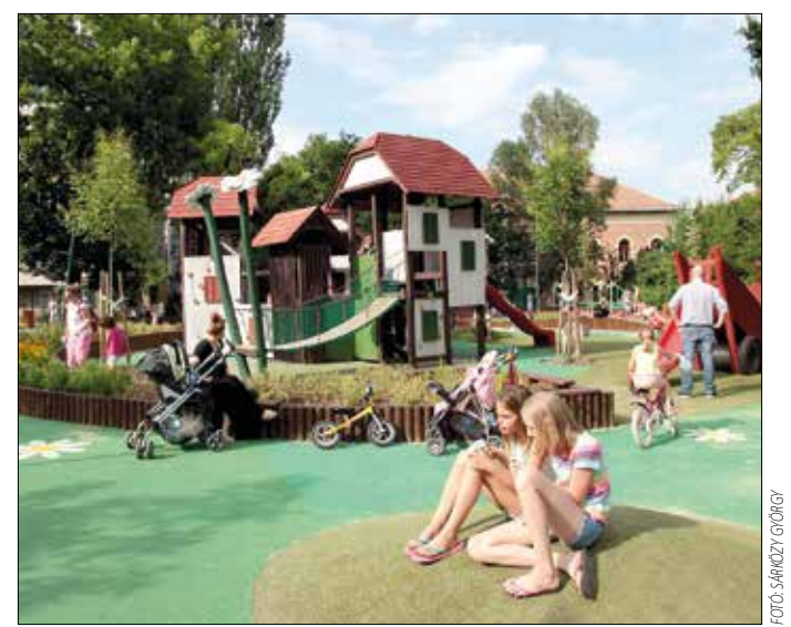
Színes, vidám, egyedi játszótér – nem véletlenül kedvelik a családok

– A hegyvidéki polgárok, amikor szakrendelést keresnek, első-