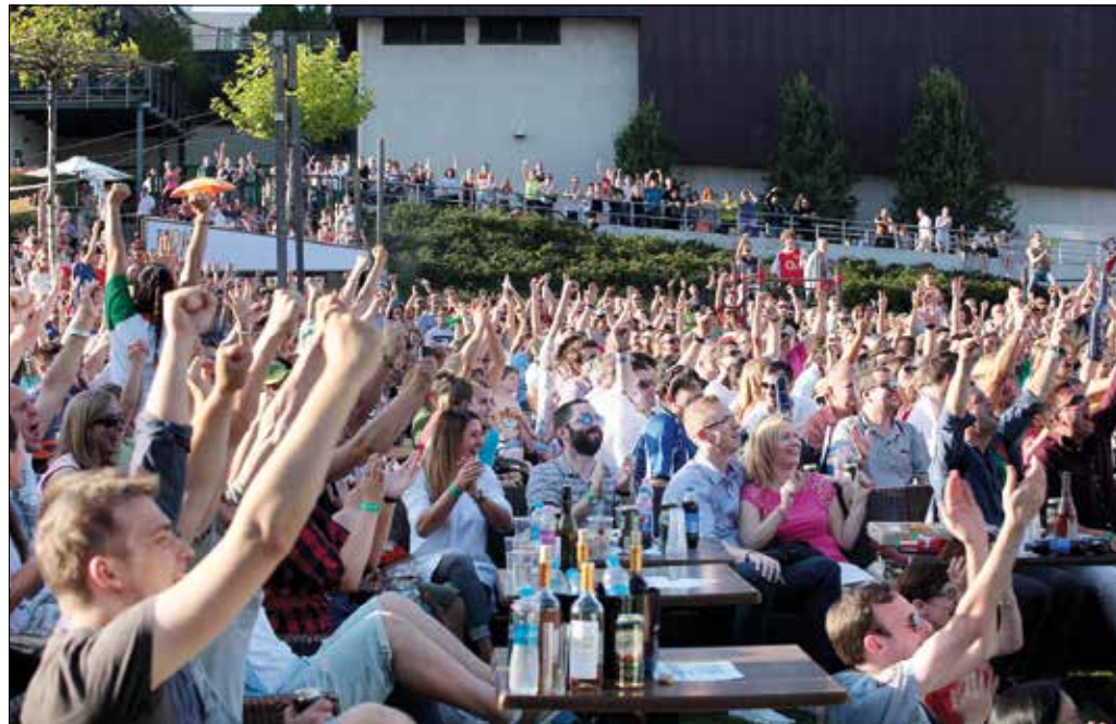
Góóó! – az Eb összehozta az embereket, mindenki önfelédten ünnepelte a labdarúgókat a MOM Beachen is