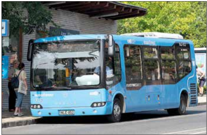
Olcsón fenntartható, környezetbarát és kényelmes