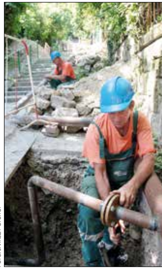
m. Vezetékfelújítás a Sirály utcában

Szintén elkészült az Agancs út Golfpálya út és Rege út közötti részén az útpálya és a járda burkolatának felújítása, míg a Hajnóczy József utcában újrarakták a tönkrement favermeket. Jelenleg is zajlik a Normafa-rehabilitáció második üteme, egyebek mellett futópálya és aszfaltjárda épül a területen.