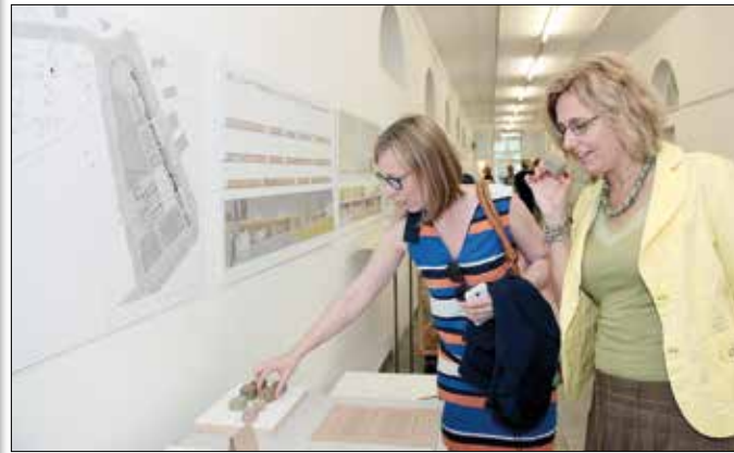
A főépítész és az alpolgármester az „illatos vályogot” veszi szemügyre