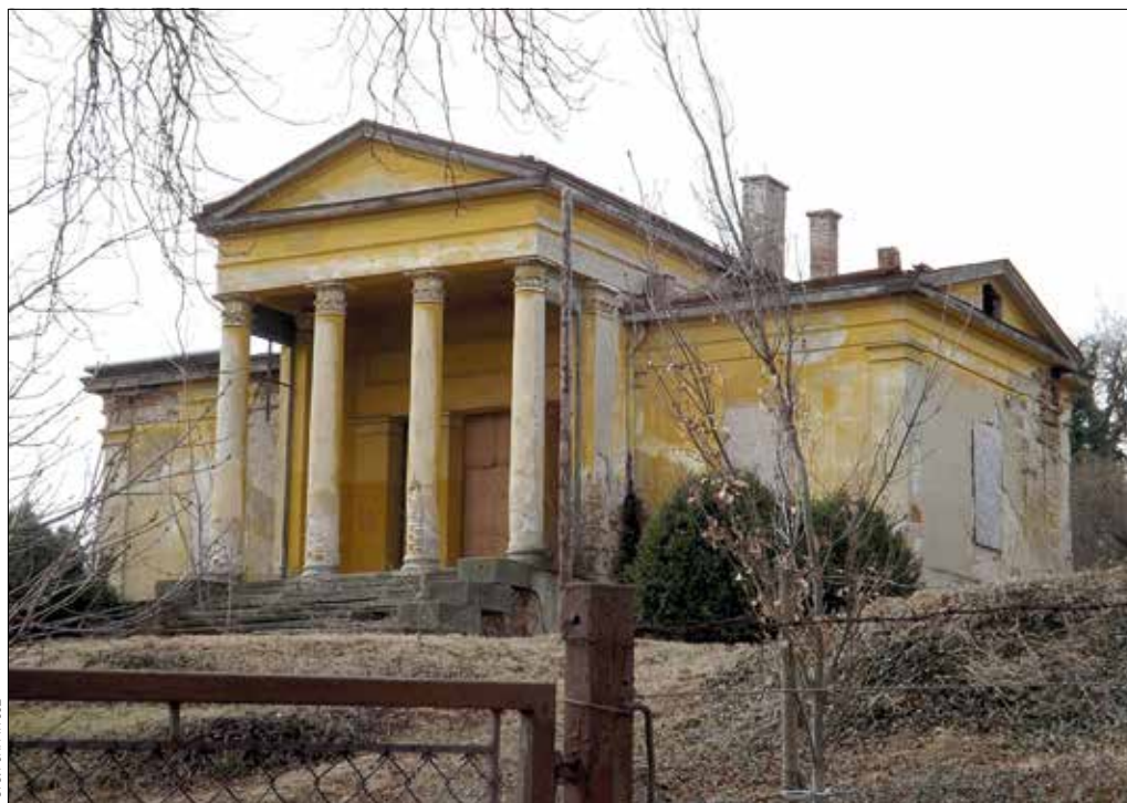
Ma már sajnos kevés látszik ebből, de a főépület és a park egykor a Hegyvidék kiemelkedő értéke volt

„Hild József, aki soha, még amikor az ország legfoglalkoztatottabb építésze volt, sem vitt un. nagy házat... Hírét, tekintélyét nem gyümölcsöztette, mint ahogy sokan tették, akik érdemekben meg sem közelítették őt, s így a szétfeszülő ér-