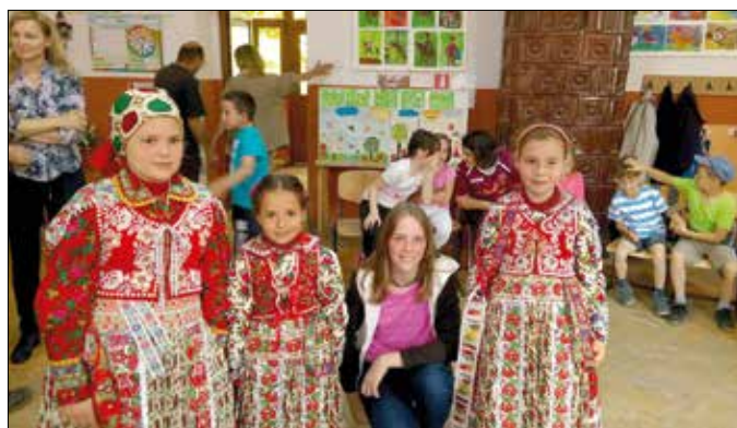
A magyarvistai gyerekek díszes népviseletben fogadták a vendégeket

Az Erdélyben található magyar irodalmi és nyelvi emlékek megismerése, valamint az ott élő magyar fiatalokkal való kapcsolatok kialakítása, elmélyítése volt a fő célja annak a kirándulásnak, amelyen a Jókai iskola közel negyven 7. osztályos diákja vett részt a kormány Határtalanul! programjának támogatásával.