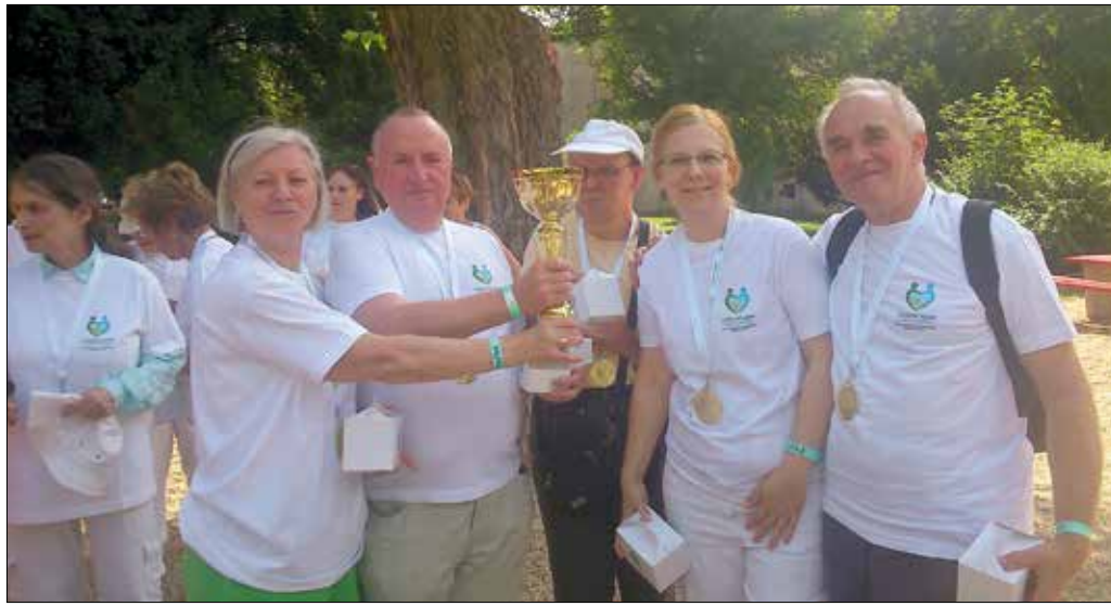
A győztes csapat tagjai már most eldöntötték, hogy jövőre is indulnak, szeretnék megőrizni a vándorkupát

A Szépkorúakért a Hegyvidéken program egyik célkitűzése az időskori sportolás és az egészséges életmód népszerűsítése. Sokan elfeledkeznek arról, hogy 60 év felett különösen fontos az egészségmegőrzéshez, a testi és szellemi jóllét megtartásához nagymértékben hozzájáruló fizikai aktivitás. Számos betegség – például az időskorban gyakori érrendszeri elváltozás, cukorbetegség és mentális zavar – jóval nagyobb eséllyel elkerülhető, akik gondot fordítanak a mindennapos testmozgásra. Ebben próbálnak segíteni a program szervezői azzal, hogy kellemes hangulatú, vidám, játékos sportnapokat rendeznek, amikre változatos, az idősök számára is