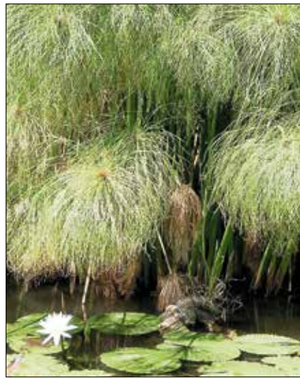
Szépen díszíti a kertet, a tavak partját

A fagymentes nyári hónapokra a szabadba is kihelyezhetjük. A közvetlen napfénytől eleinte érdemes óvni, de rövid szoktatás után és megfelelő öntözés mellett a nyári nap sem károsítja. A néhány hónapos nyaralás alatt a vízipálma