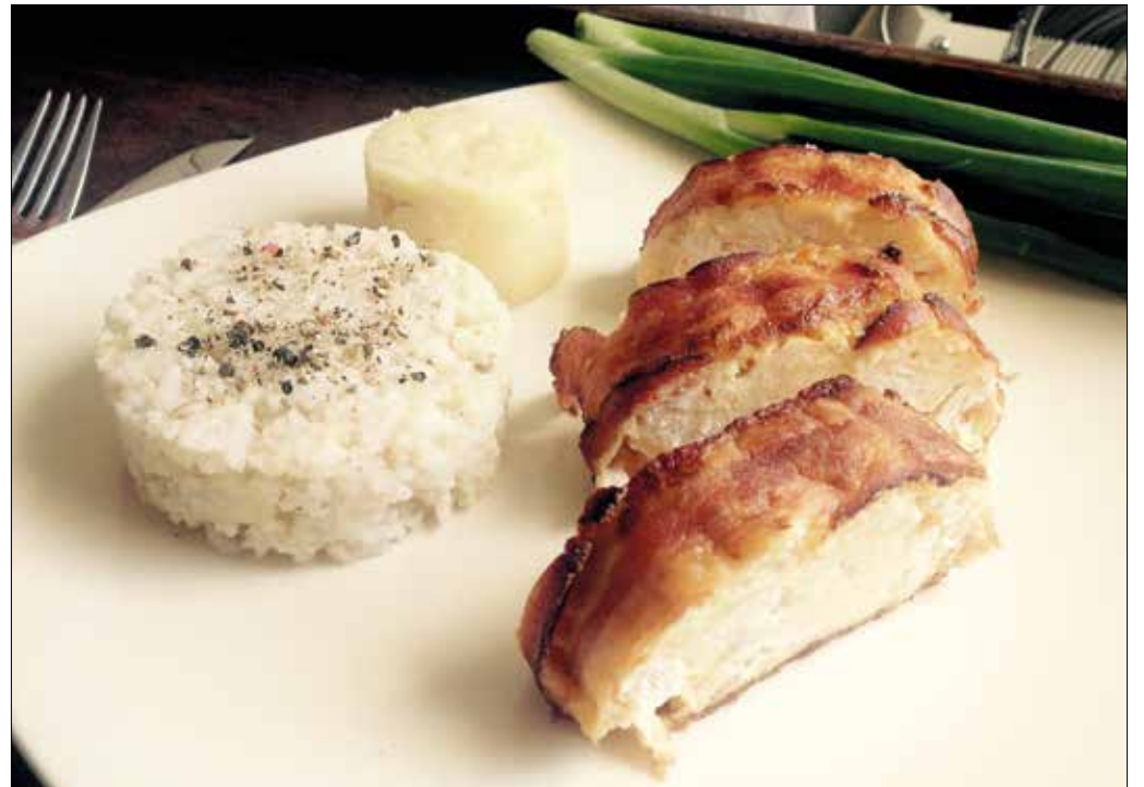
Csirke és bacon – nem lehet velük tévedni

A vizes piskóta titka, hogy lehetőleg minél többet megőrizzük a hozzá felvert habok állagából. A tojások sárgáját a vízzel könnyű, de sűrű, a fehérjét kemény habbá verjük. A