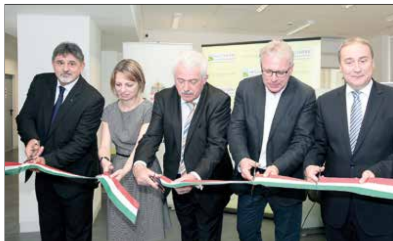
A Kiss János altábornagy utcai a 250. kormányablak az országban

A Széll Kálmán téri okmányiroda mellett a hatósági és a gyámügyi osztály is a Kiss János altábornagy utca 31-33/a szám alá költözött, ahol így már a kerületi hivatal hatáskörébe tartozó összes ügy elintézhető. A kerületi hivatal szervezetéhez tartozó Apor Vilmos téri kormányablak működését érintően nem történt változás, a Hegyvidék Központban lévő nagy forgalmú iroda változatlanul nyitva tartással fogadja az ügyfeleket.