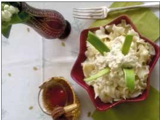
Könnyed kis juhtúrós tésztakalend

20 dkg sóska 2 ek olaj 2 ek liszt 2 ek tejföl 4 tojás