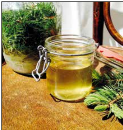
A fenyőpuncs hatásos és finom

A citrom csodás tulajdonságairól, a fenyőgyegek alternatív gyógyerejéről is szó esik ezen az oldalon, amelyen biztos sikert kínáló fogások sorakoznak. Az eperszezonra való tekintettel epres finomságokat is ajánlunk. Elsőként közöljük legkedvesebb, mascarponés epertortánk receptjét. Válgják egészségükre!