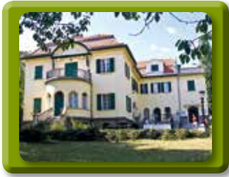
BAJOR GIZI SZÍNÉSZMŰZEUM XII., STROMFELD AURÉL ÚT 16. TELEFON: 356-4294 WWW.SZINHAIINTEZET.HU

A Nemzet Színészei. Emlékezés a jelenre. A legnagyobbak a legnagyobbak között, a legismertebbek a legismertebbek között, a magyar színjátszás királyai és királynői. A kiállítás látogatható: augusztus 28-ig, szerdától vasárnapig 14.00–18.00.