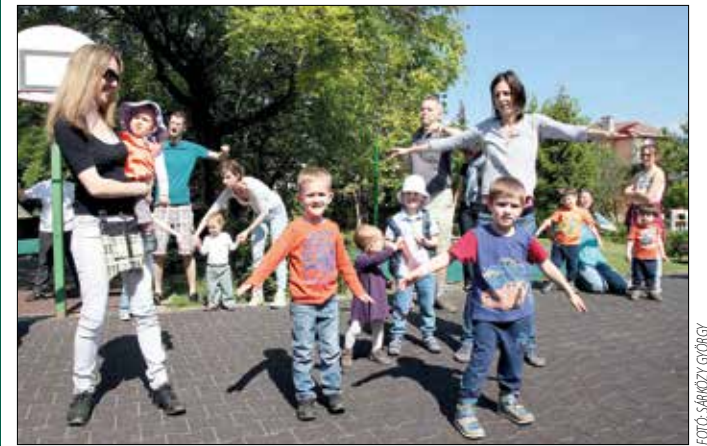
Közös bemelegítés az akadályverseny előtt

Szülők és gyerekek közösen teljesítették a játékos feladatokat a Táltos Óvoda és annak Csikó tagóvodája hagyományos tavaszi családi sportnapján. Az egészséges életmódra nevelés és a mozgás népszerűsítése fontos része az intézmény nevelési programjának, s ezt nagy sikerrel szolgálta a rendezvény.