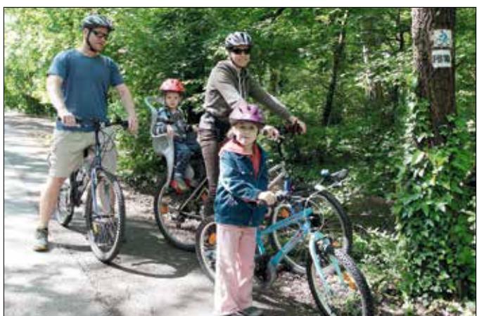
A szabadidő-kerékpárosok igényeit is kiszolgálja a Pilis Bike

Több száz kilométernyi biciklis útvonal áll mostantól a kerékpárosok rendelkezésére a Pilisben, valamint a Visegrádi- és a Budai-hegységben. A Pilisi Parkerdő Zrt. nagy szabású fejlesztését, a Pilis Bike projektet két fő célcsoport igényeihez igazították: egyrészt a túrázókerékpárosokhoz, akik minél változatosabb és hosszabb útvonalakon szeretnének kerekézni, másrészt a városban élő szabadidő-kerékpárosokhoz, akik örömmel Budakeszi és Telki között, a hideg-völgyi pihenőhelynél hoztak létre P+B pontokat. A vadsparkból például a Hideg-völgy, valamint Nagykovácsi felé indul egy-egy tartalmas túraútvonal, mintegy két-két és fél óra becsült menetidővel. A kijelölt túraútvonalokról részletes tájékoztatást a Pilis Bike honlapján, a www.pilisbike.hu címen találhatnak az érdeklődők.