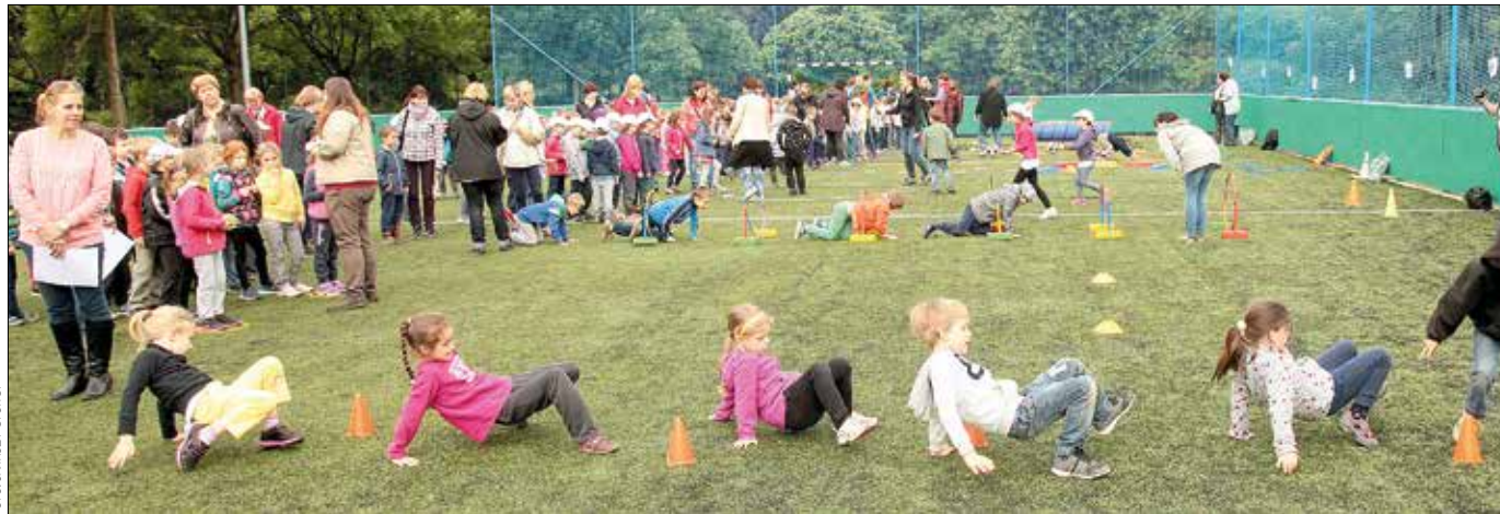
A különféle mozgások gyakorlása és fejlesztése elengedhetetlen az iskolaérettség eléréséhez, egyszersmind jó játék a gyerekeknek