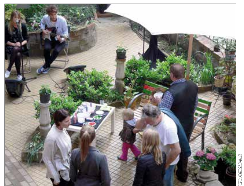
Vidám piknik zajlott a Városmajor utcai ház udvarán a díjátadó alkalmából

Az eddigi sikereken felbuzdulva a házban élők újabb pályá-