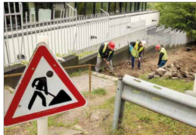
Megújul a Pethényi köz lépcsője