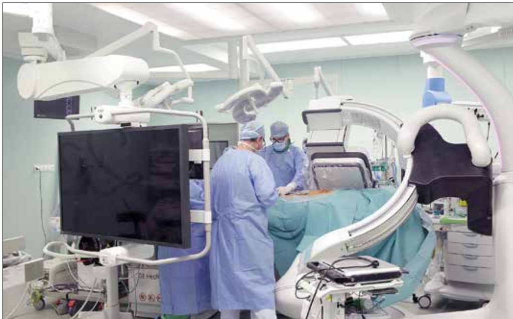
Operáció a hibrid műtőben

csak házon belül gondolkodnak, az önkormányzattal karöltve egy közeli, háromezer négyzetméteres ingatlanban szeretnék központosítani a nem invazív képalkotó központjukat. Ez, közvetlen összeköttetésben állva a klinikával, lehetővé tenné, hogy a nagyon közeli jövőben a szívkatéteres eljárások mellett stroke-katéteres eljárásokban is részt vehessenek, ami bár nagyon hasonló technikát igényel (Folytatás a 3. oldalon)