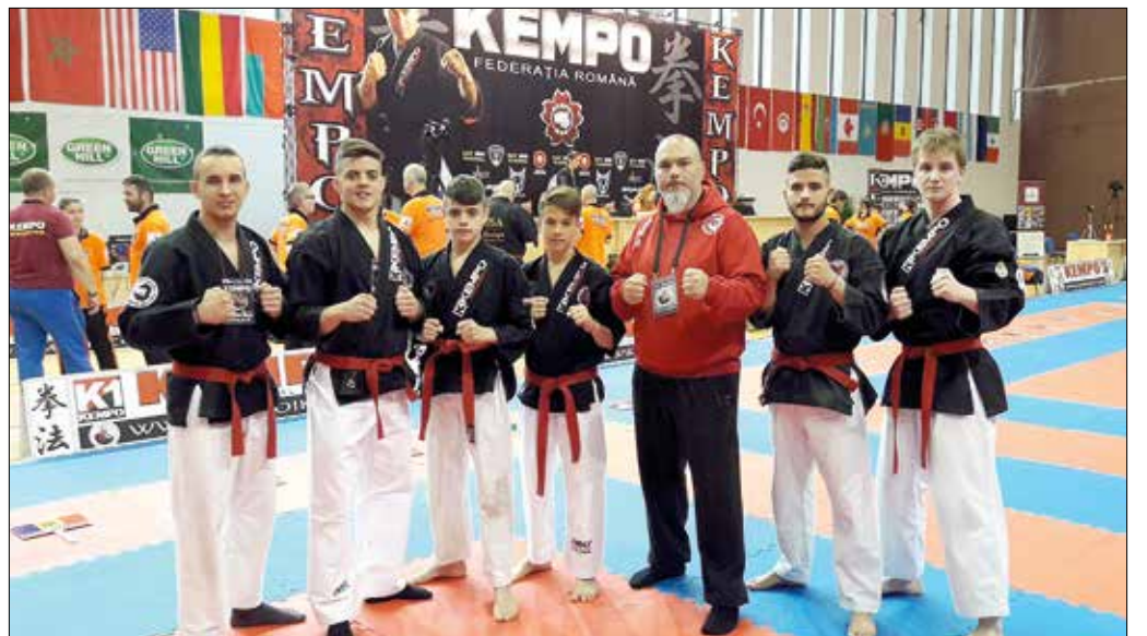
Sikeresek a sportban és a sportdiplomáciában is

A XIII. IKF Kempo Világbajnokságon összesen huszonnyolc ország legjobbjai vettek részt, a nemzetek végső rangsorában a 16 év alattiak világgupáját – a hegyvidéki harcosok nagyszerű teljesítmények is köszönhetően – Ma-