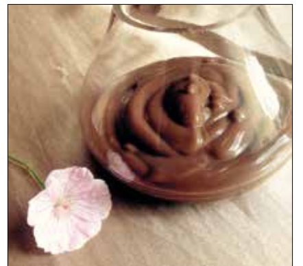
A házi csokipudingnak nincs vetélytársa

juk, megvárjuk, amíg szépen karamellizálódni kezd, majd hozzáöntjük a tejszínt. Ha felolvadt a hideg tejszíntől megkeményedett karamell, hozzáadjuk a vaníliarúd kikapart magjait, a vajat, a mézet és a fél csipet sót, majd kavargatva főzzük