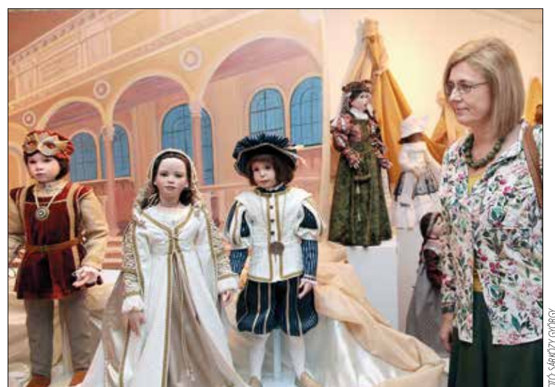
A kiállítás egyik fő ékköve a Rómeó és Júlia-jelenet

■ A közönség június 3-ig tekintheti meg a kiállítást a Hegyvidék Galériában (XII., Városmajor utca 16.).