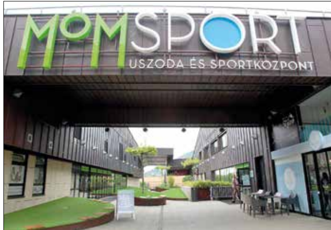
Egyre szélesebb körben válik ismertté a MOM Sport neve

Újabb közönség- és szakmai díjakkal gazdagodott a Magyar Fürdőszövetség „5 csillagos uszoda” nemzeti védjegyét birtokló MOM Sport. A minősítést tavaly végezték el először, és a hat hónappal későbbi ellenőrzésen az