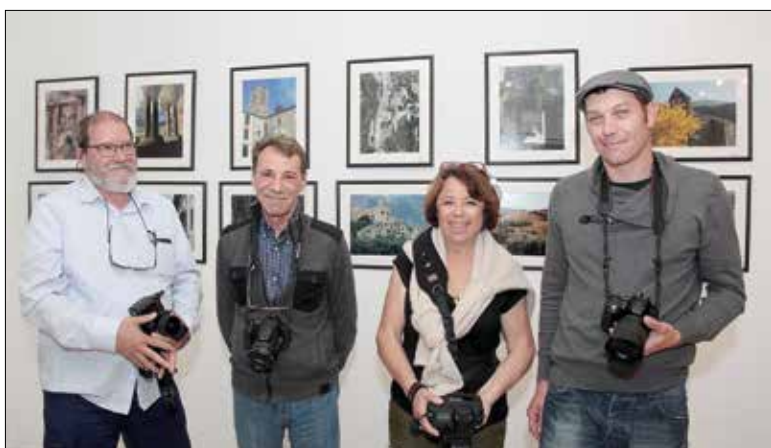
Budapesten készült fotóikat a vendégek szeretnék bemutatni a katalán közönségnek

Négy francia fotós Perpignanról és Észak-Katalóniáról készített képei láthatók május végéig a Livia-villában. Egyikük egy nemzetközi körversenyt nyert meg a Diószögyényi Énekkaral, s az ismerettségéből barátság, valamint egy kiállításra szóló meghívás lett.