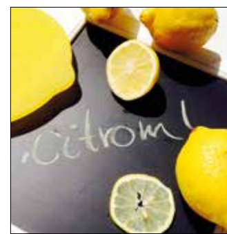
Csodás ereje van

felvágás előtt kicsit felmelegítjük, vagy tenyerünkkel az asztal lapján görgetjük. Ha csak pár csepp lére van szükségünk, ne vágjuk fel a gyümölcsöt, mert úgy nagyon gyorsan kiszárad. Elég, ha beleszúrunk, és ki-nyomjuk a szükséges mennyiségű levet.