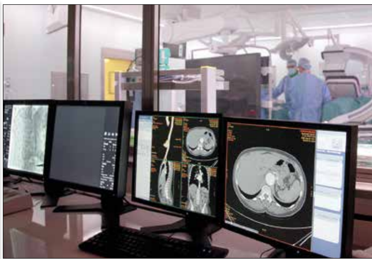
Innen is követhető a műtőben folyó munka