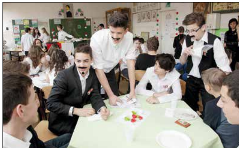
Petőfi, Jókai és társaik forradalmi hevülettel lelkesítették a többieket

Ezt a felemelő, forradalmi hangulatot, a nemzeti összetartozás megnyilvánulásának legszebb pillanatait elevenítették fel a Virányos Általános Iskola diákjai és pedagógusai, akik az intézmény falai közt berendezték a saját Pilvax kávéházukat. Az ünnepet megelőző napokban az egyik tanteremben a magyar trikolor színeiben pompázó papírvirágokkal díszített asztalok, a diákok festményei, rajzai, pla-