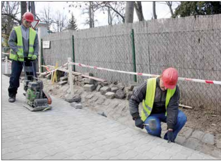
Mintegy százméteres szakaszon átépítik a Vilma utcai járdát

Több helyen 15-20 centi mély süllyedések keletkeztek a Bűrök