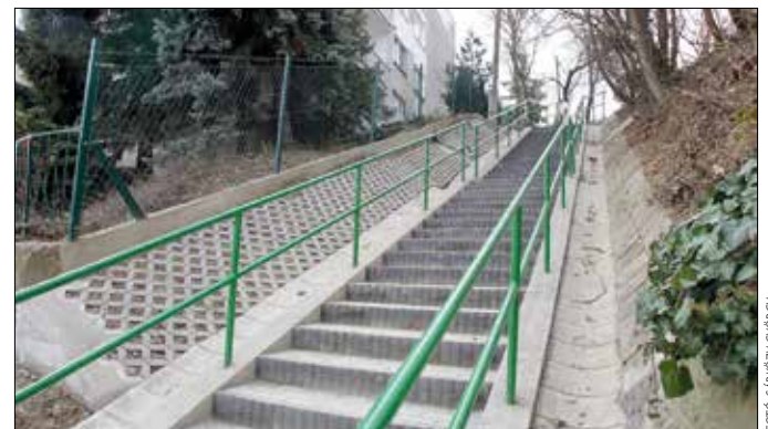
Már használhatják a gyalogosok a megújult Alma utcai lépcsőt

Az előző évekhez hasonlóan az idén is jelentős út-, járda- és lépc- sőfelújításokat végzett a Hegy- vidéki Önkormányzat a tavaszi és nyári hónapokban. A kommunális adókból származó bevétel felhasználásával a karbantartási munkák mellett jelentős fejlesztésekre is számítani lehet a XII. kerület több pontján.