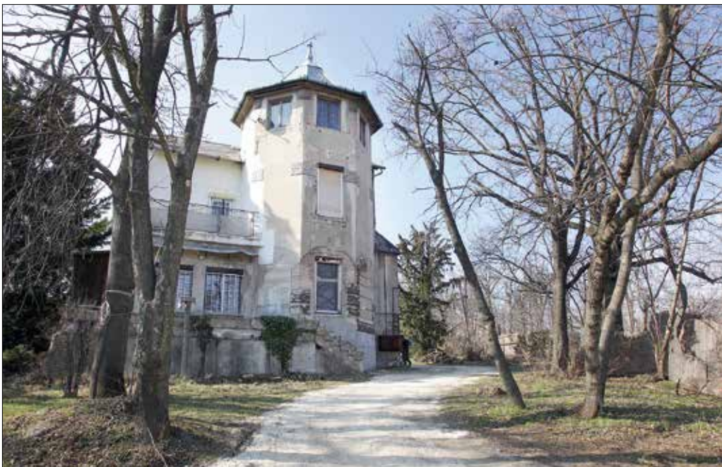
A helyreállítandó Eötvös út 48. szám alatti villa is kiszolgálófunkcióknak biztosítana helyet