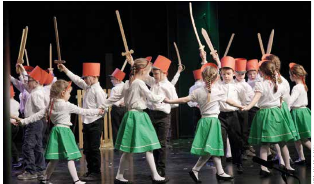
Verbuválás – a Zugliget Óvodába járó gyerekek ünnepi műsora