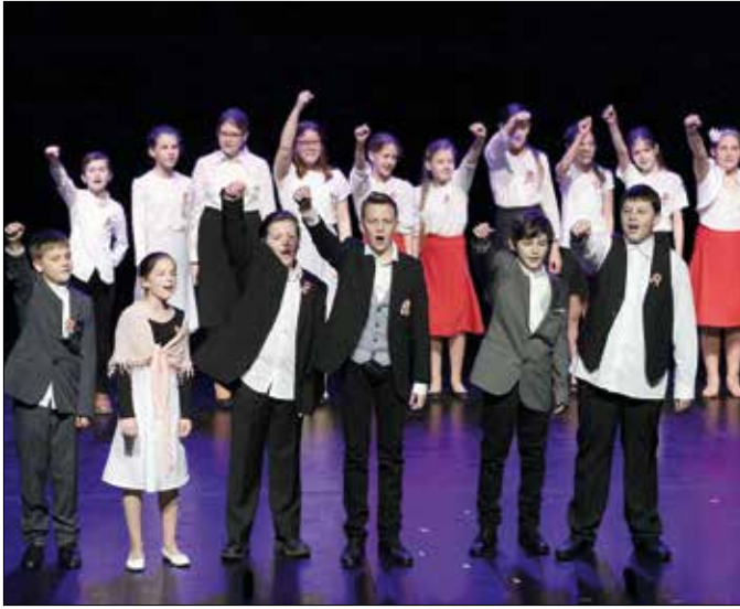
Örömműnnepe ez a nap (részlet a Virányos iskola diákjainak műsorából)