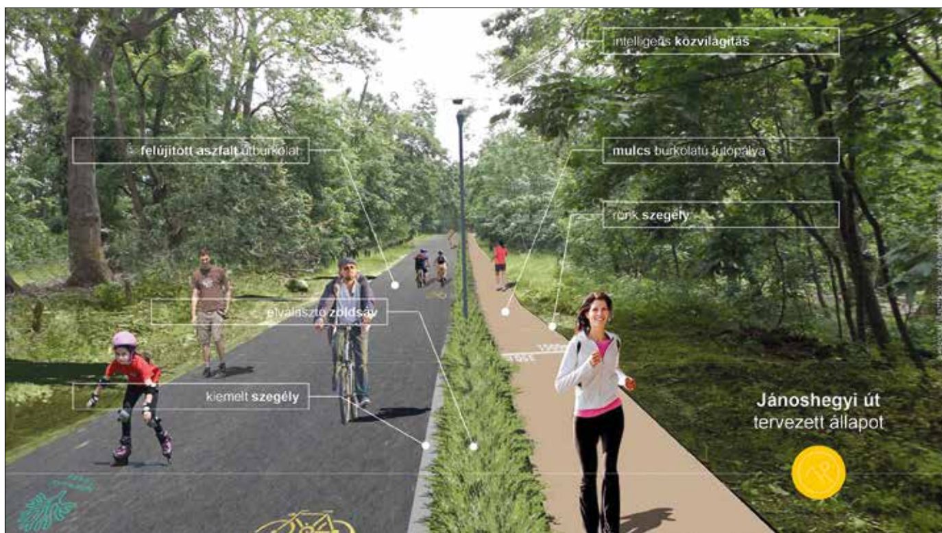
A leendő futópálya látványterve