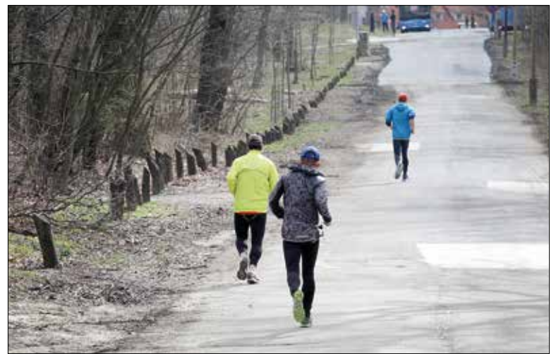
Aszfalt helyett izületkímélő pályát használhatnak majd a futók