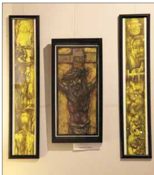
Károlyi András: Triptichon

A kiállítás tehát nemcsak a feltámadás, a viszontlátás és a remény örömeit hivatott bemutatni, de segít válaszolni arra a kérdésre