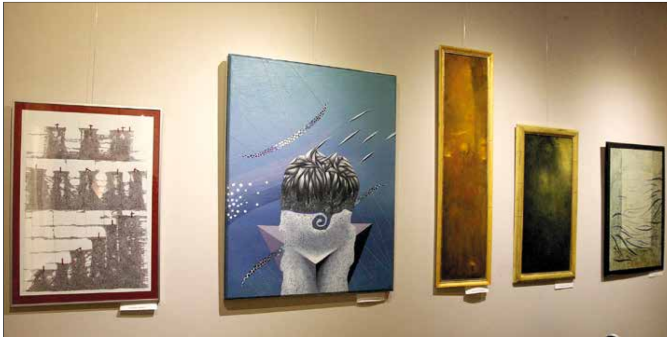
A Galéria 12 Egyesület alkotói megmutatják, lelkileg mit jelent számukra az ünnepek ünnepe

Húsvét legszűkebb értelemben kétnapos ünnep, húsvétvasárnapot és húsvéthétőt foglalja magába, ám – hasonlóan a karácsonyhoz – az ünnepet előkészítő és az azt követő időszakok is szervesen hozzá kapcsolódnak, ebben az értelemben beszélünk húsvéti időről. Ez csaknem száznapos időszak, ami a negyvennapos nagyböjttel kezdődik, és a húsvétot negyven nappal követő áldozócsütörtökkel (Jézus Krisztus mennybemenetelének ünnepével), valamint a további tíz nappal későbbi pünkösddel zárul. Ez utóbbi időszakot nevezzük szent ötvennapnak. A