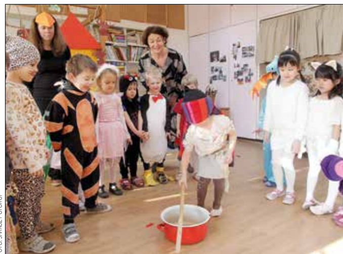
Az óvodapedagógusok munkájában a személyiségüknek is nagy a szerepe