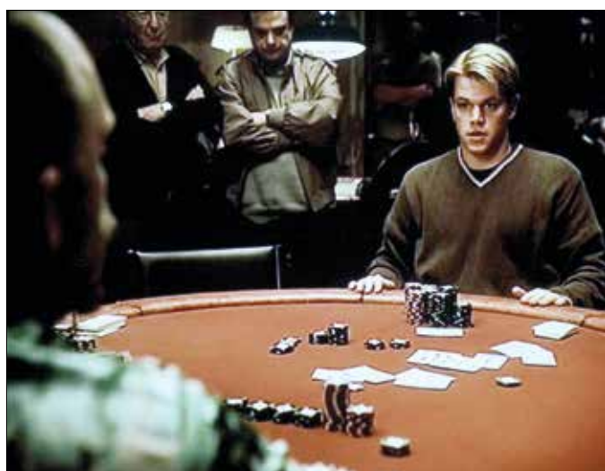
A Pókerarcok főszereplője: Matt Damon