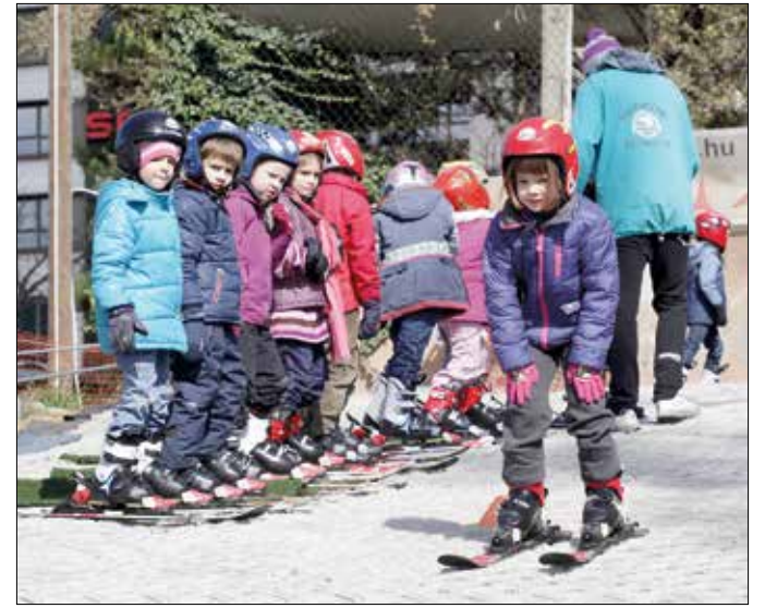
Nem síbajnokok lesznek, a rendszeres mozgás a fontos

„A programmal nem síbajnokokat kívánunk nevelni, hanem a