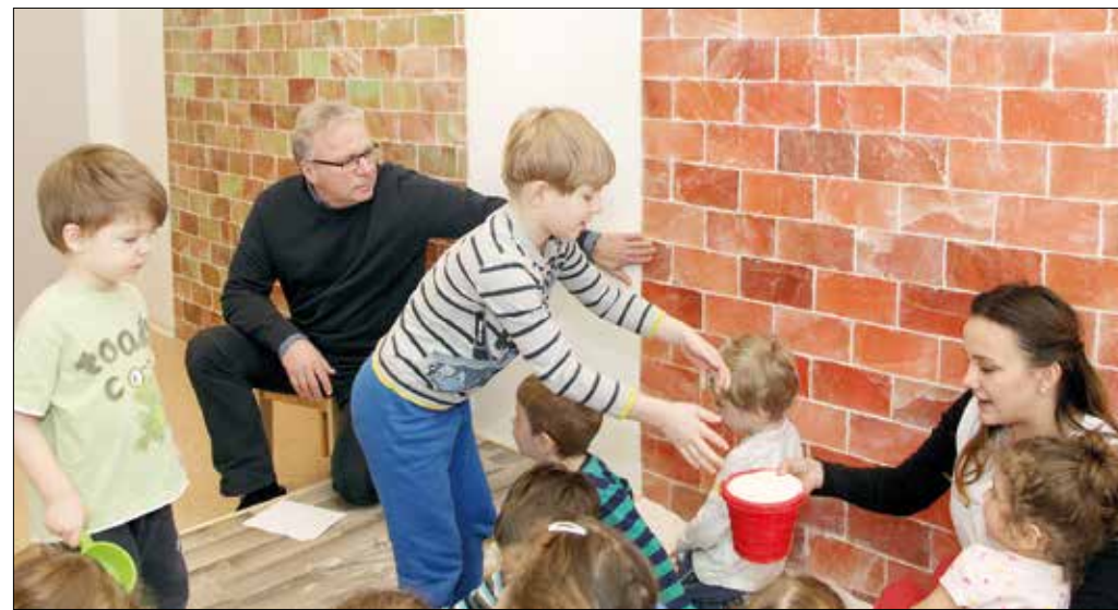
A parajdi sötéglákból álló fal mögött állítható színű LED-világítás van

A XII. kerületi óvodákban, ahol volt rá hely, az elmúlt években mindenütt kialakították szószobát. A tavaly szeptemberben megnyílt tagóvoda terápiás helyiségének létrejöttét az Ader János által alapított „Tégy a parlagfű ellen!” Közhasznú Alapítvány támogatta 1,7 millió forinttal.