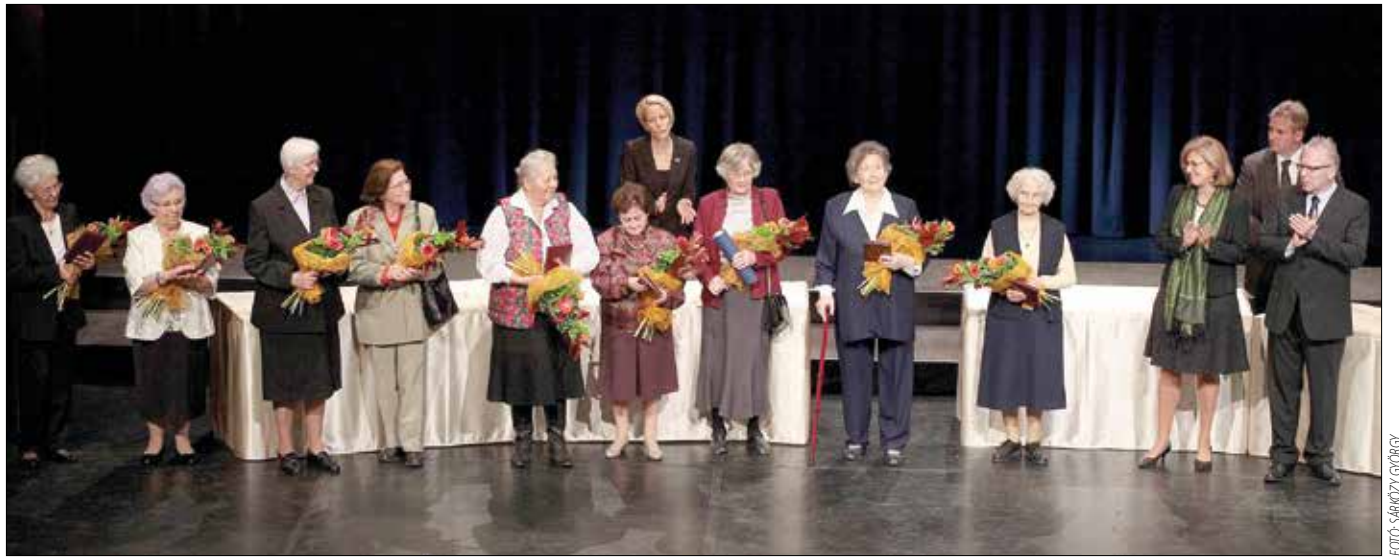
Hosszú és eredményes munkájukat elismerve nyugdíjas pedagógusokat köszöntött az önkormányzat az ünnepségen