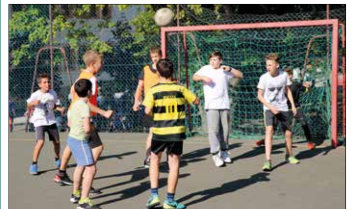
Fociban is megküzdöttek egymással a felsősök

Hagyomány, hogy a Virányos Általános Iskolában összel családi sportnapot rendeznek a diákoknak és szüleiknek. Az idén sem volt ez másképp, a nap ráadásul egybeesett az Európai Diáksport Nappal, a szervezők ezért még látványosabb programokkal készültek.