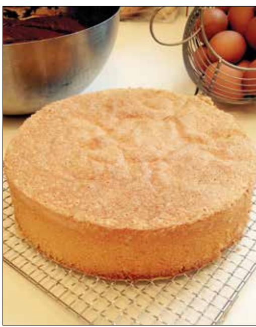
Rácson hűtsük ki, hogy eltávozhasson a felesleges gőz

Ezután elzárjuk a sütőt, és az ajtaját nyitva tartva a megsült tésztát még legalább