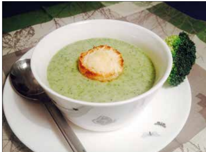
Ennél a levesnél a kalap a lényeg

A kalapos levest minden gyerek szereti. Szinte bármit adhatunk nekik, úgyis a kalap a lényeg.