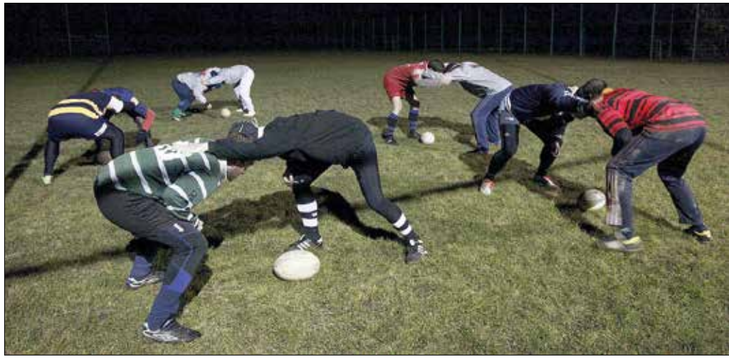
A fizikai felkészülésre és a technikai képzésre egyformán nagy hangsúlyt helyeznek az edzéseken