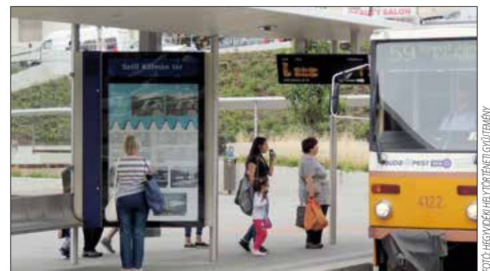
Tudást szerezni és játszani is lehet a villamosmegállóban