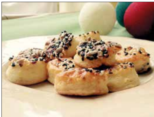
Szerény, de finom vendégváró pogácsa