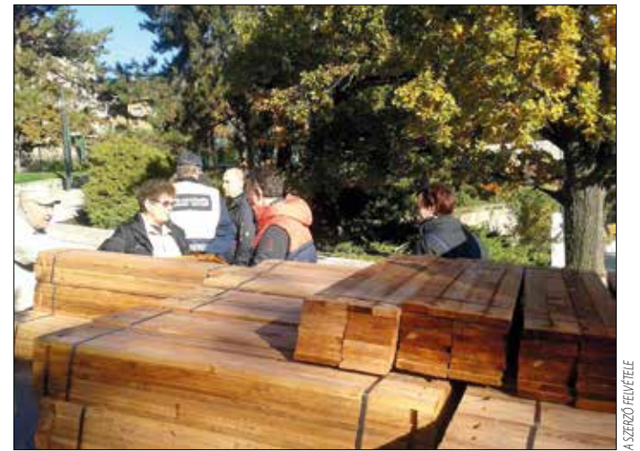
A lécekből bárki könnyen össze tudja állítani a komposztálót