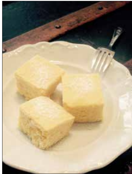
Régi ünnepek fénypontja volt a prósza

A szegénység nagy tanítómester, találmónnyá teszi az embert, aki aztán minden apróságot jobban megbecsül, értékkel. Drága emlékeztető nagypapám, aki a híres somogyi „rosseb-ezred” vitéz katonája volt a „Nagy Háborúban”, sokat mesélt nekem egykor a kis vaskályha pattogó tűzénél a gye-