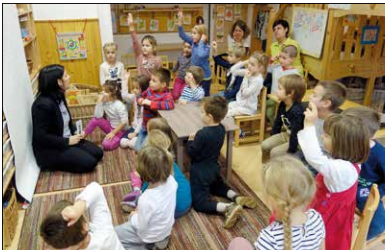
Nagycsoportosok, akik tudósok akarnak lenni

Ki szeretne tudós lenni? – kérdezte a Kíváncsiak Klubja legutóbbi foglalkozásának résztvevőit, a Csermely úti óvodásokat a Bugyulófalva Szociális Szövetkezet két munkatársa. Mindenki