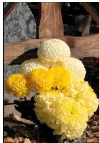
A temetők virága is

Ehhez időzíteni kell a virágzást, amit elsősorban az ültetés idejével, a visszacsipéssel és a megvilágítás hosszával érnek el a kertészek. Szerencsére a krizantém jellemzően őszi növény, akkor kezd kibontani szirmait, amikor a sötét időszak hossza