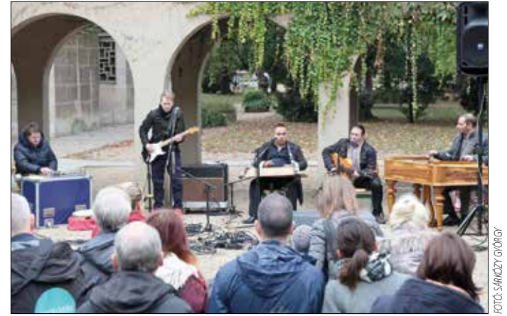
Számik és romák zenéltek együtt a termelői piacon

úttal székelykaposztjával ara- kialakított alkalmi színpadon. A