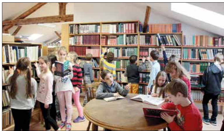
„Kuckós”, kellemes hangulatú helyiség, hamar megkedvelték a diákok