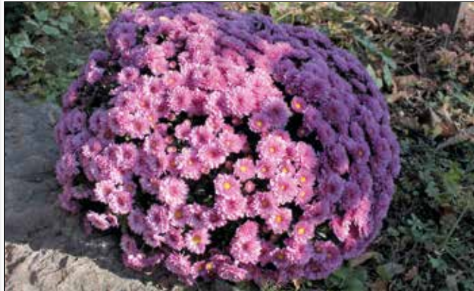
Leginkább a kis virágú krizantémet érdemes kertben nevelni

Nálunk főleg a temetők környékén láthatjuk halottak napja idején, pedig a krizantém sokoldalúan használható kerti dísznövény és vágott virág. Termesztése nem problémamentes, változatos megjelenése miatt mégis érdemes vele foglalkozni.