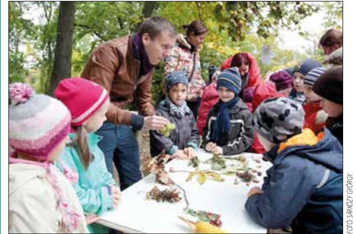
Az őszhöz kapcsolódó természetismereti játékok várták az óvodásokat

A kert másik részén a fűben, bokor tövében elrejtett őszi terméseket kutatták fel a gyerekek, aztán a terméseket és a faleveleket párosították össze. Őszi témaként a szőlőszüret és a népi hagyományok is előtérbe kerültek: népviseletbe öltözött pedagógusok a szüreti mulatságok világát felidézve hívták táncba a csapatokat.