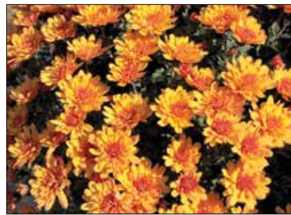
Színek tekintetében széles a paletta

A krizantémok közül számunkra az elmúlt napokban a temetőknél kapható hatalmas fejű vágott virágok voltak a legfontosabbak. Ezek nevelése külön művészet, hiszen csak egy nagyon rövid időszakban van rájuk ekkora piaci kereslet. Lehet gyönyörű a virág október közepén, vagy november második felében, mégis sokkal kevesebbet érdekel, mint a halottak napja idején. Fontos tehát, hogy a virágok tömege épp ekkor pompázzon a legszebben.