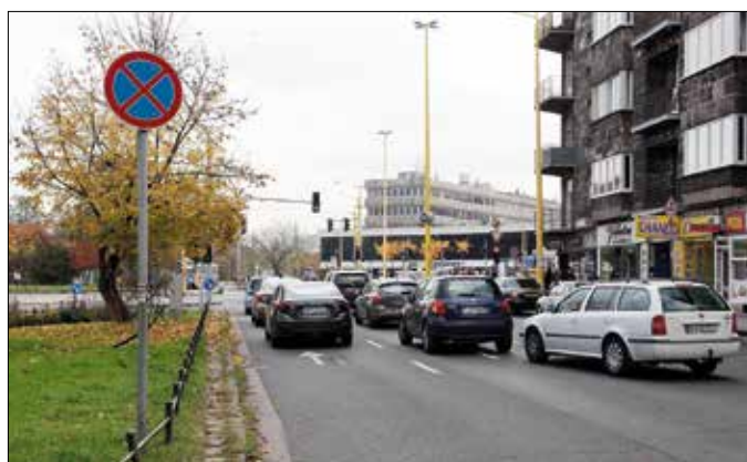
Két sáv egyenesen, kettő jobbra – balra nem lehet kanyarodni