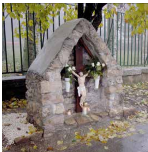
Mindig van mellette virág vagy mécses

vendéglőt. Ez a Svábhegyen, a Költő utca 9. szám alatt, az általános iskolával szemben, a Költő utca és Diana utca sarkán állt egykor.