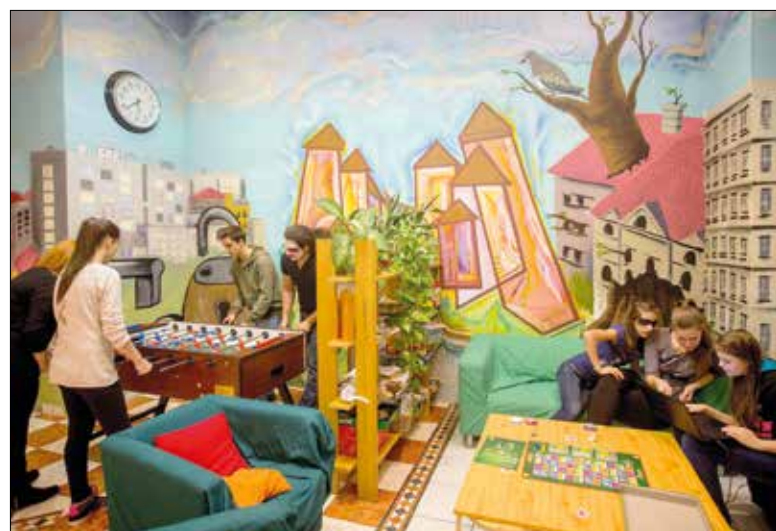
A családsegítő egyik újszerű kezdeményezése az Ifjúsági Közösségi Tér