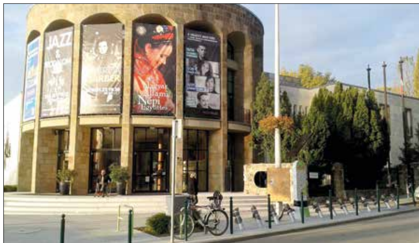
Az öt hegyvidéki állomás egyike a MOM Kulturális Központ előtt lesz

érdekében tömör gumikkal szerelték őket, ami tökéletes védelmet jelent a defekttel szemben, de ezért a komfort hiányával kell fizetni. Ettől függetlenül lejtmenetben az új állomásokról egy kellemes, laza tekeréssel elérhető