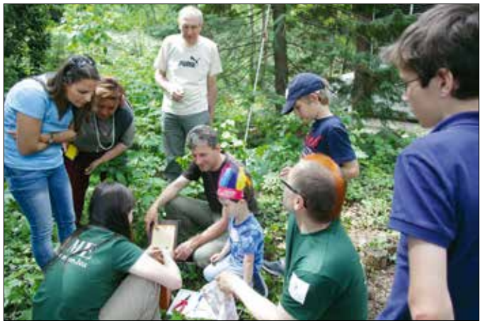
Családi napra várják a vendégeket a Jókai-kertben

tal szervezésében. Az igazán nagy feladat az objektumok tulajdonosaira, működtetőire, kezelőire hárul, mivel ők vállalják, hogy a látogatók számára hozzáférhetővé teszik értékes, szép épületeiket, gyűjteményeiket. Minden esztendőben egy-egy központi téma köré szerveződik a program, oly mó-