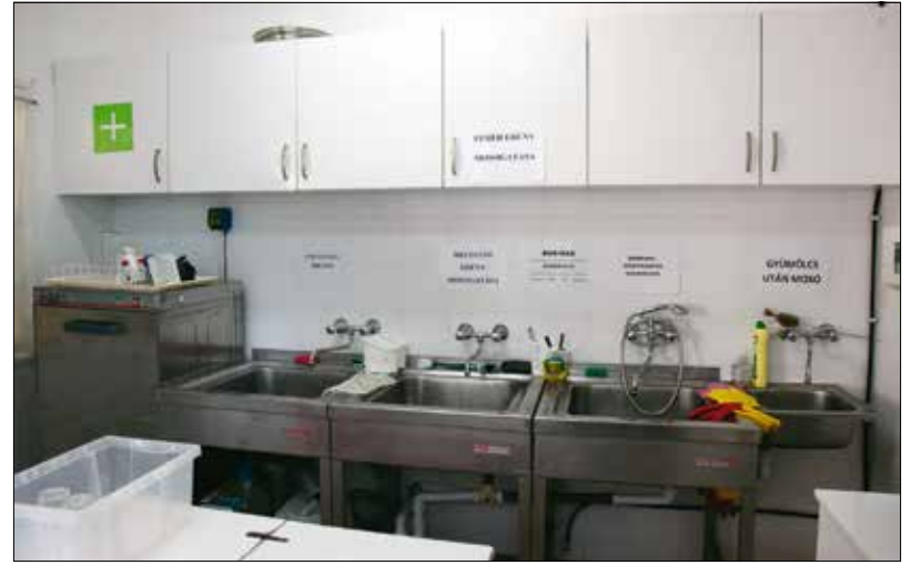
A Normafa Óvoda korszerű, praktikus konyhát kapott

és a szellőzés biztosításával megszüntették az alagsori logopédiai helyiség falainak nedvesedését,