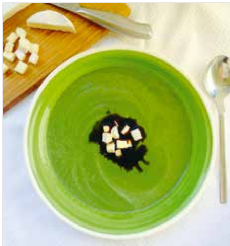
Egyszerű, mégis izgalmas leves

50 dkg finomliszt 2 csipet só 1 tk cukor 1 tojás 1,5 dl hideg víz 1,2 dl hideg tej 2 dkg friss élesztő 25 dkg vaj ½ kg alma meghámozva, vékony cikkekre szeletelve 1 tk fahéj 4-5 tk vaníliás cukor 1 ek vaníliakivonat 20 dkg mascarpone vagy más natúr sajtkrém 5 dkg ricotta ½ citrom leve és leresztelt héja 3 ek porcukor 1 ek tej