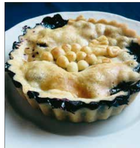
Erdélyi áfonyapálinka nélkül nem az igazi

30 dkg rétesliszt 15 dkg vaj 3 ek cukor 1 tojás sárgája kb. 1 dl tejföl 1 csipet só 1-1 ek búzadara 1-1 ek kristálycukor 3-3 marék áfonya 1-1 kupica áfonyapálinka