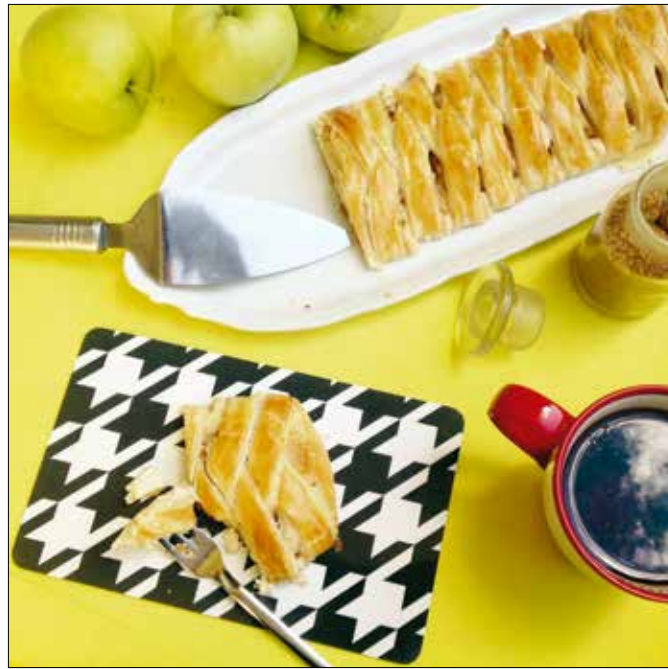
Almás süti: gyors, reggeli kávéhoz, teához illő csemege

50 dkg friss paraj 1 fej salotta hagyma ½ dl tejszín ½ l csirke alaplé diónyi vaj 1 camembert tökmagolaj a díszítéshez