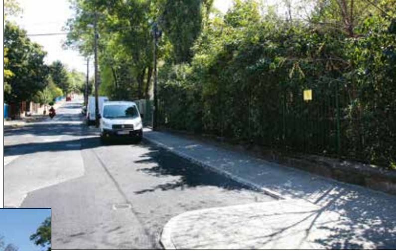
Parkolók épültek a Virányos Általános Iskolánál

Az év legnagyobb útfejlesztése zajlott a Határőr út kerületi fenntartású, Ráth György utca és Gaál József út közötti, 400 méteres szakaszán, amely teljesen megújult. Az egyirányú forgalom biztosítása érdekében a munkálatokat több ütemre osztották, ennek köszönhetően