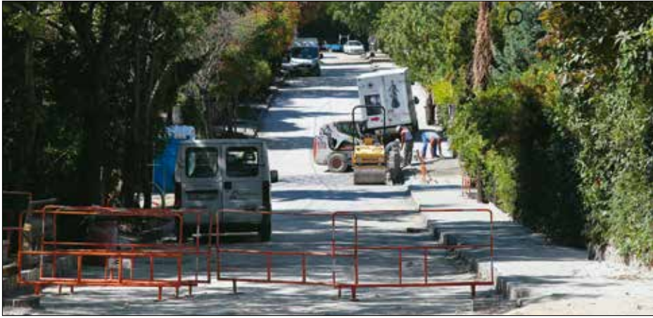
Hamarosan befejeződik a felújítás

az egyébként szabályosan parkoló autók miatt a szembejövő járműveknek sok helyen félre kell állniuk, mert nem férnek el egymás mellett. Ez lassítja, nehézkessé teszi a haladást, ráadásul akadá-