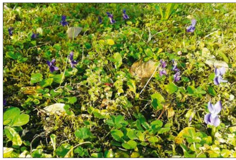
Mohás és virágos gyeptelepítés

lan átkeléssel tönkre lehet tenni sok hét munkáját, ezért a háziállatokat, a vendégeket és a gyerekeket érdemes távol tartani a frissen telepített fűfoltoktól. Aztán ha az egyre bokrosodó fűcsomók megerősödnek, újra mindenki birtokba veheti a kert gyepes területeit. (Barta)