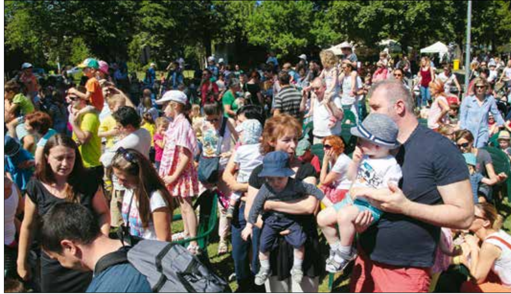
A jó programok és a jó hangulat minden évben garantált