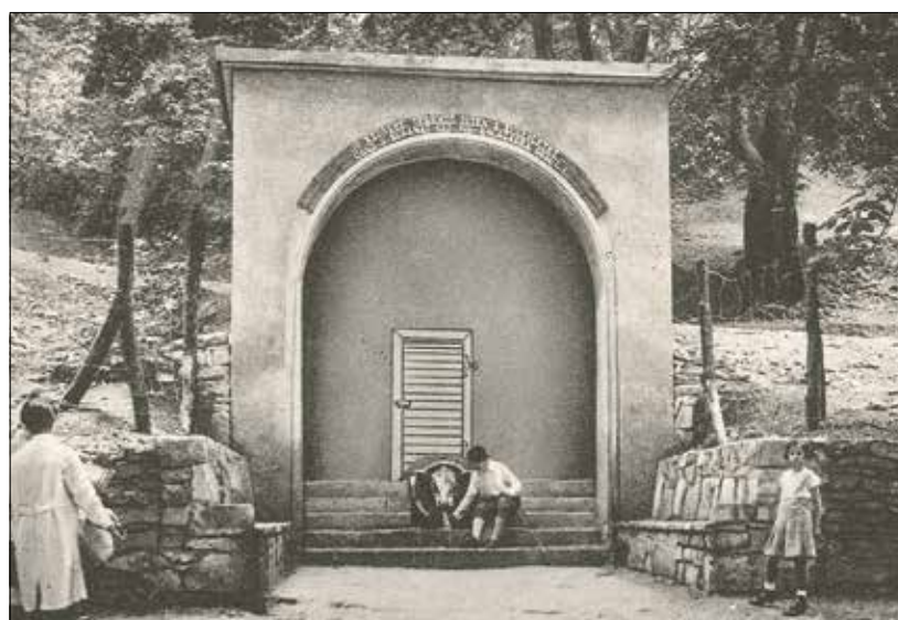
A Disznófó-forrás, homlokzatán Vörösmarty Mihály híres mondatával

„Pünkösdi napján a ligetben víg emberek sokadoznak: zöldelő fák árnyékában heverésznek, játszadoznak.” (1894)