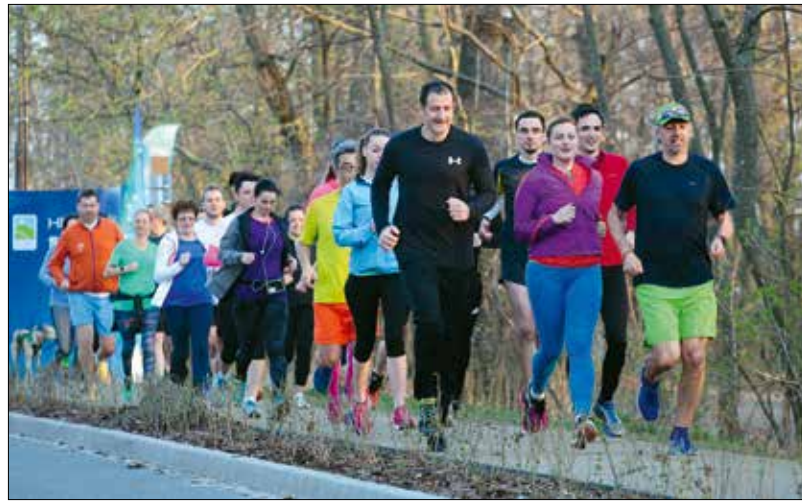
Aki nyáron lazított, most újrakezdheti

Ha az időjárás lehetővé teszi, a közeli városmajori parkban vagy a sportközpont udvarán mozoghatnak (ingyensen) a kerületi iskolások, rossz idő esetén pedig a sportközpont tornaterme is rendelkezésre áll. A tervek szerint lesznek sorversenyek, foci, asztalitenisz, labdolt-labda, aerobik, számháború, tánc és más csapatversenyek, bizonyos létszám felett pedig még különlegesebb lehetőségekkel, például íjászattal,