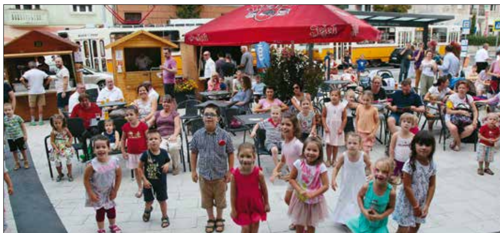
A Sörfesztivál igazi családi esemény volt

a fesztivál kezdeteire. – Pár évvel ezelőtt született az ötlet, hogy az Oktoberfest példájára a kerületben is jó lenne rendezni egy hasonló mulatságot. A kezdeményezésünk megtetszett az önkormányzatnak, így a támogatásukkal átköltöztettük a rendezvényt a Lívia-villából a Városháza térre. Országszerte sokféle fesztivál van, de a hegyvidékihez hasonlót nem ismerek – ezen a háromnapos programsorozaton lehetőségünk van bemutatni a német nemzeti-