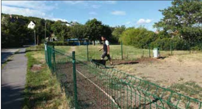
Októberben már az ivókutat is használhatják a kutyusok

A gazdák igényei között a kutyáik által használható ivókút kiépítése, valamint kisebb agilitatyafuttatóban a környékről oda