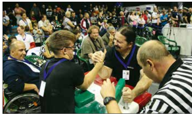
Óriási küzdelmek várhatók a népes mezőnyben

A 69 fős magyar csapattól tíz érmet, köztük három aranyat vár a szakvezetés, különösen a parakategóriában számítanak esélyesnek a hazaiak. Külön is érde-