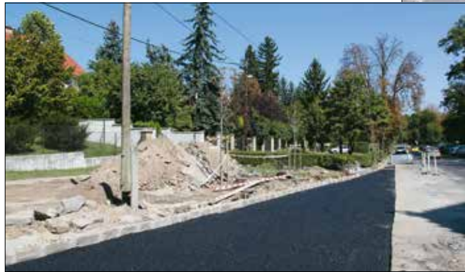
Készül az új nyomvonal a Zugligeti úton