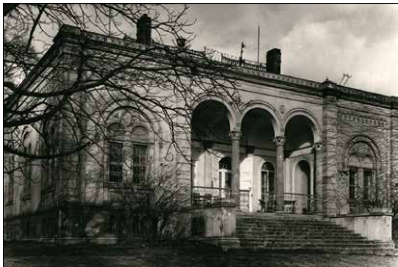
A Róza-villa (Budakeszi út 36/b) Ybl Miklós tervei alapján készült, romantikus stílusban

vette birtokba. Ők felújították a hadműveletek során elpusztult szőlőket, és újakat ültettek; a szőlőterületeket kisebb-nagyobb darabokban budai polgárok kapták meg.