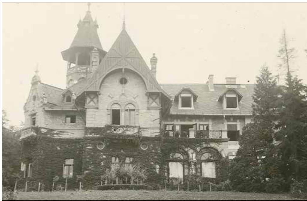
Szent József-villa (Budakeszi út 87.)

Az első épületek közül napjainkban mindössze kettő áll még a Zugligetben: az egyik a Janka út 4/b, a másik az Árnyas út 40. szám alatt található. A kettő közül a Janka úti a régebbi, így nyugodtan kijelenthetjük, hogy a Czillich-major a XII. kerület legöregebb, ma is létező lakóépülete. Az egykori majorosház pontos „születési” dátumát nem ismerjük, de az 1770-es években ké-