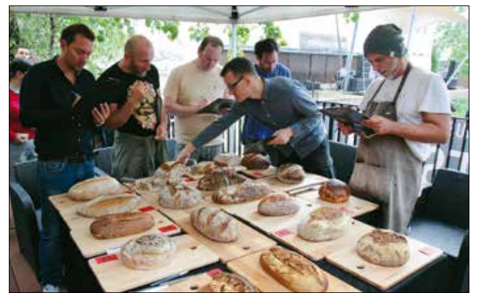
A sütőverseny zsűrijének nehéz, ám annál hálásabb feladata volt

„A fesztivál sikerre van ítélve! Egy nagyon sokat szenvedett műfajról van szó: a tömegtermelés és a gyengébb minőségű lisztek igen rossz irányba vitték el a kenyeret. Szerencsére vannak még olyan pék-