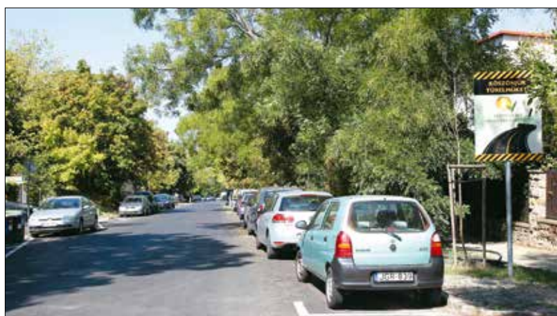
A Határőr úton befejeződött az év legnagyobb útépitése

járdaszakaszt, aminek köszönhetően a Nagysalló utcából immár biztonságosan elérhető a Németvölgyi úti leágazásnál kialakított zebra. A Sün utca megközelítését javítja a Kikerics utca irányából kiépített térköves járda, továbbá az ahhoz csatlakozó, korláttal ellátott lépcsősor.