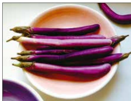
Édesebb, mint dundi rokona

dig Olaszországban igen népszerű csemegének számítanak. Eszik lisztből és forró vízből készített panírba mártva, forró olajban kisütve, hallal és datolyaparadicsommal összepírítva, és készíte-