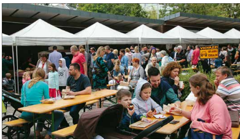
A szervezők szerint a legfontosabb feladatuk, hogy visszahozzák a köztudatba az igazi kenyér fogalmát