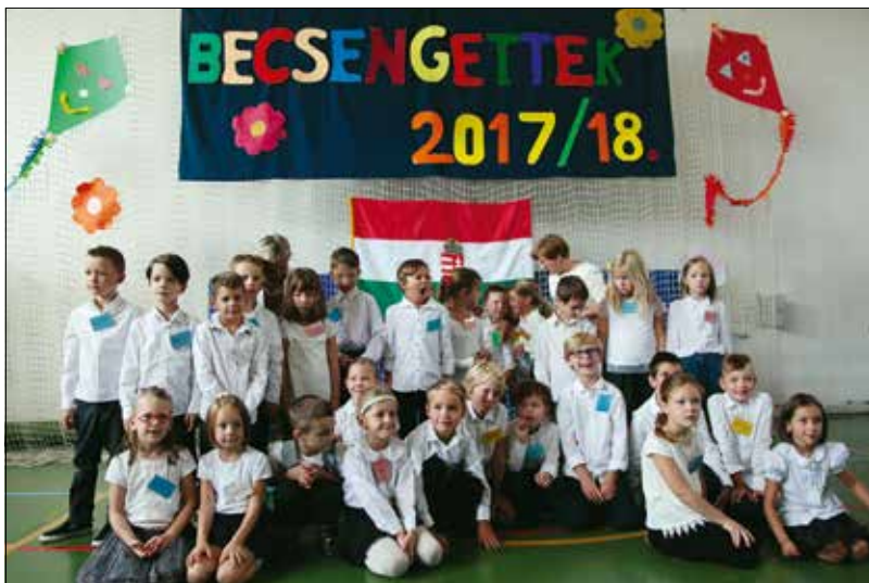
A Zugligeti Általános Iskolában is becsengettek