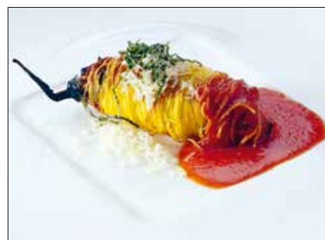
A feldolgozás alatt elveszíti lila színét

egy padlizsán 4 gyöngypadlizsán 20 dkg cernametélt 20 dkg ricotta 2 dkg reszelt parmezán 2 ek olívaolaj ½ hagyma 2 dkg bazsalikom 2 tojás sárgája 5 g safrány só, bors bő olaj a sütéshez kukoricakeményítő 20 dkg érett paradicsom ¼ fehér hagyma 5 dkg bazsalikom 2 gerezd fokhagyma 2 ek extra szűz olívaolaj 1 csipet só 2 dl olaj egy csokor bazsalikom