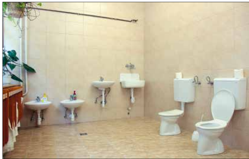
A Zugligeti Bölcsődében megszépült a vizesblokk

Elkészült a külső nyílászárók modernizációja a Süni Óvodában. A felújítás részeként a belső