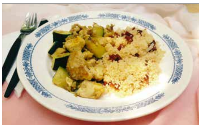
Csirke safránnyal, aszalt paradicsommal, kuszusszal, cukkinivel

A tetejére ismét vékonyra nyújtott tésztaalap kerül, amelyre érdemes ablakot vágni, hiszen a csodaszép, sötét, sziruposra párolódott gyümölcs jól mutat majd a világos tésztától övezve. A lecsó tésztaadatokból tetszés szerinti díszítést készíthetünk. Ha elkészültünk, egy ecsettel óvatosan tejet permetezünk a piték tetejére, és porcukrot szitálunk rájuk, ettől szépen barnulnak majd. Száznolcvan fokra előmelegített sütőben 25-30 perc alatt aranyszínűre sütjük őket.