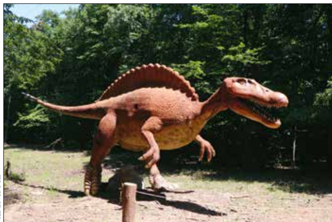
Nem éppen őshonos hazai állatfaj, de senki nem reklamál emiatt

A Budakeszi Vadaspark immár sokadszor csatlakozott az Állatkertek éjszakájához. Tizenkét hazai állatújteménnyel együtt érdekes programokkal várták a látogatókat.