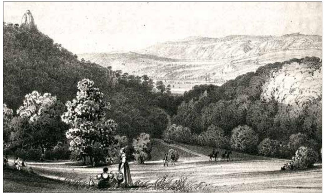
Zugligeti táj (Alt Rudolf rajza, 1845)