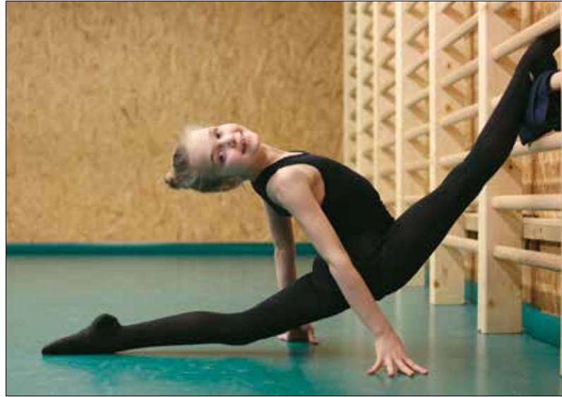
Imádja az rg-t, az lenne számára a legnagyobb büntetés, ha nem járhatna edzésre

Ami még fontosabb: a versenyzés nem megy a tanulás rovására. A sok hiányzás ellenére minden tantárgyból dicséretes tanul, amihez a Virányos Általános Iskola, s