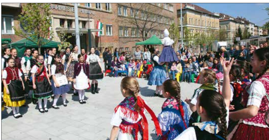
Sokan voltak kíváncsiak a Kis Rakonca hagyományörző műsorára