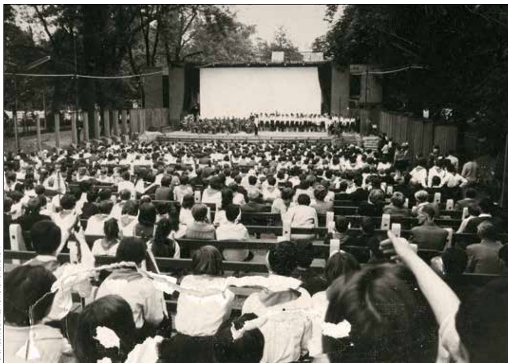
Az 1950-es évektől főleg gyermek- és ismeretterjesztő programokat láthattak a nézők a Városmajorban