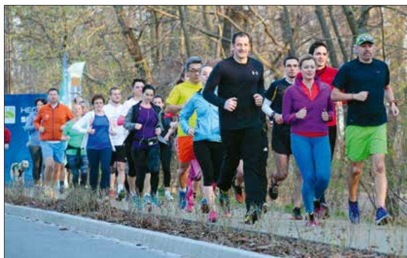
A környezet szép, a hangulat kellemes, a pálya pedig minden igényt kielégítő

Az edzéseket minden csütörtök este fél 7-kor kezdődnek, előtte 6 óráig lehetőség van a legújabb futótípus kipróbálására. „A tréningeket szakdedzők tartják, mindenki