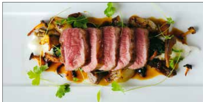
A húsvéti időszak kedvelt fogása a bárányhús

Gazdagon fűszerezett pácban minden hús megneimesedik. Hát még a bárányhús! A húsvéti szezon kedvelt fogásai közé tartozó húsféle egészen átlényegül a safrányoskardamomos-gyömbéres pácban.