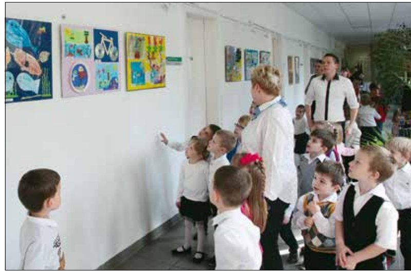
A kis alkotók egymás rajzaira is kíváncsiak

Immár tizenhatodik éve csalmosolyt a hivatalba érkezők arcá-