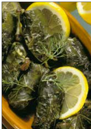
Egzotikus élmény: hal és szőlőlevél

Ha előző nap készítettük el a levest, külön-külön tároljuk el ezeket a hozzávalókat, és tálalás előtt forrósítsuk fel a levet, amiben először a kockára vágott csirkemellet pároljuk meg, aztán sorban felmelegítjük benne az édesburgonyát, a cukorborsót és a tésztát. Tálaláskor vékonyra metélt lilahagymával, korianderrel, ferdén felszelt újhagymakarikákkal és egy-egy cikkely lime-mal díszítjük. Ízlés szerint szórhatunk rá vékonyra metélt, friss chilipaprikát is.