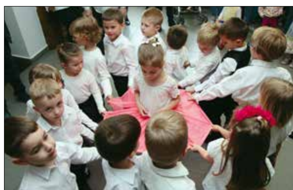
Süni-óvodások műsora a megnyitón