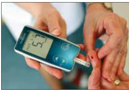
5, 6, 7, 8 – ezekre a számokra kell figyelni!

A sejtek 2-es típusú cukorbetegség esetén azért éheznek, mert az inzulin nem képes a sejtmembránhoz kapcsolódni – ez az inzulín-