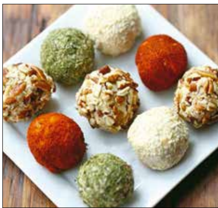
Előételnek is kiváló sajtgolyók

Előételnek és vendégváró csipegetnivalónak is kitűnő választás ez a recept. Jót tesz neki, ha egy egész éjszakát pihenhet a hűtőben tálalás előtt, mert így van idejük hatni a fűszereknek, és a markáns ízű sajtok is jobban összeérnek benne. A tálalást pedig meg lehet bolondítani az alább felsoroltakon kívül