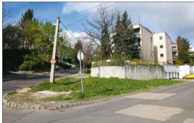
A Szent Orbán téri zöld sarkot a TE gyakorlóiskolája gondozza majd

Nemzeti Park Igazgatósága, egyetem és kormányzati szereplők bevonásával a rossz állapotú kerületi fasorokat szeretnék megújítani. Hozzátette, hogy a közterületeken található faállomány jellemzőiről meglehetősen pontos képe