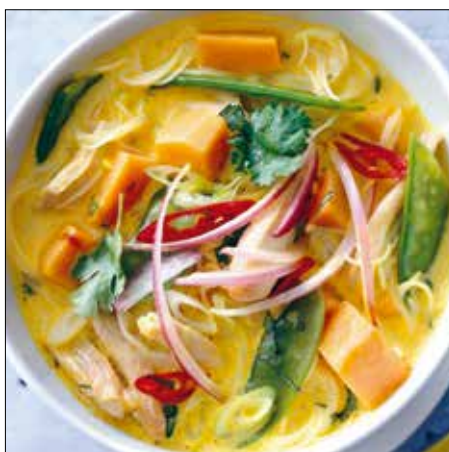
A leves már a színeivel is díszíti az asztalt

Ez az üdítő, gyümölcsös saláta nemcsak finom, de esztétikus fogása is lehet az ünnepi étkezésnek. A vízitorma, ami nem csak C-vitamin-, de kalcium-