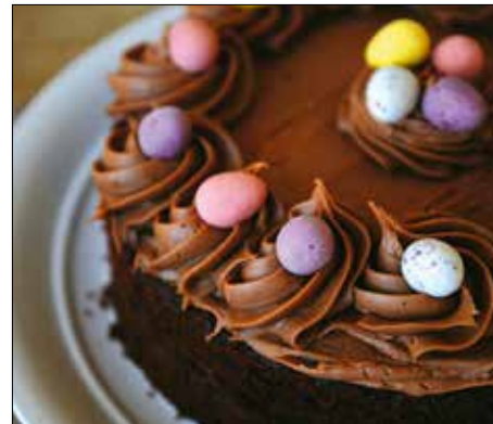
Cukortojással ékesített csokitorta

Végezetül következzék báró Bornemissza Elemérné Szilvássy Karola százéves, jól bevált receptje, amelyet nem is olyan régen adott közzé a Helikon Kiadó Az eddigi főúri konyha titkai című kötetben. A „chocolate-torta” sötét sziluettjén jól mutatnak a színes cukortojások, de ha ilyenek nincsenek kéznél, marcipánból is gyúrhatunk rá szép díszeket.