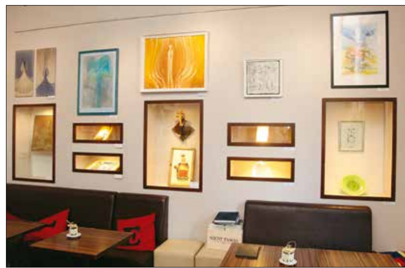
Részlet a kiállításból

„Hagyomány a Hegyvidéken, hogy a Galéria 12 művészei évről évre felmutatják nekünk, mit jelent számukra húsvét. Ez egy hiánypótló kiállításorozat a budapesti galériák palettáján – mondta a megnyitón Sikota Krisztina, a XII. kerületi önkormányzat oktatási és kulturális bizottságának elnöke, majd a művészekhez szólva így folytatta: – Ti, alkotók, az európai kultúra évezredes gyökerét jelentő hírt a művészet nyelvén, talán a szónál néha befogadhatóbban közvetítitek. Az utolsó szó nem lehet a gonoszságé, az élet diadalmaskodik.”