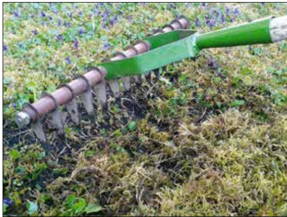
Mohairtás speciális gereblyével

Ha végeztünk a mohátlanítással és a levegőztetéssel, s hátranézünk – különösen a korábban erősen mohás részekre –, akkor elkéserítően gyér gyepet látunk. Kézenfekvő hát a pótlás kérdése.