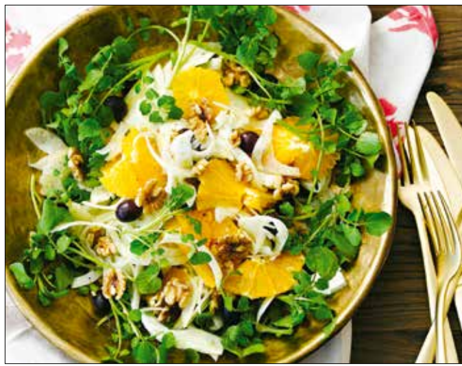
Üdítő ízű és esztétikus is a naranccsaláta

tartalmával is kiemelkedik a salátafélék közül, méltatlanul elhanyagolt összetevője ennek az egzotikus salátának.