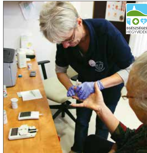
Nagyon fontos a vércukorszint rendszeres ellenőrzése

képes csatlakozni a sejthez, de ekkorra a cukor mennyisége is sokkal magasabb lesz. Idővel a hasnyálmirigy kimerül, ilyenkor kell a 2-es típusú cukorbetegséget inzulinval kezelni.