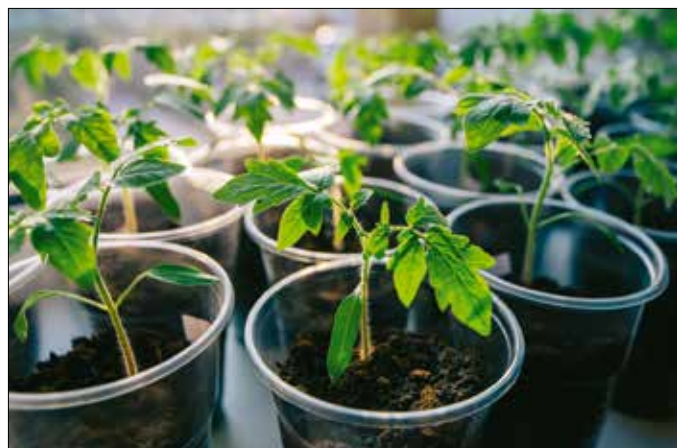
Ha jól sikerül a nevelésük, a kertek igazi díszjeivé válhatnak

sabb tejföls poharak, vagy akár cserepek, esetleg tőzegből préselt edények, amik aztán a növényvel együtt kiültethetők. A tejföls poharak mellett szól a környezettudatos újrahasznosítás, de mindig alaposan mossuk ki őket, nehogy a romló ételmaradék megfertőzze a csírákat.