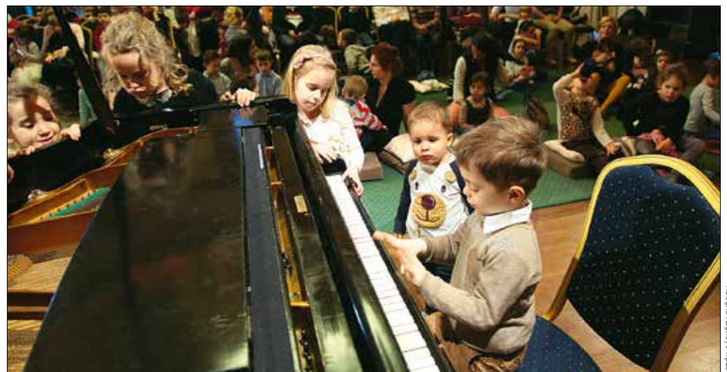
A fesztivál egyik rendezvénye volt a legkisebbek számára rendezett Hangszerválasztó

Az ezt követő Django-jazz operettmelódiaikkal (A vén budai hársfák...) és vérbeli cigányzenével