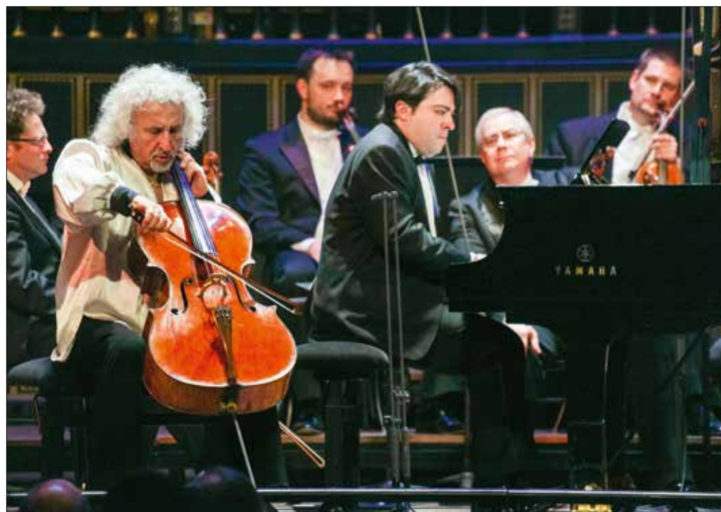
A záró hangverseny világhírű vendége Mischa Maisky csellóművész volt

ség. Az Ellington zenekar közismert Caravan című számával vette kezdetét a műsor, és egymást követték a népszerű számok. A sokféle zenei formációból és stílusirányzatból összeállított „bárest” kellemes emlékekkel távozhattak a vendégek.