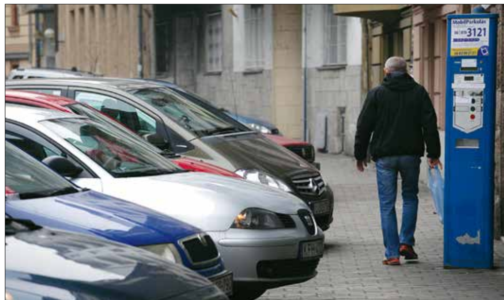
Ma már minden harmadik parkolási engedélyt elektronikusan igénylik a hegyvidékiek

■ Elsőként a parkolási engedélyek elektronikus igénylését tette lehetővé az önkormányzat. Sokan felfedezték már az e-ügyintézés előnyeit?