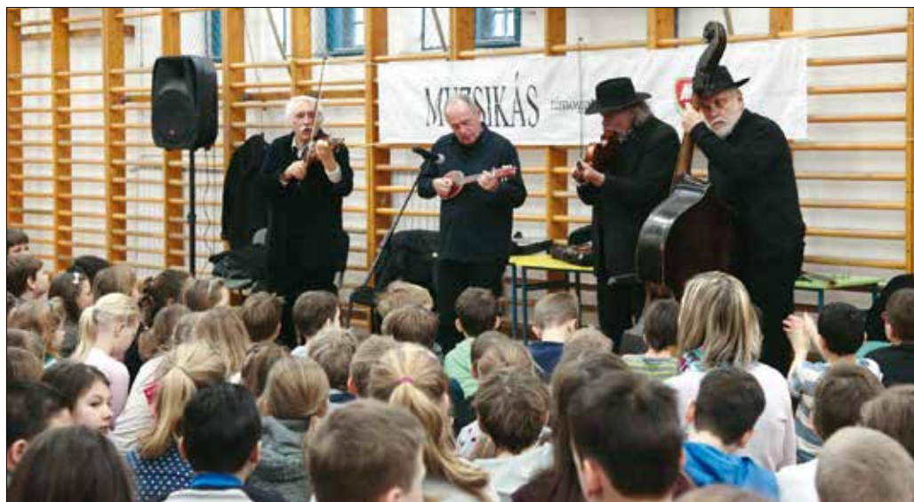
A Muzsikás előadásain a gyerekek is részeseivé válnak a zene születésének

lki harmóniához is, továbbá a fegyelmet, a koncentrációképességet és a teljesítményt is fokozza.