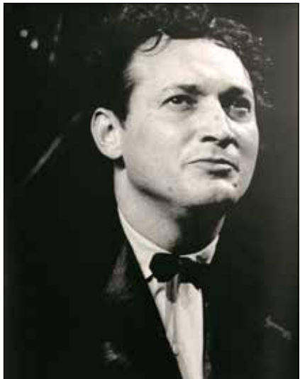
A fesztivál névadója, Cziffra György