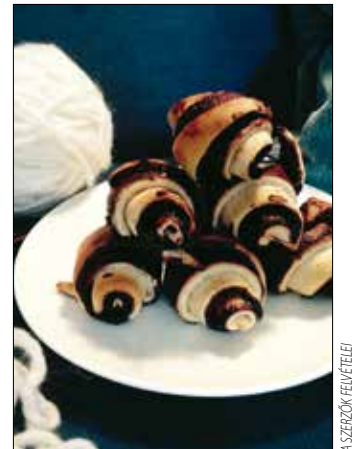
Csokis harapnivaló tévézéshez

Tűzálló edénybe tesszük a vaját és a csokoládét, amit lassú tűzön összeolvasztunk. Hozzáadjuk a kakaóport és a mézet is, aztán