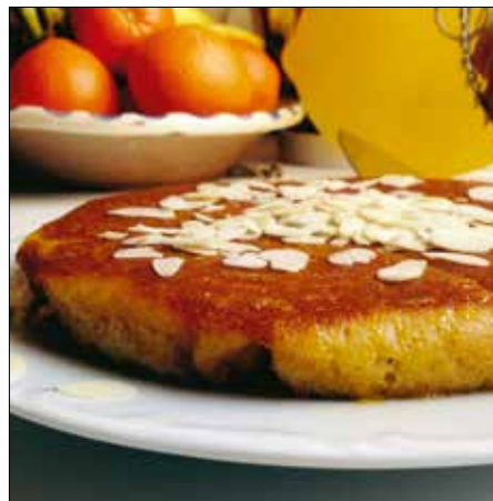
Narancsos mandulatorta: nehéz neki ellenállni

A tojásokat a cukorral halvány-sárga habbá verjük. Míg a habverő dolgozik, robotgéppben finomra