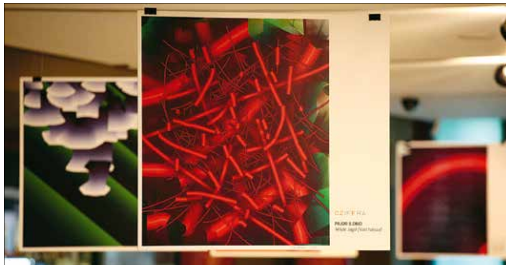
A fesztiválon jelen volt a képzőművészet is