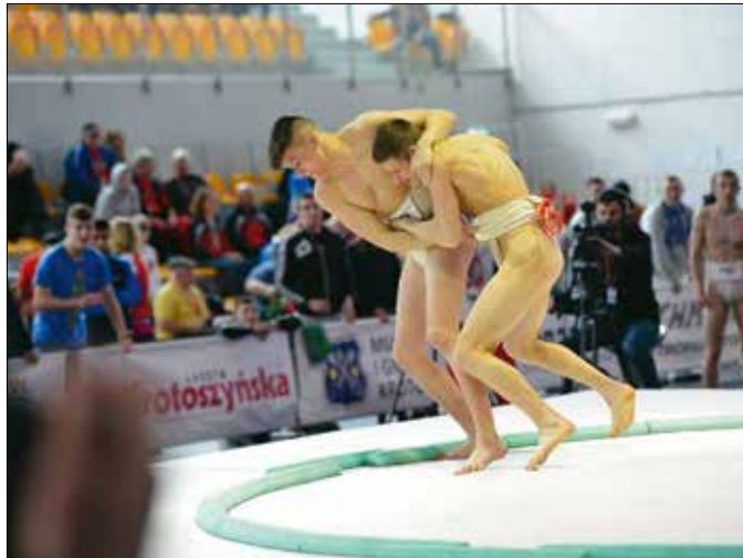
A tavalyi szumó-Eb-n U18-ban 3., U21-ben pedig 5. lett

megmutathattam, hogy mit tudok. Bár a döntőbe jutás nem sikerült, a bronzéremmel mindent beleadtam, hiába álltam vesztesre két másodperccel a vége előtt, akkor is az járt a fejemben, hogy nyerni kell. Nemcsak magamért, hanem azért is, mert már mindenki nekem szurkolt. Indítottam