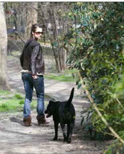
Az ebösszeírást is segíti az e-ügyintézés

– Csak tavaly indult a rendszer, de a parkolási engedélyek közül ma már minden harmadikat elektronikusan bocsátjuk ki – ez is jelzi, hogy van igény az ilyen és ehhez hasonló, az életünket megkönnyítő szolgáltatások iránt. A fejlesztések is hozzájárultak ahhoz, hogy az idén még többen igényelték parkolási engedélyüket a Hegyvidék-fiókjukon keresztül, ez év január 1-je