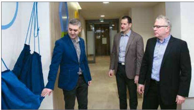
Játékok, dekorációk teszik színesebbé a várótermi részt

„Az a dolgunk, hogy rendezett körülményeket biztosítsunk az önkormányzat által fenntartott házi orvosi rendelőinkben, ne lepusztult, málló vakolatú helyiségekben