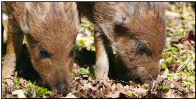
Az év elején vadmalacok születtek a Budakeszi Vadsparkban

naptára és néhány játék is helyet kapott a kellemes megjelenésű és jól használható alkalmazásban, amit nem csak a látogatás idejére érdemes letölteni, mert az események egész évre előre megtalálhatók benne, így könnyebb megtervezni a következő látogatást. Az