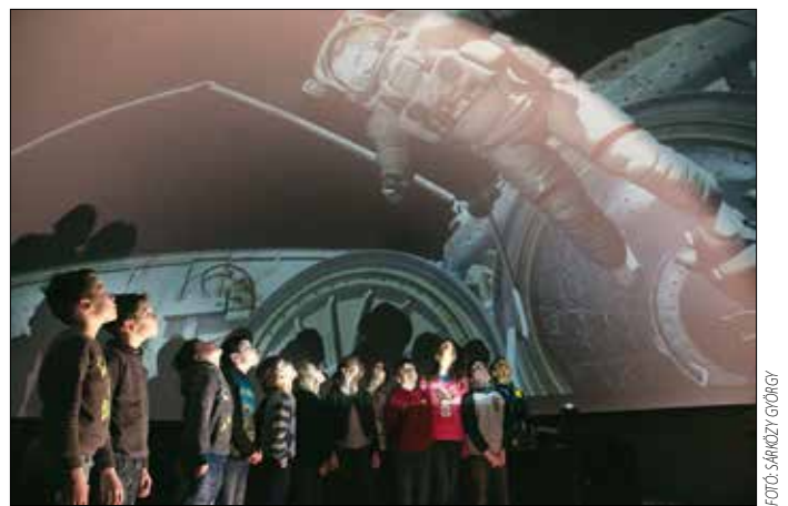
Karnyújtásnyira a kozmosztól

A digitális technikát – full HD felbontású, halszemoptikás sík-projektort – alkalmazó Utazó Planetárium a hagyományos planetáriumi programok szellemében állította össze előadásait, azaz bemutatja a csillagképeket, a boly-