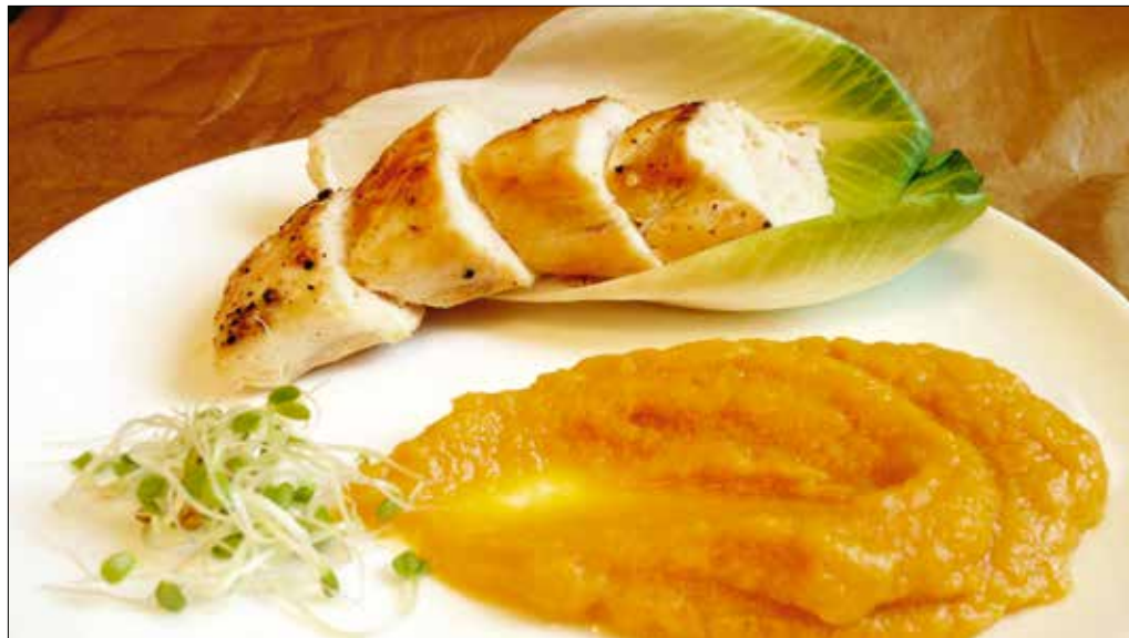
A gyömbéres, lime-os csirke savanykás izvilágát jól ellenpontosza az édesburgonyából készült püré

zunk, megborsozzuk, meghintjük szegfűborsal is, és hozzáadjuk a koriandert, majd újra megfuttatjuk a robotgépet. A masszából pogácsákat formázunk, amiket kevés forró olajon ropogósra pírítunk.