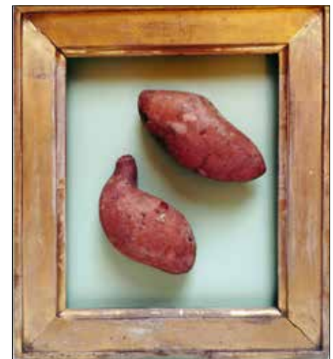
Itthon is természetesen az édesburgonyát

ma miatt daganatmegelőző hatást is tulajdonítanak neki, állítólag csökkenti a gyomorrák és a májbetegségek kockázatát, antioxidánsai, vitaminjai és proteinjai