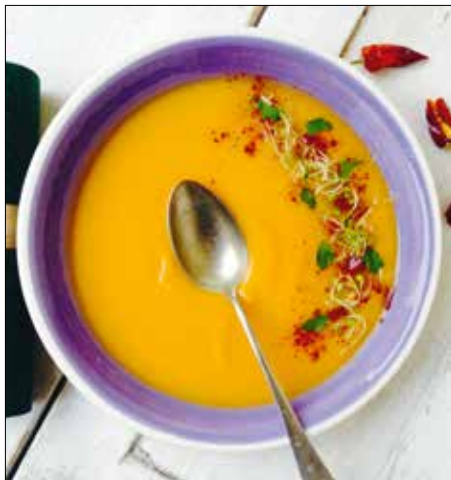
Pikáns leves édesburgonyából

1 kg édesburgonya 1,5 l húsleves 2 vöröshagyma 2 gerezd fokhagyma 1 chilipaprika ½ lime leve só, bors