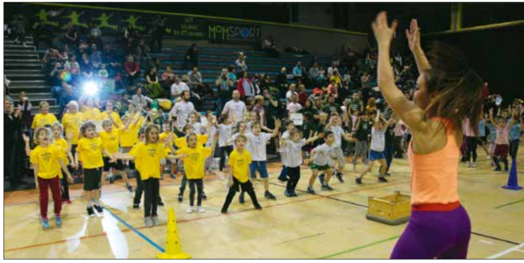
Népes gyereksereg állt rajthoz, tizenegy hegyvidéki óvoda csapatai indultak a versenyen

ügyvezető igazgatója adta át a gyerekeknek.