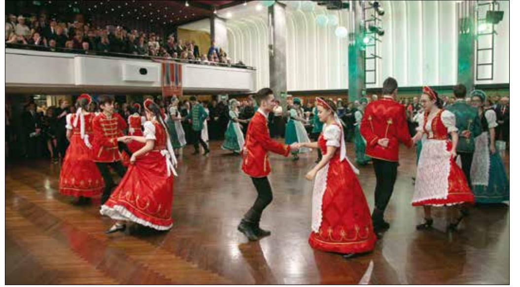
A nyitótáncot ezúttal a fővárosi Kolping katolikus iskola diákjai járták el

Az idei bál díszvendége a Magyar Kolping Szövetség volt, képviselőjében Kövesi Ferenc országos prézes atyával, a szövetség egyházi elnökével, aki – Don Boscóhoz hasonló életutat bejáró – német alapító, Adolph Kolping életéről és hitvallásáról is mesélt. Az 1991-ben boldoggá avatott, sze-