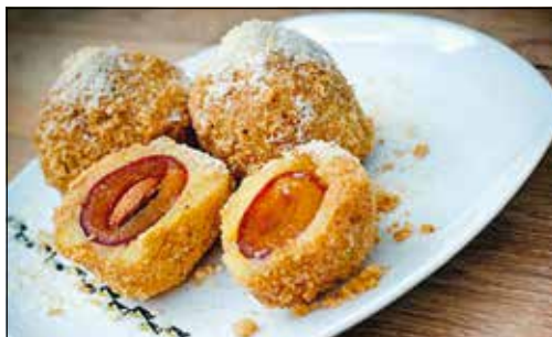
Mélyhűtött gyümölcsökkel töltve is finom

A töltött gombócot télen-nyáron egyformán élvezhetjük, hiszen kitűnően tölthető mélyhűtött gyü-