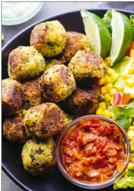
Kitűnő böjti étel a falafelpogácsa

A babot és a csicseriborsót konyhai robotgéppben pépésítjük, ráreszeljük a citromhéjat, megszós-