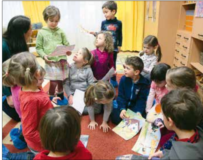
A hegyvidéki óvodák híresek a magas színvonalú munkájukról

a gyerekekre, azaz „tanversere”, amik vonzó formába csomagolt, hasznos ismereteket nyújtanak a kicsiknek, tele morális tanulságokkal, és igen jó memória-gyakorlatokat jelentenek, ám vigyázni kell a mértékkel. Nem szabad a gyereket a „hány verset tudnak?” mércéjével mérni, és az anyák napi vagy egyéb alkalmakkor szokásos versmondásokat valamifajta „ünnepi elszámoztatás” tekinteni, ahol „biodisztingált” kerülnek szereplésükre.