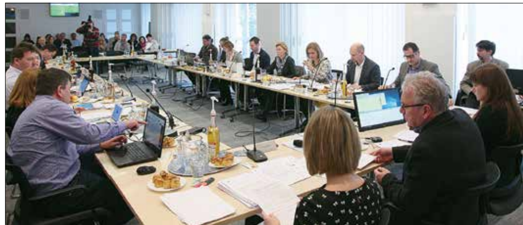
Az adóügyek elektronikus intézését lehetővé tévő rendeletet is alkotott a testület a legutóbbi ülésén

A népszerű termelői piacok további terjeszkedésének elősegítése érdekében rendeltettségű módosításával a településfejlesztési koncepció, az integrált településfejlesztési stratégia és a településrendezési eszközök mellett már a településképi arculati kézikönyv és a településképi rendelet egyeztetési eljárásába is bevonandók a partnerek.