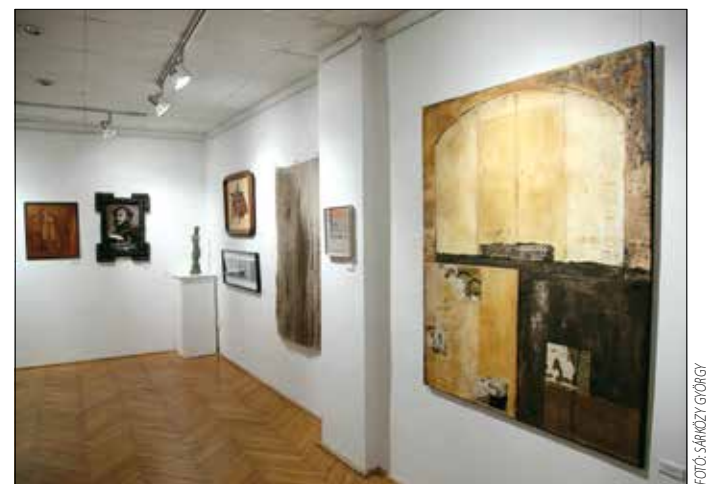
„Folyt. köv.”, csak most már új helyen, a Királyhágó térenél

hogy mások mellett sok Kossuth-, Munkácsy- és Ferenczy-díjas művész is megtisztelte részvételével a március 10-ig nyitva tartó tárlatot. A jövőről szólva megjegyezte: „Úgy szeretnénk