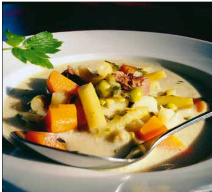
Tejszínes, könnyű raguleves némi marhahússal és sok-sok zöldséggel

Ennek a tejszínes ragulevesnek az ötlete azon a viharos reggelen szü-