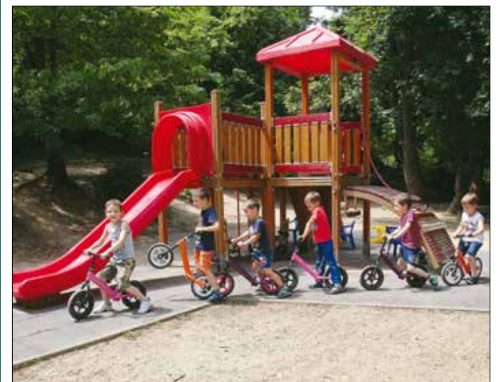
Könnyebben elsajátíthatják a kerékpáros közlekedés szabályait