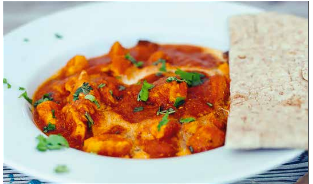
A csípős, illatos indiai ételleket naannal esik jól kikanalazni a tányérból

Magozzuk ki és aprítsuk fel a chilit, hámozzuk meg és kocká-