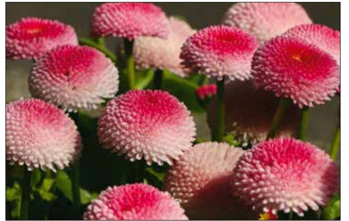
Telt virágú százsorszép

Szaporítása nemcsak a fényben csírázó és eléggé nehezen gyűjt-