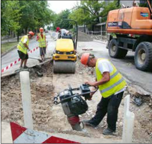
Az ütemtervnek megfelelően halad a munka

Az első két ütem már befejeződött, a helyükre kerültek a burkolati jelzések, azonban a Határőr úton a kivitelezés ideje alatt továbbra is egyirányú marad a közlekedés. Ez azt jelenti, hogy a Ráth György utca és a Gaál József út felől is csak az Alma utca irányába lehet gépkocsival haladni, az Alma utca pedig kizárólag a Városmajor utca felé járható. Az építkezés befejezése után visszaáll a környéken korábban megszokott forgalmi rend.