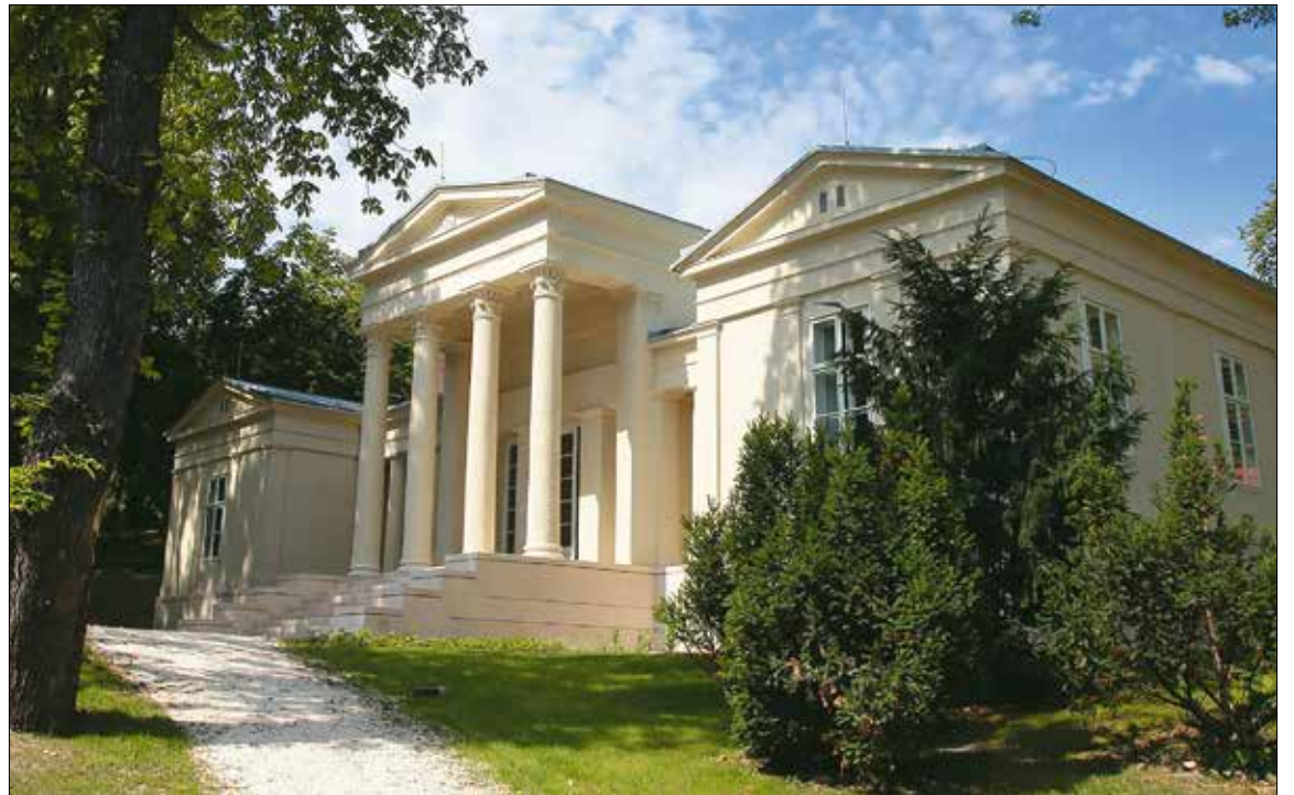
A Budakeszi út 38. alatti felújított villát most a Magyar Művészeti Akadémia használja

Hild fő művei többségében Pesten és vidéken valósultak meg. A Belvárosban járva szinte minden utcában jellegzetes hildi homlokzatarchitektúra hívja fel magára a figyelmet. Bár lakóházhomlokzatainak ritkán figyelhetünk meg díszítő motívumokat, majd' mindegyikre jellemző a mérték-tartó, egyéni kialakítás. Csak felsorolászerűen néhány pesti főúri palota és lakóház: a Derraház a József Attila utca és Október 6. utca sarkán (1838-ból); az egykori Tigris szálló – Wagner-ház a Nádor utca 5. alatt; Nádor