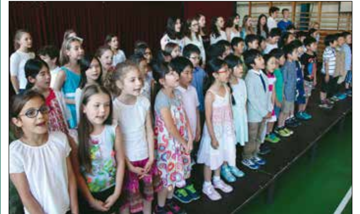
Japán és magyar gyerekek együtt énekeltek a Virányos iskolában