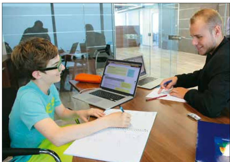
A diákokat személyre szabott ütemterv alapján tanítják a központ oktatói

sen folytathassák tanulmányaikat a legjobb hazai és külföldi egyetemeken.