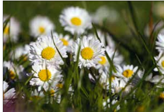
A vad százsorszép kerti fejlődését nem veti vissza a fűnyírás

A kertben terjedő vad százsorszép világoszöld, lapát formájú, enyhén fűrészes szélű levelei alig emelkednek a nyírt gyepek szintje fölé, ezért a kétszikű növények