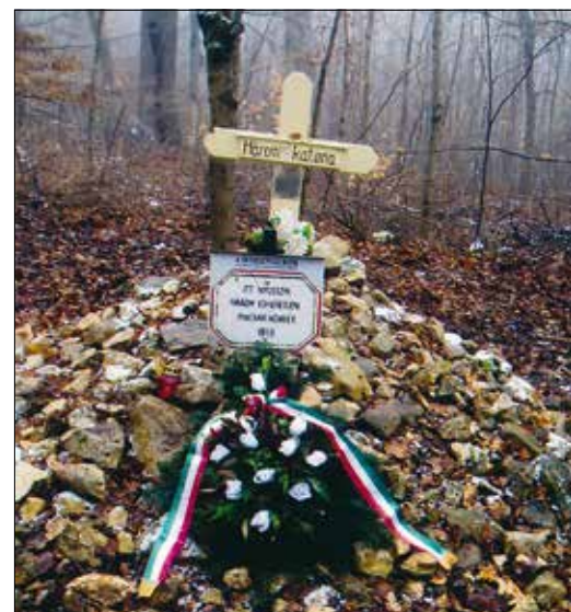
Történelmi jelentőségű kegyeleti hely