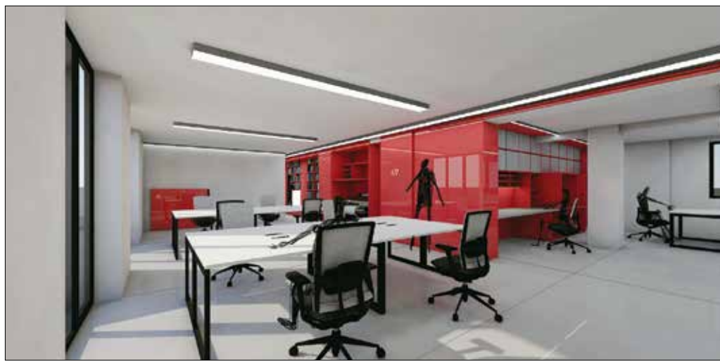
„Köztér” – részlet az Árkay-pályázaton második helyezést elérő tervből

Az Árkay-pályázaton első helyre rangsorolt tervező 250 ezer, míg a második helyezett csapat