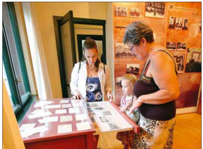
A Hegyvidék a „Nagy Háború” idején című kiállítás utolsó látogatói