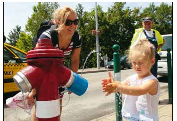
Hőségben néha különösen jólesik felfrissülni az utcán

Előfordul, hogy lomtalanítás előtt a trükkös tolvajok vételi ajánlatot tesznek a lomokra, közben pedig megpróbálják elvinni a valódi értékeket, ezeket pedig – a sértett figyelmetlenségét kihasználva – ráírják az adásvételi szer-