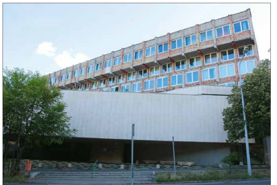
Egy épületbe kerülne az összes szakrendelés, és az új diagnosztikai részleg a járóbeteg-ellátást is kiszolgáltatná

A járóbeteg-ellátás szempontjából fontos változás lenne, hogy a Kútvolgyiben egyetlen épületbe kerülne az összes szakrendelés, nem kellene azokat a nagy területű János kórház különböző pavilon-épületeiben keresgélni. A megújuló Kútvolgyi Klinikai Tömbben – a külön álló kórházi, valamint szakrendelői szárnyat összekapcsoló „G” épület jelentős átalakít-