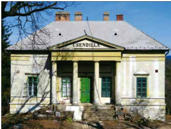
A II. kerületi "Csendilla" nincs túl jó állapotban

Hild József már a családi környezetben magába szívhatta a szakma rejtelmeit, mivel apja, Hild János az Újépület tervezője és építészvezetője volt. A fiú a piarista gimnázium után a Bécsi Művészeti Akadémián folytatta tanulmányait.