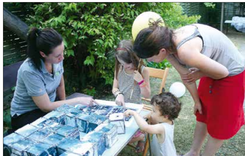
Kirakós- és memóriajáték a kertben