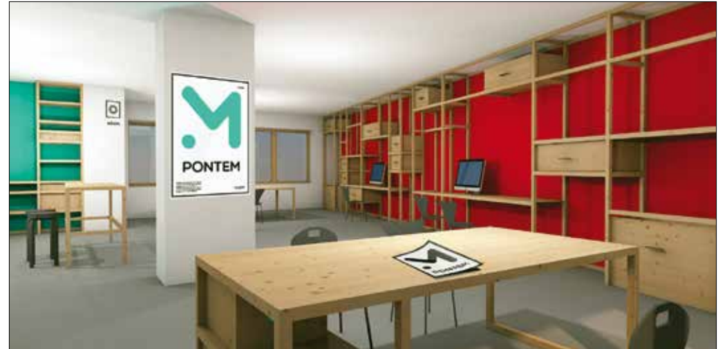
„Pontem co-working iroda” – részlet az Árkay-pályázaton első helyezést elérő tervből

zásra, terveik, termékeik kiállítására, árusítására és a közös munkára.