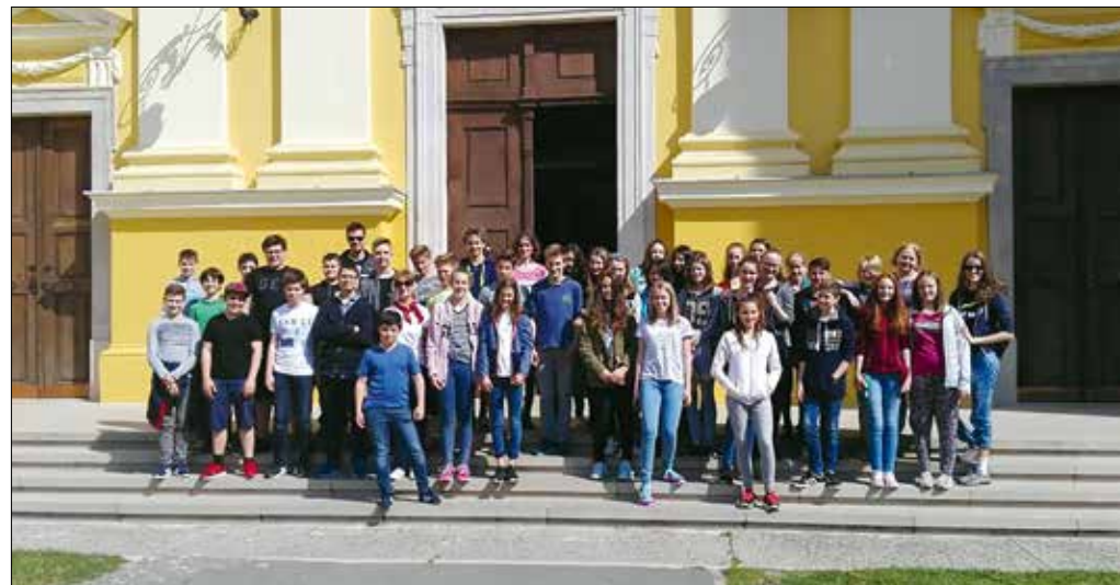
A nagyváradi templom előtt

Brassóban a Cenk hegytömből gyönyörködtek a hegyekkel körülvett város látképében, majd megnézték a főtér és környékét, utána pedig Pürkerence utaztak, ahol