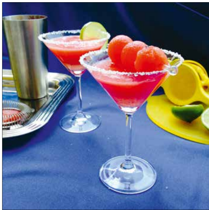
A dinnyekoktél kitévő vendéglő a forró napokon

Mostanában, amikor a meggy, a cseresznye és a ribizli egyszerre érik a sárgabarackkal, az őszibarackkal és a görögdiinnével, igencsak fel kell kötnünk a gatyánkat, ha a nyár minden ajándékát élvezni akarjuk. A felhasználáshoz és a tartósításhoz is hasznos tanácsokkal szolgál Saly Noémi frissen megjelent, Spájs című könyve, amelyet egy recept erejéig mi is megidézzük. Ezúttal egy olvasói desszertleírásnak is helyet szorítottunk az oldalon, amelyen igyekszünk új ötletekkel szolgálni és kedvet adni a főzéshez a forró napokon is.