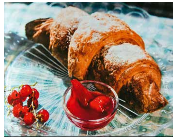
Az őszibarack és a ribizli jól kiegészítik egymást

Felhasználása: pirítóssal, hajjal! De rácsos linzerre, túrórtortába