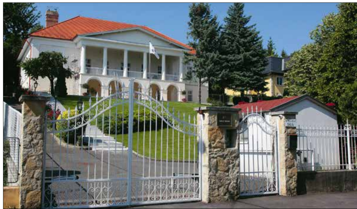
Az 1846-ban épített egykori Libasinszky-villa ma szépen karbantartott követségi épület