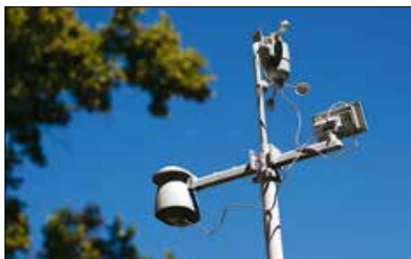
Kültéri meteorológiai állomás

Melyik gyerek ne szeretne a szabadban tanulni? A Németszőlgyi járó diákok mostantól ezt akár mindennap megtehetik, hiszen udvari tanteremmel gazdagodott az általános iskola.