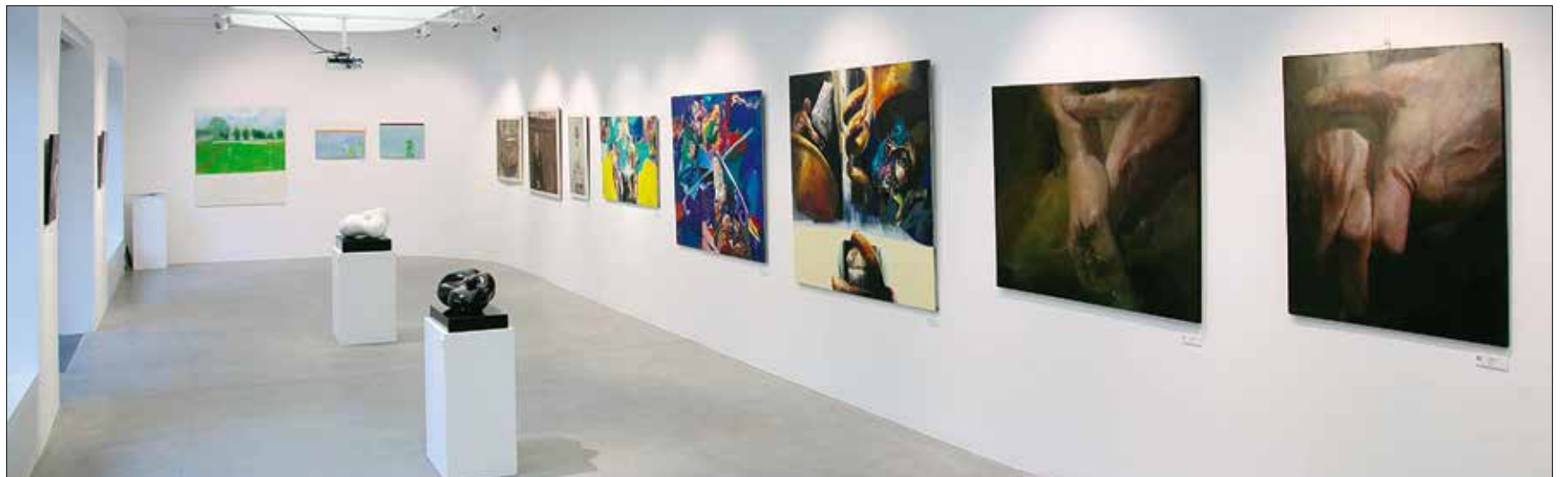
Hét művész, hét stílus – izgalmas kiállítás

kiváló és rangos tárlatoknak ad otthont a historikus hely. Mint mondta, ezért az MMA is mindent megtesz majd.