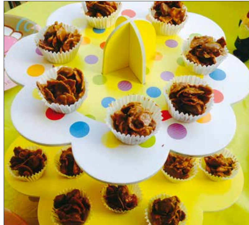
A csokoládécsókákat gyerekjáték elkészíteni

forma alján, és toljuk be a 180 fokra előmelegített sütőbe. Negyed óra alatt megsül a diós alap.