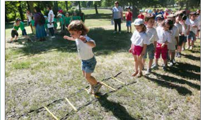
A feladatok javítják a koordinációt, az egyensúlyérzékletet és a gyorsaságot

vakondtúrás, a szöcskelétra és a kakasviadal mellett ilyen feladatot is kapnak. A Hunniareg Pedagógiai Intézet Nonprofit Kft. és a kerületi óvodavezetők közösségének programján az idén tizenkét csapat indult.