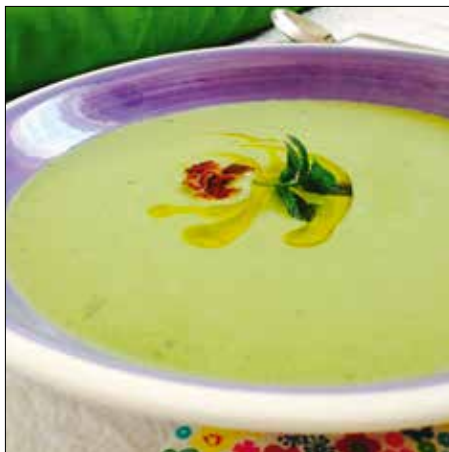
A borsóleves is lehet hűsítő

Közben elkészíthetjük a feltétként szolgáló baconchipszet. Ehhez újniyi szeletekre vágjuk a bacon, és forró serpenyőben ropogósra pirítjuk. A levest a chipszsel és egy-egy kanál olívaolajjal díszítjük.