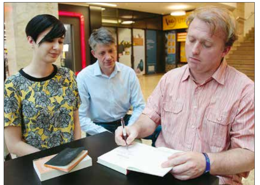
Az irodalom nem kelkáposzta, hanem a hab a tortán – Lackfi Jánosra érdemes figyelni

egy ilyen vers, mint például a Fekete router, amire hatszázegyzetvenczer ember kattintott rá, és több mint tízezer meg is osztották. Kétszázötven ezer ember kattintott rá a Széthúzás himnuszára. Ha belelátok egy versmerőrl kialakult csetepatába, akkor általában egyrészt higgadt hangon hozzászólok, ha látok olyan kérdést, ami megvilágítani való, de inkább meg szoktam köszönni, hogy milyen jó, hogy ilyen szenvedélyesen viszonyulnak emberek az irodalomhoz. Mert az irodalom halála nem a gyűlölet, hanem az unalom.