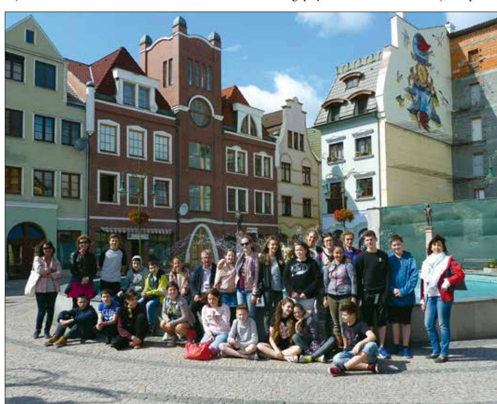
A révkomáromi Európa-udvar sem maradhatott ki a városnézés során

repet játszhatnak benne a korábbi utak kedvező tapasztalatai is. Még az olyan osztályoknál is, amelyek kevésbé nyitottak, megfigyelhető volt, hogy a tanulók emelkedett hangulatban tértek haza a nyárasdi látogatásról, s ők maguk is jobban összerázták, mintha