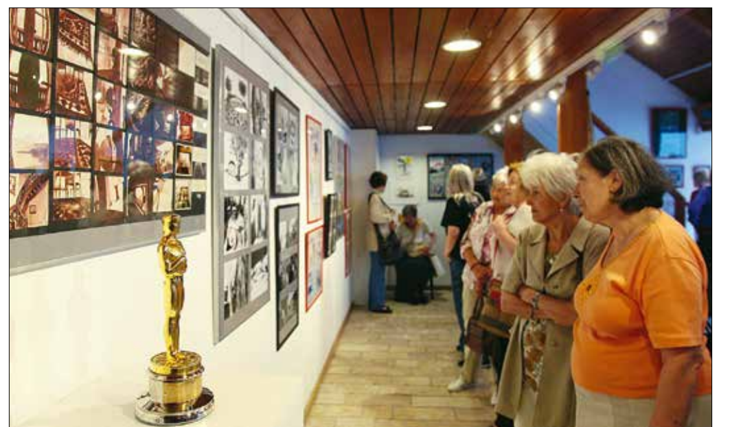
Előterben az Oscar-szobrocska, ami kalandos körülmények között került jogos tulajdonosához

■ A Galéria 12 Egyesület és a Gadányi Alapítvány rendezésében látható kiállítás július 1-jéig, hétfőtől péntekig 14–22, szombaton 16–22 óráig látogatható a Galéria 12 Borbár és Kávészóban (XII., Hajnóczy József utca 21.).