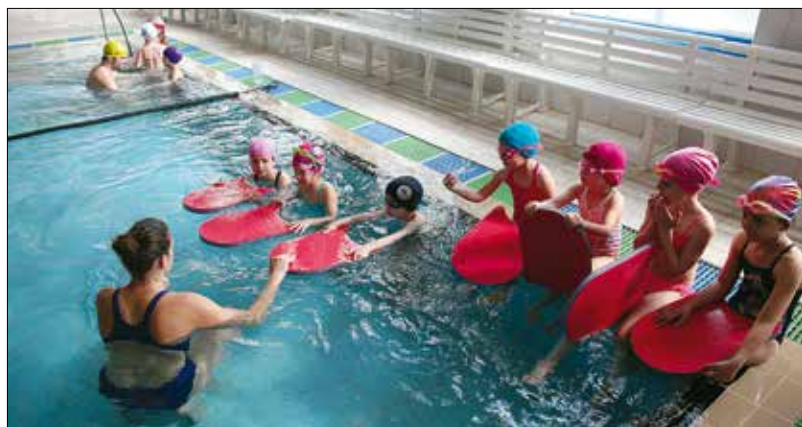
Heti turnusokban váltják egymást a gyerekek a Hegyvidéki Úszóiskola táborában

Sakk táborokat tartanak 4–12 éveseknek június 26–30-ig a Szamóca utcai Kikötő Családi Bölcsődében és július 10–14-ig az Agárdi úti Kisvakond Játékkuckóban ( www.sakkovi.hu ). A Csillebérci Kalandpálya ( www.kalandpalya.hu ), valamint a közelben működő Piczinke Póniudvar ( www.poniudvar.hu ) szintén hirdet napközi tábor okat a nyárra, míg a Kázmér úti Botanicon Tanoda és Tankert ( www.botanicon.hu ) kereszteti és természetismereti tábor okban vértézi fel új ismeretekkel az 5–12 éves gyerekeket. d.