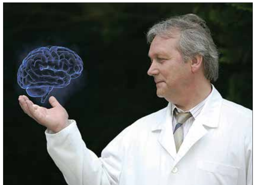
Az agykutatás kiemelt támogatása sürgető politikai feladattá vált

– A kommunikációnak a hihetetlenül hatékonyvá válása, az, hogy egyre több emberrel tudunk felszínes kapcsolatokat fenntartani, létrehozni, a kapcsolatok mélységének a rovására történik. Valahogy rá kell tudni ébreszteni az embereket arra, hogy ez a fajta lelki elvárosodás az emberi mivoltukat is veszélybe sodorja, és konfliktusok forrásává válhat. A mai fogyasztói társadalomban az ideális fogyasztó a médiát uraló gazdasági érdekkörök hatása alatt álló, elmagányosodott, értékrendjeitől és céljaitól megfosztott ember. Ebben az elembertelenedő,