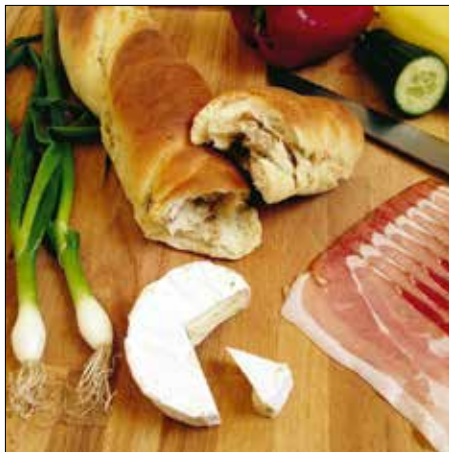
Nem igazi kenyér, de finom

Ez a recept instant megoldás arra az esetre, ha a négy napos ünnep közepén kifogyunk otthon a pékárukból. Nem igazi kenyér, hiszen optimális esetben nem élesztővel,