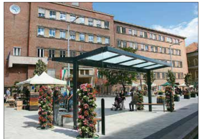
Minden szempontból harmonizál a környezetével az új utasváró

Szintén megújult és a közlekedést segítő korlátot kapott a Csermely lépcsőhöz csatlakozó járda. A Monda utcában kijavították a beszakadt, balesetveszélyes járdaszakaszt, a közeli iskola miatt jelentős forgalmat bonyolító Márfy lépcsőt pedig az alapoktól újjáépítették, mivel már nem volt biztonságos a nem egységes lelépési