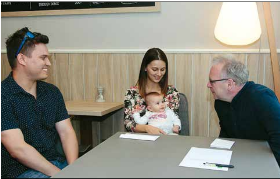
A boldog szülő, a polgármester és a sikeres baba, aki rögtön élete első versenyét megnyerte

nem mert ilyen viszonylag rövid idő alatt is sok kedves és vidám emberrel ismerkedtek meg a környezetükben.