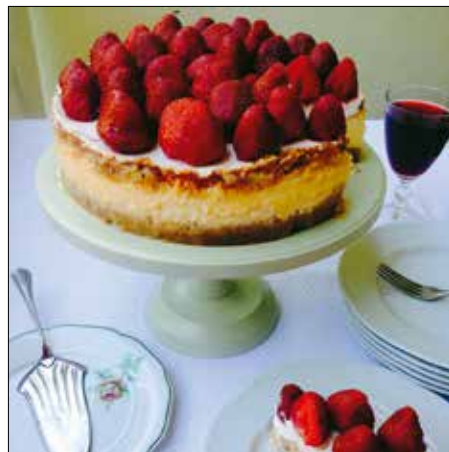
Ezzel a tortával megéri bajlódni!

Vegyünk egy kapcsos tortaformát! (Ez nagyon fontos, mert később vízfürdőbe kell tennünk.) Robotgépben törjük apróra a diót és a kekszet, majd adjuk hozzá a hideg vaját is, és ezzel is futtassuk meg a gépet. A masszát terítsük szét egyenesen a torta-