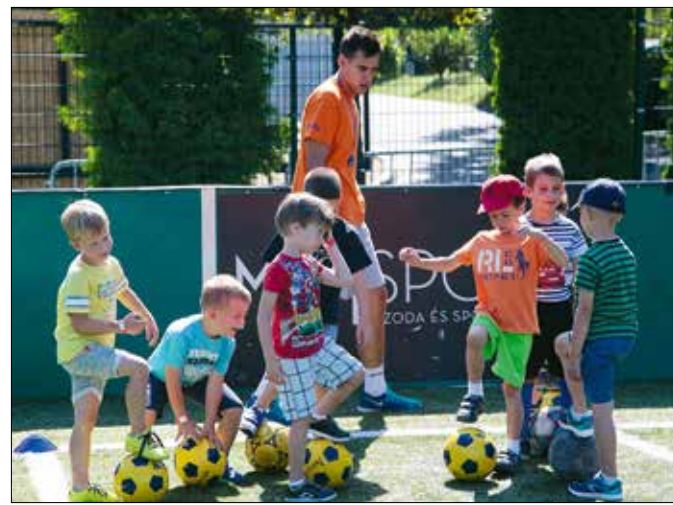
A MOM Sport táborai is sokféle sportolási lehetőséget kínálnak

A MOM Sport épületében működő Fitness & More szintén készül a nyárra. Az F&M CrossKids táborban július 3–7-ig és augusztus 7–11-ig a hagyományos, korcsoportnak megfelelő, funkcionális, készségfejlesztő edzés mellett úszásoktatás, úszó-edzés, strandolás és sok játék is lesz. (További információk, jelentkezés: info@fundm.hu .)