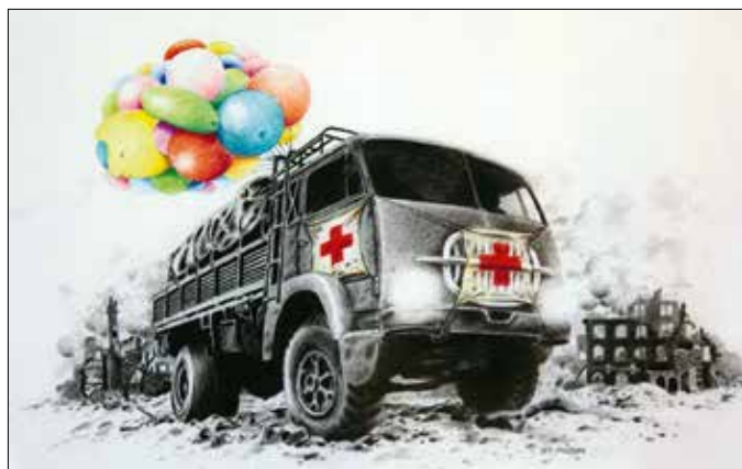
Rófus Ferenc rajza 1989-ből

■ Rófus Ferenc életmű-kiállítása megtekinthető: július 31-ig, hétfőtől csütörtökig 9–18, vasárnap 9–13 óráig (a Barabás Villa programjához igazodóan). Cím: XII., Városmajor utca 44.