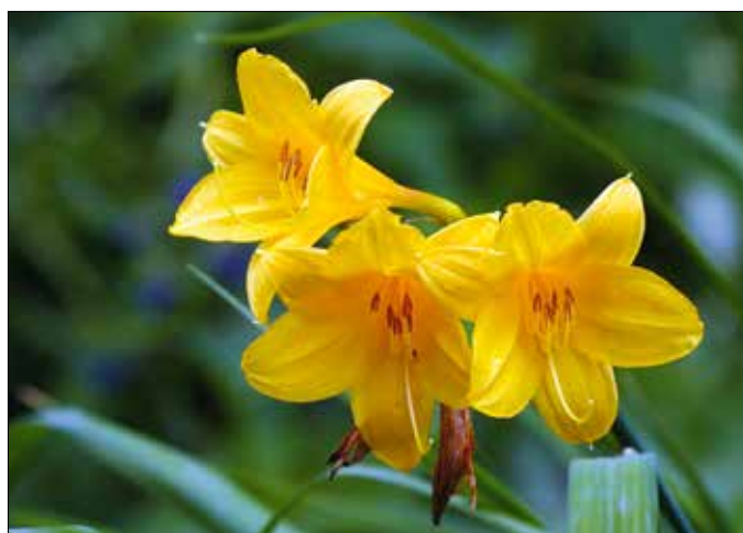
Virága csak egyetlen napra nyílik ki

ugyanis semmi köze a liliomokhoz, saját családot alkot néhány nemzetséggel. Tudományos neve Hemerocallis , ami a görög „nap” és „szépség” szavakból áll össze. Jól leírja a növény azon tulajdonságát, miszerint virágai egyetlen napra