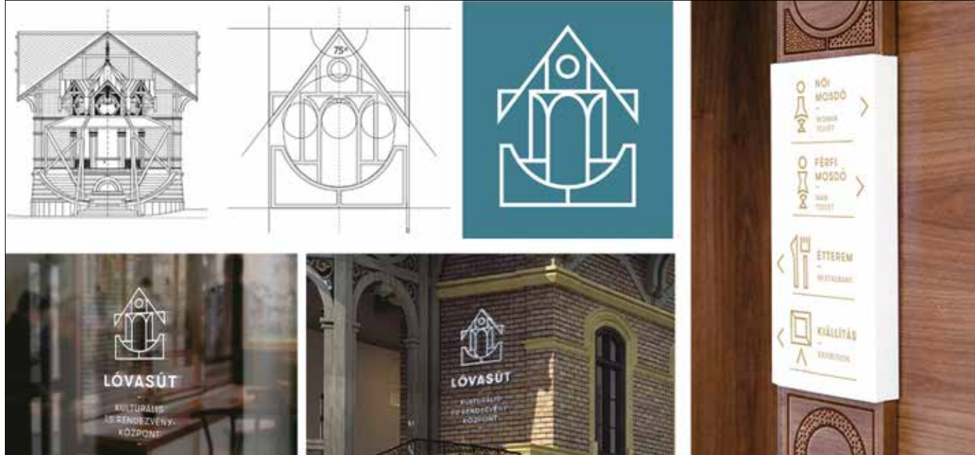
A győztes terv: az épület főbejáratán megjelenő részletek gyűrűznek tovább határozott vonalvezetéssel

meg, hogy két koncepciókat is közönségzavazásra bocsátotta a zsűri – mondta el lapunknak a tervezők, akik rendkívül bizakodók az épület további sorsát illetően. Mindemellett örülnek annak, hogy munkájukkal hozzájárulhatnak a gyönyörű