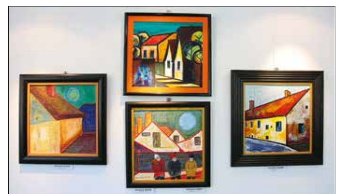
Derűs, élénk színhasználatú képek a mediterrán élethez

■ A kiállítás a polgármesteri hivatal (XII., Bösözmenyi út 23–25.) folyosógalériáján megtekinthető július 14-ig, ügyfélfogadási időben.