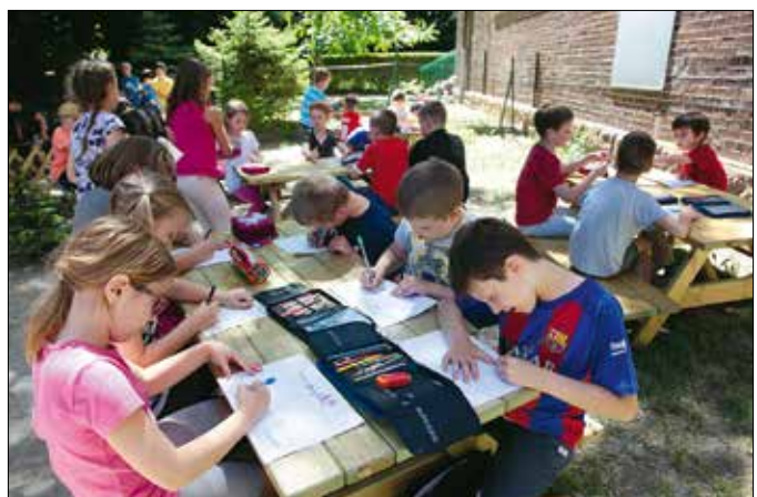
Jó levegőn, napsütésben könnyebben megy a tanulás