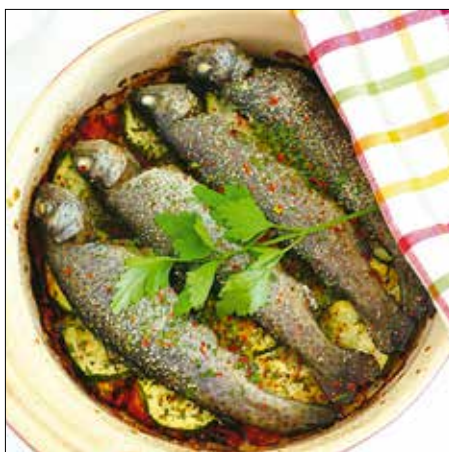
Gyorsan elkészíthető pizstrángétel

Ha összeállt, másfél-két óra alatt a duplájára kell kelesztenünk. Ezután kettéválasztjuk és hosszúkára formázzuk a tésztát, amit a közepén egyszer megcsavarunk, majd sütőpapírra téve további 15-20 percig kelni hagyjuk. Közben előmelegítjük a sütőt 200 fokra, és körülbelül fél óra alatt készre sütjük benne a „kenyereket”.