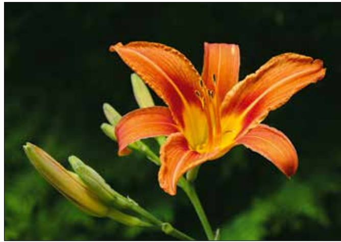
A kerti sásliliomnak többféle színváltozata lehet

A levelek között tavasz derekán jelennek meg a hosszú, felálló virágszárak, amelyek végén csoportokban ülnek a bimbók. A virágzás általában júniusban kezdődik, és kedvező időjárási viszonyok között akár három hétig, egy hónapig is elhúzódhat. A virágszárak