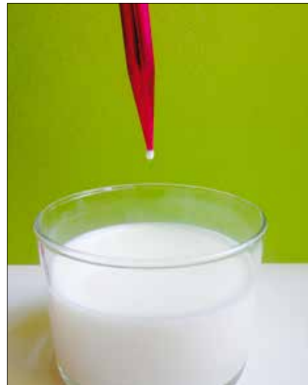
Ha kövér csepp csüng, akkor jó a tej

ízét. Egyszerű vajpróba, ha felolvasztunk meleg vízben, üvegpothárban egy kis adagot. Ha tiszta a vaj, akkor fent úszik a víz fölé, ha margarinnal keverték, akkor bűdös és zavaros.