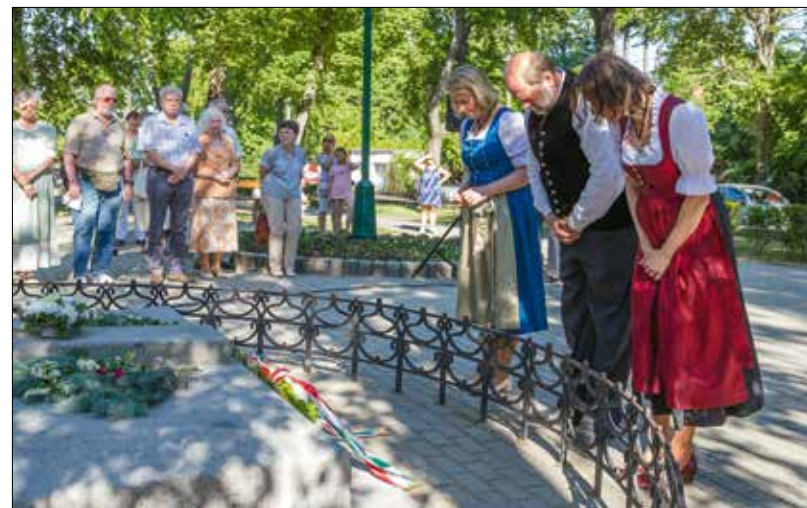
A helyi német nemzetiségi önkormányzat tagjai főhajtással emlékeztek a hőökre