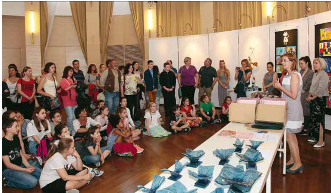
Méltó környezetben, a MOM Kulturális Központban rendezte az országos verseny díjátadóját a Budai Rajziskola