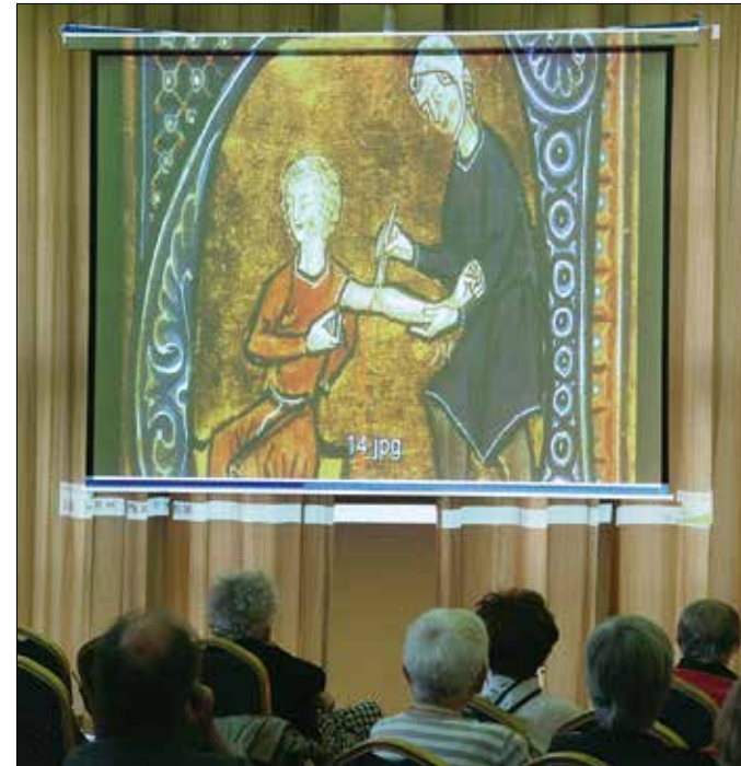
A korabeli gyógyításról szolt a szezonzáró szabadegyetemi előadás

sebészetet alantásnak tartották (holott sikeresen operáltak sérvet, hályogot, üszkösödést), mert az egyház nem nézte jó szemmel az operációkat, ahogyan a boncolást sem.