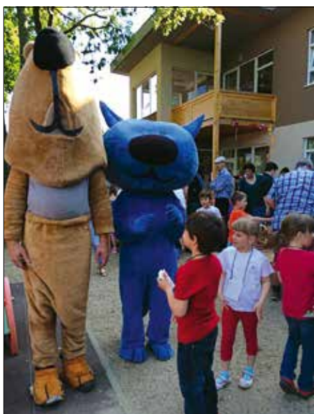
Macikutya és Picicica a KIMBI Óvodában

Az egészséges étel sokaságát felvonultató kerti büféről a csalá-