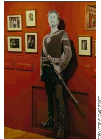
Simándy, „az örök Bánk bán”

lami Operaház Archivuma és Emlékgyűjteménye, az MTI fotóanyaga, valamint az OSZMI Fotó- és Színlaptárának dokumentumai egészítették ki.