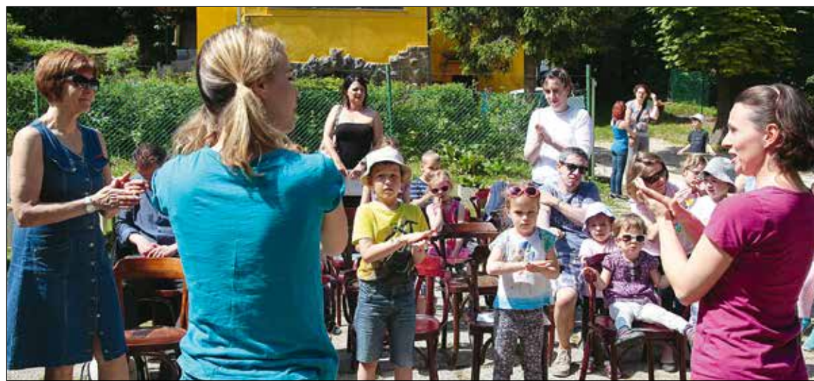
Sok-sok közös játék, éneklés, rajzolás, felolvasás, rejtvényfejtés szórakoztatta a gyerekeket a mesefesztiválon