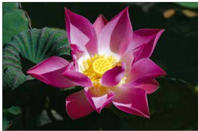
A virág a szellemi fejlődés, a megújulás, a szeretet szimbóluma

színűek, így ha a mocsár piszkos vize a rózsaszín vagy fehér virágokra fröccsen, akkor a viaszrétegről gyorsan lezsalad, és nem hagy nyomot maga után. Így a növény a mocsár közepén, vagy egy indiai falu szélén, a kétes tisztaságú tavacsákban is ugyanolyan makulátlan marad.