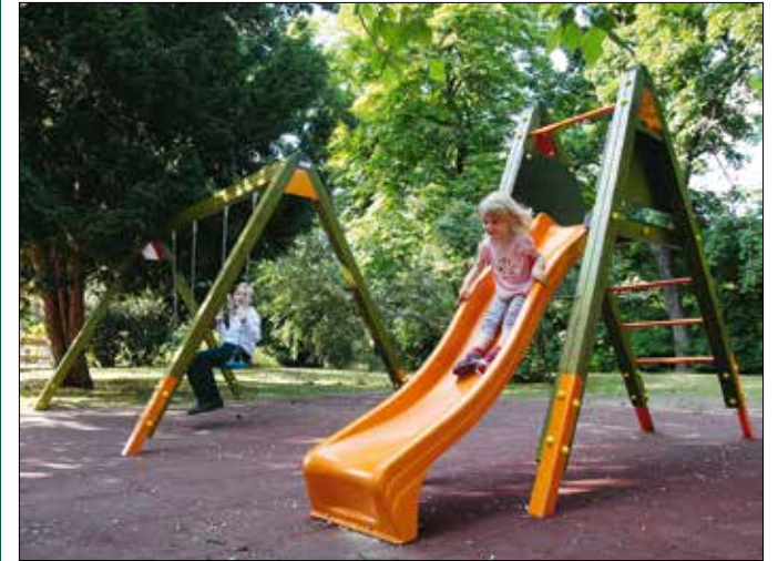
Új hinta és csúszda is épült az Eötvös József parkban

a Rácz Aladár úti játszótérén az ivókutat és az ahhoz szükséges vízbekötést alakítják ki a szakemberek. A Rege parkban és a Hollósy Simon utcában a régi máshoz cserélték le, míg a Kút völgyi úti játszótérén a korábban elbontott csúszdát pótolták. A Kempelen Farkas utcában és a Pagony utcában felújították a játszóeszközök alatti gumiburkolatot.