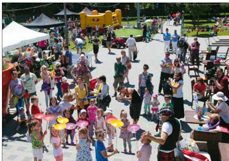
Gyereknapra benépesült a MOM Beach és környéke