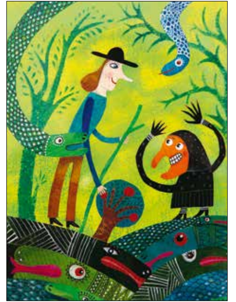
Molnár Jacquelin meseillusztrációja