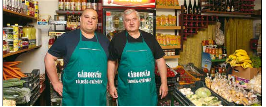
Nagyon sokan ismerik és szeretik őket a környéken

letése óta a Svábhegyen él, szinte mindenkit ismer a környéken, és persze őt is nagyon sokan ismerik. Emellett az is népszerűvé tette a boltját, hogy házhoz szállítást is vállal. Ezt a lehetőséget főként az