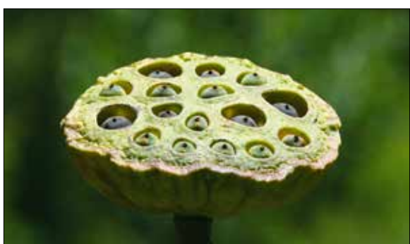
Lótusz termése magokkal