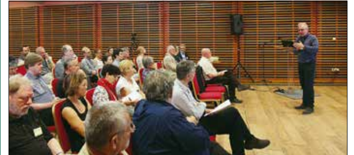
A polgármester néhány XII. kerületi problémáról is szolt a találkozón

„Folyamatos jövő – A tudomány-köziség új irányai” címmel konferenciát rendezett a Barabás Villában a Magyar Urbanisztikai Társaság elnöke.