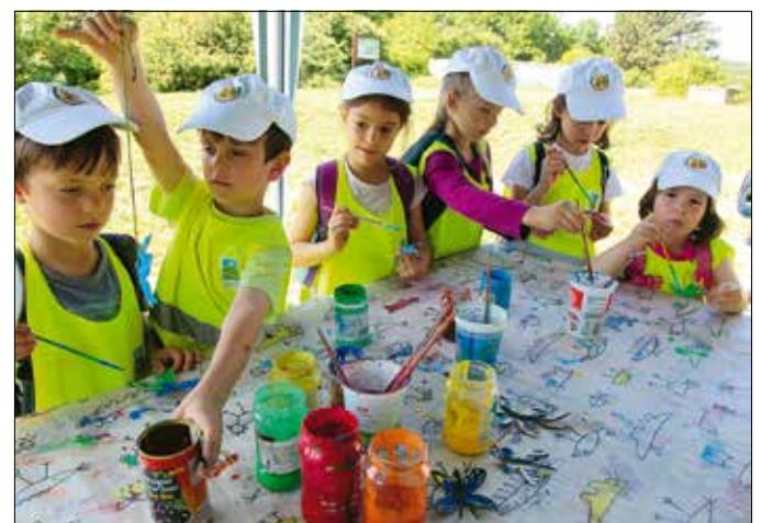
A gyerekek különféle tárgyakat készítettek hulladékból

A kis-sváb-hegyi élményösvény avatása alkalmából – a Hegyvidéki Önkormányzat támogatásával – interaktív programokat szerveztek a környezettudatosságra való nevelést zászlajára tűző egyesület tagjai. A hulladékok újrafelhasználásának jegyében vécépapír-gurigákból békákat és baglyokat, tojástartókból pedig pillangókat készítettek az óvodáscsoportokkal, a képzeletet megmozgató tárgyanimációs foglalkozáson pedig egyebek mellett azt mutatták be, hogyan lehet egyetlen nejlon-