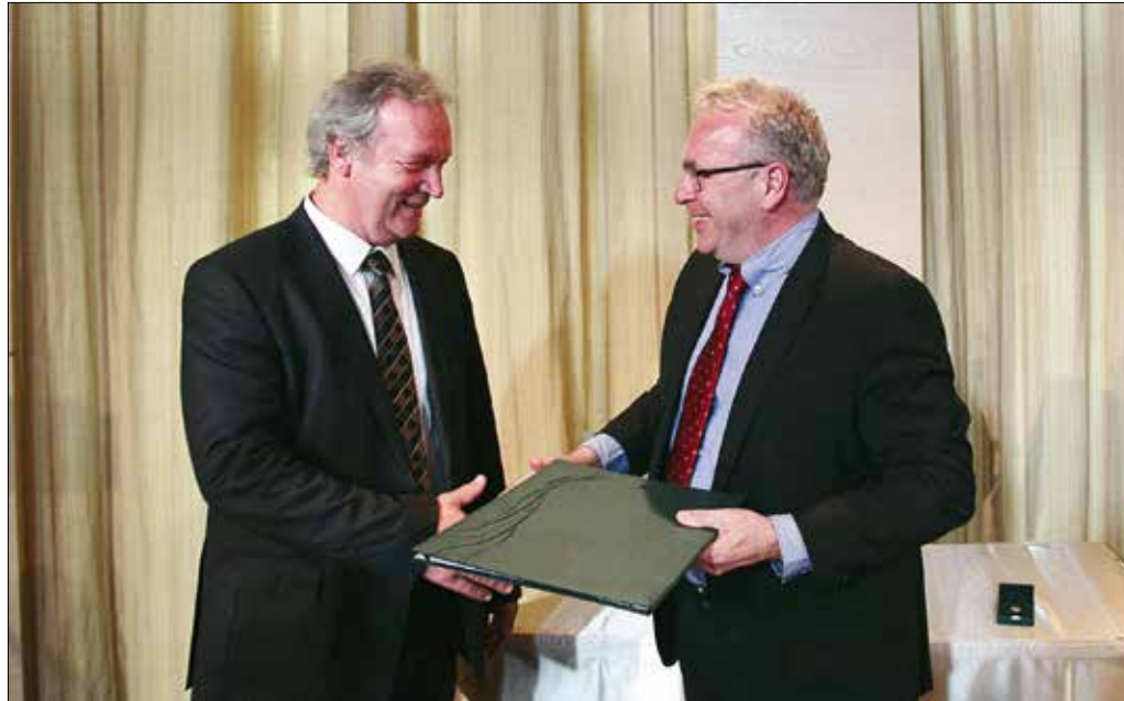
Freund Tamásnak Pokorni Zoltán polgármester adta át a címmel járó oklevelet

Pokorni Zoltán polgármester köszöntőjében visszaemlékezett arra, hogy 2000-ben, az első Bolyai-díj átadásánál neki is módja volt részt venni annak eldöntésében, ki kapja meg az elismerést.