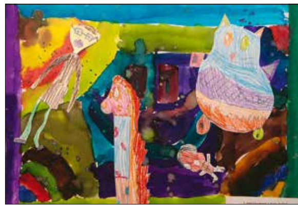
Díjnyertes pályamű a legkisebbek korcsoportjában

„A technikai tudás mellett leginkább az egyediséget figyeltük. Fontos, hogy alkotás közben kibontakozhasson a gyerekek fan-