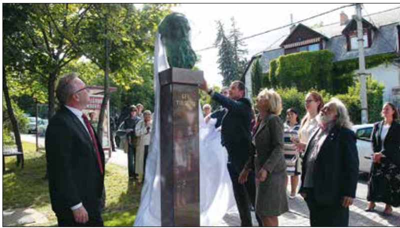
Az önkormányzat vezetői és az alkotó közösen leplezték le a szobrot

Tolsztoj és a 19. századi orosz írók jelentenek.