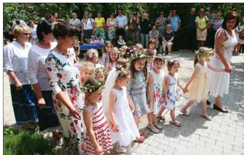
Az óvodások vidám műsort mutattak be a vendégeknek az ünnepélyes átadón