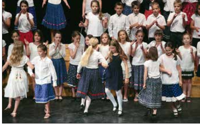
A Tamási iskola Kicsinyek Kórusa is fellépett a MOMkult-ban

„Nekik köszönhetően a hegyvidéki diákok most egy kicsivel nagyobb betekintést kaptak más kórusok munkájába, és persze az újpesti kórusnak is kiváló fellépési lehetőséget biztosított a professzionális hangosítással felszerelt MOM Kulturális Központ” – mondta el lapunknak Hraschek