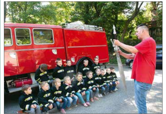
Sok hasznos tanácsot kaptak a gyerekek, hogy mit tegyenek, ha tűz van

Az elméletet a gyakorlatban is bemutatatták a vendégek, egy speciális tepsiben tüzet gyújtottak, és poroltóval, szakszerűen eloltották a lángokat. Donát komoly tapasz-