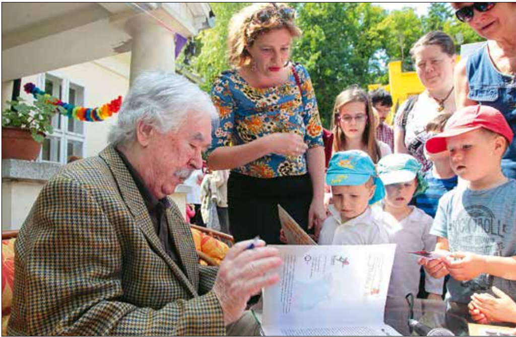
A meserajongók azonnal megrohanták Csukás Istvánt

Tréfás játékok, érdekes mesék, kedves pillanatok, interaktív kiállítás és közös éneklések tarkították a Hegyen-Völgyön Mesefesztivált a Lívia-villában. A különleges családi program vendége volt Csukás István Kossuth-díjas író is, akiről beszélgetés közben olyasmi derült ki, amire talán még a rajongói sem gondoltak volna.