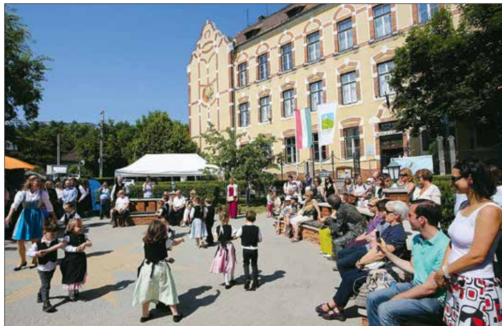
A Normaia Óvodába járó gyerekek műsora nyitotta a szombati programot