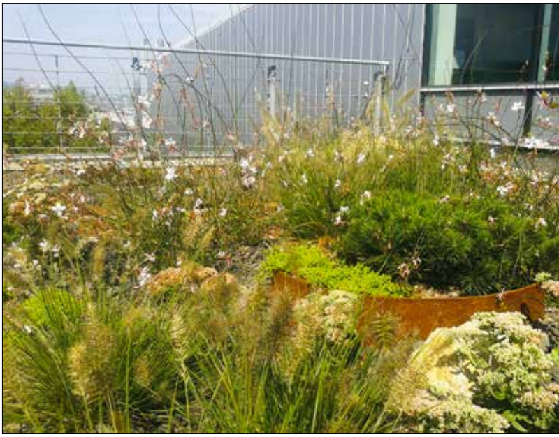
Tetőkert az Alkotás Point irodaházban

Az ingatlanuladonosok számára hasznos az is, hogy a zöldtető legalább a duplájára növeli a vízszigetelő lemez élettartamát, a termőréteg ugyanis elnyeli a hőingadozást és a közvetlen napsugárzást, aminek köszönhetően a vízszigetelő anyag sokkal hosszabb idő alatt öregszik el. A zöldtetőknek fontos szerepük lehet abban is, hogy a hirtelen lezúduló csapadék ne okozzon komoly károkat a városi infrastruktúrában, hiszen a kertekhez, parkokhoz hasonlóan ezek is olyan biológiai-lag aktív felületek, amiknek jelentős a vízmegtartó és vízvizszartartó képessége.