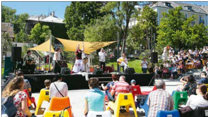
A Holddala Nap Zenekar gyerekekkel közös játékkal kötötte össze koncertjét

Művészlelek, társaságkedvelő, szószátyár, táncos kedvű, felfedező, figyelő – minden gyermek megtalálhatta a hozzá leginkább illő elfoglaltságot, a Városháza tér