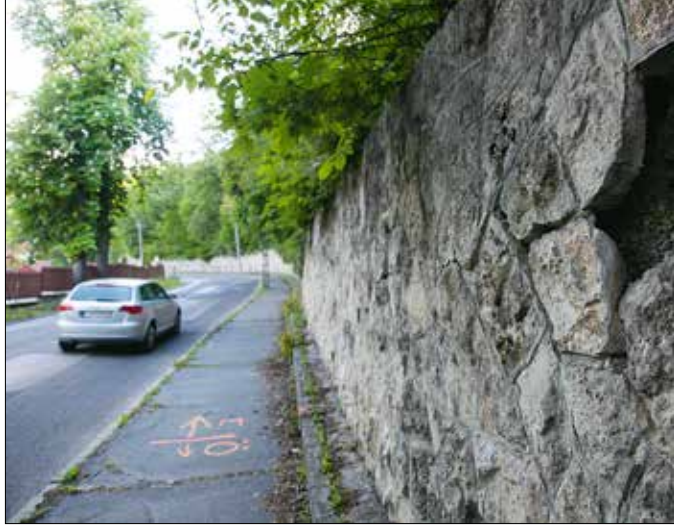
Több helyen meglazultak a támfal kövei a Zugligeti úton, lezárták a járdát

Jelentősebb felújításon esik át a Csemegi lépcső, az Álom utcát és