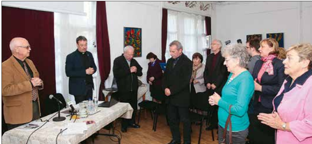
A Keresztény Értelmiségiek Szövetsége minden segíteni óhajtó emberhez szól

vetően kezdődtek meg az egyeztetések, amelyek mostanra értek be.