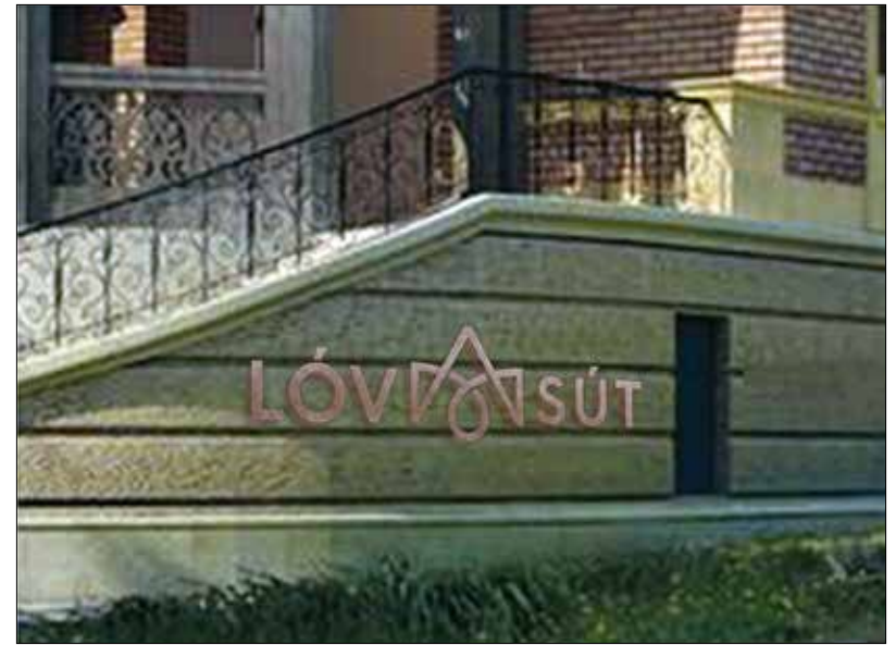
Részletek a közönségsvavazásra bocsátott két arculati koncepcióból

„Mindent érdekes és izgalmas kihívás, amikor tradicionális értékek kerülnek kortárs kontextusba. Ilyen esetben a tervezők