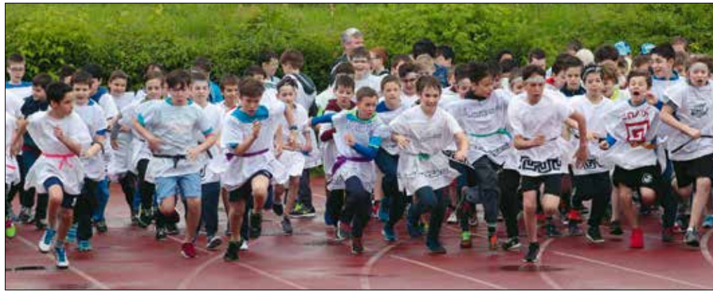
Több sportág mellett rövid- és hosszútávú futásban is összemérték tudásukat a diákok

Részvételi csúcst hozott az idei Hegyvidéki Olimpia, 460 ötödikes kerületi diák próbálta ki ügyességét az ókori versenyszámokban a Testnevelési Egyetem dr. Koltai Jenő Sportközpontjában. Győztest ezúttal sem hirdettek, a bajnoki érem azonban mindenkinek járt, míg a tanév során a legjobban teljesítő diáksportolók egy-egy különleges póllal is gazdagabbak lettek.