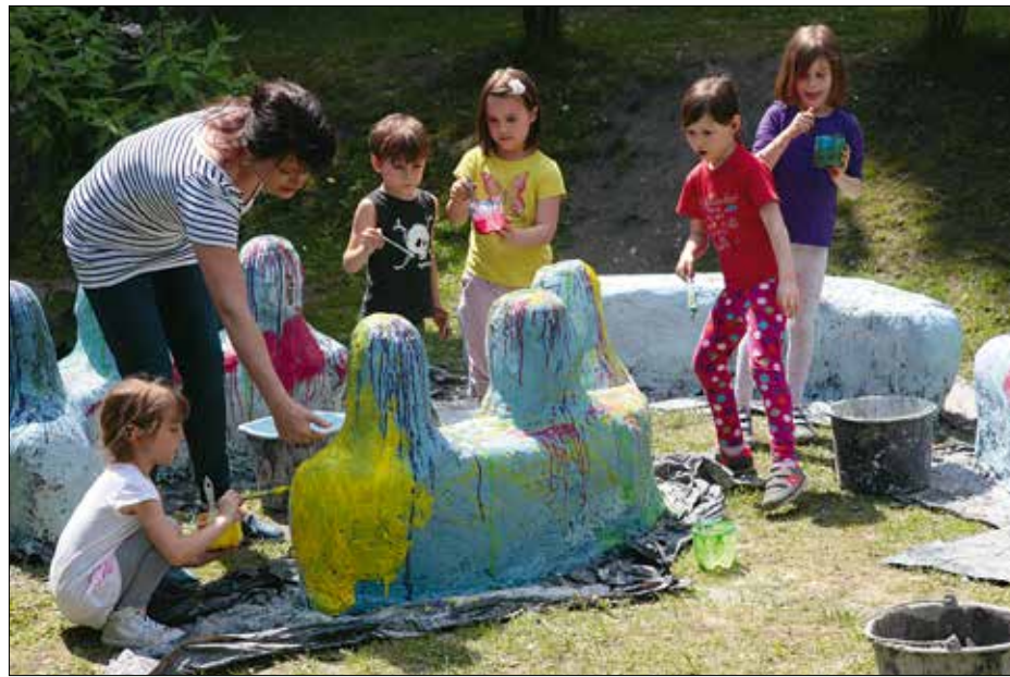
A pillekőből formált vár önkéntes dekorátőrei

A Pillekő-program foglalkozásainak ezekben a hetekben négy óvoda biztosít teret, a többi önkormányzati fenntartású intézményben az ősszel kezdődhet meg az alkotómunka. Az első óvodák egyike volt a Mesevár, ahol – hűen az intézmény elnevezéséhez – a csoportok kis várkastélyt építettek, majd befestették azt pöttyök-