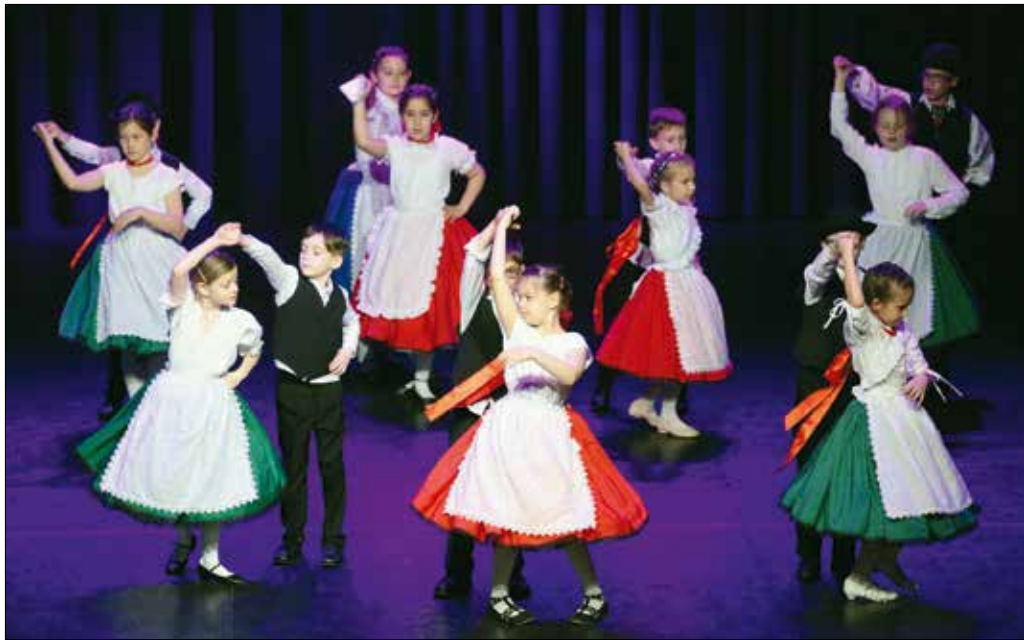
Sashegyi Néptánc Együttes

A fiataloknak nemcsak megismerniük, tanulmányozniuk és elsajátítaniuk, hanem ápolniuk és óvniuk is kell a hagyományokat, amire kitűnő alkalmat nyújt a XII. kerület egyik patinás rendezvénye, a Hegyvidéki Néptánc Találkozó. Az idei fellépők előadásai sem okoztak csalódást a MOM Kulturális Központ közönségének.