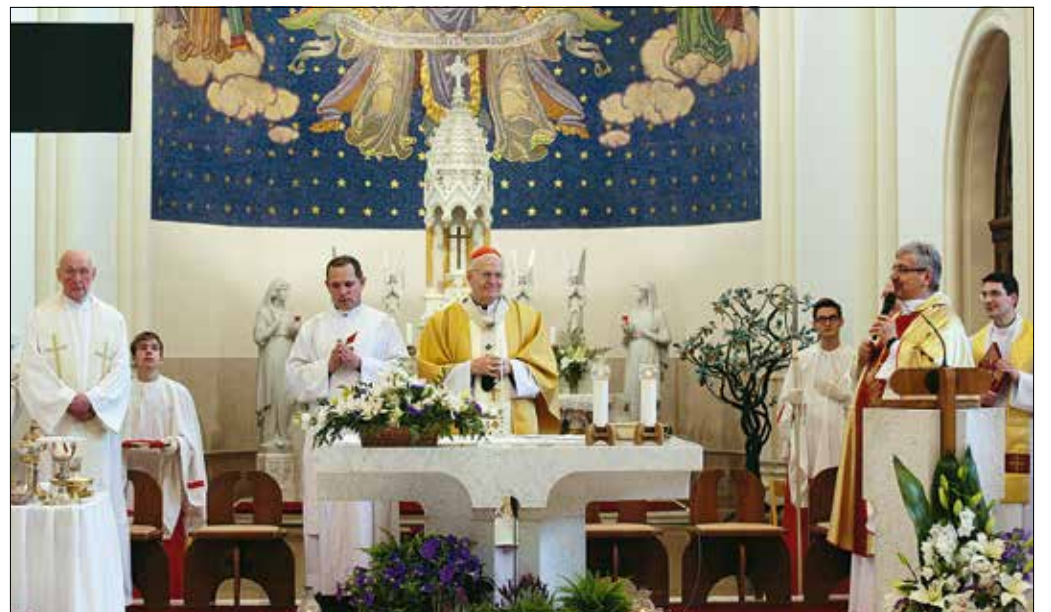
Ünnepi szentmisét celebrált Erdő Péter bíboros

A legkülönbözőbb rendezvényekkel, egybeköt orgonakoncerttel, hangversenyekkel, záródokumentumokkal, a környék iskoláit megmozgató templomtörténeti vetélkedővel, sportversenyekkel tették emlékeztetésé a Zugligeri Szent Család Plébániatemplom közösségének tagjai a Szarvas Gábor úti templom felszentelésének századik évfordulóját. Önkormányzati segítséggel kifestették az épületbelső felújították és ismét felszentelték az orgonát.