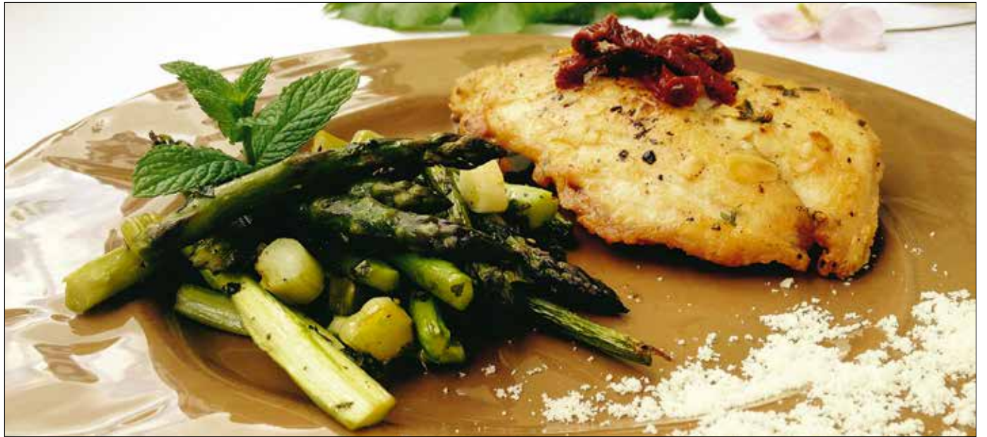
Különleges ízkombináció: aszalt paradicsommal töltött csirke, hozzá köretként sült spárga, újhagyma és mentalevél

Az aszalt paradicsomot kiszedjük az olajból, egy papíron lecsöpögtetjük, majd egészen apróra kockázzuk. Friss bazsalikom-, oregánóleveleket metélünk, és kevés parmezánnal együtt az egészet összedolgozzuk. Ezzel a masszával kell megtöltenünk a beszórt, borsozott csirkemelleket, amelyeket ezután kétrét hajtunk, és a szeleknél klopfolóval finoman ütögetve lezárunk. Friss kakukkfűlevelekbe és szeletelt mandulába forgatjuk a húsokat, s közepes lángon pirosra sütjük.