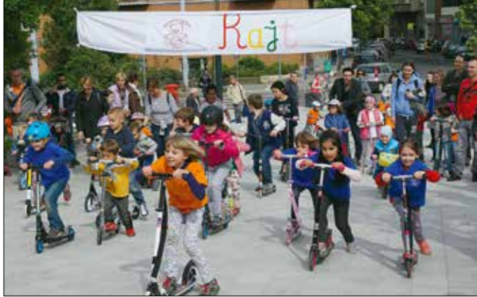
Jó hangulatban és jó tempóban kezdődött a felvonulás