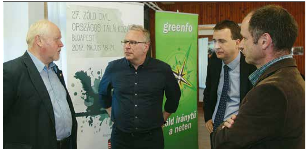
Budapesten elsőként a Hegyvidéken találkoztak a környezetvédők és meghívott vendégeik

aktivitása több ponton kapcsolódik a Zöld Mozgalomhoz. A további szervezők között volt a Magyar Madártani és Természetvédelmi Egyesület, a Védőgyelet, a Felelős Gazdtróhósók, az Átalakuló Közösségek, a Gyöngybagolyvédelmi Alapítvány, valamint a Turista és Természetjáró Információs Egyesület (TUTI) is. A találkozó a Zöld Civil Együttműködés tagjai mellett részt vehetett