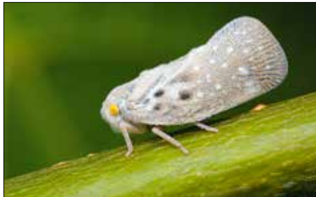
Október végéig eltarthat a rajzása

és leveleket. A zöldhulladékot azonnal tegyük zsákba, amit zárjunk le, és vigyünk el a kertből! Használhatunk hosszan felszívódó növényvédő szereket is, mint amilyenek a mospilan, a tiamectoxam vagy az acetamiprid hatóanyagú termékek. Bármilyen permetezőszert választunk, előtte egyeztessünk szakemberrel, nem mindegy ugyanis, hogy ezeket mikor, milyen időjárási körülmények között, a rovar melyik fejlődési állapotában alkalmazzuk!