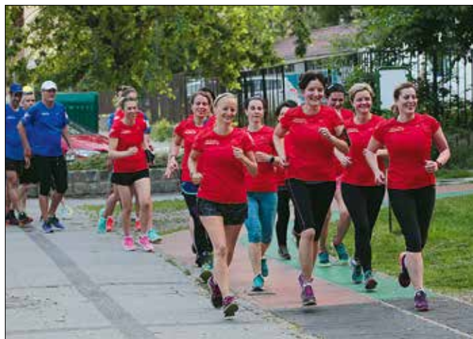
A futóklub tagjai hónapokig készültek az embert próbáló versenyre