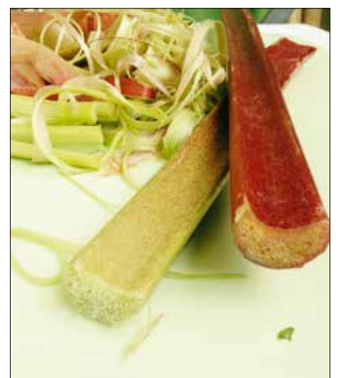
Egy-két percnél tovább nem érdemes főzni

Tippek: főzni nem érdemes egy-két percnél hosszabb ideig. Illik hozzá a vanília, a szegfűszeg vagy