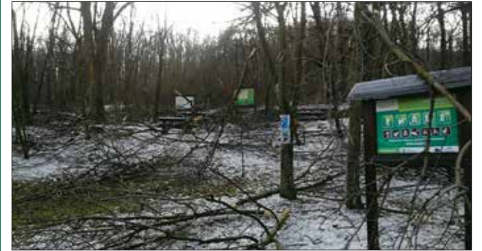
A legtöbb gondot a kitért fák, a letört ágak okozzák

A már lombosodó ágak még nehezebben viselték a hó súlyát, így