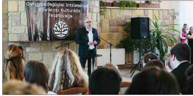
A fesztiválnak már huszonegy éve a Hegyvidék ad otthont