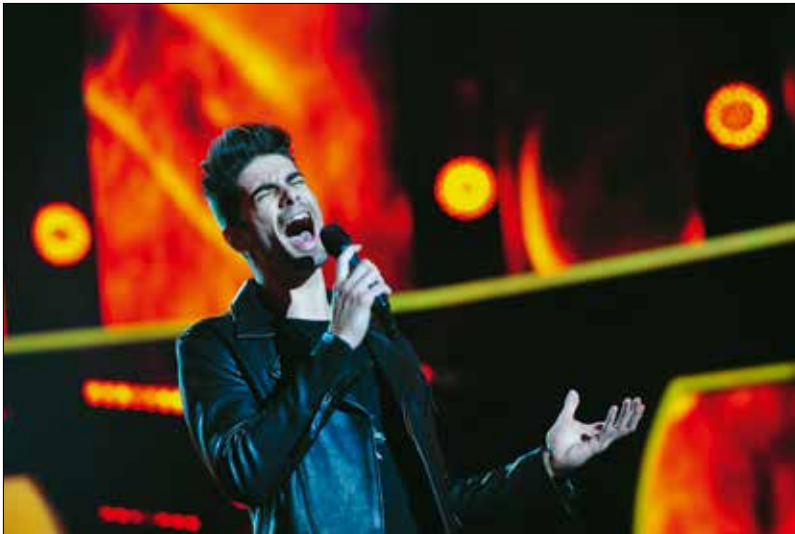
Díjai, elismerései: InStyle Style Award – Fiala tehetség (2016) • Petőfi Zenei Díj – Az év felfedezettje (2016) • VIVA Comet – A legjobb dal (2016) • InStyle Style Award – Legstílusosabb férfi (2017)

mény munka, a folyamatos felkészülés. Aki ezt belátja, annak lehet jövője a szakmában: meglesz az alázat, a céltudatos munka, ami mind szükséges ahhoz, hogy az ember fejlődni tudjon."