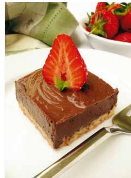
Mennyei csemege az epres csokikocka

4 dl tej 4 dl tejszín 12 tojás sárgája 20 dkg cukor 38 dkg 72%-os minőségű keserű csokoládé 1 ek kakaópor