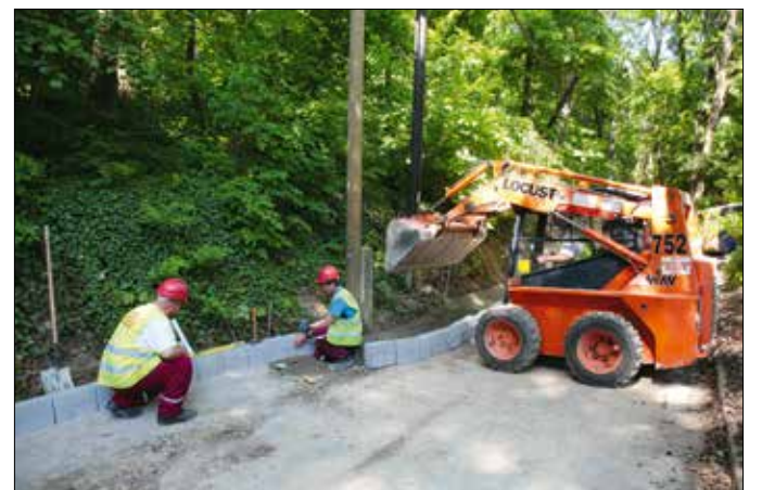
Átépitik az Irhás árok felső szakaszát

Elkezdődött a Csobolyó lépcső részleges felújítása, a munkálatok célja a botlásveszély megszüntetése. Térkövel burkolt, egyszerre hat-hét autó fogadására alkalmas parkoló épül a Virányos úton, a Visszhang utca és a Márfy utca közötti részen. Ennek azért van jelentősége, mert