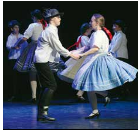
Táncosok a Fekete István iskolából