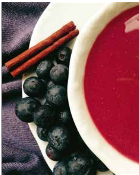
Áfonyaleves: üdítő színű és ízű

Az epertárhoz az epret megmossuk és leszárítjuk. Néhány szemet félretereszünk dekorációnak, a többit apró kockákra vágjuk. Kevés mézet, mentalevet és pár csepp jó minőségű balzsamcetet adunk hozzá. A tálalásnál jól jöhet egy kevés epervélő vagy más apró kiegészítő, de ne feledkezzünk meg a dekorációhoz kimentett eperszemekről sem!