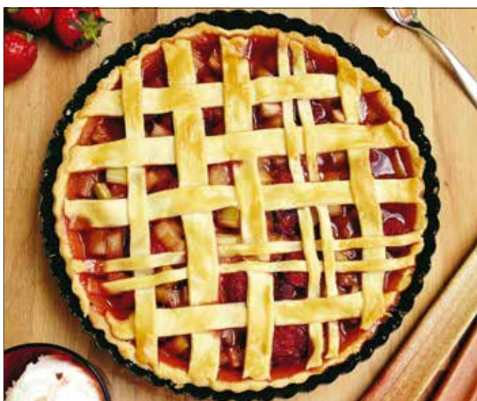
Az eper és a rebarbara jól kiegészítik egymást