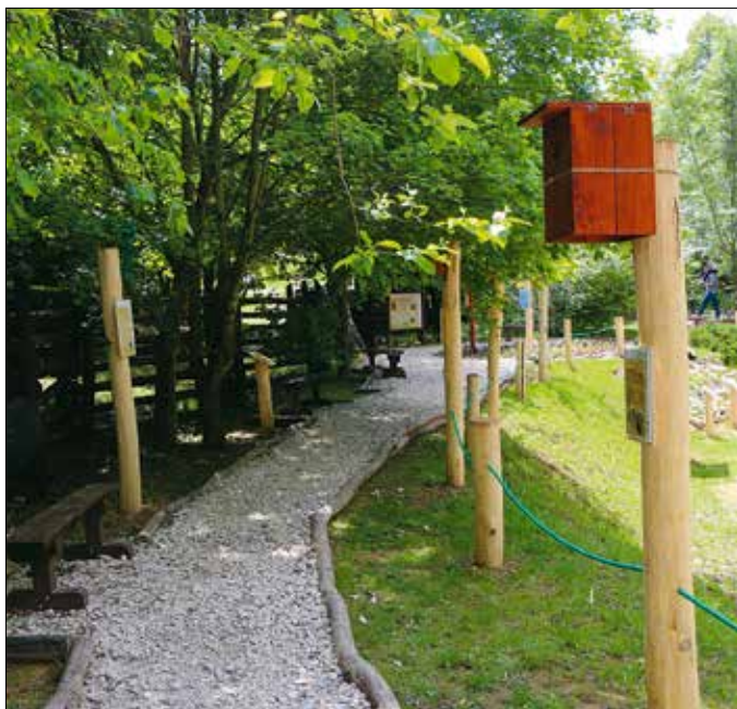
Odűbematató a tanösvényen

Május közepétől madárbarát kert gazdagítja a Budakeszi Vadspark amúgy is sokszínű látványosságait. A tanösvény nem is annyira a leküzdendő távolsággal, mint inkább a közben elsajátítható ismeretek képráztatja a látogatókat.