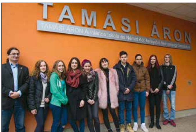
A Schulbrücke magyar csapata

Az EJBW (Europäische Jugendbildungs- und Jugendbegegnungsstätte Weimar) szervezésében, valamint a Robert Bosch Stiftung (Robert Bosch Alapítvány) és a Deutsche Nationalstiftung (Német Nemzeti Alapítvány) támogatásával megvalósuló nemzetközi együttműködésben, egyedüli magyar partnerként, a Tamási Áron Általános Iskola és Német Két Tannyelvű Nemzetiségi Gimnázium is részt vesz immár három éve – a legutóbbi találkozóra néhány héttel ezelőtt került sor az UNESCO világörökségi listáján szereplő Heidelberg városában.