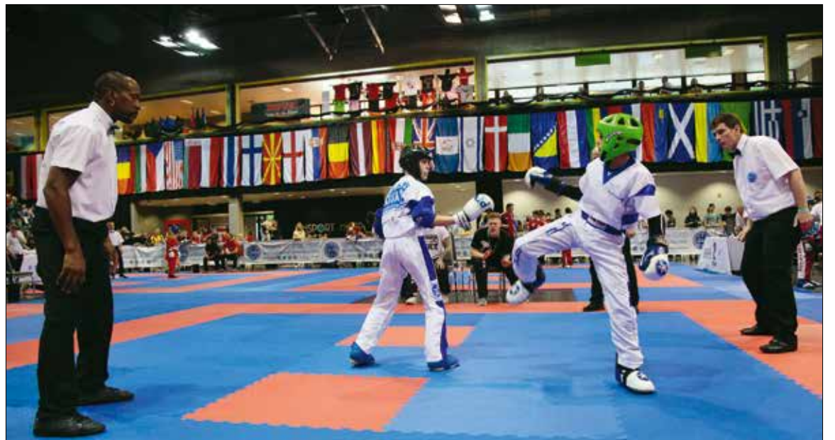
Rekordszámú nevezés érkezett, 38 országból 2700-an indultak a rangos kick-box-versenyen

„Rengeteg segítséget kaptunk Szabó Tündétől, az Emberi Erőforrások Minisztériumának sportért felelős államtitkártól, Tarlós István főpolgármestertől, a Nemzeti Versenysport Szövetséget irányító Mészáros Jánostól, a tizenkettedik kerület vezetőitől, valamint Német Szilárdtól és Schmitt Páltól. Nélkülük biztosan nem tudtunk volna ilyen kiváló világversenyt rendezni, ahogyan a MOM Sport is minden dicsőretem megérdemel, hiszen a Novotel Budapest Cityvel karöltve tökéletes házigazdának bizonyult” – sorolta Király István, aki bízik abban, hogy a novemberi, budapesti vi-