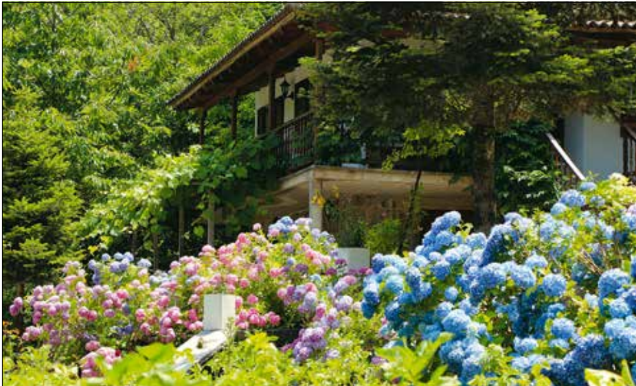
Különböző színű hortenziák egymás mellett

A kerti hortenziaváltozatok szabadban nevelve csak a nyár második felében borulnak virágba. A hazánkban elterjedt másik faj, a cserjés hortenzia ellenben már júniusban kibontja virágait. Maga a növény habitusában olyan, mintha a kerti hortenzia kistestvére lenne; fűrészes levelei hasonló alakúak, de törékenyek és kicsik, hajtásai nyúlóak, bokra lazább, levegősebb,