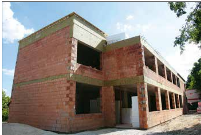
A 780 négyzetméteres „E” épület szerkezetkész – bokrétaünnep a kivitelező, a Klebelsberg Központ és a Hegyvidéki Önkormányzat képviselői jelenlétében