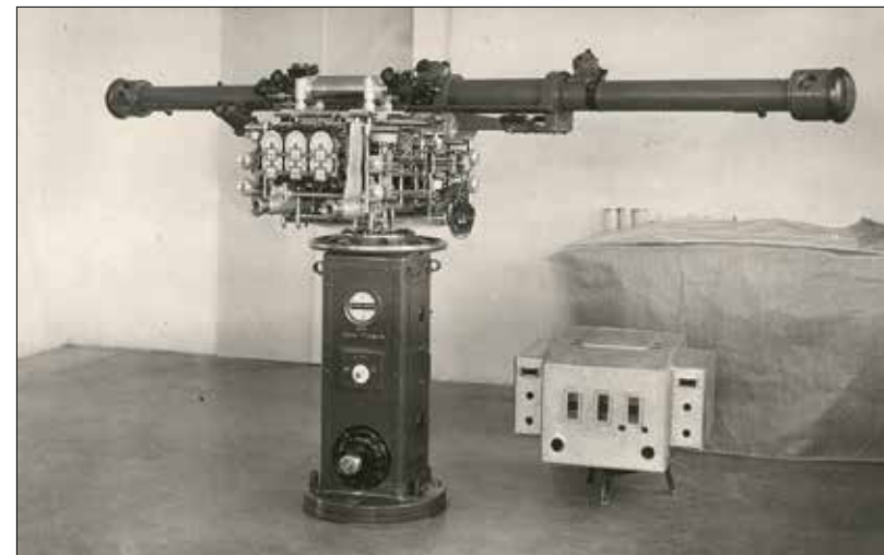
A lövekmű a légvédelmi ágyúk kezelésénél játszott fontos szerepet