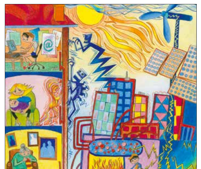
Mező Dorina rajza