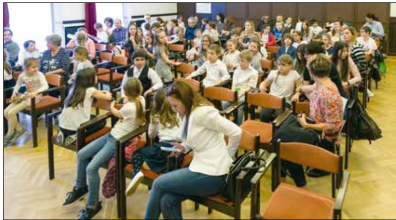
A közönség és a szavalóversenyre készülő diákok