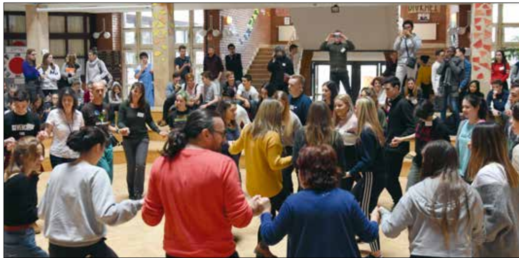
A tánc tanulásba mindenki szívesen bekapcsolódott

A Tatabányán rendezett finálé szóbeli fordulójában a versenyzőknek egy történetet kellett elmesélniük néhány kép alapján, továbbá egy jelenet bemutatása volt a feladatuk. A jókais lányoknak szüleinél napi partiszervezés jutott témaként, ami nem okozott számukra