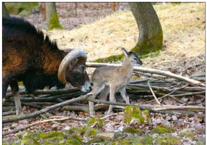
A ma még aprócska mufonbárányok egy év alatt megtízszerezik súlyukat

A jövevények a többi erdei patáshoz képest gyorsan talpra állnak, néhány óra elteltével már követik a nyáját, és ismerkednek a tavaszi illatú erdővel. Jól elfoglalják magukat, csak akkor kere-