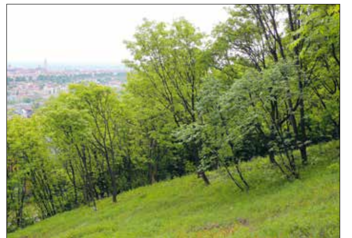
A hasonló látványokért (is) szeretjük a Hegyvidéket

elektronikusan (www.kompostmester.hu) regisztrálni. A jelentkező ezután részletes tájékoztatást kap az áprítás elvégzéséről. A