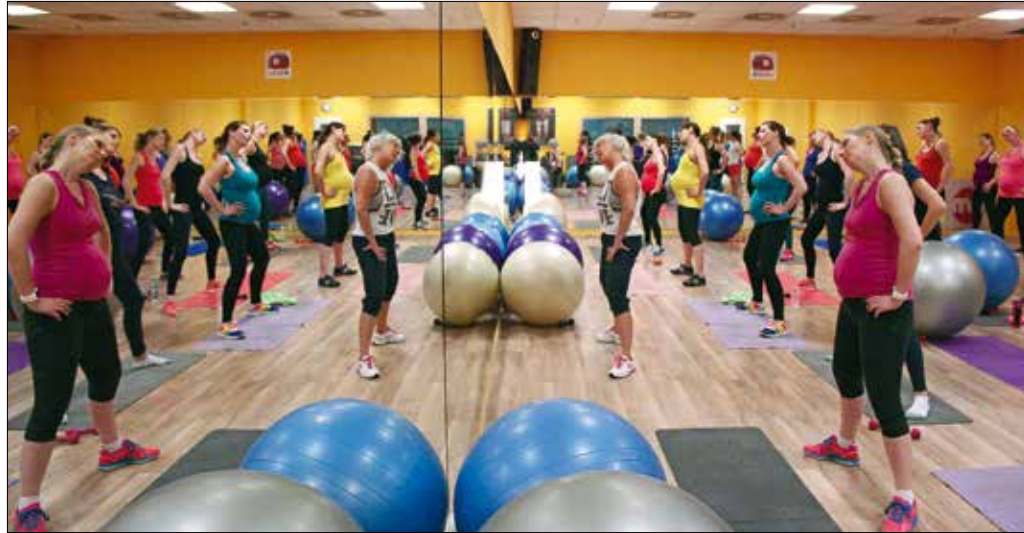
A szülés fizikai munka, amihez erő és állóképesség kell

ELTE testnevelés–rekreáció szakára, ugyanis érdekeltek a speciális mozgásformák. Általános iskolákban tanítottam, majd várandós lettem, és elkezdtem kismamatornákra járni. Ezek az órák olyanok voltak, mint egy kellemes, finom atmoszférát teremtő gyógytorna. Az ikrek alatt fel is szedtem harmincöt kilót. Tudod, hogy van ez... Egy kicsit balra billentem a fejed, majd jobbra, lábfejkörzéseket csinál, nagyon óvatos vagy, simogatod a hasad. Sokan azt mondják,