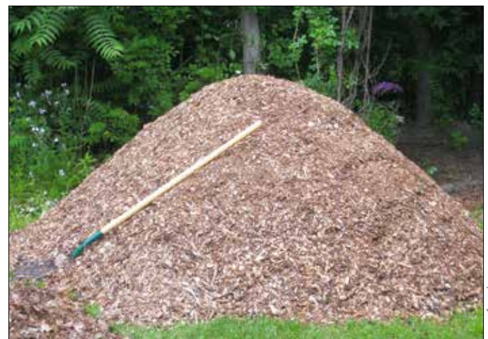
Az értékes mulcs számos módon felhasználható a kertben

Az egy lakcímen legfeljebb 10 köbméter friss ág áprítását kínál