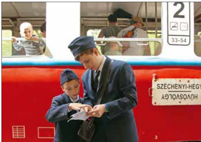
Kis és még kisebb vasutas

Hetvenedik születésnapját ünnepli a MÁV Széchenyi-hegyi Gyermekvasút. Az évforduló alkalmából különvonat indult, amelyen az