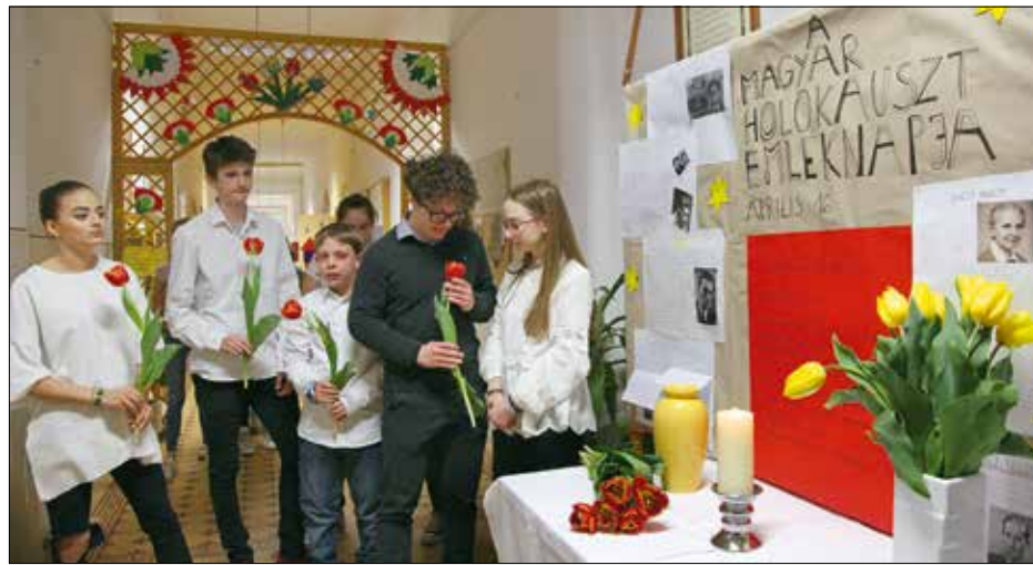
A mai napig felfoghatatlan, ami akkor történt...

Az iskola otthont adott a Zachor Alapítvány vándorkiállításának, amely a civil szervezet által kiírt országos képzőművészeti pályázatra beérkező alkotásokból válogat. „A művészet az elmondhatatlan tolmácsa” című tárlaton a holokauszt-túlélőkkel és szemtanúkkal felvett interjúk alapján készült rajzok, montázsok, festmények láthatók. Ezek különlegessége, hogy a filmekben szereplők életrajzi adatait és fényké-