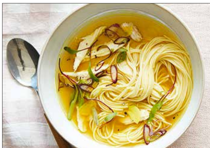
A kurkumás-gyömbéres csirkeleves gyorsan elkészíthető

2 gerezd vékonyra szeletelt fokhagyma ¼ tk kurkuma 1 tk reszelt gyömbér 1 tk extra szűz olívaolaj