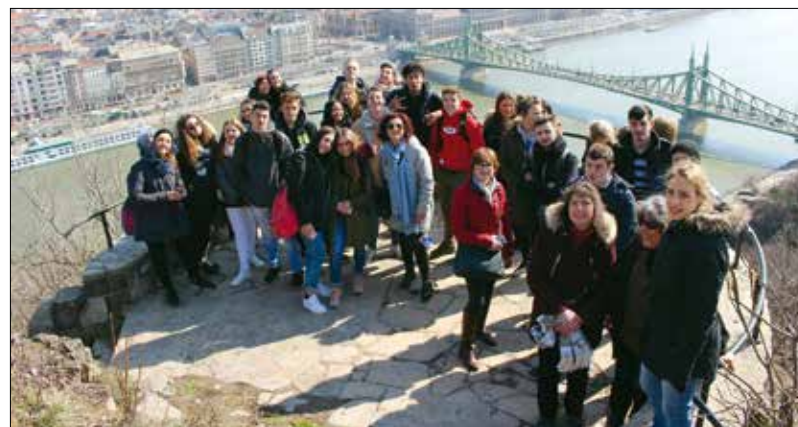
Városnézésen a nemzetközi csapat

részeként nemzetközi ételkóstoló és tánc tanítás is volt a gimnáziumban, továbbá együtt nézték meg Budapest nevezetességeit, közösen fedezték fel a várost.