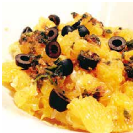
Izgalmas ízkeverék: édes-sós-csípős saláta

A narancsokat meghámozzuk, a vékony héjuktól is megszabadítjuk őket, majd félbe-, harmadba vágjuk, és egy tálba halmozzuk a gyümölcsöket. Az olajba beletörünk két fokhagymát, elkeverjük benne a pirospaprikát, a cukrot, a chilit, a római köményt és az ap-