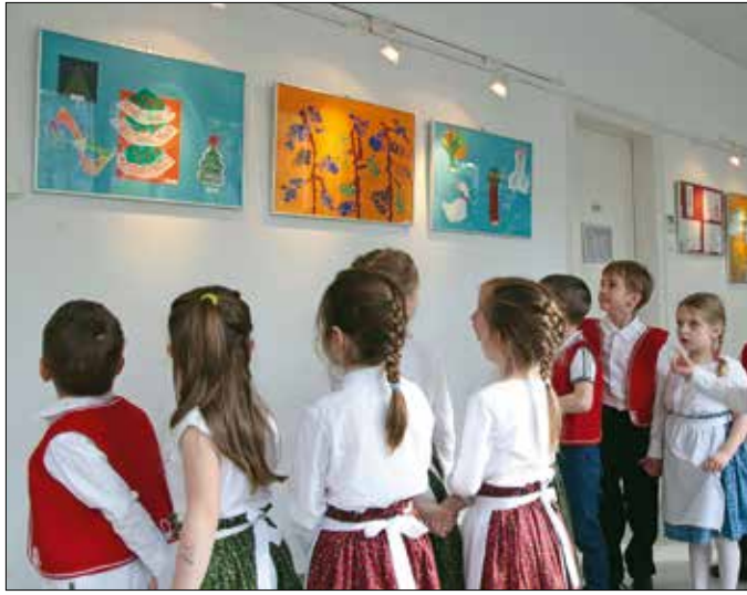
A gyerekek különleges módon látják a világot

Az ünnepek melegségéről és a hagyományörzés értékéről mesélnek a hegyvidéki óvodások alkotásai a polgármesteri hivatal új kiállításán.