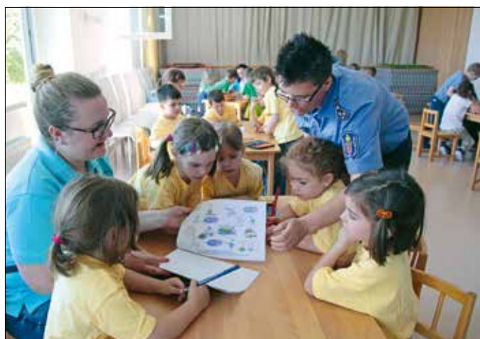
Az óvodások játék közben ismerkednek meg a közlekedési szabályokkal