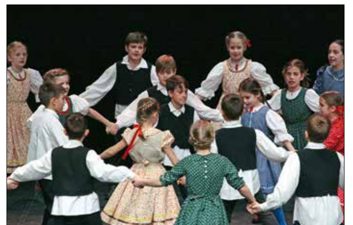
Az ELTE Gyertyánffy István Gyakorló Általános Iskola néptáncosa

biék műsorát, a színházterem másik felében helyet foglaló szülő és hozzátartozók ugyanúgy vastapsal jutalmazták a más iskolából érkező gyerekeket, mint a sajátjuk produkcióit, leghátul pedig a bölcsődés és óvodás kis-