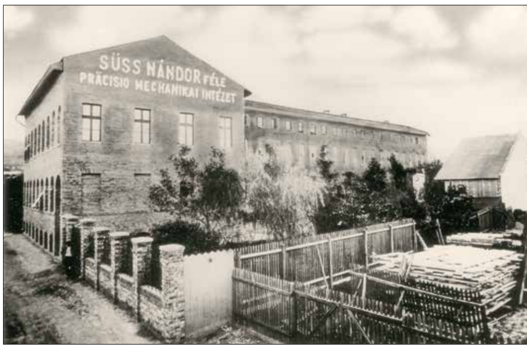
A Süss Nándor-féle Precíziós Mechanikai Intézet 1905-ben

A háborús konjunktúrában új repülőgépjárak létesültek, aminek köszönhetően a Süss-féle intézet is új profilhoz jutott: navigációs műszereket, optikai-fizika és repülőgépjárak (például optikai távmérőket) készített ezekhez. Ugyanakkor a bécsi Arsenal részére tüzérségi műszereket szállított. A megrendelés nagyságát mutatja, hogy a gyár saját irodát nyitott Bécsben. Termékinalatában lövekművek (amik a légvédelmi ágyúk kezelésénél