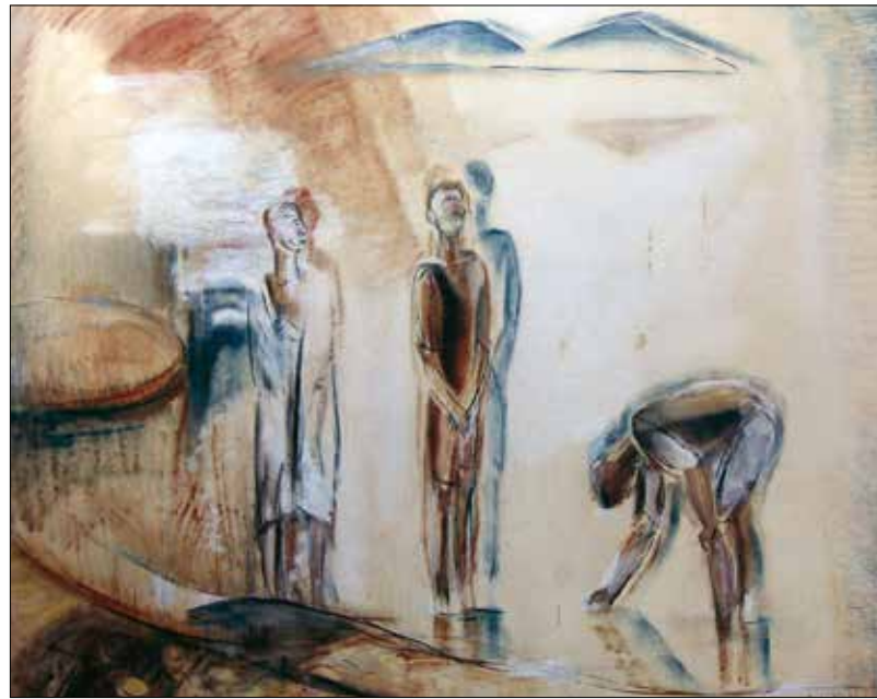
Keresztelő Szent János

Egry József (1883–1951) a magyar festészet egyik legeredetibb, egyetlen irányzathoz sem tartozó