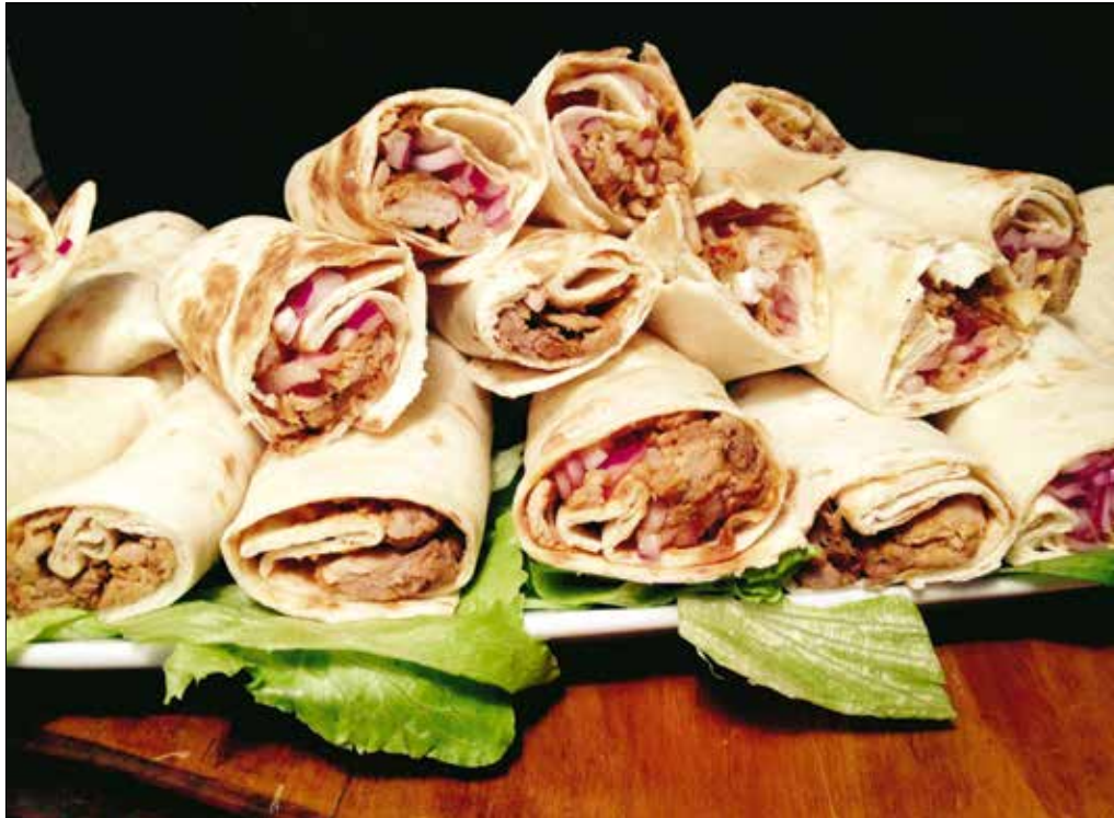
A tortillalapokba töltött, szaftos, dél-amerikai ízesítésű sertéshús kiadós ebéd lehet

1,5 l csirkealaplé 1 csomag angyalhajtészta vagy cernametélt 1 csirkemell vagy 2 csirkecomb 1 ek friss citromlé mogyoróhagyma