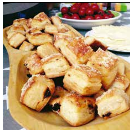
Melegen és hidegen is kiténő vendégváró

Legalább egy órát hagyjuk pácolódni a húst, mielőtt betoljuk a