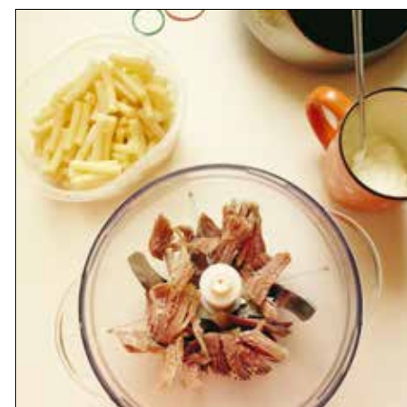
A megmaradt sonkából sonkás tészta készíthető

tunk, hogy a levesben főtt zöldséget egy tejjel áztatott zsemlel, kávéskanálnyi zsiradékkal és egy tojással összeállítjuk, ízesítjük, és krocketformában olajban kisütjük. Kelkáposztához, paradicsomos káposztához vagy parajhoz is adhatjuk.