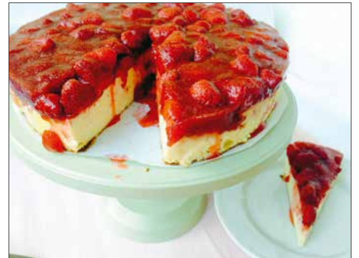
Nem éppen könnyű, de annál finomabb csemege

Melegítsük elő a sütőt 180 Celsius-fokra. Keverjük el a cukrot a túróval és a krémsajttal, adjuk hozzá a tojássárgáját, majd a lisztet, a citrom levét és reszelt héját. Verjük kemény habbá a tojások fehérjét, aztán forgassuk bele a tésztába. Öntsük tortaformába, és kb. 30 perc alatt süssük készre.