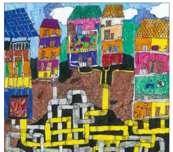
Frigyesi Jakab rajza

„Kevesen tudják, hogy a távfűtés környezetbarát, ugyanis sokkal kevesebb szennyezőanyagot bocsát ki az egyéb elterjedt fűtőmódokhoz képest” – mondta el a