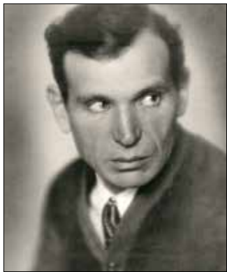
Egry József festőművész