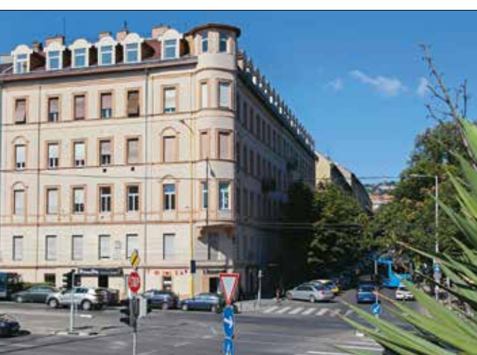
Homlokzatfelújításra beadott pályázatoknál a falfirkákat 168 órán belül el kell távolítani

Külön kezelték az előre nem látható, vis maior eseteket. Ezek megoldására a mostani elbírálási időszakban több mint ötmillió forintot fordítottak. A normal pályázatoknál a legtöbb – tizenöt – ház a tetővel kapcsolatos felújításokra kért és kapott támogatást. Elektromos felújításra tizenkét, homlokzatrekonstrukcióra tizenegy, gázalavezeték- és kéményjavításra hat-hat pályázat érkezett.