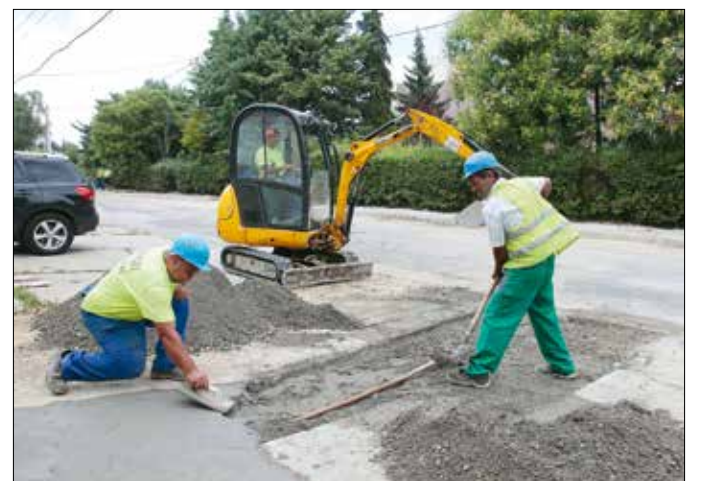
Megújul a Nógrádi utca a Szendrő utcától a Szent Orbán térig

Hamarosan birtokba vehetik a hegyvidékiek a Gesztenyés kertben kialakított futókört. A kényelmes gumiburkolattal ellátott, nagyjából a meglévő gyöngyos ösvényt követő pálya 400 méter hosszú. A színről a parkot használók egy két héten át tartó helyszíni felmérés során döntö-