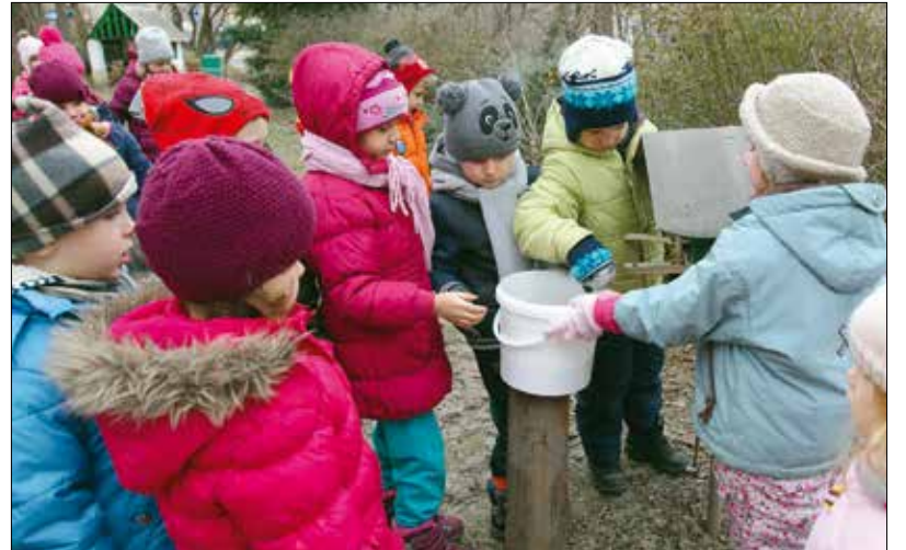
A Madárbarát Hegyvidék Program a városmajori óvodások körében is népszerű

önkormányzat, pályázati formában. A nevelési intézmények az igényelt támogatásból fejleszthetik tovább tehetségműhelyeiket a játékos- és eszközpark korszerűsítésé-