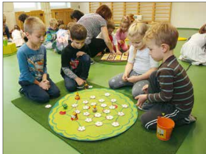
A Mézeskuckó-program a méhek világát mutatta be a gyerekeknek

A középső és nagycsoportos gyerekek a műhelyek mellett kerületi szintű kiemelt programokban vehetnek részt. A most véget ért nevelési évben a Mézeskuckó-program keretében a méhészet világába kalauzoló, játékos foglalkozásokon mélyíthették el természeti ismereteiket. Korábban ugyancsak a természet iránti érdeklődésük felkeltését célozta a Madárbarát Hegyvidék Program.