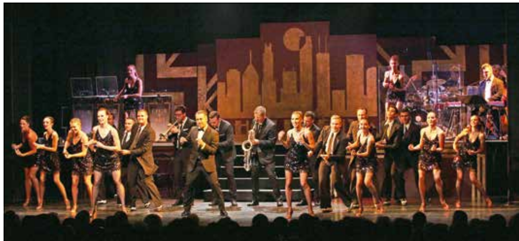
Óriási show volt, a zenészek ezúttal színészként és táncosként is bemutatkoztak

A Group'n'Swing négy fúvósa és a ritmusszekció véperzdítő swinges hangzásvilágot teremtett.