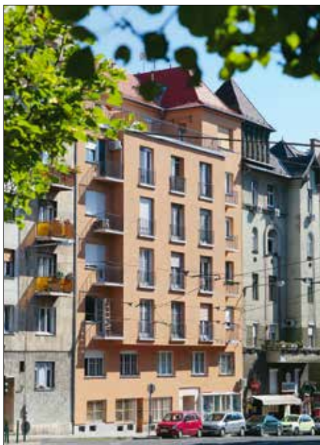
Minden pályázó lakóközösség kapott támogatást

A támogatás mértéke 4–8 lakásig 55 ezer, 9–12 lakásig 50 ezer, 13–20 lakásig 45 ezer forint, 20–49 lakásig 40 ezer forint lakásonként, de nem haladhatja meg a felújítás összköltségének harminc százalékát vagy a másfél millió forintot. Húsz százalékkal növelhető az összeg a graffitit eltávolítását és a graffitivédelem elvégzését is magában foglaló homlokzatfelújításnál.