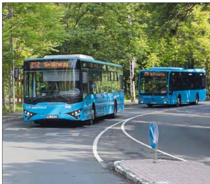
Három buszjárat együtt szolgálja ki a Normafa kirándulóforgalmát

zodó menetrend lép életbe. A Budapesti Közlekedési Központ tájékoztatása szerint a fejlesztés bevezetését követően vizsgálni fogják az érintett járatok utasforgalmának alakulását.