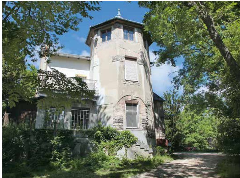
Az Eötvös út 48. alatti, helyi védettséget élvező nyaralóvilla felújítása is része a rehabilitációnak

Az önkormányzat a beérkezett javaslatok figyelembevételével dolgozta ki a végső terveket. A nyertes koncepció alapján a megújítandó régi villa az információs központnak, a környék múltját és természeti értékeit bemutató interaktív kiállítóteret, továbbá kávézókat és az üzemeltetéshez kapcsolódó irodáknak biztosít majd helyet, míg a látogatók által igényelt különféle szolgáltatások és az egyéb üzemi funkciók az új, terepbe simuló épületben jelennek meg. Az új épület tetején egész évben használható, műanyag borítású tanulóspályát alakítanak ki.