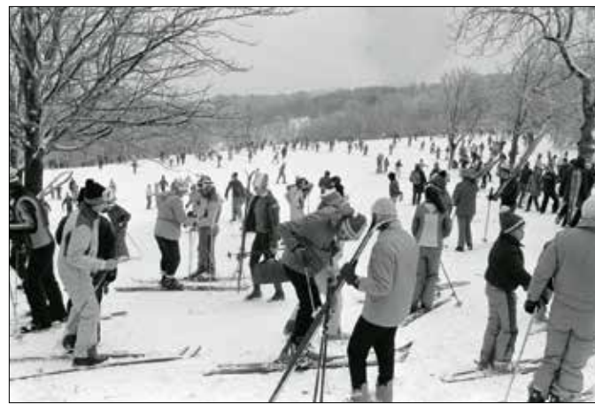
Síelő a Normafa lejtőjén 1980-ban

A kis „történelmi” sípálya helyreállításával egy időben az önkormányzat szeretné elkülöníteni a sízőket, a sífutókat és a szánkózőket, elsősorban a balesetveszély