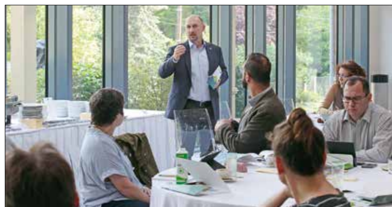
A résztvevők örömmel vennék, ha a jövőben hasonló konferenciákra találkozhatnak

környékét szeretnék zöldíteni oly módon, hogy egyebek közt kiiktatják az erdőben zajló illegális parkolást, miközben összehangolják a terület különböző tulajdonosainak eltérő érdekeit.