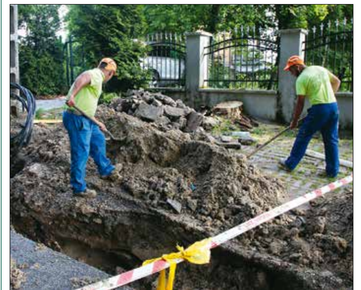
Elektromoskabel-rekonstrukció a Normafa úton

Dolgoznak a XII. kerületi utcák közelművelatok kivitelezői is. A Vilma úton, a Mátyás király út és a Normafa út közötti szakaszon, valamint a Normafa úton, a Vilma út és a Normafa út 25. között elektromoskabel-rekonstrukciót végez az Észak-Budai Zrt. Vízvezeték építését kezdte meg a Csatorna-Víz Szerviz Kft. a Moha köz felső szakaszán, míg a Fibermaster Kft. és a Hál-Ép Kft.