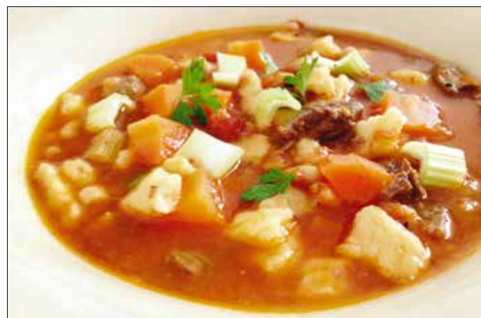
Gazdagon megpakolt francia raguleves

Ezt az illatos, francia ragulevest gazdagon megpakoltuk minden