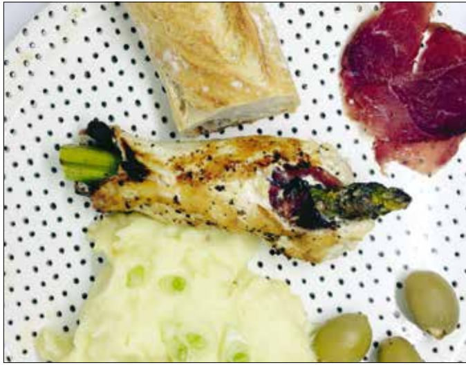
A spárgás csirkemell bármilyen hagyományos körettel tálalható

A vinaigrette-hez vágjuk finomra a zöldfűszereket, törjük össze a fokhagymát, és minden