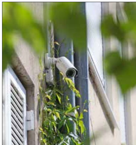
Folyamatosan, 0–24 órában működik

A Hegyvidéki Önkormányzat ebben az évben először pályázatot hirdet társasházak számára zárt rendszerű, képröggitővel ellátott megfigyelőkamera vagy kamerarendszer telepítésére. A támogatás mértéke a telepítés összköltségének 30%-a, legfeljebb 250 ezer forint. A pályázati keret ötmillió forint, jelentős érdeklődés esetén azonban tovább növelhető ez az összeg.