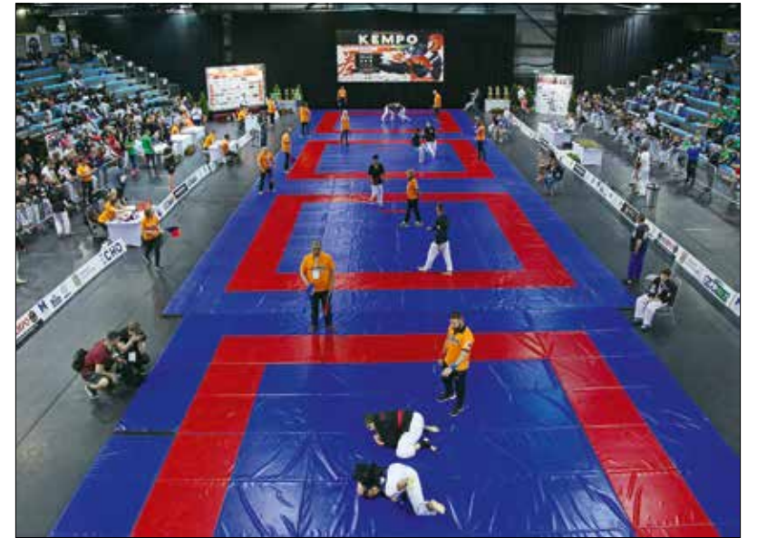
Immár másodszor adott otthont a MOM Sport az IKF Kempo Világbajnokságnak

komoly kihívás, hiszen egy súlycsoporttal feljebb, a 95 kilósok között kellett helytállnom” – foglalta össze tapasztalatait a még csak 16 éves versenyző, hozzátéve, hogy a követ-