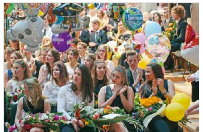
A Városmajori Gimnázium végzősei

a megfelelő családi támogatáson, hanem a gyermeki akaraterőn is múlik.