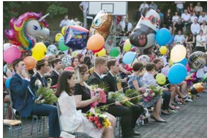
A Tamási Áron gimnázium végzősei

– Hogy érzed, sikerült kellőképpen felkészülni az érettségire?