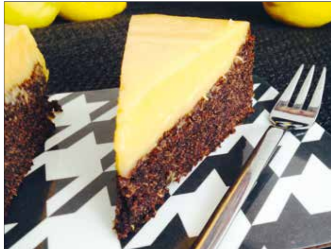
A citromos máktorta piskótája nem szárad ki

5 tojás 20 dkg porcukor 12 dkg vaj 20 dkg darált mák 0,4 dl tej ½ tk fahéj