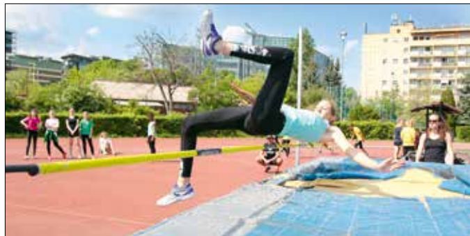
Magasan a lécfölött

Az idén is az egész versenysorozat egyik legnépesebb mezőnye gyűlt össze a Testnevelési Egyetem