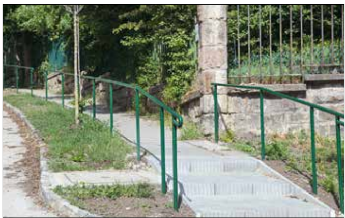
Új korlát épült a Kálló esperes utca nehezen járható szakaszán

Nemcsak a lépcsőkön, hanem a járdák és úttestek felületi hibáinak kijavításán is folyamatosan dolgoznak a közbeszerzésen kiválasztott cégek. A Zalai úton, valamint a György Aladár, a Galgóczy és a Zirzen Janka utcá-