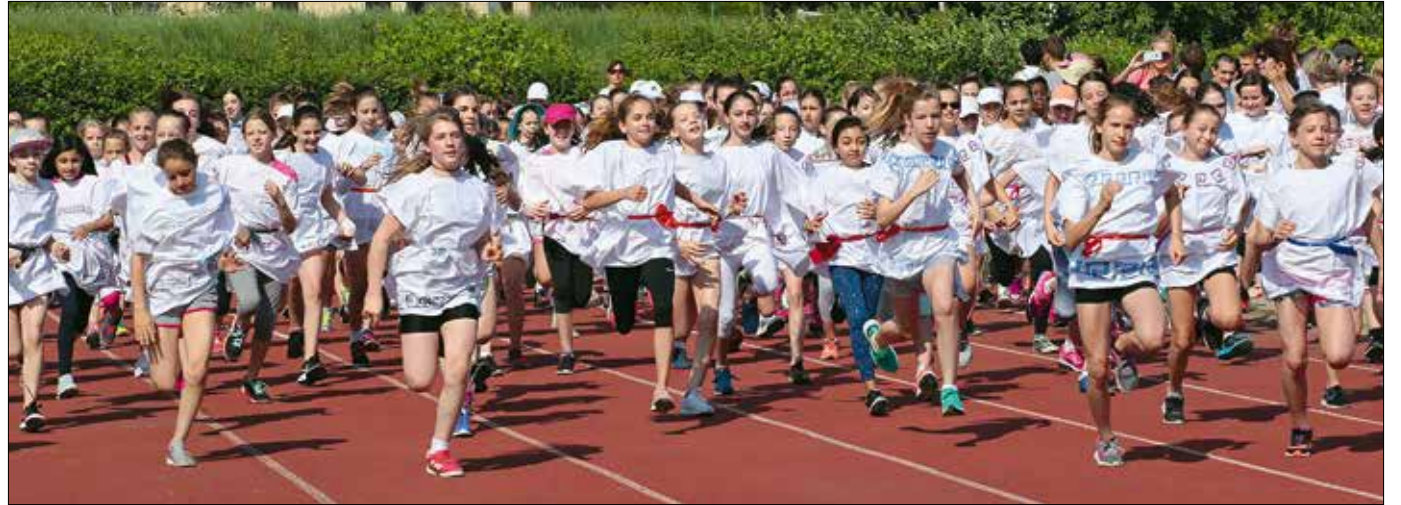
Minden eddiginél többen, tíz hegyvidéki iskolából közel ötszázan vettek részt a Hegyvidéki Olimpián

A verseny zárásaként az ifjú sportolókat igazi görög lakoma várta, amihez a szervezők gyű-