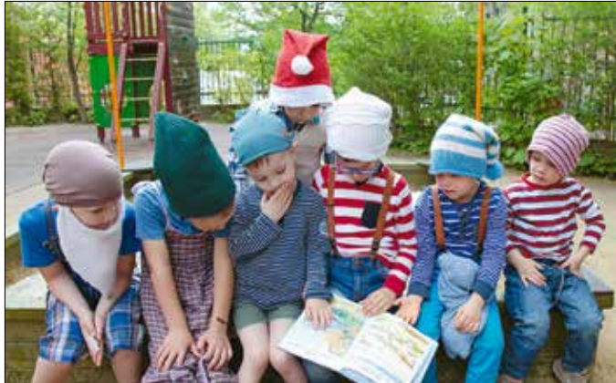
A hét törpe