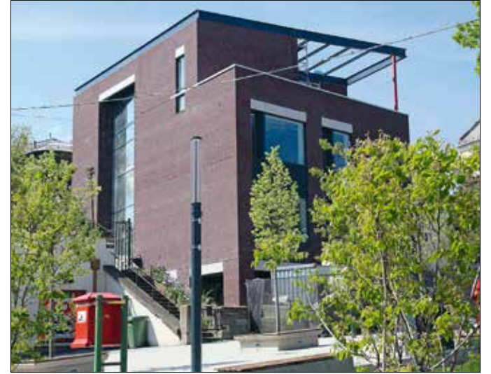
A Hegyvidéki Kulturális Szalon új épülete a Törpe utca 2. alatt

költőnő a Királyhágó utca és a Böszörményi út sarkán álló házban élt sokáig, lakása harminchárom éven át volt szerkesztőségi és baráti összejövetelek színhelye. Makovecz Imre, a magyar organikus építész nagy hatású képviselője, a Hegyvidék díszpolgára