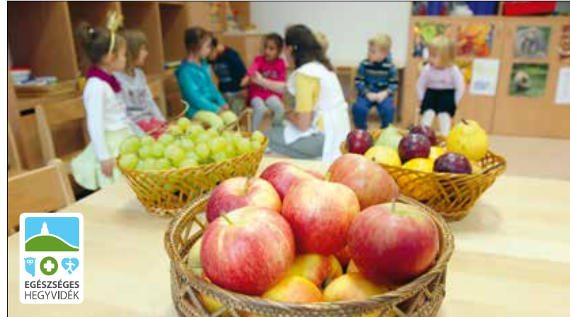
Az az ideális, ha mindennap minden étkezéskor eszünk nyers zöldséget és gyümölcsöt

azonban még ez sem elég a valódi fogyáshoz.