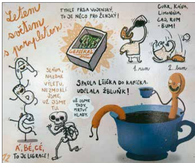
Jaromír Plachý rajza