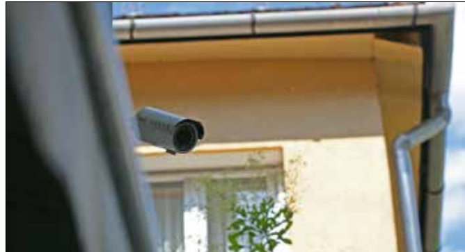
Legalább 2,5 méter magasságban kell elhelyezni

Ami az elhelyezést illeti, a kamera legalább 2,5 méter magas-