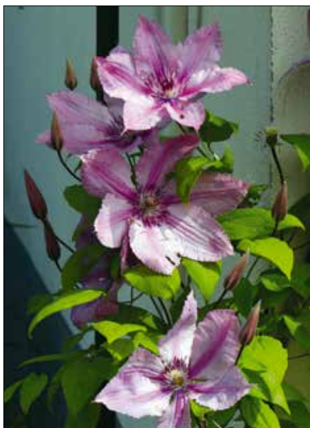
A kerti iszalag árnyékos helyen is szépen fejlődik

Ha sikerült kiválasztani a kívánatos klematisztervet a kertészeti katalógusból, vagy az árudából,