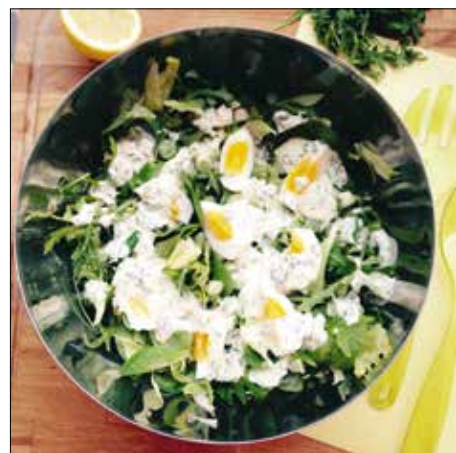
Kiadós saláta reggelire, ebédhez

hözvalóval együtt tegyük shakerbe (vagy egy lezáráható befőttesüvegbe). Alaposan rázzuk össze, majd – közvetlenül tálalás előtt – öntsük a salátára. Vágjuk nagyjából hasonló méretűre a salátaleveleket, és jól keverjük össze. Tegyük egy nagy tálba, szórjuk meg a négyrészt vágott kemény tojással, és locsoljuk meg a vinaigrette-vel.