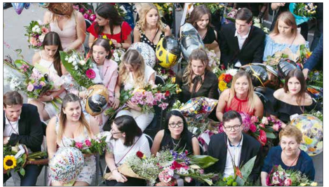
A Sashegyi Arany János Általános Iskola és Gimnázium végzősei

A Tamási Áron Általános Isko-la és Német Két Tannyelvű Nem-zetiségi Gimnáziumban a tizen-kettedikes lányok ugyanúgy csa-csogtak a folyosókon, mint bár-melyik tanóra előtt. Az utolsó becsengetés szerintük semmi