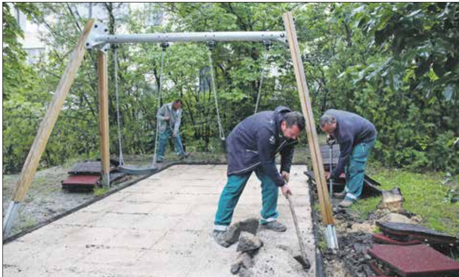
A környékiek javaslatainak figyelembevételével épül újjá a Tállya utcai park

és a parkoló rendezése sem marad el. Az invazív bálványfák helyére őshonos növényeket ültetnek a szakemberek, valamint a környezeti fenntarthatóságot szem előtt tartva ökológiai alapú csapadék-víz-kezelést valósítanak meg. A KIMBI Óvoda saját gondozású kiskertet kap, míg a felső részén,