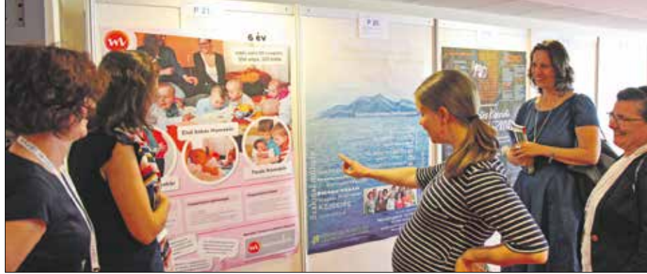
Nemrégiben egy budapesti nemzetközi konferencián is elismerően beszéltek a kórházi programról

rádadásul hajléktalansággal is küzdött. Őt már e program szellemében kezeltük: kísérettel látogathat a kisbabáját, néhány hónap alatt pedig nemcsak a gyógyulása volt látványos, hanem a lakhatása is megoldódott. – Akkor már megvolt az a bizonyos ajtó az osztályok között? – Nem, de láttuk, hogy ezen változtatni kell. Volt bőven ellenérzés, sokan mondták, hogy „boldogokat”, kezelhetetlen embereket akarunk átengedni a gyerekekhez, ebből biztosan baj lesz. Mégis sikerült megkapni az engedélyt a kórház vezetésétől az ajtó létesítésére, az élet pedig minket igazolt. A mai napig több mint háromszáz