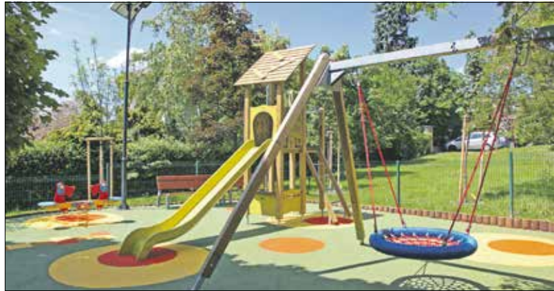
Rácz Aladár út: új fészekhinta, csúszdás játékok, rugós játékok, színes gumiburkolat

A régi játszótér fejlesztésével családias hangulatú közösségi tér jött létre a Rácz Aladár úton. A korábbi, gazdaságosan már nem felújítható játékokat a kivitelezők lecserélték, új fészekhintát, rugós játékokat, továbbá két modern, kisebb