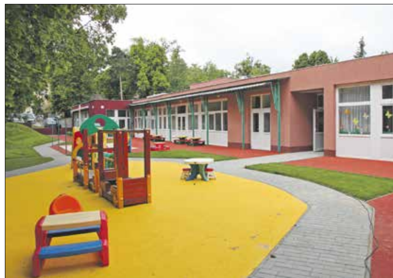
A fejlesztés részeként teljesen megújult a kert és a játszóudvar

ahol a meglévők mellett két új homokozó és játszószer is helyet kaptak. Utáncsillapító gumiburkolat került a homokozókhoz és a