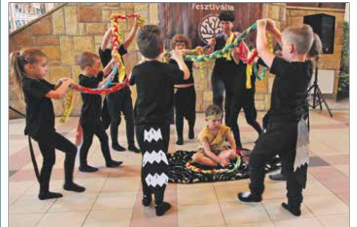
A dzsungel könyve

ális maradni. Jár ezért a köszönet a fellépő gyerekeknek és az őket felkészítő tanároknak” – fogalmazott Pokorni Zoltán, majd egy történetet is elmesélt. Gyermekei iskolájában az ötödikeseknek minden évben olimpiát szerveznek. Nemcsak a leggyorsabbaknak, a legügyesebbeknek, a legerősebbeknek, hanem az egész évfó-