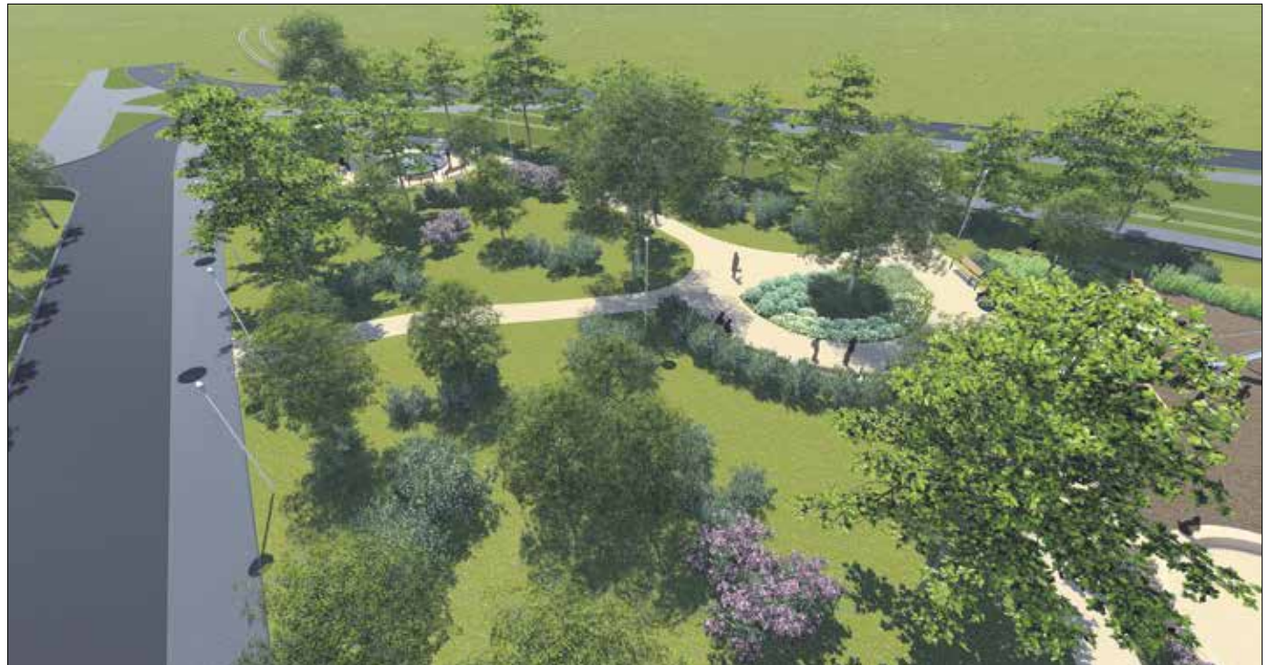
A lebontott rossz állapotú Hotel Olimpia helyén új park épül, ennek elnevezésére is javaslatokat vár az önkormányzat

Az új útszakasszal párhuzamosan a fogaskerekű normafai meghosszabbításának is biztosítják a szükséges méretű területet. Megszűnik a Normafa Síháznál lévő buszforduló és parkoló, hogy ezt a