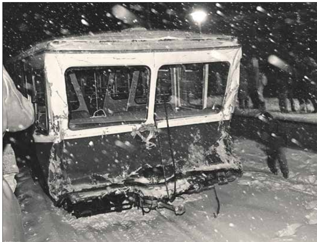
Halálos áldozatokat is követelő baleset történt a fogaskerekű vonalán az emlékezetes 1987-es nagy hóesésben

volt, most Budapesten a hó az úr. A 74 éves idős úr szervezete nem bírta a szokatlan hideg időt, a szíve felmondta a szolgálatot. A mentőknek végül több utast kellett a fogaskerekűről kórházba szállítani, szerencsére nem volt súlyos sérült, volt, akit a helyszínen elláttak. A két törött piros kocsit viszont a helyszínen maradt néhány napig. Természetesen nemcsak a fogaskerekű üzemeltetését szüneteltették, hanem számos villamos- és buszjárat sem indult el 12-én reggel. A gyerekek nagy örömmel szünetelték a tanítást az iskolákban, egyedül ők élvezték: milyen is egy igazi tél a városban, falun.” (Urbán Tamás, 1987)