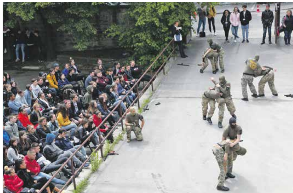
Látványos bemutatót tartott a Nemzeti Közszolgálati Egyetem Tonfa Csoportja

Szerencsére mindez csak egy rendőrségi bemutató történet, aminek éppen az volt a célja, hogy tudatosítsa a fiatalokban a rájuk leselkedő veszélyeket. Ezeket hozza testközelbe a Re-Akció országos interaktív büntelmegelőzési program, amely arra figyelmeztet, hogy egy rossz döntés egy életre szólhat.