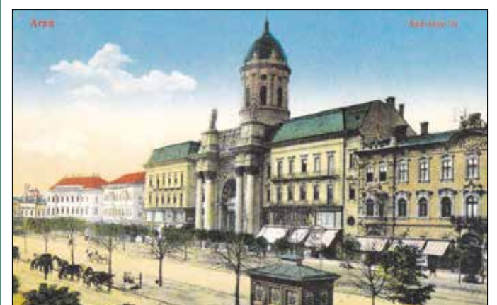
Az aradi Andrassy tér régi képeslapon

Hallhattunk Némethy Emilről, a repüléstörténet úttörőjéről is. Ő 1897-ben az aradi papírgyár igazgatója lett, szabad idejében pedig az emberi repülés lehetőségeit