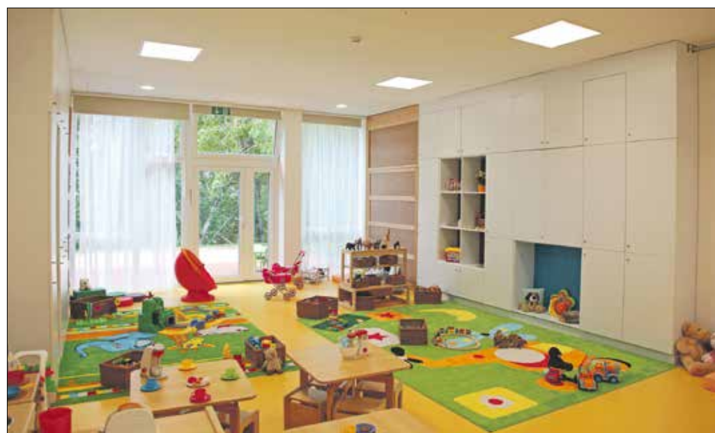
Nőtt a férőhelyek száma, a két új csoport összesen négy új – teraszokra nyíló – szobát kapott

ra kérték a szülőket. Őket, akárcsak az óvodába jelentkezőket, az elmúlt évek szisztematikusan fejlesztéseinek köszönhetően mind fel tudják venni. A Svábhegyi Bölcsődében már tavaly lezajlott egy jelentős energetikai beruházás, az