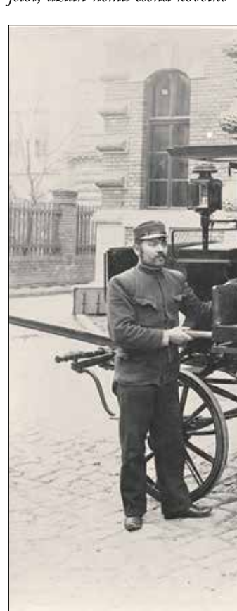
Mentőjármű 1896-ban (bemutató)