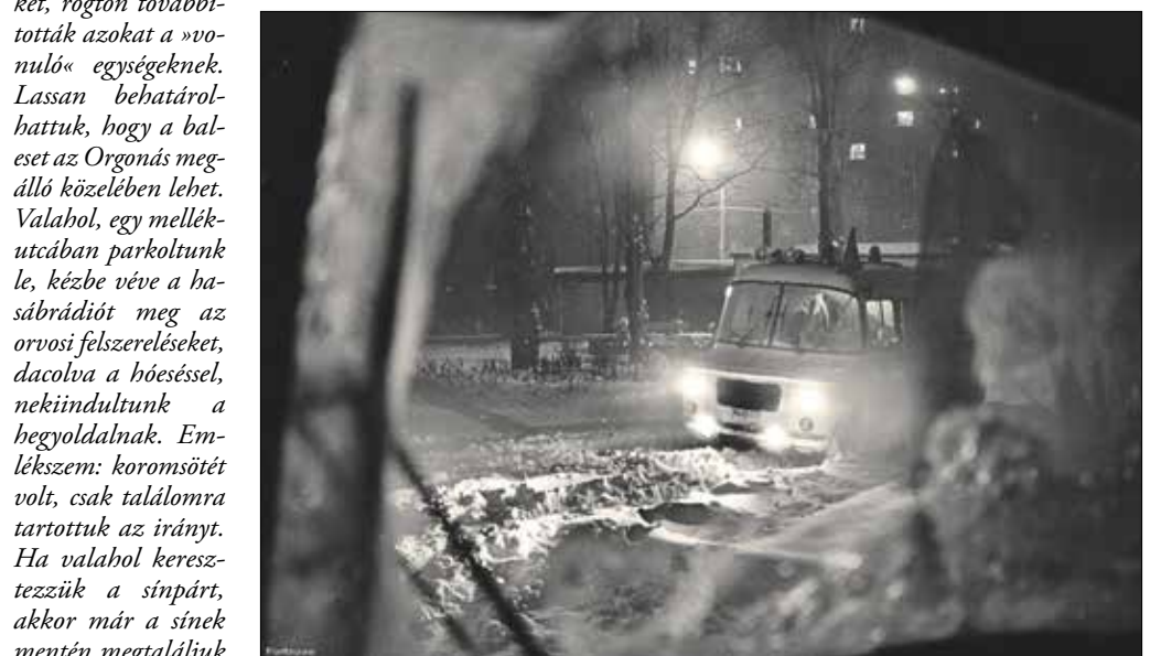
Érkezik a Nysa kocsija a balesethez

süllyedni. Másnap, 11-én este fél kilenc előtt néhány perccel érkezett az első komolyabb bejelentés: a fogaskerekű valamilyen balesetről számoltak be a telefonálók. A be-