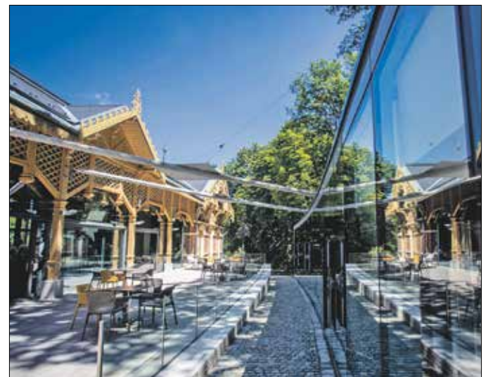
Megmaradt a karaktere, és a mai kor követelményeinek is megfelel

Időről időre felmerült valamilyen ötlet a hasznosítására. Demján Sándor kaszinót és gyémántkereskedést álmodott ide, ám a műemléki előírásokból adódó jelentős költségek miatt végül meg gondolta magát. A Moholy-Nagy Művészeti Egyetem doktori iskolát és szellemi műhelyt hozott