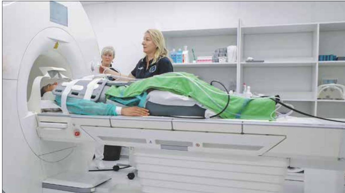
A modern berendezéssel az alattásban lévő vagy újraélesztett betegek, a csecsemők és kisgyerekek vizsgálata is lehetséges

gép a használat során egyre jobb lesz: a felhalmozódó adatokat akár évekkel később is fel tudja használni a vizsgálatoknál.