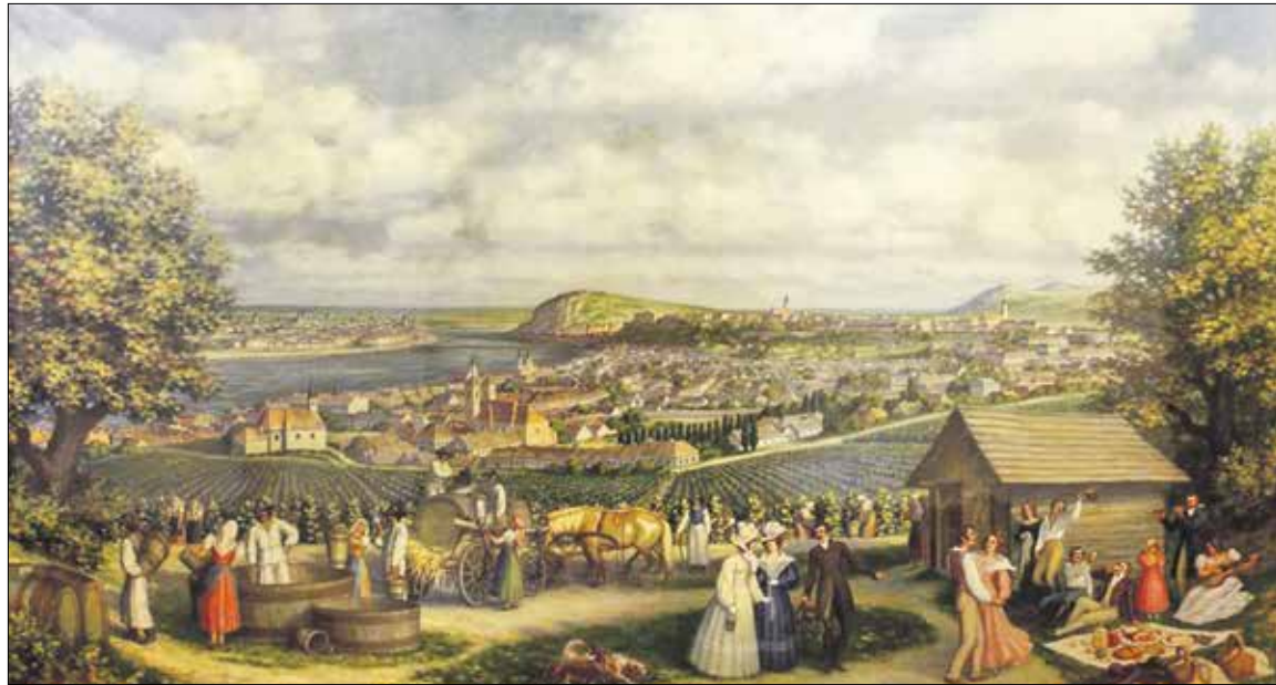
A vidám budai szüret mindig alkalmat adtak a mulatozásra

ző mily nagy vonzalmat táplált a budai, elsősorban a sashegyi borok iránt. Beethoven levelezéséből és kortársai emlékezéseiből is kiderül, hogy nem szűkebb hazája – a Rajna vidéke – nedűit kedvelte, hanem a jó sashegyi és egyéb budai fajtákat, amiket barátja, Brunsvik Ferenc küldött neki.