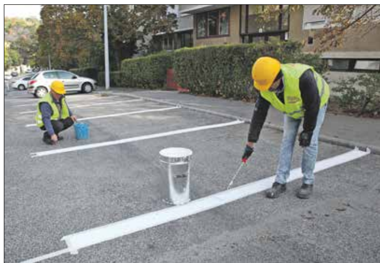
Új parkolóhelyek a Thomán István utcai buszfordulónál

Az önkormányzat megrendelésére októberben több gyalogosbiztonságot növelő közterületi építkezést és biztonságtechnikai fejlesztést valósult meg a kerület-