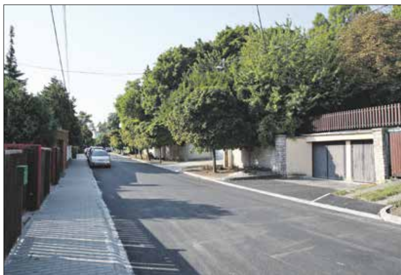
Új aszfalt, szegély és járda is épült a Szendrő utcában

vidék egyik legszebb, csendes környékét érintette, ahol azonban hétköznapi csúcsidőben – főként a környékbeli iskolák miatt – jelentős az autóforgalom.