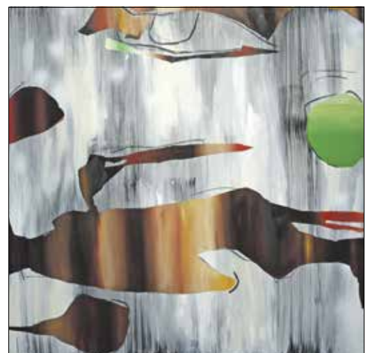
Koszorús Rita: Nyírfá