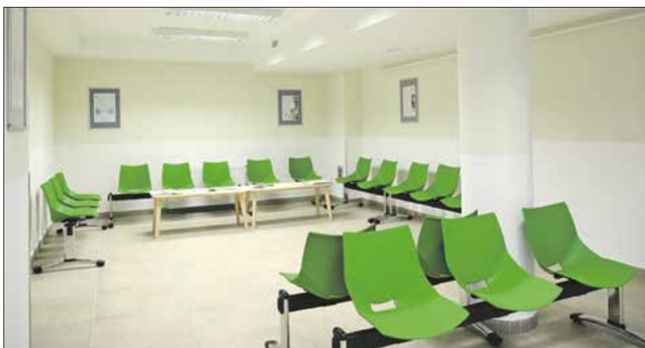
A már felújított többi orvosi rendelőhöz hasonló arculatot kapott

ablakokat építsenek be. Azok ugyanis jobban szigetelnek, és több természetes fényt engednek be” – hozott példát a doktornő az