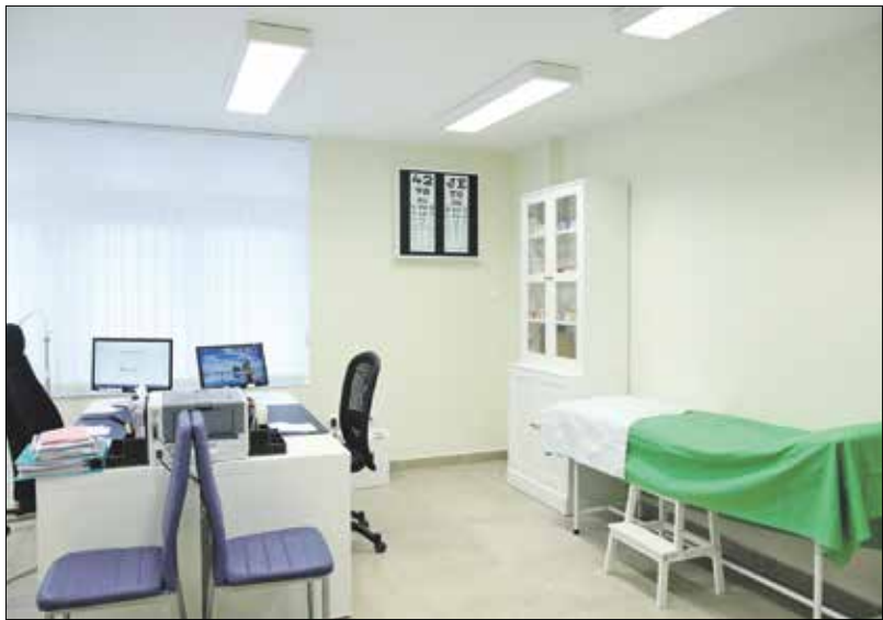
Szellősebb terek jöttek létre, ami jobban igazodik a betegek és az orvosok igényeihez

A Hegyvidéki Önkormányzat által három évvel ezelőtt elindított rendelőfelújítási program részeként a Beethoven utcai házi orvosi rendelő a tizedik, amelyik megszépült. A betegfogadók terek nemcsak szebbek, hanem jóval tágasabbak is lettek; a bővítésre a központi házi orvosi ügyelet kiköltöztetése teremtett lehetőséget.