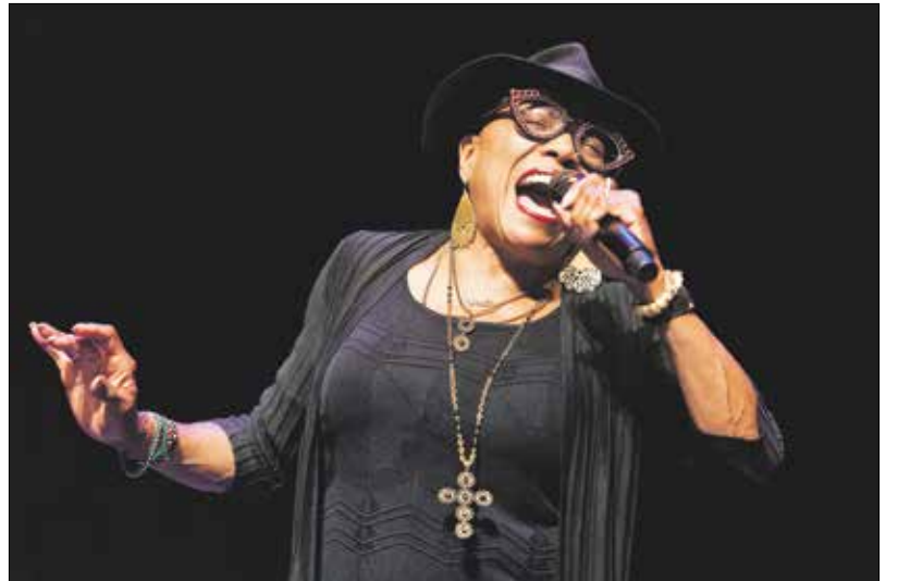
Dee Dee Bridgewater a szülővárosa, Memphis előtt tisztelő lemezét mutatta be

elsajátítanom a nyelvet, így bátran vállalkozhattam arra, hogy előadjam a világhírű sanzonokat, a legnépszerűbb francia szerzők dalait. Charles Aznavour, Gilbert