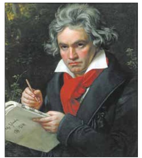
Ludwig van Beethoven

kísérletképpen 1000 akó magyar bort vitt hazájába, és szállítmányában sashegyi vörösbort is volt. A körülmények kedveztek a vállalkozásnak, mert akkoriban a háború miatt a francia bor nem juthatott át Angliába, továbbá az is segített, hogy Lipót császár elengedte a kiviteli vám harmadát. Ez annyira felháborította a boraikra féltékeny franciákat, hogy minden követ megmozgattak, ne juthasson el a budai bor az angol fővárosba. Ezzel azonban akaratlanul is hatalmas hírverést csaptak