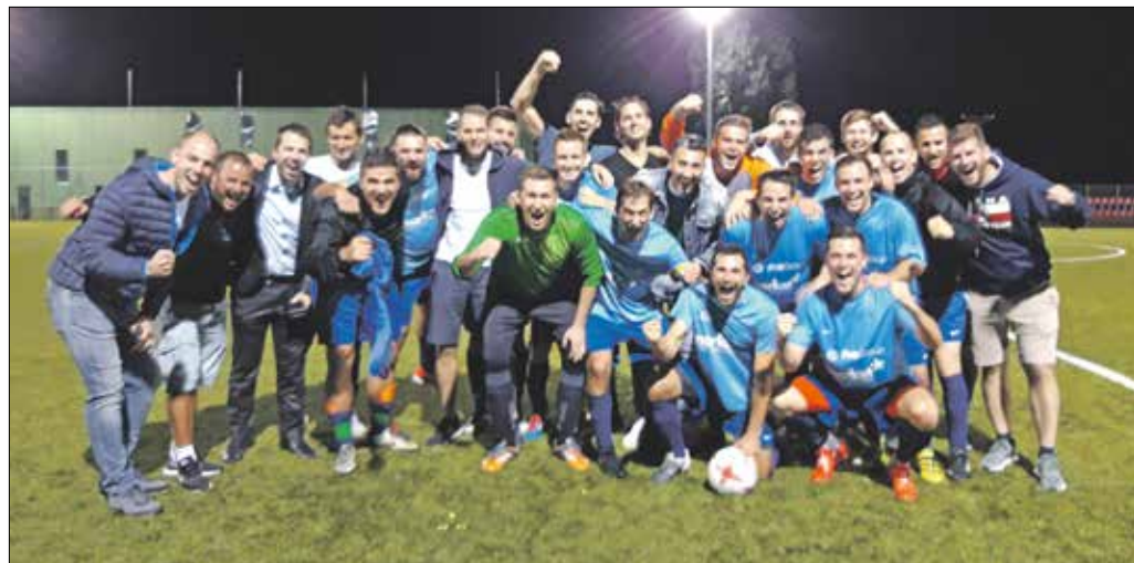
Ebben a szezonban először feljutott a Magyar Kupa 128-as főtáblájára az alig néhány éve létező labdarúgócsapat

senysportban való részvételre. Sajnos jelenleg kizárólag nagypályás labdarúgócsapattal rendelkezünk, így a merítés viszonylag szűk, de a középtávú tervek között szerepel egyéb szakágak beindítása is. Ehhez jóval több anyagi erőforrásra lenne szükség. Amennyiben ez meglesz, akkor majd a nagyobb álmainkat is meg tudjuk valósítani. Továbbra is szigorúan ragaszkodunk viszont az amatőr jelleg megtartásához!