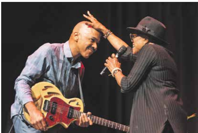
„Try a Little Tenderness”

bum címadója, aztán a The Thrill Is Gone, B. B. King dala 1969-ből, a Try a Little Tenderness, amit Otis Reading vitt sikerre, vagy Isaac Hayes szerzeménye, a B.A.B.Y. Carla Thomas előadásában, mindkettő '66-ból.