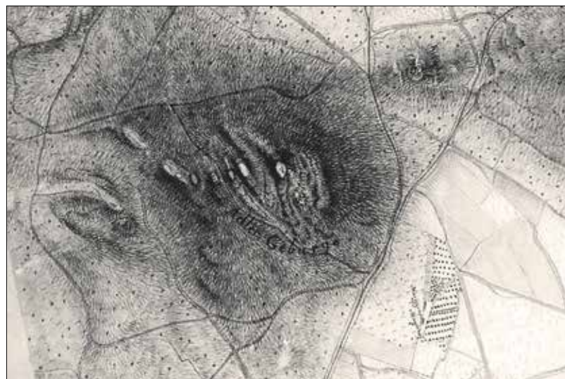
A Sas-hegy és környéke egy 1823-as térképrajzon

úgy, hogy földet vásárolt a Hegyvidéken. A 15. században a legtöbb nemesnek voltak itt szőlőbirtokai, ezért a budai német nyelvű polgárság Adelsbergnek, azaz Nemes-hegynek nevezte el a környéket. Az egyik feltevés szerint ebből eredhet a Sas-hegy elnevezés: miután a budai svábok kiejtése idővel torzította a nevet, így lehet, hogy a magyarosítás során az Adelsberg Adlerbergnek (Sas-hegy) értették, és azt ültették át magyarrá.