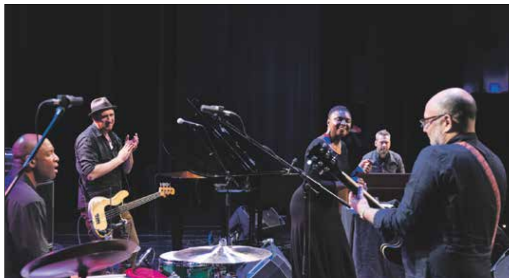
Az amerikai énekesnő és csapata két órára elvarázsolta zenéjével a MOMkult közönséget