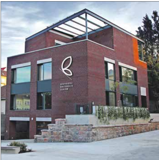
Hegyvidéki Kulturális Szalon

a hely szelleme jegyében? – erre is hozott példát. Beszélt arról, hogyan tervezték meg a városmajori Kós Károly általános iskola mel-