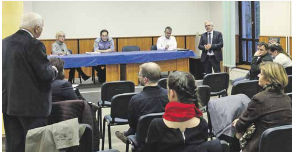
A közbiztonsági fórumon több közérdekű problémát is felvetettek a résztvevők

fórumot. A rendőr alezredes példaként említette, hogy amíg négy évvel ezelőtt mintegy 300, az idén eddig alig 50 lakásbetörés történt a XII. kerületben. Ebben a számban a meghíúsult betörési kísérletek is benne vannak, amikor az elkövető végül semmit nem tudott elvinni a lakásból.