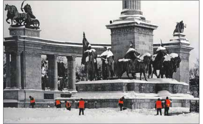
Tóth József: A hét vezér

A portréfotó vízmosásos arcait sorsdrámaként kapjuk Pató Károlytól, míg Alapfy László grafikai háttérrel – M. Tóth Éva-portré és Ónarckép – az arc törékenységét hangsúlyozza. „Aknyai Tibor szim-