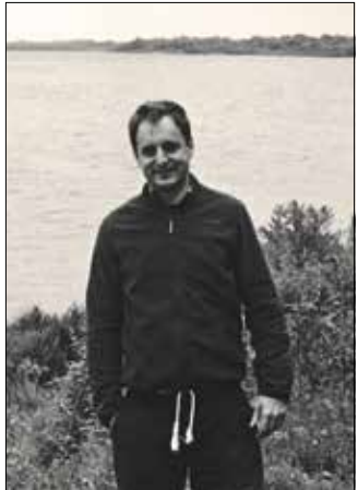
Zichy Pál, a fotók készítője

Mindig öröm a polgármesteri hivatal folyosógalériájában kiállítást rendezni, hiszen ily módon is közelebb kerülnek a nagyközönség-