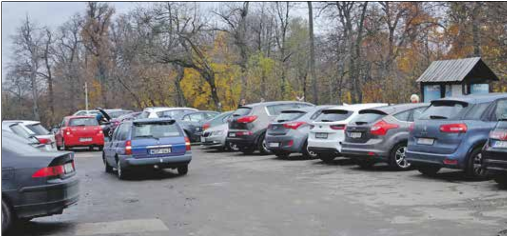
A fejlesztés zöld értékeket képvisel, mivel kihozza a parkolót az erdős területről, és közlekedési területre teszi át. A környék utcáiban is rendezett viszonyokat kell teremteni

A petíció szervezői a megbeszélést követően „remek hírként” értékelték a parkoló újratervelését, ennek ellenére másnap, november