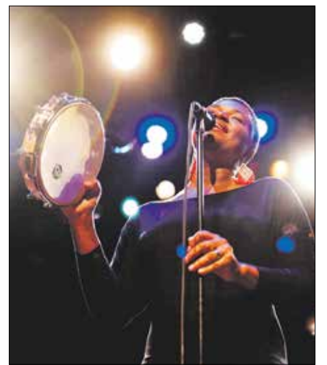
Ha Lizz Wright énekel, szebben ragyognak a fények

Elhangzott Neal Young dala, az Old Man, legutóbbi lemezének címadója, a Grace, aztán a Salt, majd a My Heart, a New Game és a Hit the Ground is. A közönség ütemes tapsal hívta vissza a