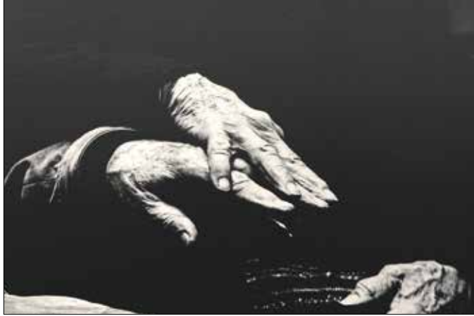
Aknyai Tibor: Kézmadarak

Széchenyi Zsigmondot, a híres Afrika-kutatót és szenvedélyes vadászt idézte fel köszöntőjében a Galéria 12 új tárlatának megnyitóján Kovács Lajos önkormányzati képviselő, akinek több szem-