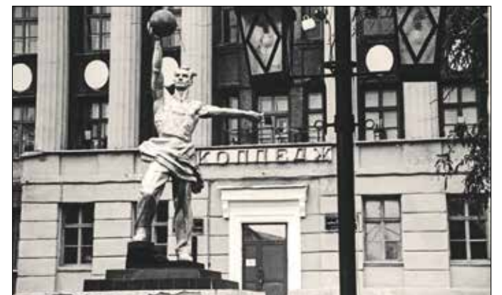
A vorkutai bányászati és gazdasági főiskola