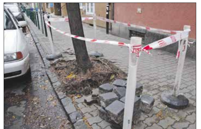
A fák gyökérzete megrongálta a burkolatot, ezért kell átépíteni a járdát

A gyalogközlekedés biztonságának javítása érdekében több járdaszakasz felújítása vagy átépítése kezdődött meg az utóbbi hetekben a XII. kerületben. Van, ahol teljes rekonstrukció zajlik, máshol a kisebb, ám annál bosszantóbb burkolati hibákat szüntetik meg a kivitelezők.