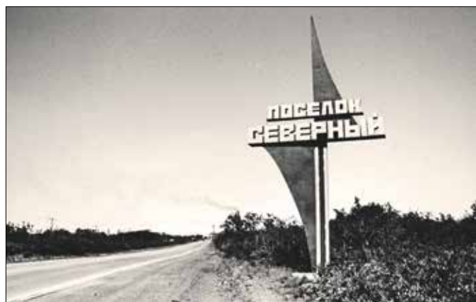
Severnij települést jelző építmény

„Hogyan történhetett meg, hogy egy állam ezt megtehette, hogy ennyire lényege legyen a rendszernak a népirtás?” – vetette fel a történész, aki úgy látja, a táborok rámutatnak a bűnös állam és a bűnállam meghatározás közötti különbségre. A szovjet egyértelműen bűnállamként került be a történelembe.