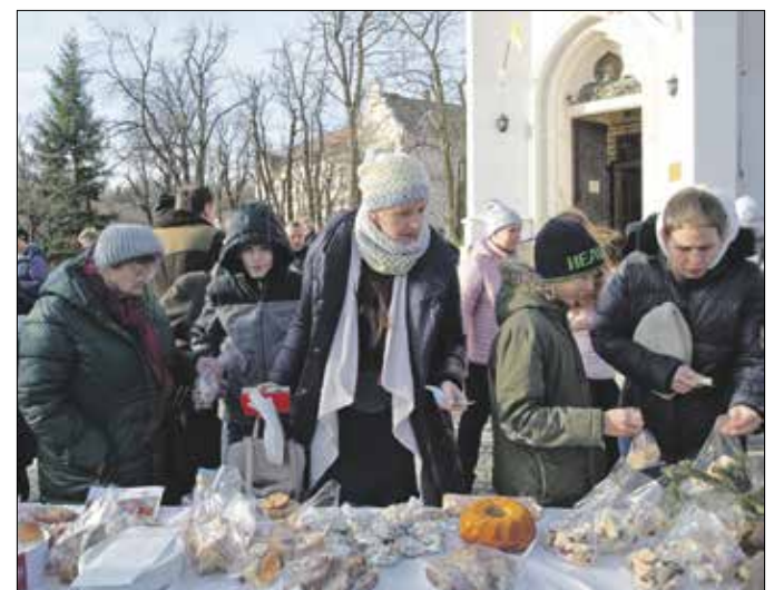
Jótekonysági süteményvásár az Istenhegyi Szent László Plébániánál

kább a betlehemezés, holott ez is kedves szokás. A pásztorjáték gyakoribb, ebben a betlehemi jelenetet játsszák el a gyerekek. Sok helyütt él még a regölés hagyománya, amikor böttal a kézben, rigmusokat mondvá üzik el a boszorkányokat.