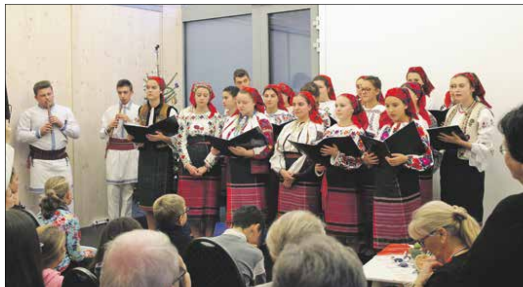
Moldvából érkező diákkórus nyitotta meg az esti programot

menni. A 22 éves kósteleki lány öt testvérből a legidősebb, és mindennap beszélget a családjával az interneten. Még nem tud-