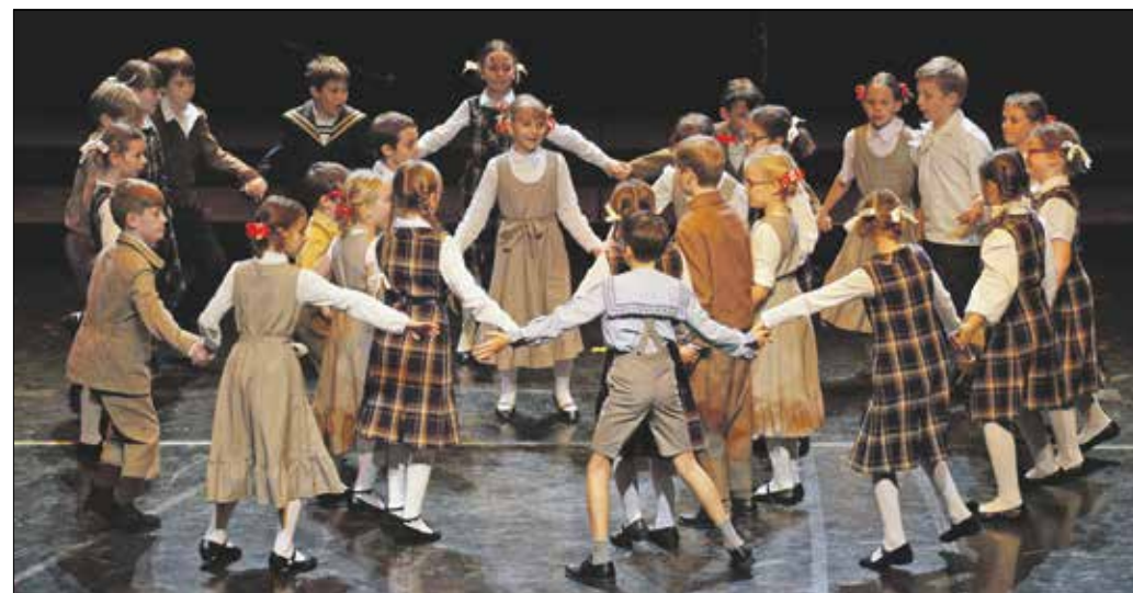
Színvonalas produkciókkal készültek a diákok a jubileumi gálaműsorra

Az ELTE-gyakorlóiskola gálaműsorában a legkisebbektől a legnagyobbakig felléptek a diákok, továbbá a tanárok és a szülők