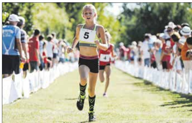
Célban az országos bajnokságon