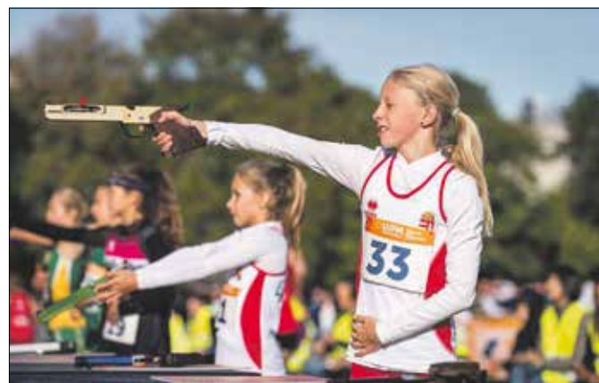
A dublini Laser Run világbajnokságon

– A lovaglást, amit még nem űzök versenyszerűen, kilenc éve