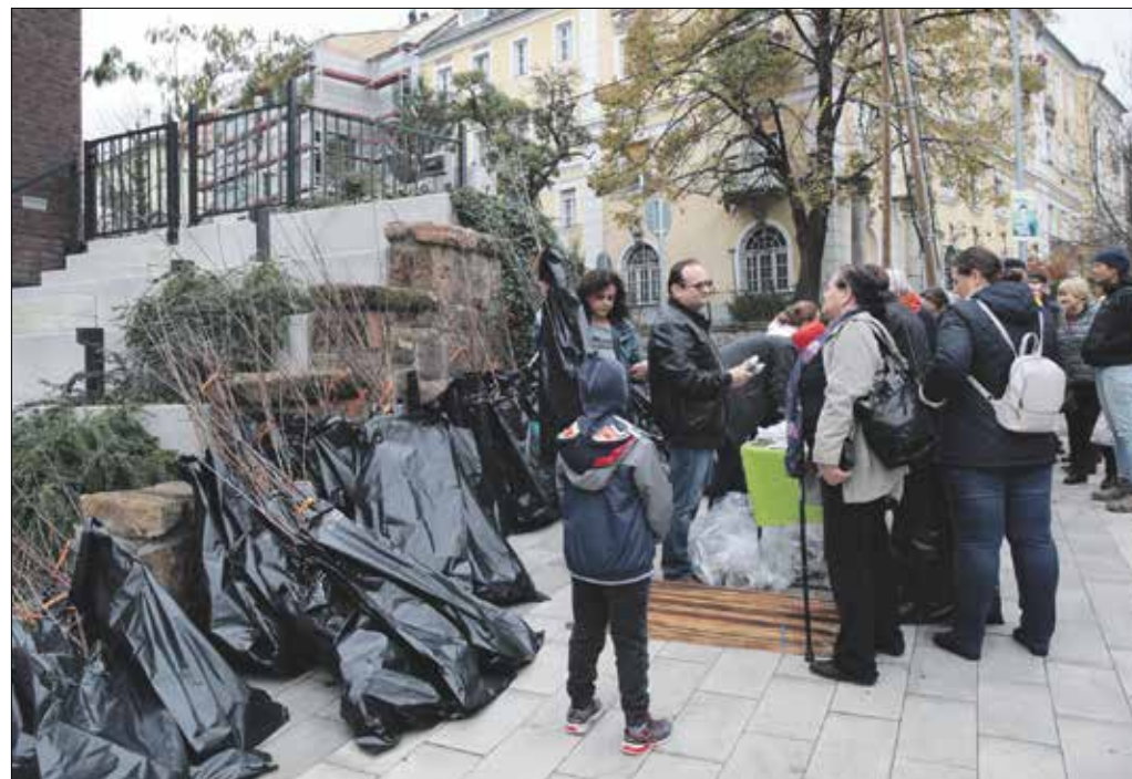
Őshonos gyümölcsfákat kaptak a kerületiek a Gyümölcsöző Hegyvidék program keretében

Dendrológiai Alapítvány szakmai együttműködésével, kísérleti jelleggel szabad gyökerű suhángokat is ültettek. A szakemberek abban bízunk, hogy ezek a kis tölgyek az