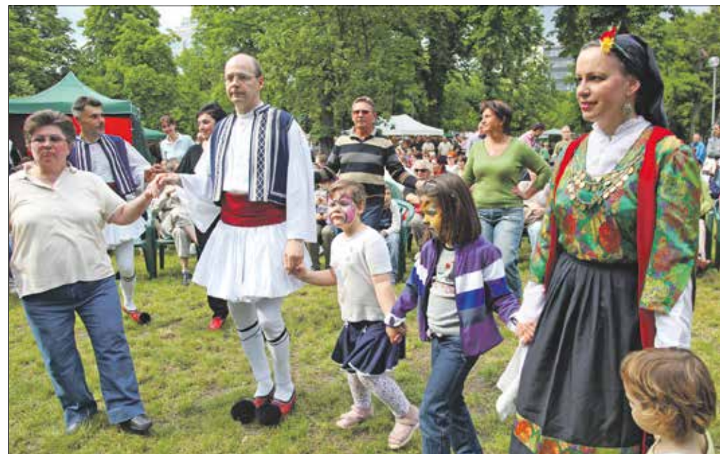
Görög néptánc a Hegyvidéki Napokon