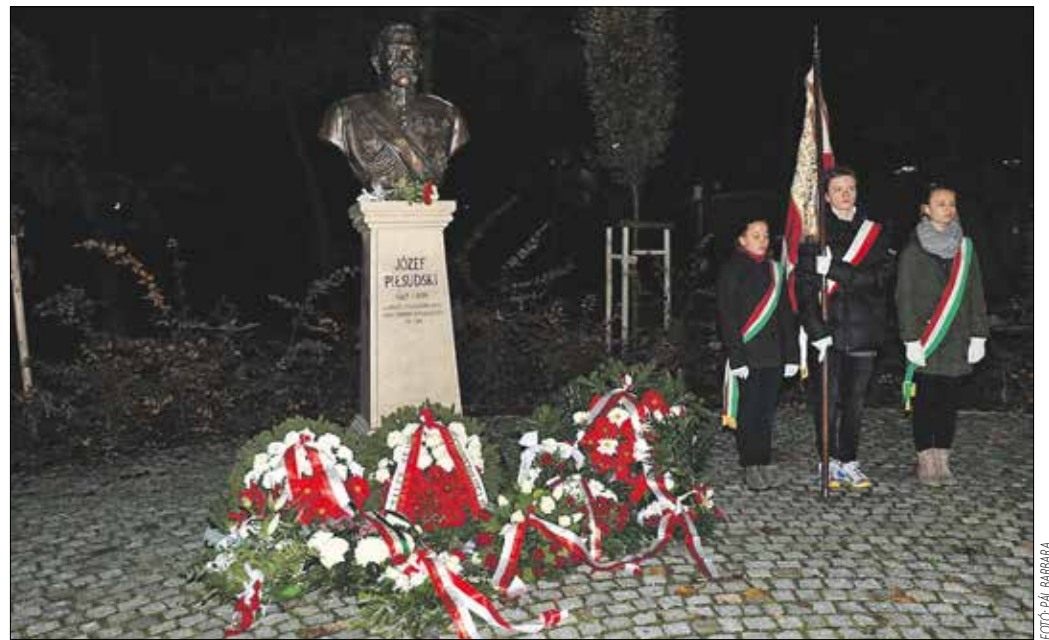
Az új lengyel nemzetiségi önkormányzat első programjaként megemlékezést tartott a Piłsudski-szobornál

...színesítette közmeghallgatását a horvát nemzetiségi önkormányzat: a budapesti Horvát Hagományörző Egyesület néptáncosai léptek fel a Hegyvidék Galériában. Ezután Gyurity István XII. kerü-