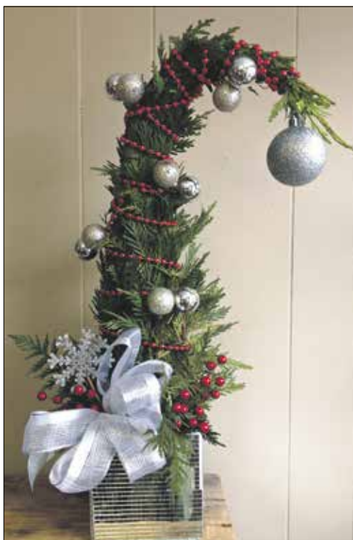
Vidám hangulatot visz az ünnepi készülődésbe

amivel a karácsonyi ajtódíszeket, adventi koszorúkat vagy a karácsonyfát ékesíteni szokás! Kerülhetnek rá spirálisan futó szalagok, le lehet fűjni műhóval, és ha elég nagy, akár egy színes karácsonyi égősor is elfér rajta.