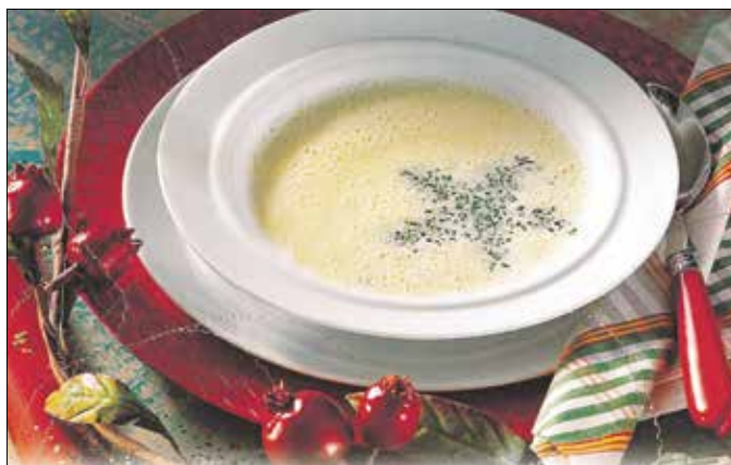
Az ünnepi vacsora csodálatosan illatos bevezetője

A borkrémleves sok helyen illatos bevezetője az ünnepi vacsorának, de legyünk őszinték: klasszikus édes, fűszeres íze alaposan lecsitítja a következő fogások iránti étvágyunkat! Ez a sós, borsos változata krémességében emlékeztet az eredetire, de ízében meglepően eltérő.