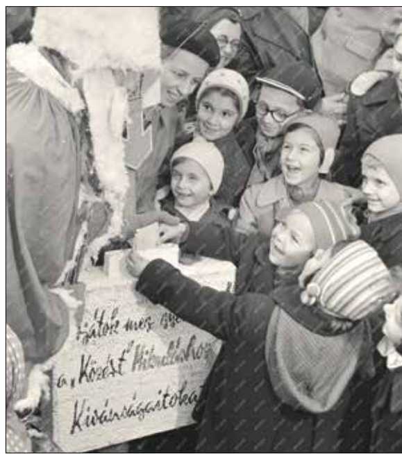
Kívánságlistákkal telik meg a Mikulás ládája a Széna téren (1958)

esztendővel később a hölgy, aki az Izabella utca 70. szám alatt, egy úri család otthonában állt alkalmazásban, a család gyermekeivel együtt a Svábhegyre ment ródlizni. Egy hirtelen fordulónál a ródlí felborult, a fiatal nő az