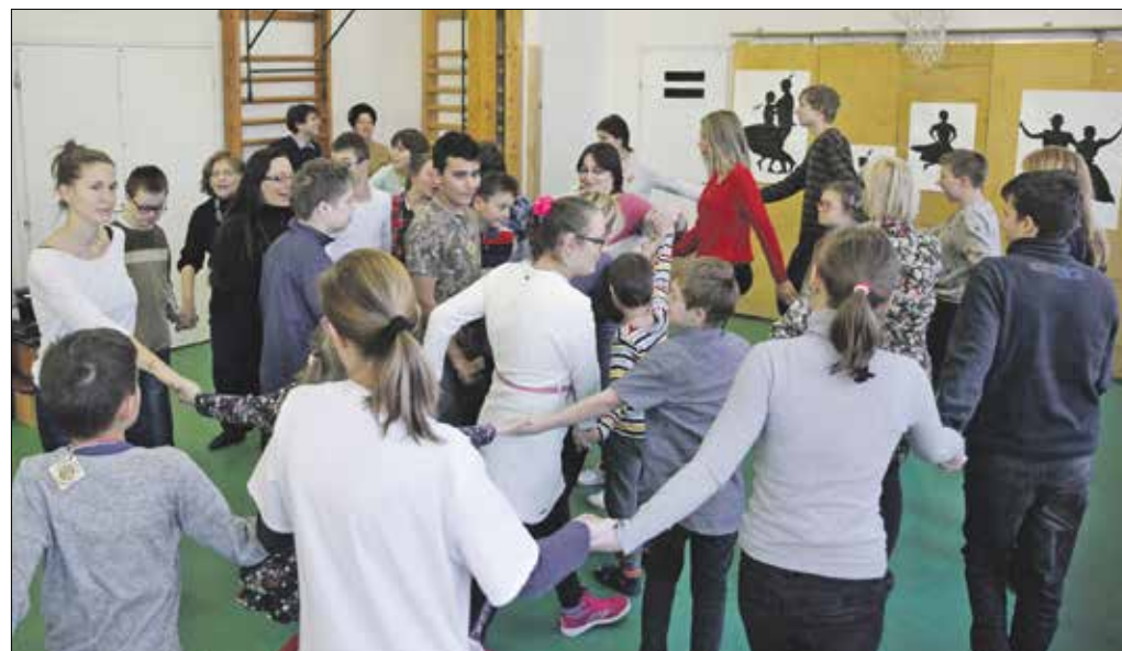
Az adventi családi nap zárásaként gyerekek, szülők, rokonok, barátok táncoltak együtt

családi napján. Az egyébként is erős, összetartó közösség és az intézmény munkatársai – tanárok, pedagógusok, segítők – ismételt tanúbizonyságát adták annak, hogy odafigyeléssel, szeretettel, hozzájárulással szinte minden akadály legyőzhető.