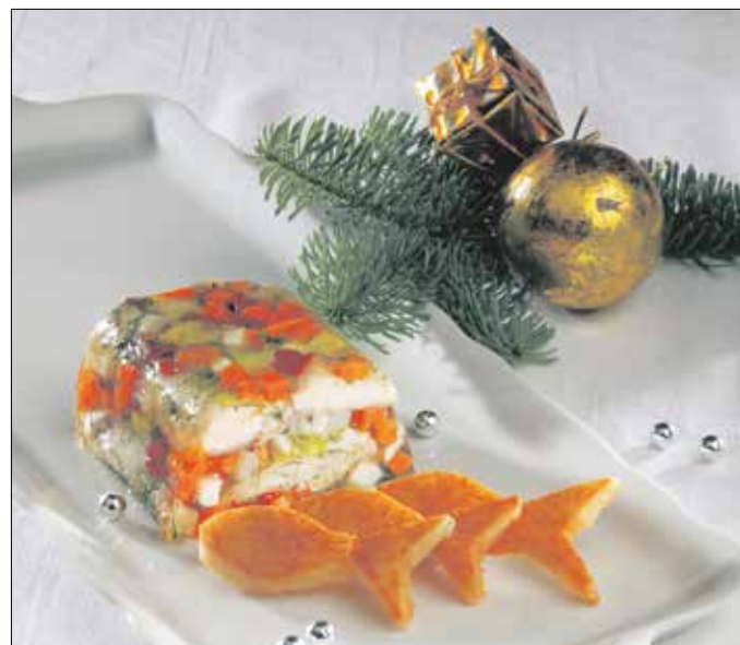
Halat formázó pirítóssal tálalhatjuk a finom és mutatós kocsonyát

juk kihűlni. A kaliforniai paprikát kis kockákra, a kapor apróra vágjuk, a főzőlébe dobjuk, majd a hideg vízben feloldott zselatint is beleöntjük, és lassú tűzön jól összefőzzük. Közben a megfőtt sárgarépát és petrezselyemgyökereket kis kockákra vágjuk, és a zselatinos léhez adjuk. Ezután egy hideg vízzel kiöblített pástétomforma aljára egy sor zöldséget terítünk, egy kevés zselatinos lével meglocsoljuk, a csukafilékkal befedjük, ismét meglocsoljuk, majd a rétegezést addig folytatjuk, amíg megtelek a formánk. Végül az összes levet ráöntjük, kissé meg is rázzuk, hogy mindenütt egyenletesen elterüljön, és a kocsonyát hideg helyen így hagyjuk megdermedni. Az öntethez az apróra vágott csemegeuborkát, a petrezselymet, a kapribogyót összekeverjük az olívaolajjal, a fehérborral, a sóval, borssal, és hűtőszekrényben jól