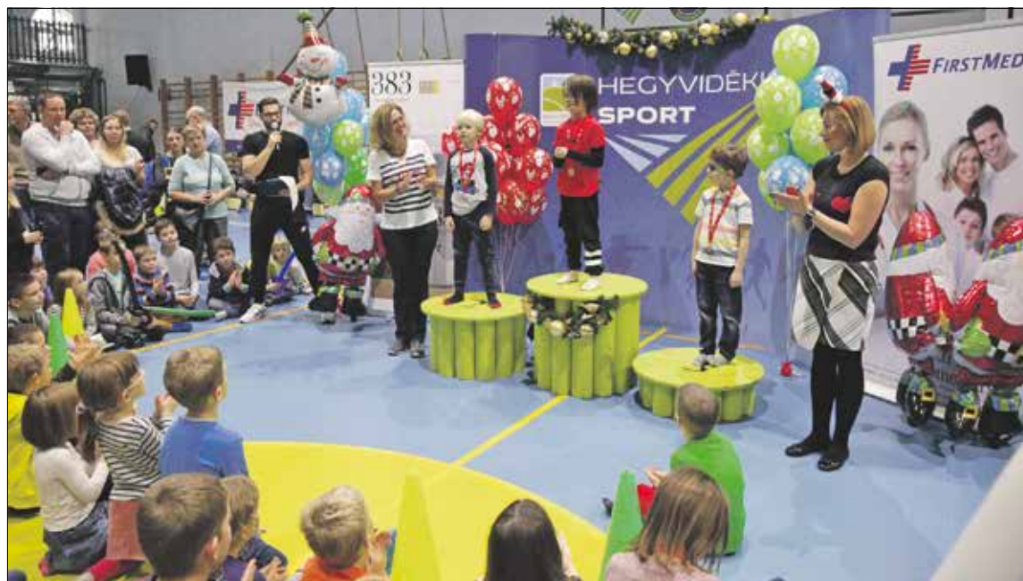
Minden évben igazi családi nap a Mikulás Kupa

■ Információk a Városmajor utcai sportközpont úszótanfolyamairól: http://hegyvidekiuszoiskola.hu