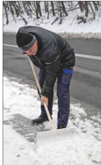
Az ingatlantulajdonos feladata

Nagyon fontos az is, hogy mivel lehet síkosságmentesítést végezni. Hagyományos konyhasóval fák közelében semmiképpen sem! Ezt tiltja a 346/2008. (XII. 30.) kormányrendelet, amely kimondja,