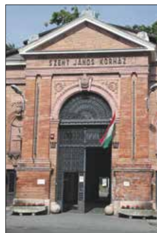
toronyépület is az intézményükhöz kerül. Mire használják ezt?

– A Semmelweis Egyetem a kormány határozata értelmében a Kút-völgyi Klinikai Tömb egészét átadja a Szent János Kórháznak, így nemcsak a szakrendelő épülete, hanem a