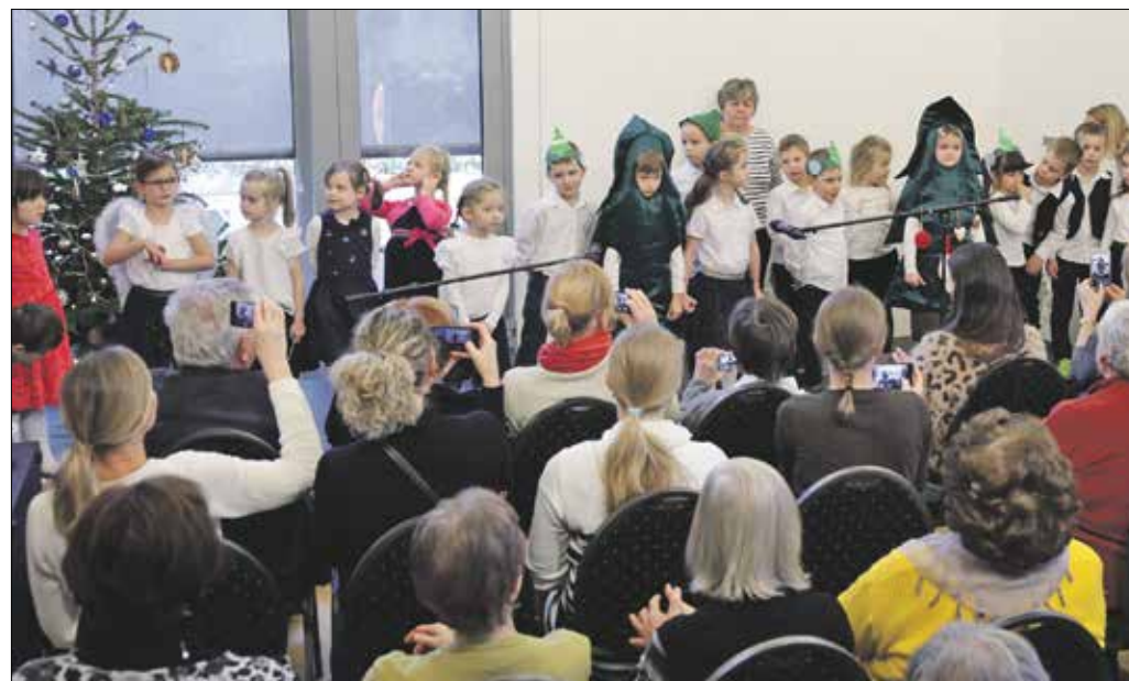
A Szalonegyetem decemberi előadása kezdetén óvodások adtak vidám karácsonyi műsort

A néphagyományban jeles esemény december 16. és 24. között a szentszalád-járás. Ilyenkor az emberek meglátogatják rokonikat, ismerőseiket; ehhez vidékenként meghatározott kötött imádság tartozik. Nagyvárosban rit-