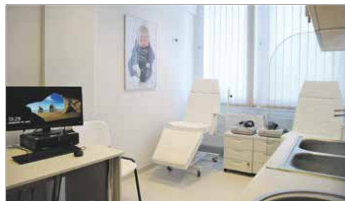
Új ctg-vizsgáló a Kút-völgyi Klinikai Tömbben

– Terveink szerint a toronyépületben, kisebb felújítást követően, ideiglenesen – a János kórház központi részeinek átalakítása idejére – az infrastrukturális szempontból legrosszabb helyzetben lévő osztályainkat helyezük el. A műtétes