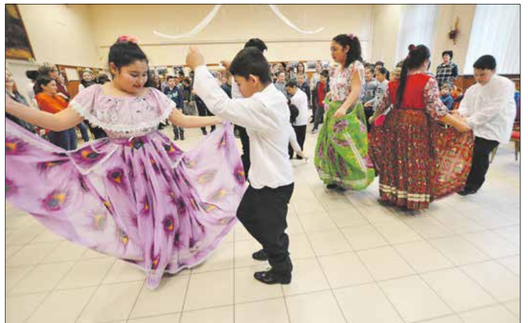
A roma önkormányzat által tervezett rendezvényeken bárki betekintést nyerhet majd a roma kultúrába