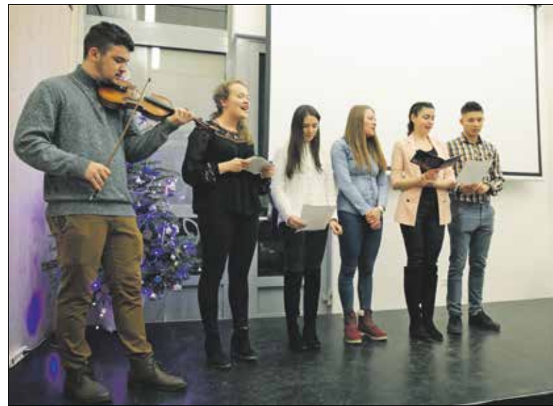
Az itt tanuló csángó diákok vizsgaidőszakban is gyakoroltak, hogy jól szerepelhessenek