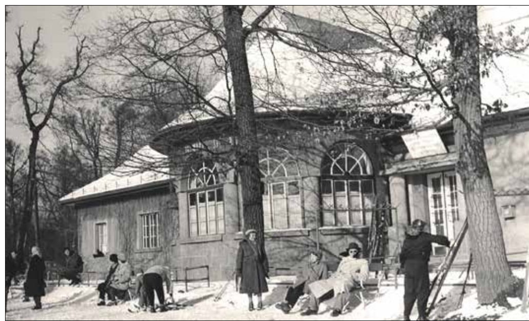
Napozók, síelők a Normafánál 1961 januárjában

Egy másik súlyos sibaesetről Az Est újság írt 1935-ben. A cikkben az olvasható, hogy a mentők a Normafánál lévő menedékházban állították fel a segélyhelyet, és a baleset helyszínéről szánon húzták oda a sérülteket. Ha súlyos volt