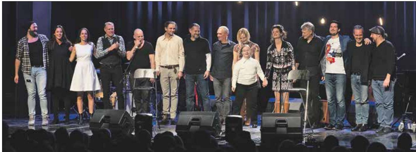
Színművészek és zenészek fogtak össze, és léptek fel a MOMkult-ban, hogy az autista gyerekeket támogató Tarnai Ottó Egyesületnek segítsenek

hallhattuk, aki Janis Joplin Mercedes Benzét is elénekelte. Az akár énekesnői babérokra joggal pályázó színésznők sorában említhetjük