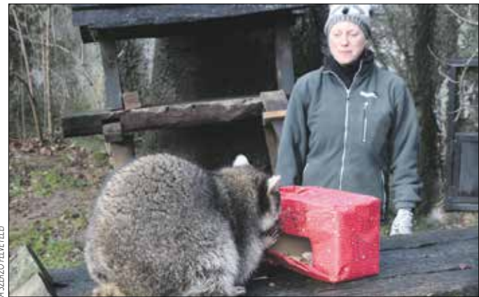
A nyestkutya és a mosómedve is boldogan fogyasztották el ajándékukat

Az élelmes és falánk mosómedvék után a nyestkutya következtek. Ezek a kinézetre – különösen téli bundában – nagyon hasonló állatok sokkal elegánsabban álltak a karácsony kérdéséhez. Bár nem alszanak téli álmot, azért ilyenkor erősen takarékoskodnak az energiával, és ez a megfontoltság már el-