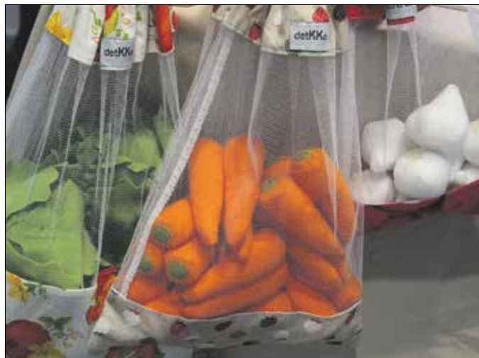
Praktikus és „nyom nélküli” tárolótáskák