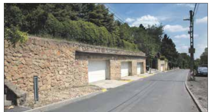
Megoldódott a csapadékvíz elvezetésének problémája az Irhás árokban

Teljesen megújult az útpálya a Zugligeti úton, az új és a régi iskolaépület között. Az útszakasz „kiegyenesedett”, így jött létre a Fácános tér, zebrákkal, parkolókkal, buszfordítóval, szervizúttal, igényesen kialakított járdával. (Folytatás a 4. oldalon)