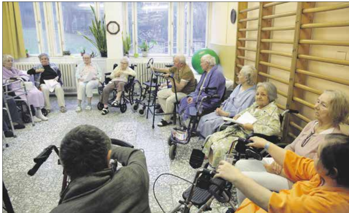
„Közösen készülünk a karácsonyi műsorra, jó együtt lenni”