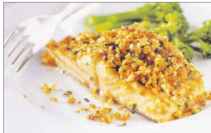
A diós hal kitűnő kímélő fogás ünnepek idején

majd hagyjuk kihűlni. Közben a halat besózzuk (lehetőleg tengeri sóval), megborsozzuk, és a szeleteket a bőrös felükkel lefelé forró olajon elősütjük. Ezután szűrőlapáttal óvatosan kivajazott tepsibe egymás mellé fektetjük, a tetejüket megkenjük tojássárgájával, és