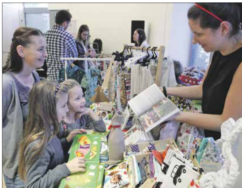
Nekik talán már természetes lesz a hulladékmentes életmód

– A zacsokokat a szupermarketekben is lehet használni, már több pénztáros is megjegyezte, hogy mennyivel szebbek, mint a zacskók. A zero waste táskákat is újrahasznosított anyagokból készítem, tartósak, ráadásul ka-