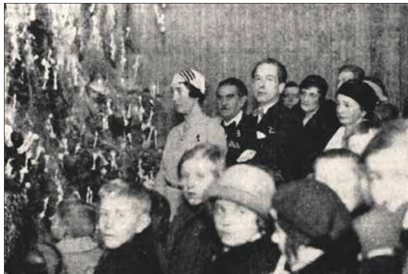
Albrecht királyi herceg és felesége nyolcszáz családnak segített 1932 karácsonyán

Az adományozásán kívül egy másik érdekes szokás volt ilyenkor siversenyek rendezése a budai hegyekben, főleg az ünnepek idején, mivel legtöbbször karácsony második napján kezdődött a szezonzon. A Nemzeti Sport 1922-ben arról számolt be, hogy december 26-án Pannónia vándordíjat – ötös sístafaversenyt – szerveztek a Hegyvidéken. A cél és a két váltás a Normafa és az Anna-kápolna