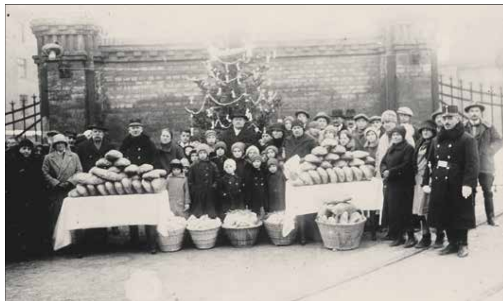
Kenyérosztás rászorulóknak 1920-ban