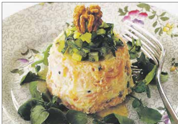
A pisztráng-hab nagy előnye, hogy nem kell főzni

A megtisztított sárgarépát és petrezselyemgyökereket annyi hideg vízben, amennyi bőven ellepi, felforrat, néhány percig főzzük, majd a csukafilét is beletesszük, megsózzuk, megborsozzuk, és kis lángon addig hagyjuk a tűzön, amíg a hal megpuhul. Közben a bort is beleöntjük. Végül a halat és a zöldséget szűrőkanállal kiemeljük, és hagy-