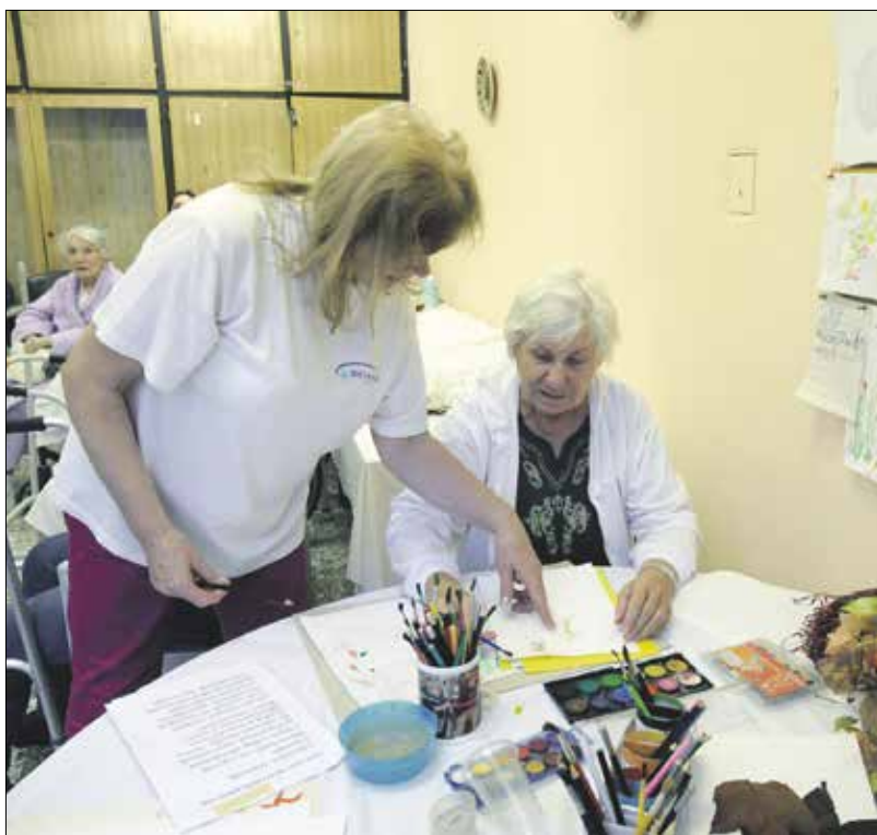
„Nekem nincs jó hangom, ezért én festek”

karácsonyt. „Bár itt maradhatnék örökre! Megszoktuk egymást, a nővérek nagyon kedvesek, a társaimmal sokat beszél-