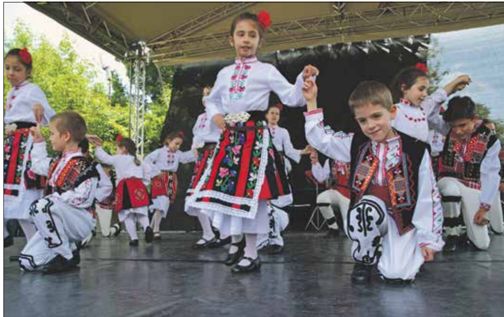
A bolgár Roszica gyermek-néptáncgyűttes