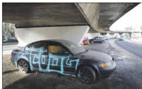
Árva autó a BAH-csomópontnál

ján kideríthető legyen a tulajdonos személye, hiszen csak így tudják értesíteni őt az elszállításról. Idáig azonban nem érdemes eljutni, a tréler ugyanis 17 500 forintba kerül, a tárolás díja pedig napi 1200 forint. Ez legfeljebb hat hónapig tart – ennyi a törvényben rögzített kötelező idő, – ha addig nem je-