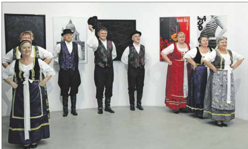
A budapesti Horvát Hagományörző Egyesület néptáncosai léptek fel a horvát közmeghallgatáson

kiet. Előadásokat szerveznének, valamint ötletként felmerült, hogy egy parkrészt gondozásba vesznek, amely bemutatóhelye lehetne a bolgárok által meghonosított különleges kertészeti megoldásoknak.