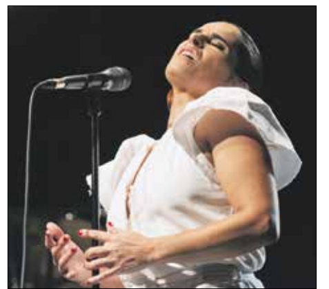
Vágyakozás, szomorúság, fájdalom

Cristina Branco teljesítményéről csak felsőfokú jelzőkkel beszélhetünk. Kitűnő angolással konferált, ami nagyban hozzájárult a dalok mondanivalójának megértéséhez. Másfél órát énekel, mindvégig csodálatosan, mély átéléssel. Leszámítva néhány korábbi sikerszámát (Fado Tango, Anciao en Paris, Alvorada) az új