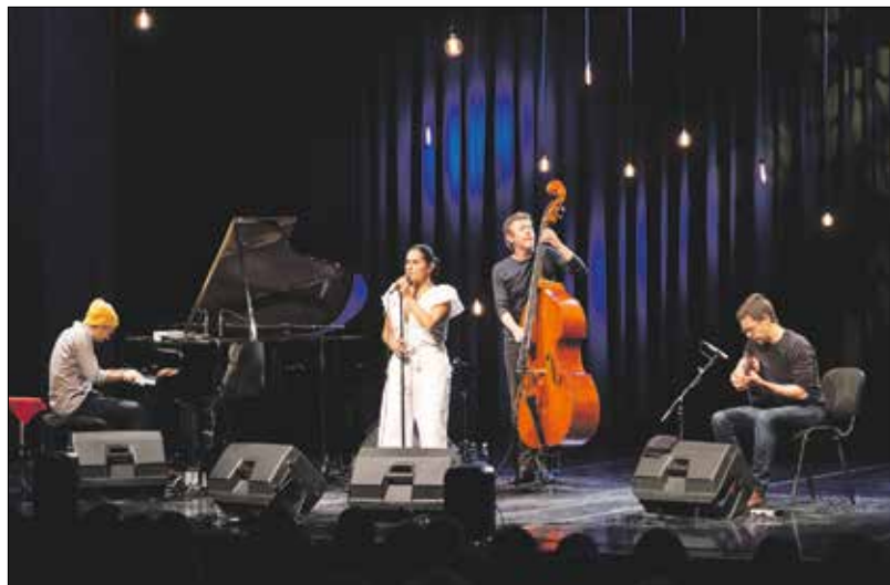
Cristina Branco egyszerre hagyományápoló és műfajmegújító fadoénekesnő