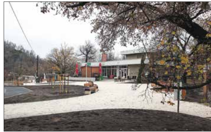
Közel 1000 négyzetméter zöld terület jött létre a Libegő felső állomásánál