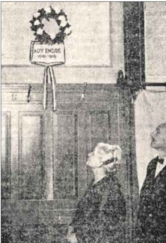
A tulajdonosnő és a főpincér, aki még kiszolgálta Adyt

és elmentek, hogy soha többet ide be nem teszik a lábukat. Két óra múlva visszajöttek, és elkezdtek pálinkázni. Megvárták, míg hat óra lett, akkor a kisasszonyt leváltották,ők