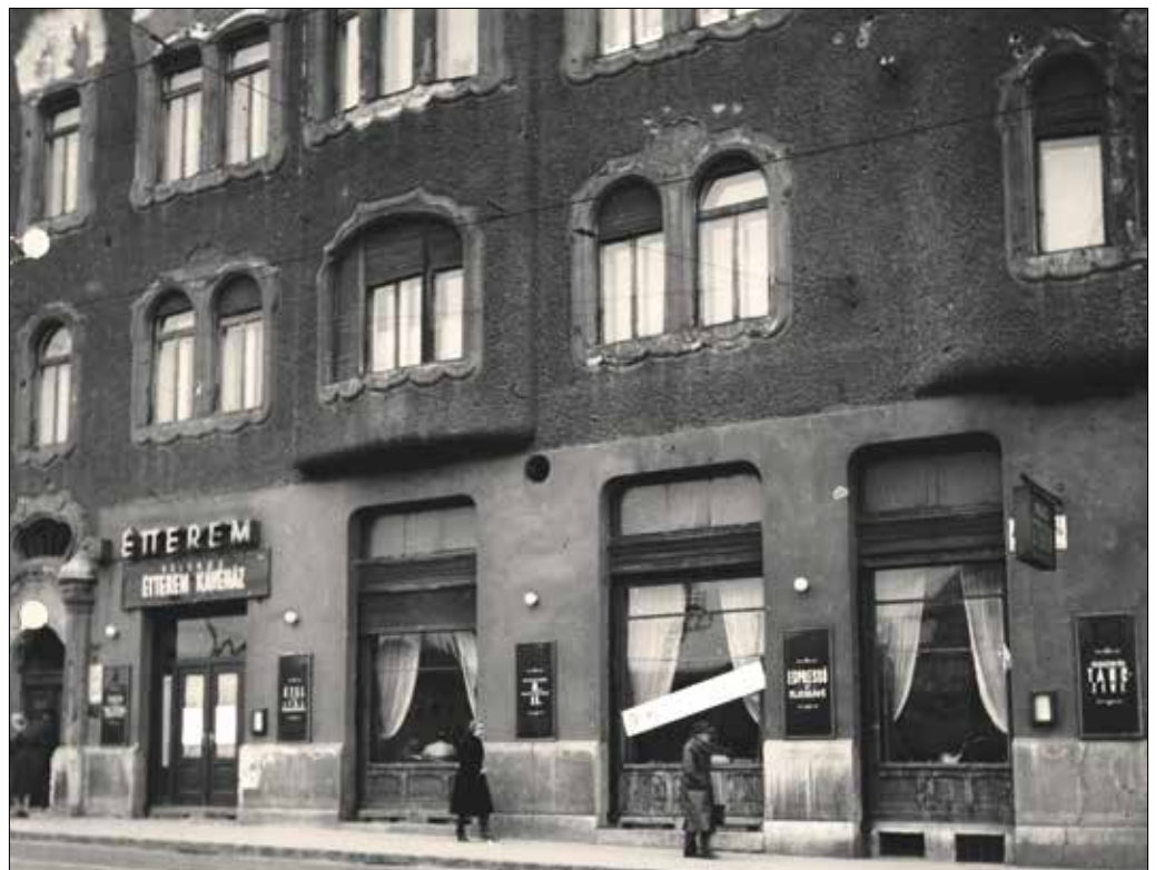
A Délivasút kávéház helyén később a Velence étterem működött