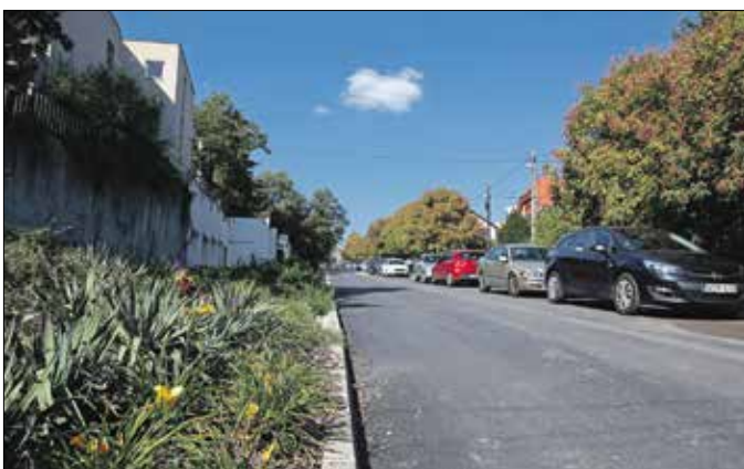
Az elejétől a végéig új aszfaltburkolatot kapott a Nógrádi utca

Százötven méter hosszán az alapokig visszabontották az Ada utca alsó szakaszát, majd a meglévő szegélyek részbeni felhasználásával új, kiemelt szegélyekkel teljesen újjáépítették. Korábban rendszeresen gondot okozott a csapadékvíz elégtelen elvezetése, ezt csatorna rendszerre köthető hat