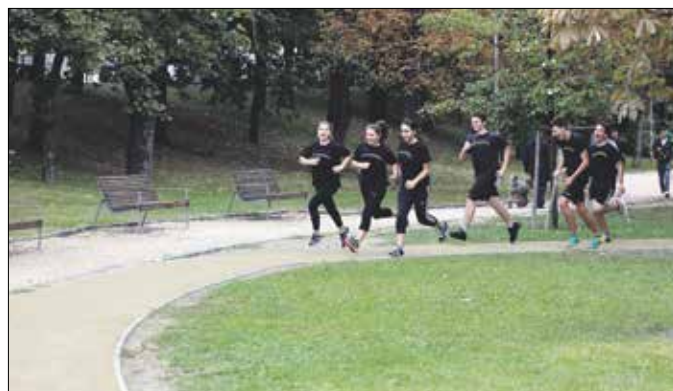
Már a Gesztenyés kertben is profi futókör várja a mozogni vágyókat

Az önkormányzat ingyenesen hívható zöldszáma: