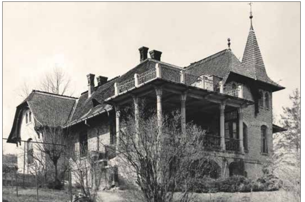
Kollár Lajos nyaralója a Kútvolgyben. Tetőzetén a népi építészet elemei figyelhetők meg

A két világháború között több terve készült, így például a budapesti Szabadság tér déli oldalát ismét városi, pártázatos épületekkel zárta volna le. Ez sem valósult meg, mint ahogy a már említett későbbi