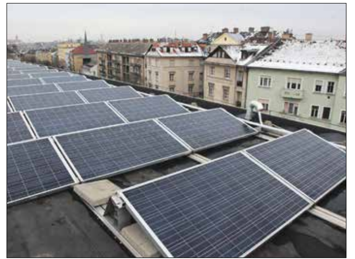
A napelemek használata is csökkenti a szén-dioxid-kibocsátást

a közlekedésből, valamint a szolgáltató- és középületek – különösen az elavult kórházi épületek – üzemeltetéséből származik. A kibocsátáscsökkentésre számos megoldást felvonultat az akcióterv: ezek közé tartozik az épületek energetikai korszerűsítése, a napelemek telepítése, az elektromos meghajtású járművek mind szélesebb körű használata és a szemléletformálás.