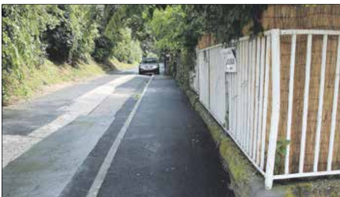
Egy szakaszon teljesen megújult a Nárcisz utcai járda