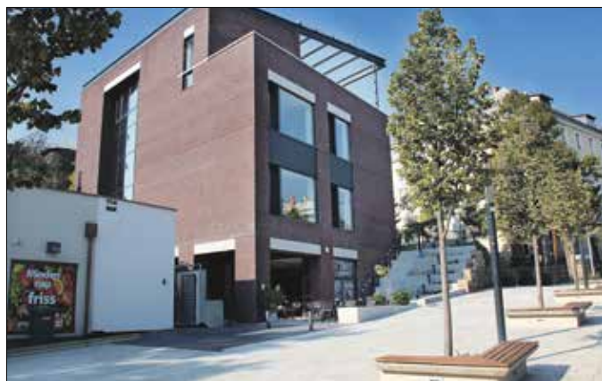
Elkészült a Hegyvidéki Kulturális Szalon és közvetlen környezete