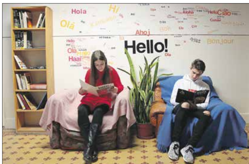
Az ötletes pihenőhelyek az iskolai közösség építését is szolgálják

Már elkészültek az iskolai pályamintapéldányai, valamint azok az